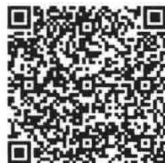
案例1-4(外国银行中国分行的诉讼地位)

2004年2月12日经由中华人民共和国商务部颁布的《关于外商投资举办投资性公司的规定》允许外国投资者根据中国有关外国投资的法律、法规及本规定,在中国设立投资性公司。因此,这种投资性公司显然是中国法人。但是,投资性公司可以作为发起人在中国发起设立外商投资股份有限公司。 ⑤ 因此,投资性公司所投资金为“外资”。那么,投资