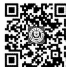
厦门大学出版社 微博二维码