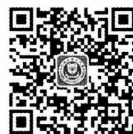
厦门大学出版社 微信二维码