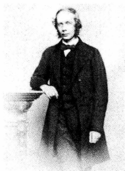
年轻时的亨利·萨姆纳·梅因 (Henry Sumner Maine, 1822—1888)