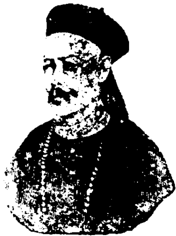
庚子前二年庚子影王(廿四)

議就大綱十二款。已於是年冬月批准。旋又於十二月某日。欽奉懲辦首禍諸王大臣。上諭曰。京師自五月以來。拳匪倡亂。開釁友邦。現經李鴻章與各國使臣。在京議和。大綱草約業已畫押。追思肇禍之始。實由諸王大臣昏謬無知。鴛張跋扈。深信邪術。挾制朝廷。於剿辦團匪之諭。抗不遵行。反縱信拳匪妄行攻戰。以至邪焰大張。