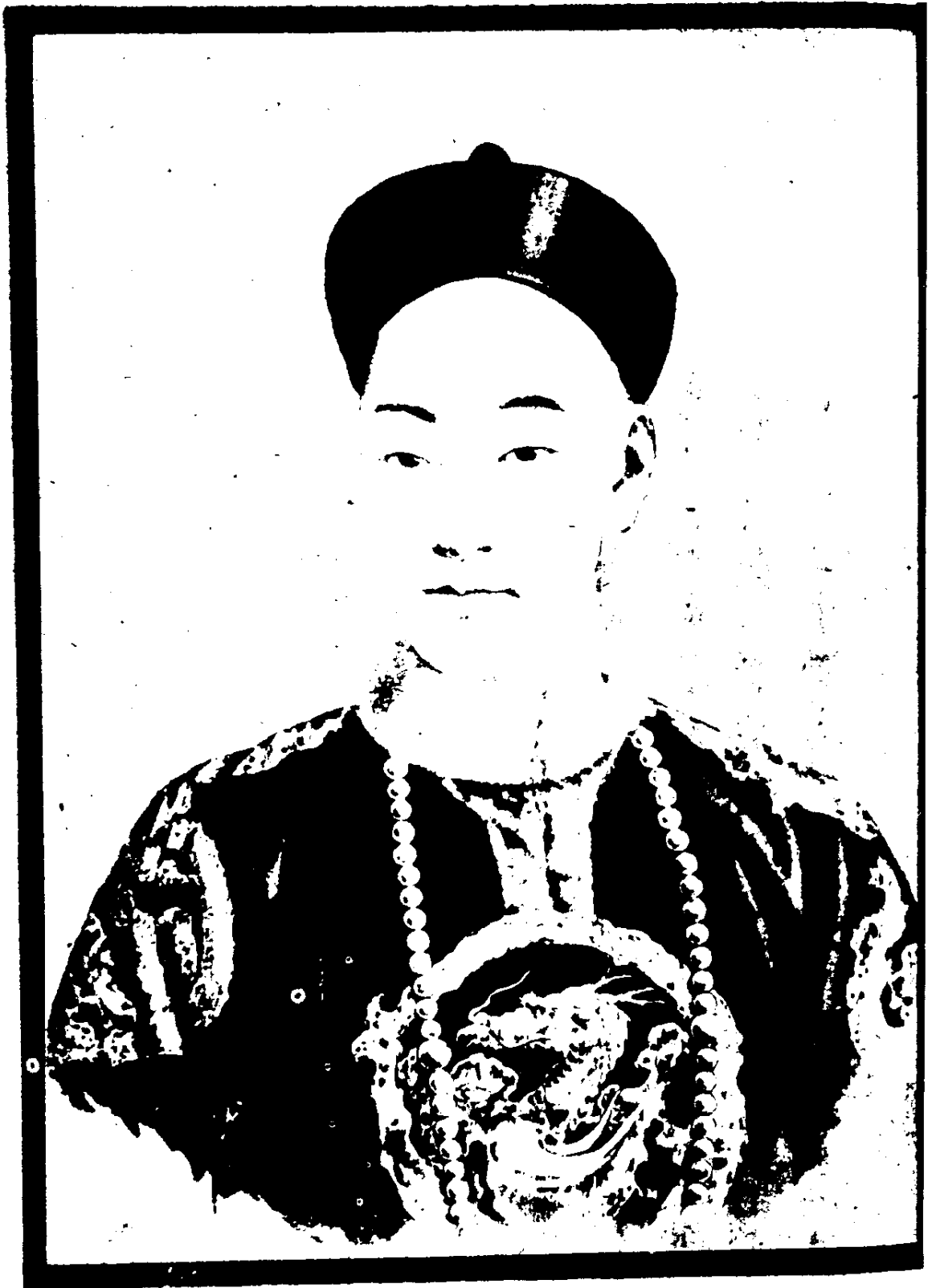
(圖) 德 宗 景 帝 遺 像