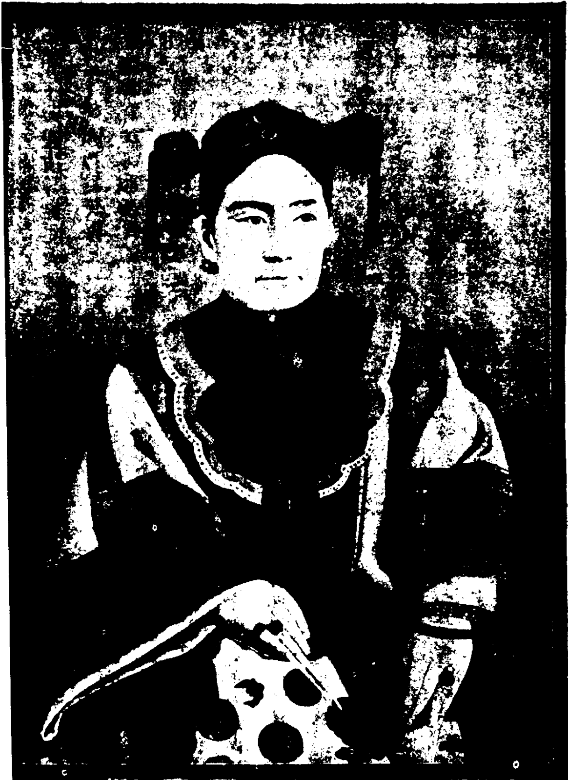
(傳) 像 建 辰 皇 顯 欽 寧