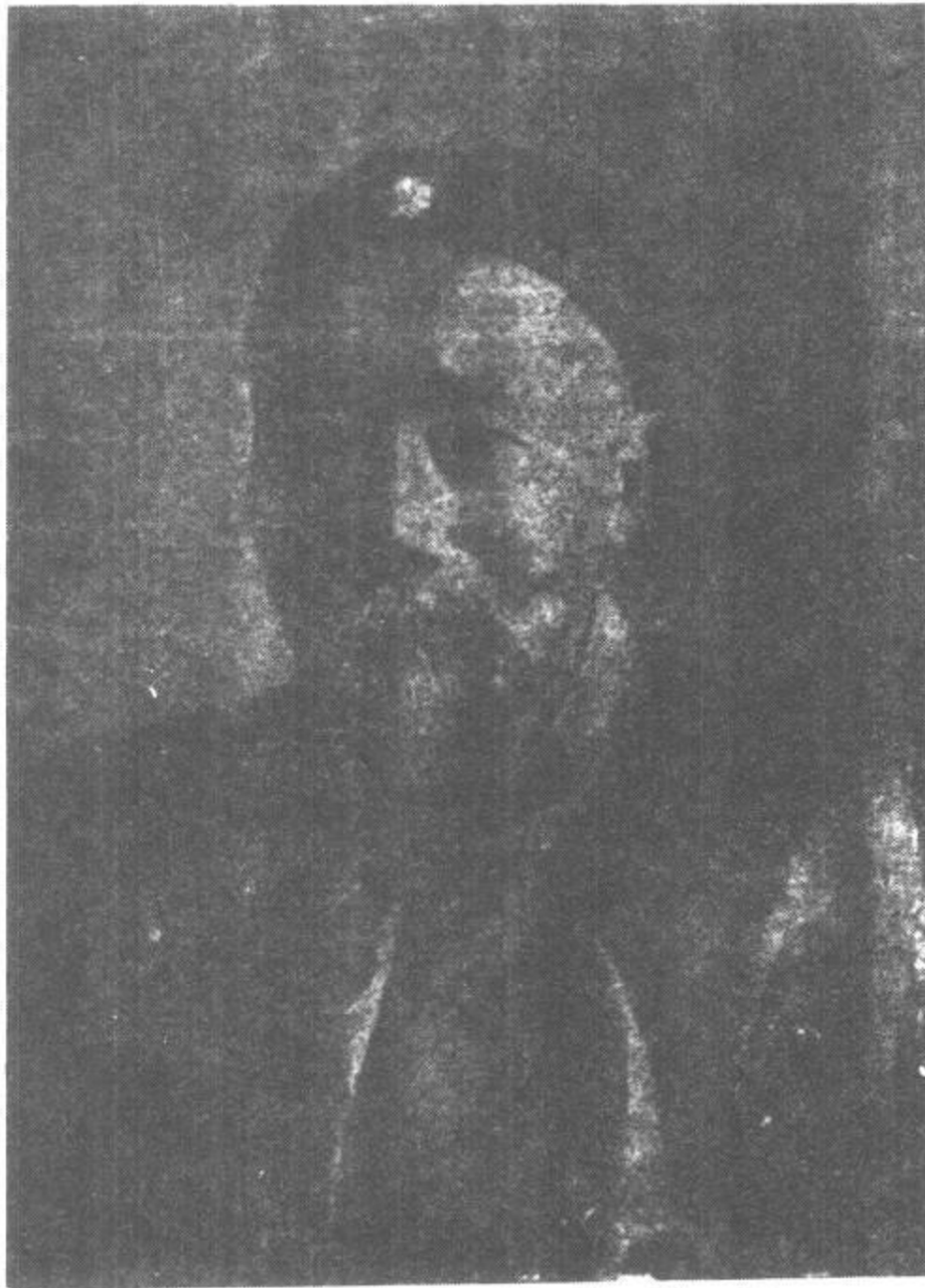
李文忠公鴻章遺影 巡撫毓賢 前在山東 巡撫任內。 妄信拳匪 邪術。至令 爲之掄揚。 以致諸王 大臣受其 煽惑。及在 山西巡撫

主戰。致啟釁端。罪實難辭。降調韓國公載瀾。隨同載勛。妄出違約告示。咎亦應得。着革去爵職。惟念均屬懿親。特予加恩。均着發往新疆永遠監禁。先行派員看管。已革