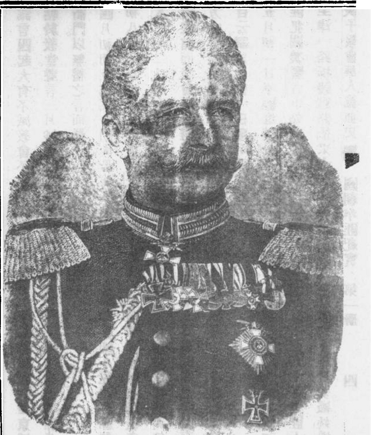
聯 軍 統 帥 瓦 特 西 (3126) 肅入都。 在市遊 行見遍 地皆拳 匪。聲言 帥殺鬼子 姚此日 昇平世 界汝等 勿妄言。 汝等欲 殺鬼子。