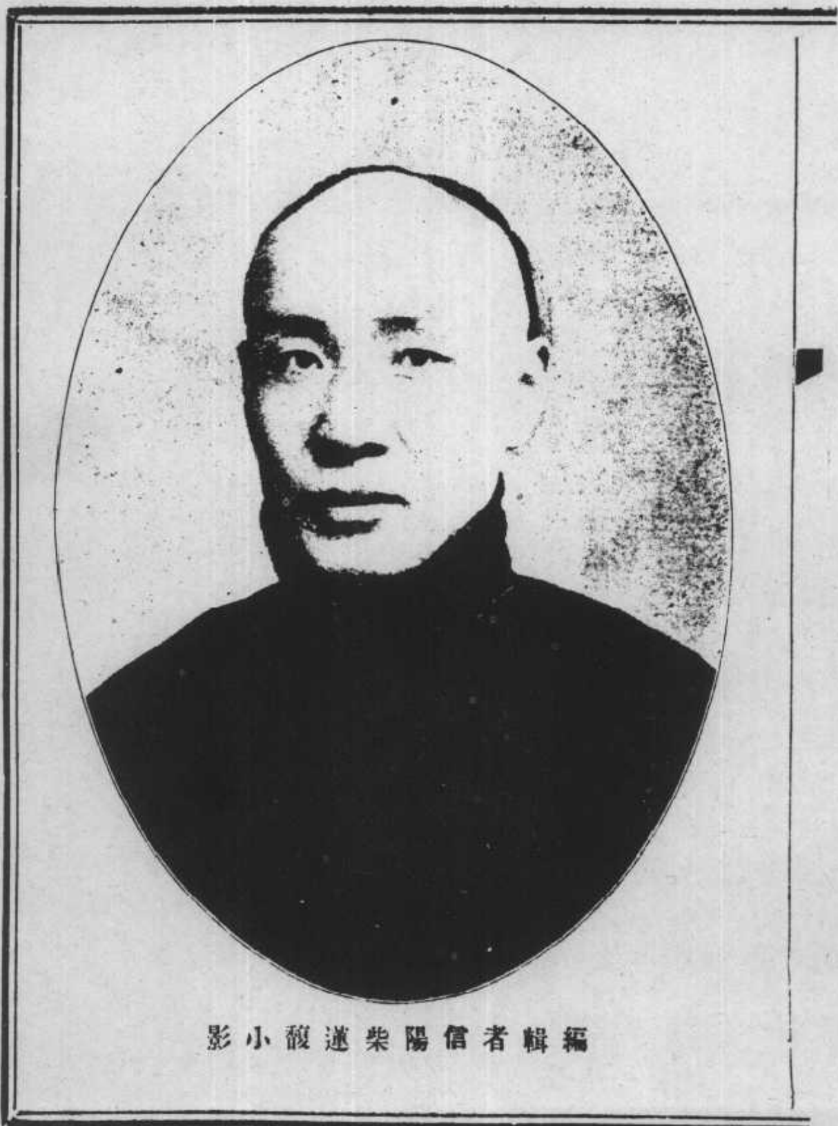
影小馥迷柴陽信者輯編