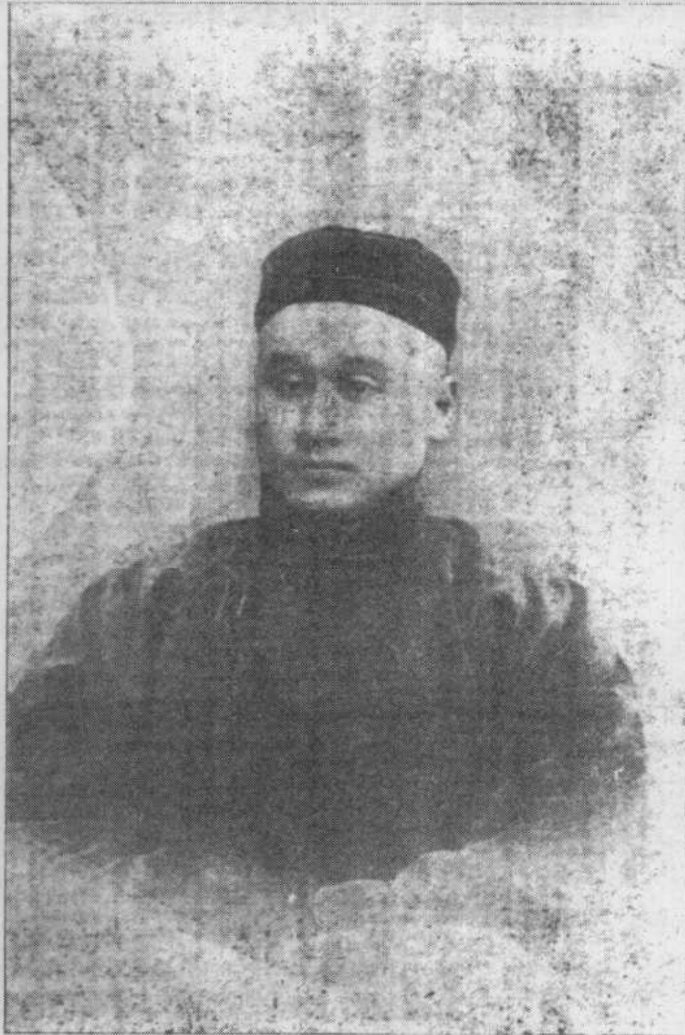
E3776 像肖生先繪維徐會書教聖國中海上