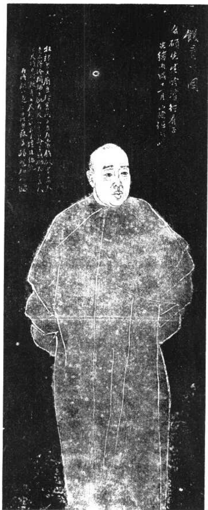
任伯年画吴昌硕画像 — 西泠印社 —