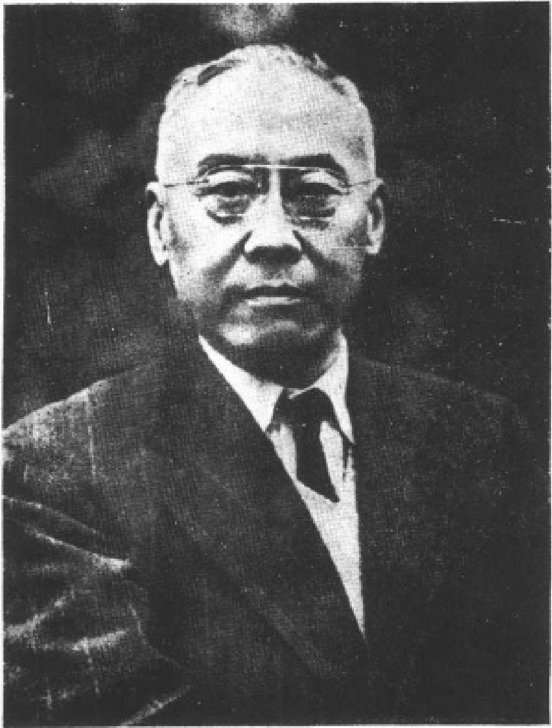
中國社會黨主席張勳先生照