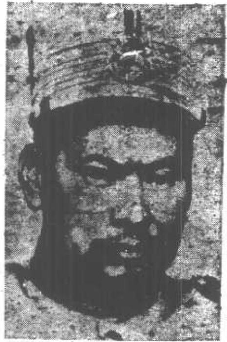
陸 榮 廷 (1856—1928)