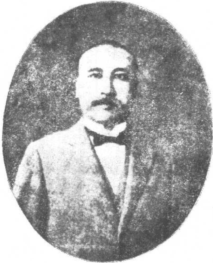
陳 炯 明 (1877—1933)