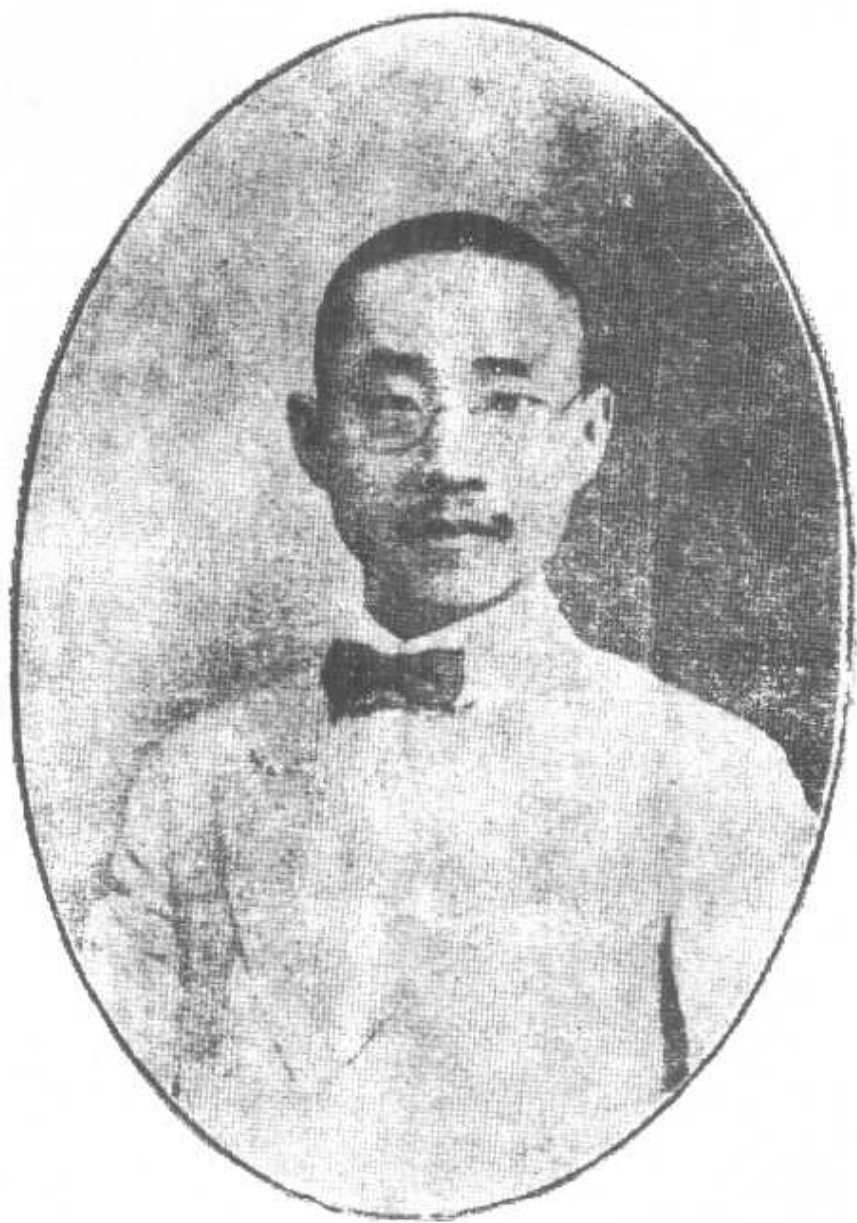
朱 執 信 (1885—1920)