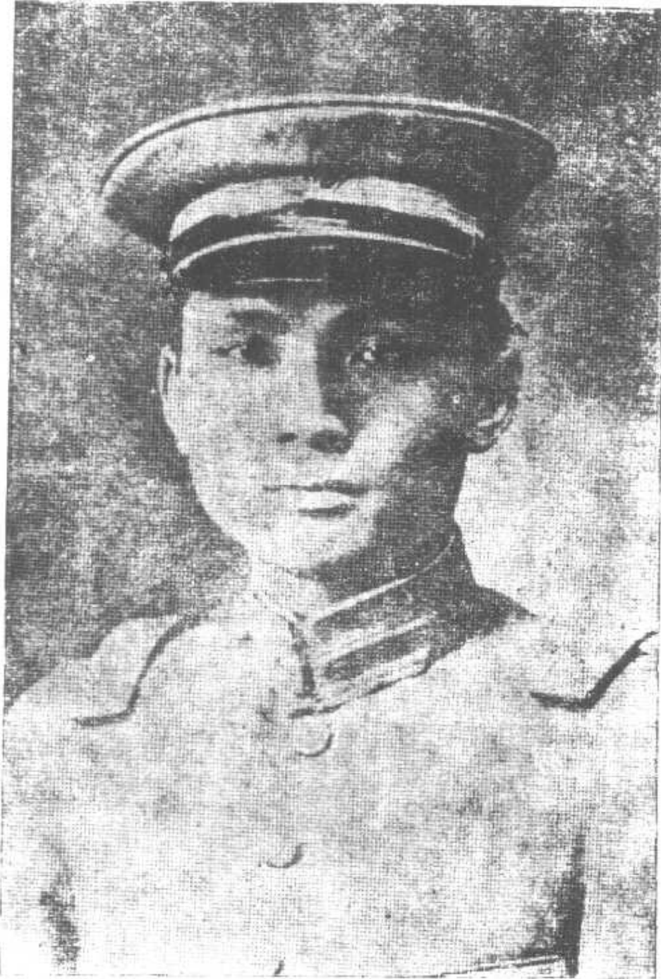
鄧 鏗 (1885—1922)