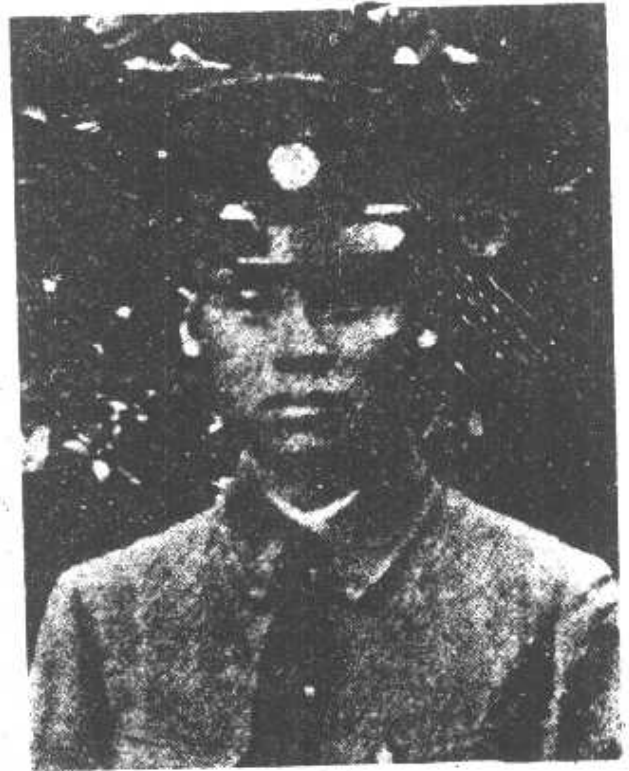
同祝願長營營一第團二第