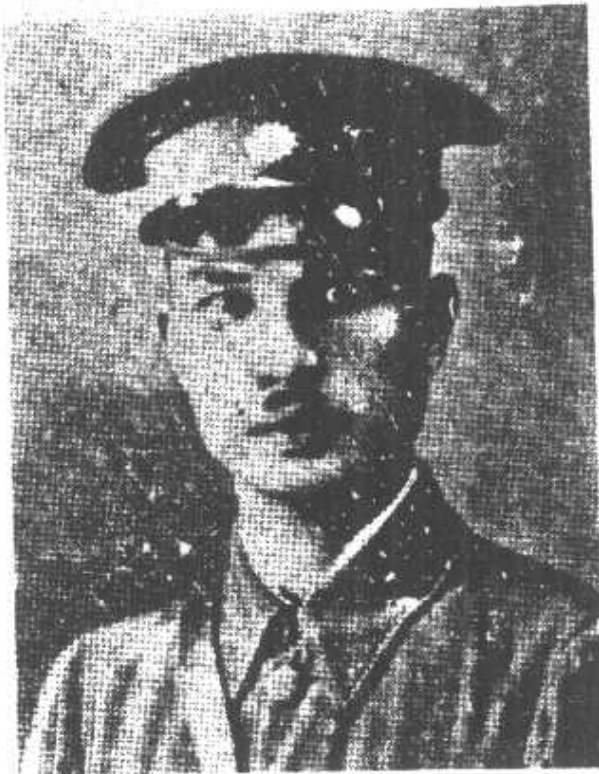
俊 王長營營三第團一第