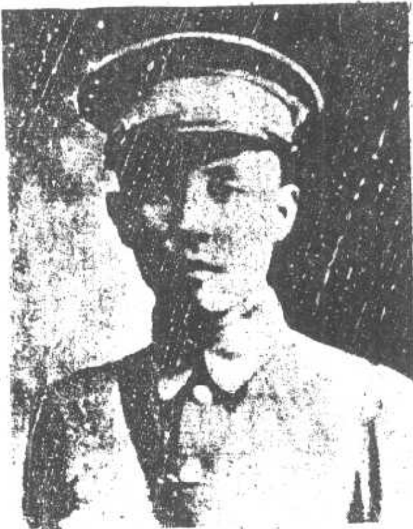
鈞大錢 長團團二第