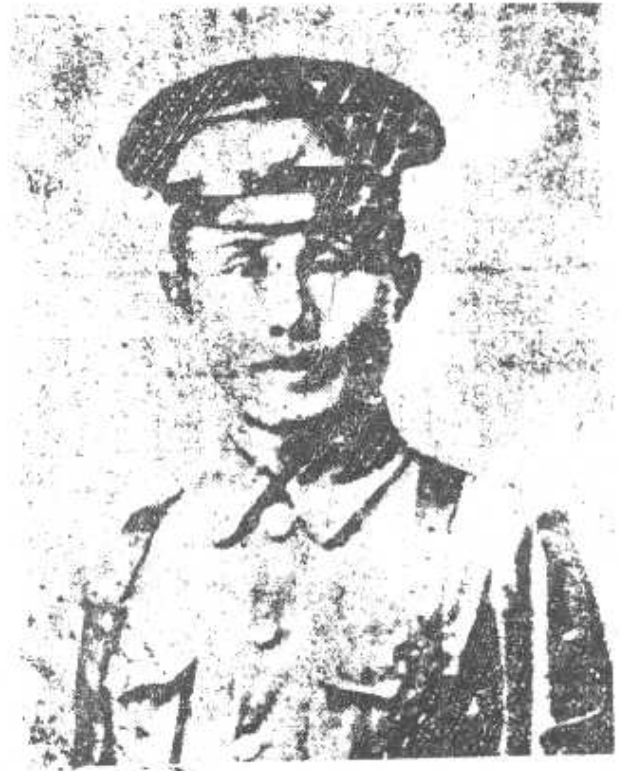
欽應何 長團團一第