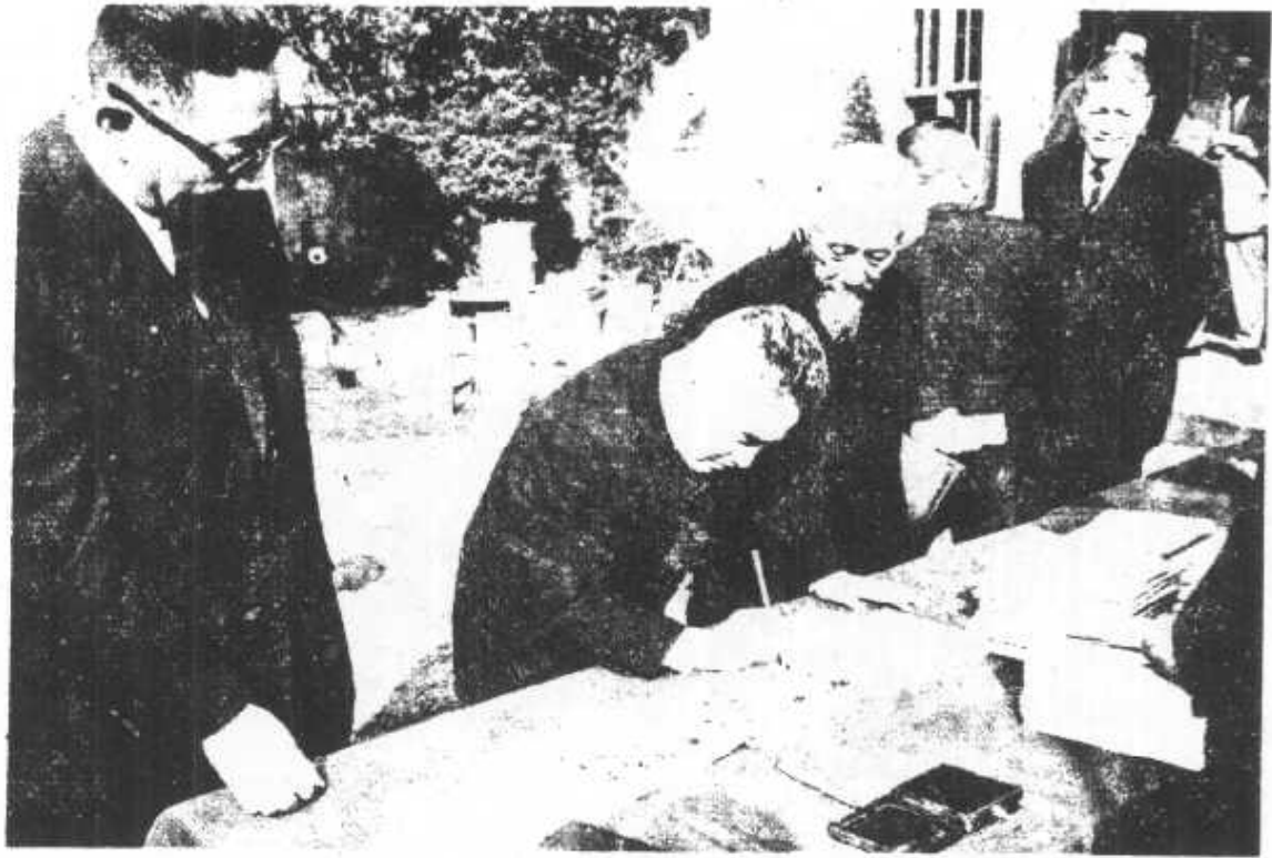
。名簽會念紀席出菜彥長書秘鄭