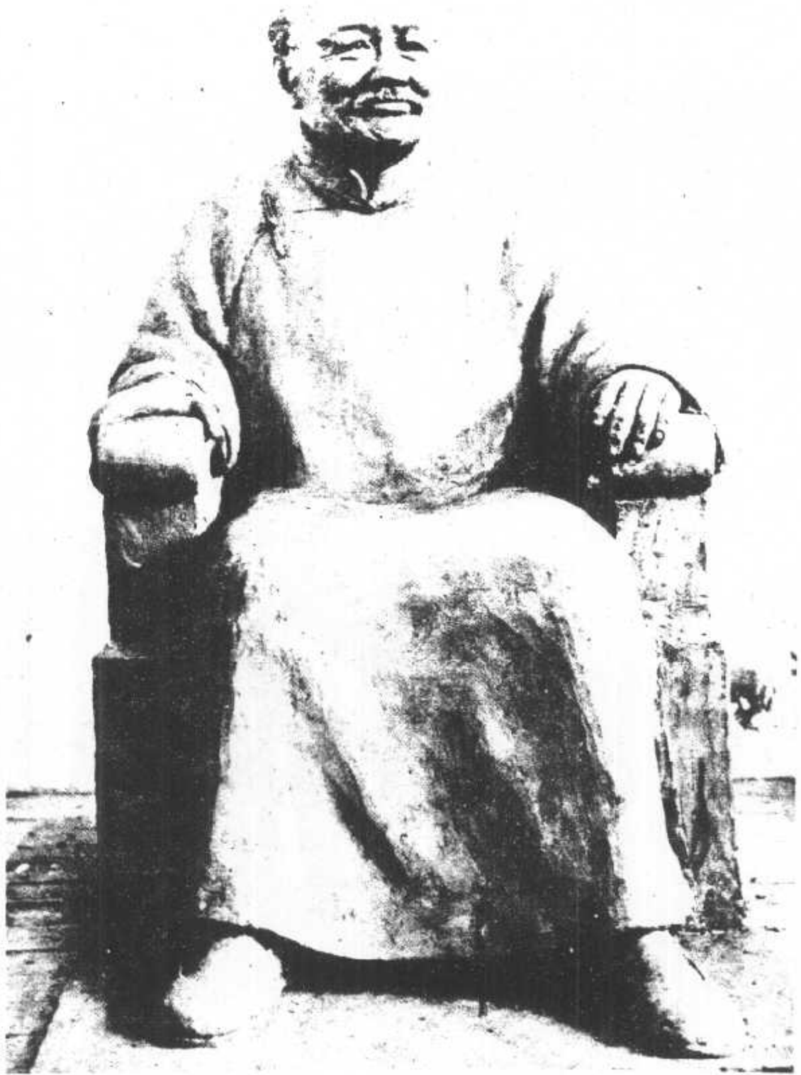
，成鑄月三年三十六國民像銅生先暉稚吳 。園校學中級高恕強立私北台於奉安已現