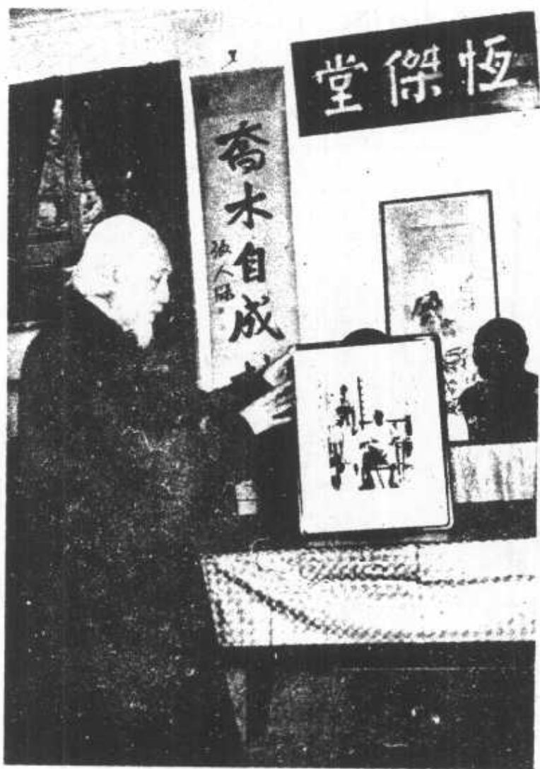
里昂中法大學，另一創辦人李石曾（煜瀛）先生遺影。