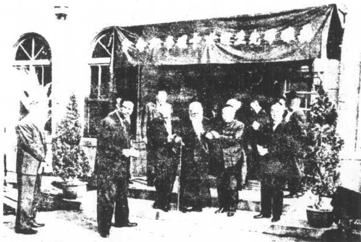
。會念紀臨蒞任右長院于