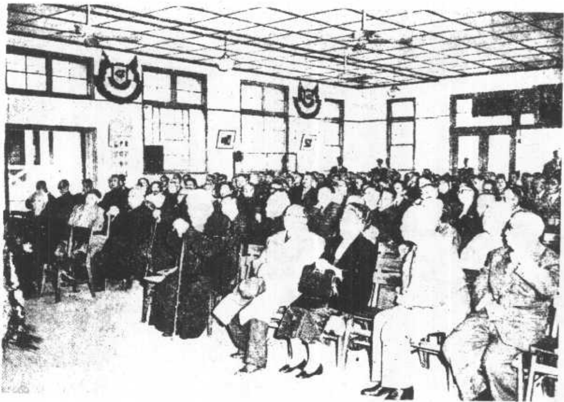
。場會會念紀年週十世逝生先暉稚吳