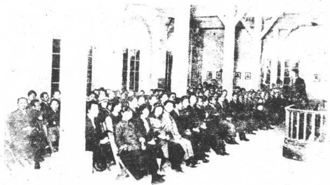
民國十年冬里昂中法大學校長吳稚暉先生向學生講話之照