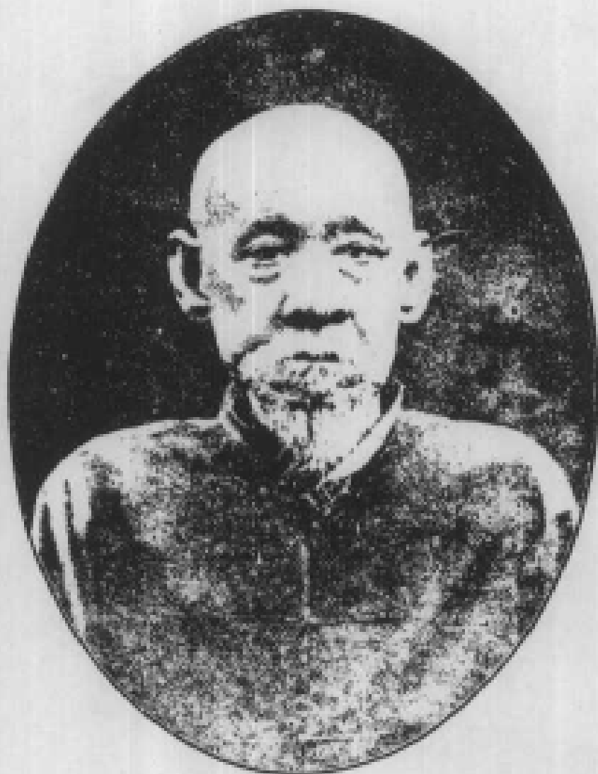
成山老人十八歲像