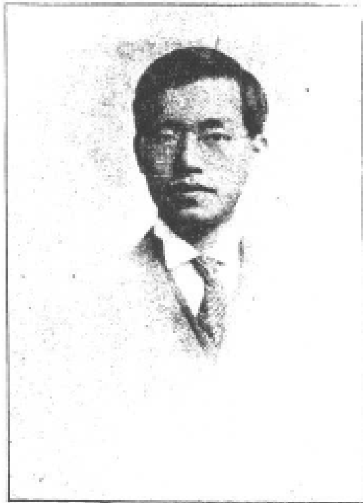
標可葉長會正會合聯會農