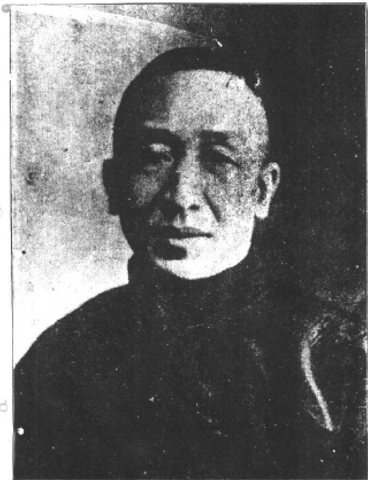
厚汪纂副兼長處副處稅統菸推部政財