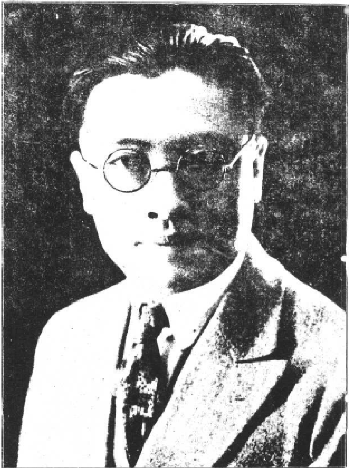
度叔程纂總兼長處處稅統菸捲部政財