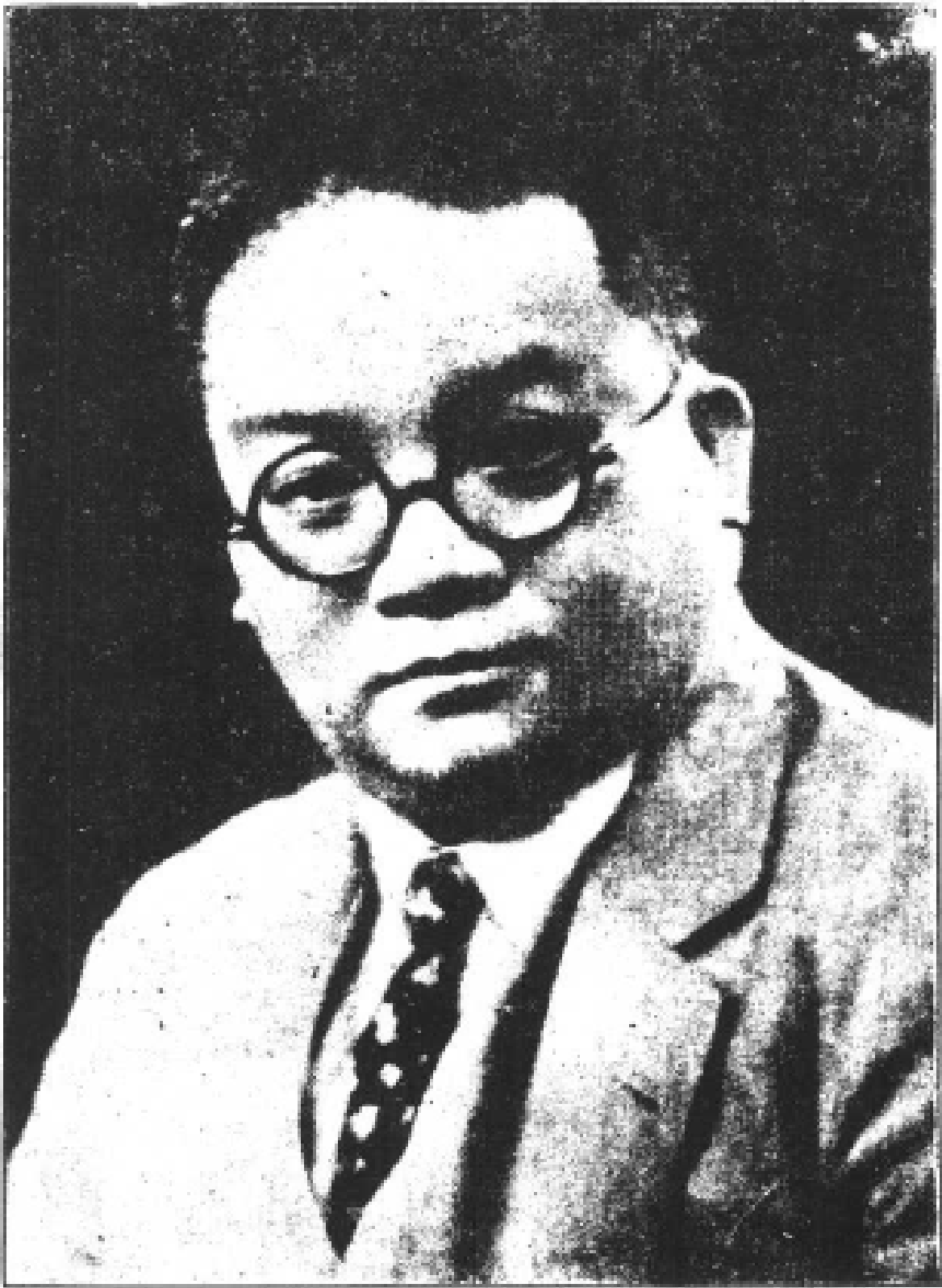
前財政部捲菸稅處處長謝祺