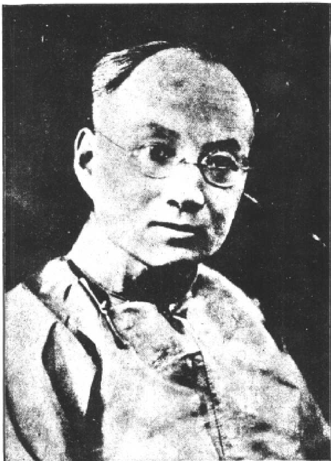
鋪 齋 張 長 次 部 政 財