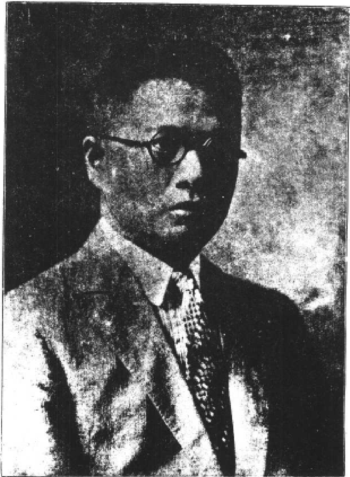
文子宋長部部政財