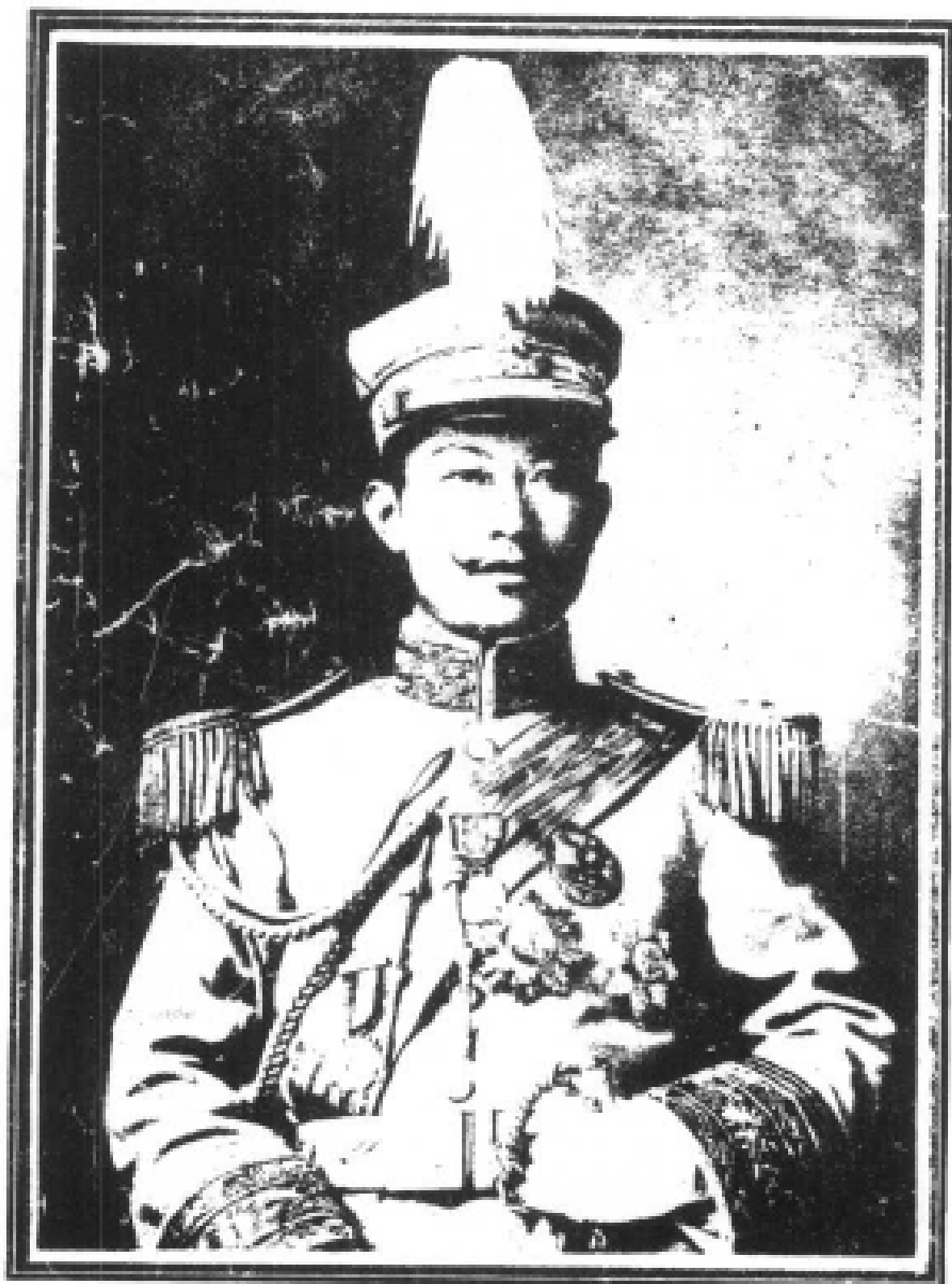
蔡松坡先生最近攝影