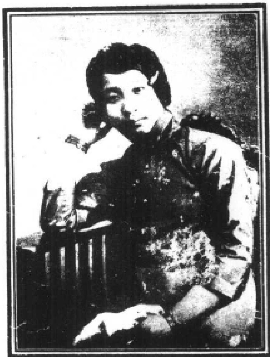
俠 妓 筱 鳳 仙 小 影