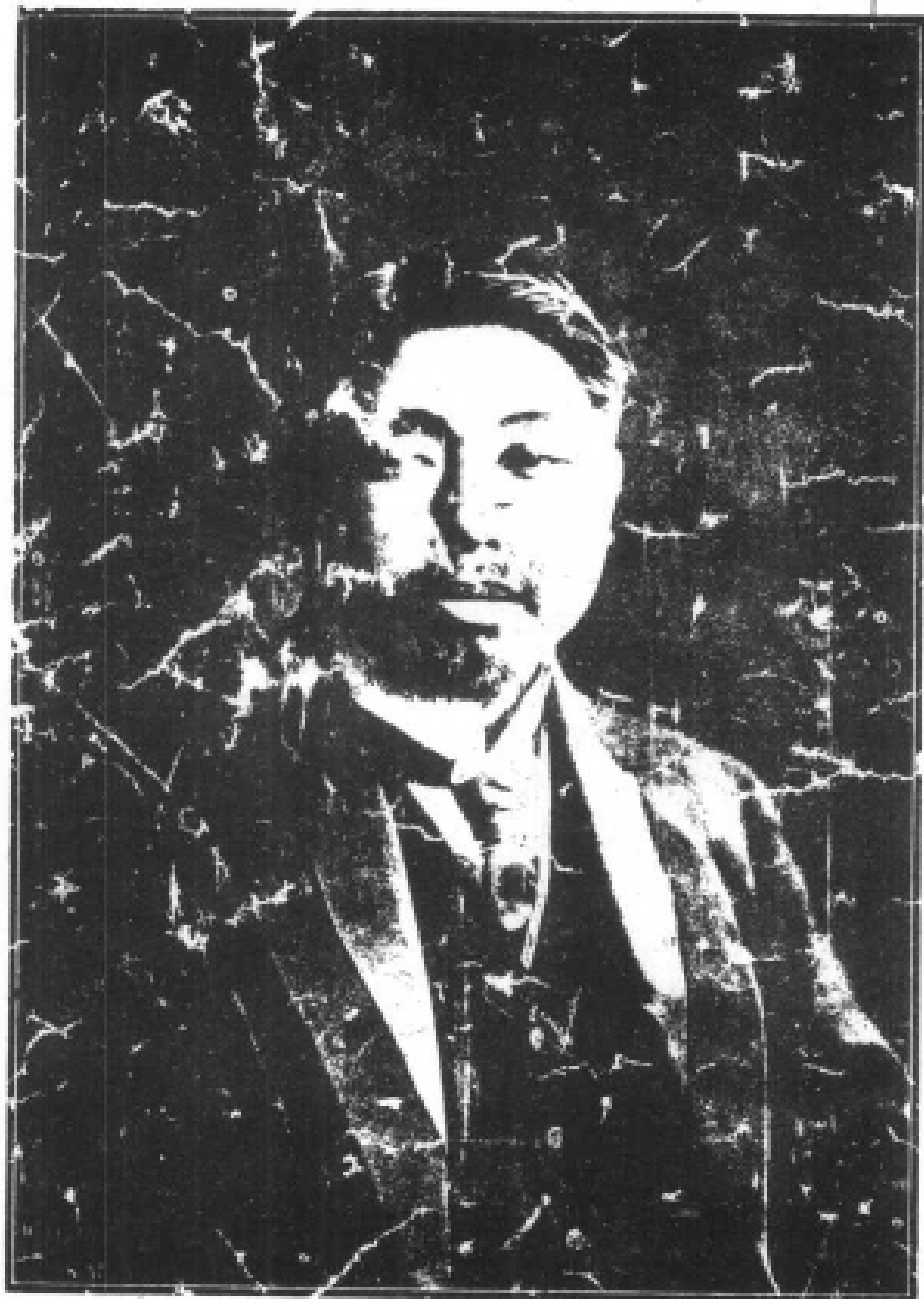
影 攝 近 最 生 先 强 克 黄