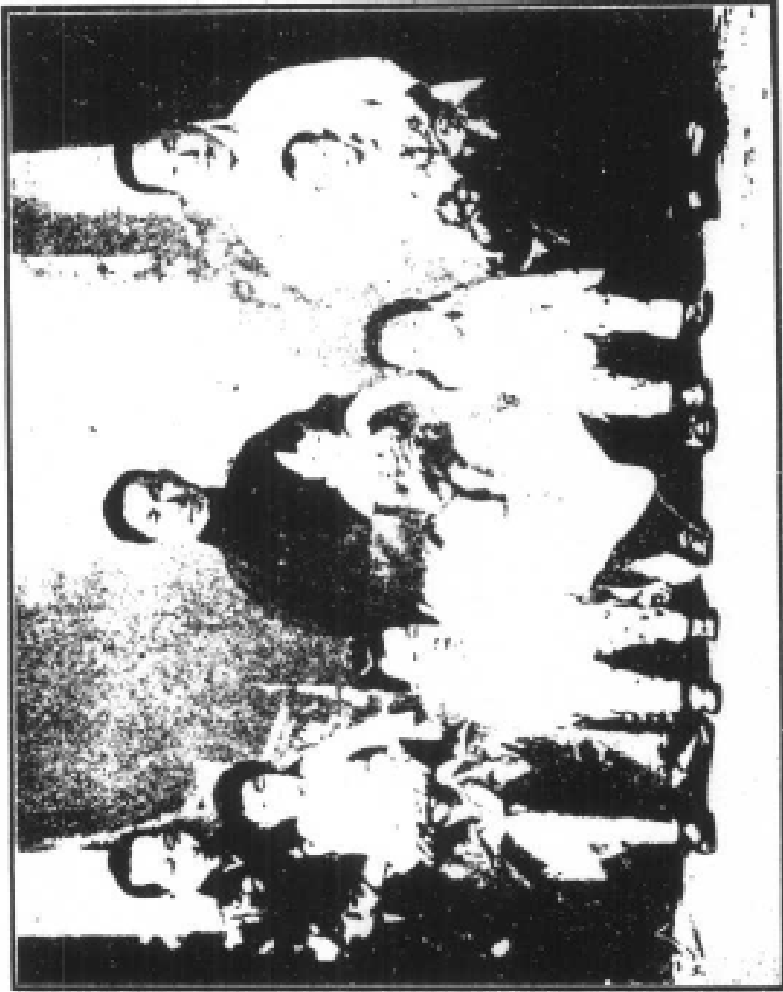
蔡松坡先生之家庭