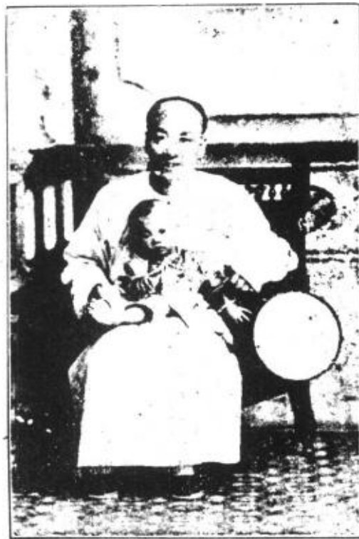
公 賦 開 時 代