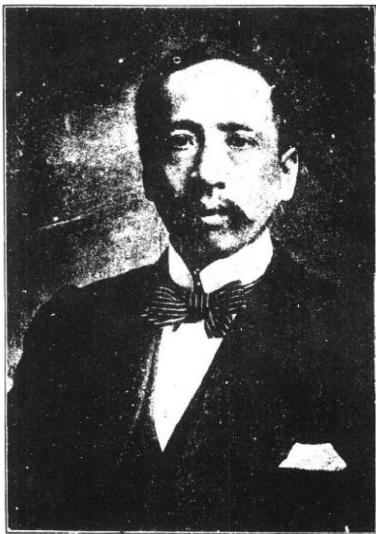
公一八九八年照片