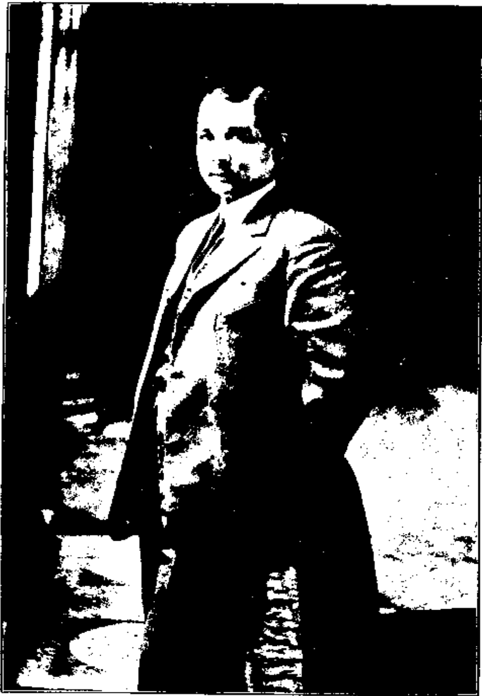
（黎巴法在）年三前元紀國民