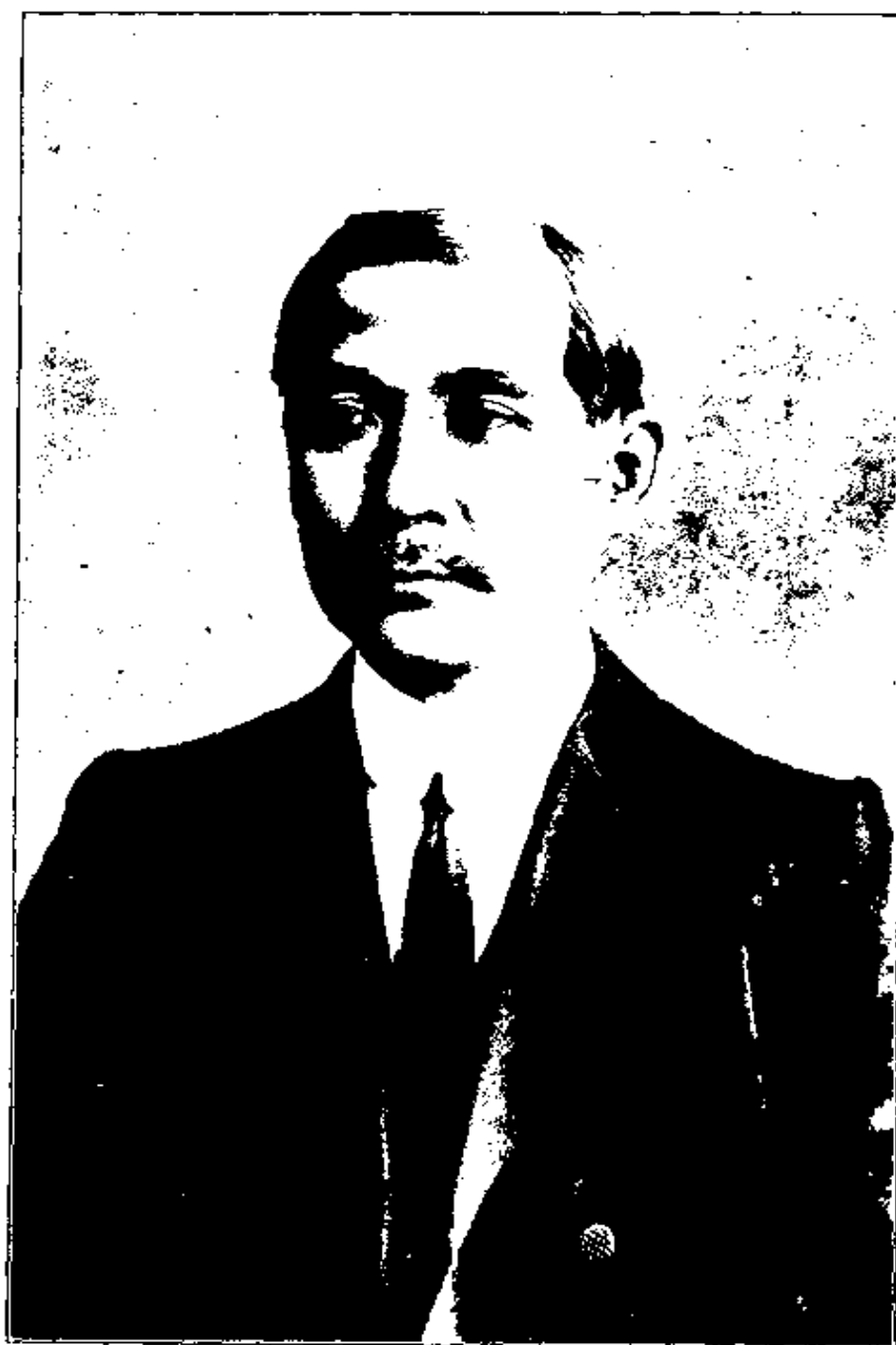
職統總大任一第就京南在年元國民