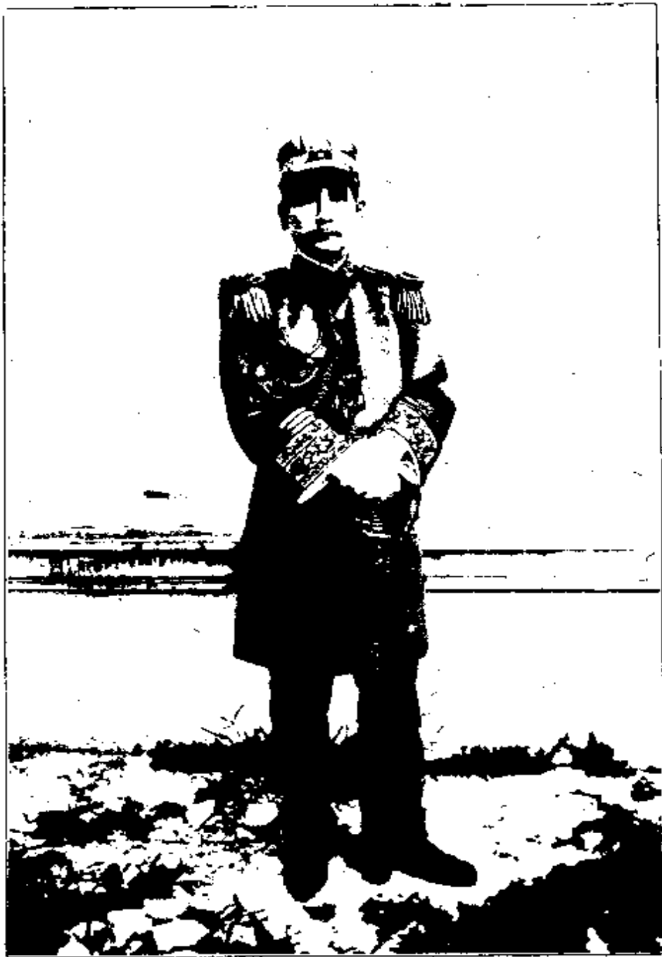
職帥元大就州廣在年六國民