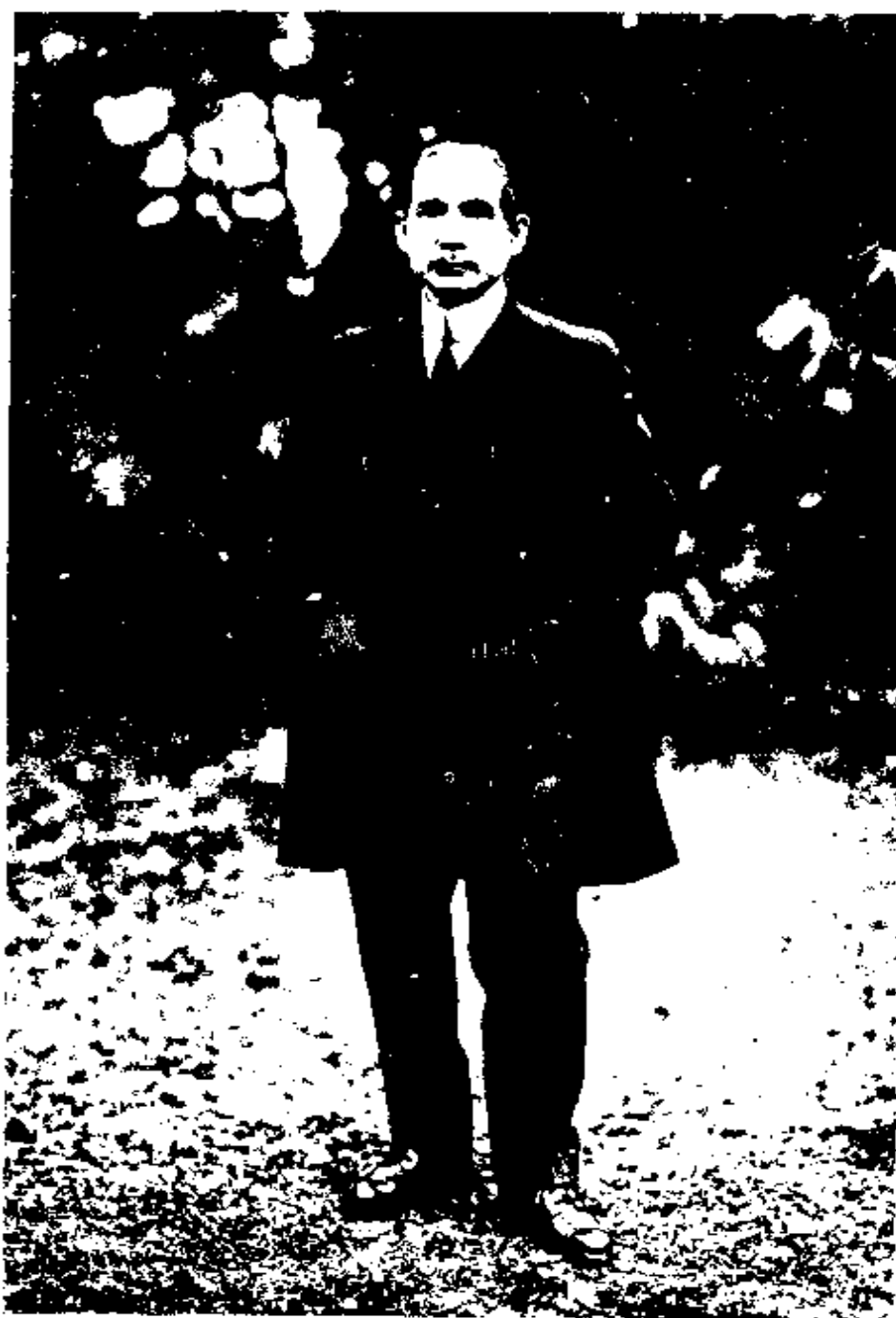
(海 上 在) 年 五 國 民