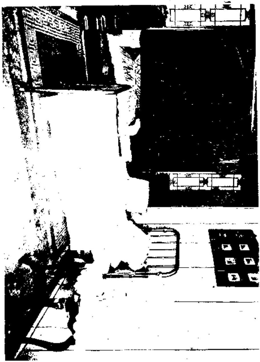
北京鐵獅子胡同轅之中齋室