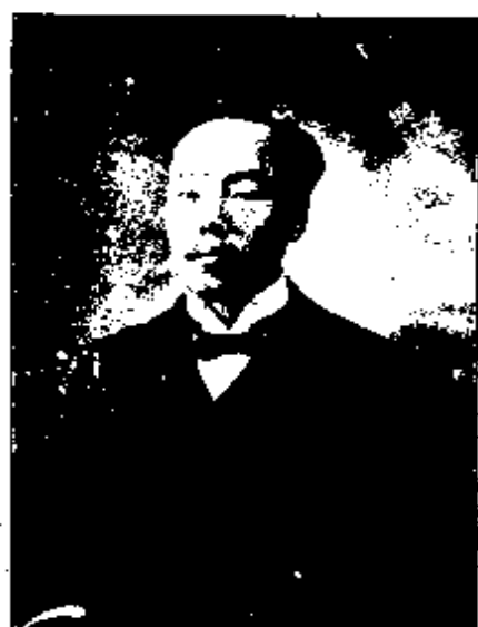
先 達 著 吳 星 編

款は關稅及び鹽稅を以て抵當と作す。速に條約國と加稅を商議して一面に屋金を廢し、及び輸出稅を減少すべし。毎年海關常關額四千四百萬兩より六千萬兩に増加せば、前項の外債に抵支して餘あり。鐵道及び他項の借款に至りては別に鐵道及び他項の收入を以て償還不足す、則ち鹽稅より支出補填すべし。尙ほ各省の地方外債總額約一千餘萬兩あり。又た去冬庚子(北清事變)賠款未拂額一千二百餘萬兩あり、均しく新政府に歸入す、即ち大借款項中より速に償還すべし。建設の行政費、即ち應に迅速に豫算を成立して以て大借款支用の標準を定むべし。目前先づ短期國庫債券を發行して急需を濟ひ、本項の國庫債券は將來大借款より返還すべし。此事極めて重要にして此を合て他法の財政信用を恢復すべし無し。新法に仿つて鹽稅を整理せば鹽稅五千萬兩を増すべし。田賦を整理し、行役の積弊を刷り、人民の負担を軽くすること、未だ升科の地を經ず、專門の人才を搜集して新に從つて測量し、稅則を酌定し國幣を改良し、國法を劃一すること財政最要の關鍵と爲す、即ち必ず迅速に實行すべし。我國財政專門の人員尙ほ少なく、又た經驗に乏し、將來庶政具に擧げんとす、亦た須らく異材を借用し、以て先導に資して顧問に備へざるべからず。民國成立す、宜しく實業を以て先務と爲すが故に農林工商部を分設し、以て協助提倡の義を盡すべし。凡そ學校生徒は尤も實業を重んじて國本を培ふを宜しとす。吾國の實業は尙ほ幼稚時代に在り。實を以て言へば中華は實に農國にして開墾、森林、牧畜、漁業、茶、桑の富を地に瘞して未だ顯かざ