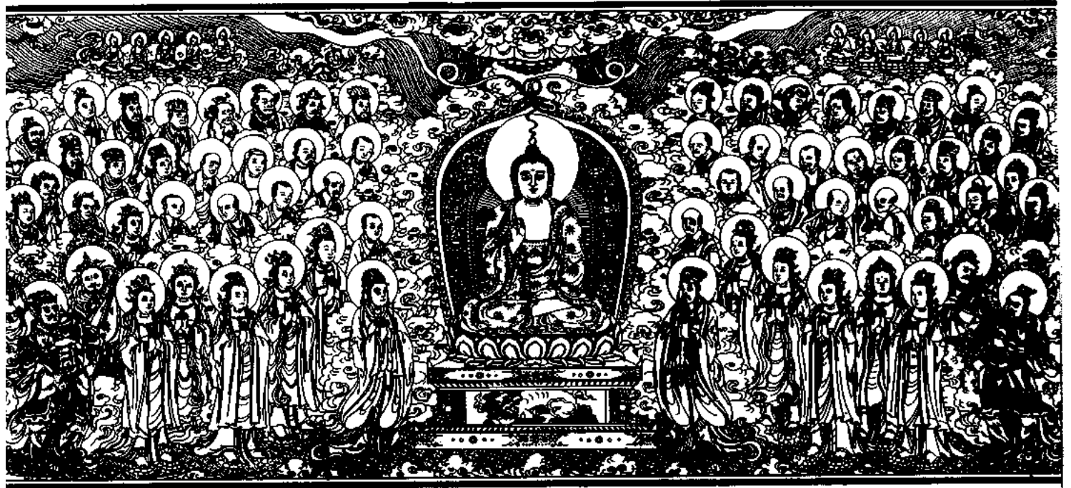
清刻龍藏佛說法變相圖