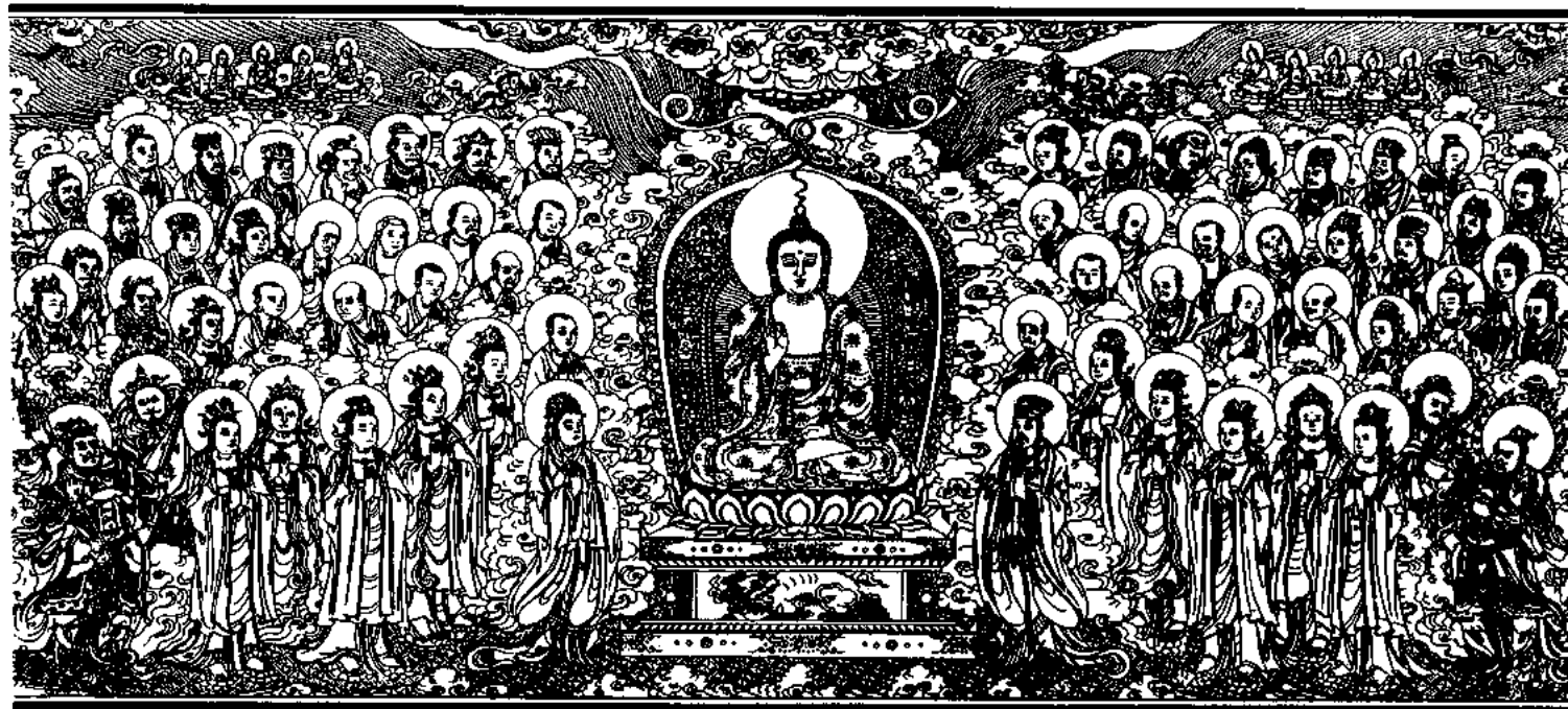
清刻龍藏佛說法變相圖