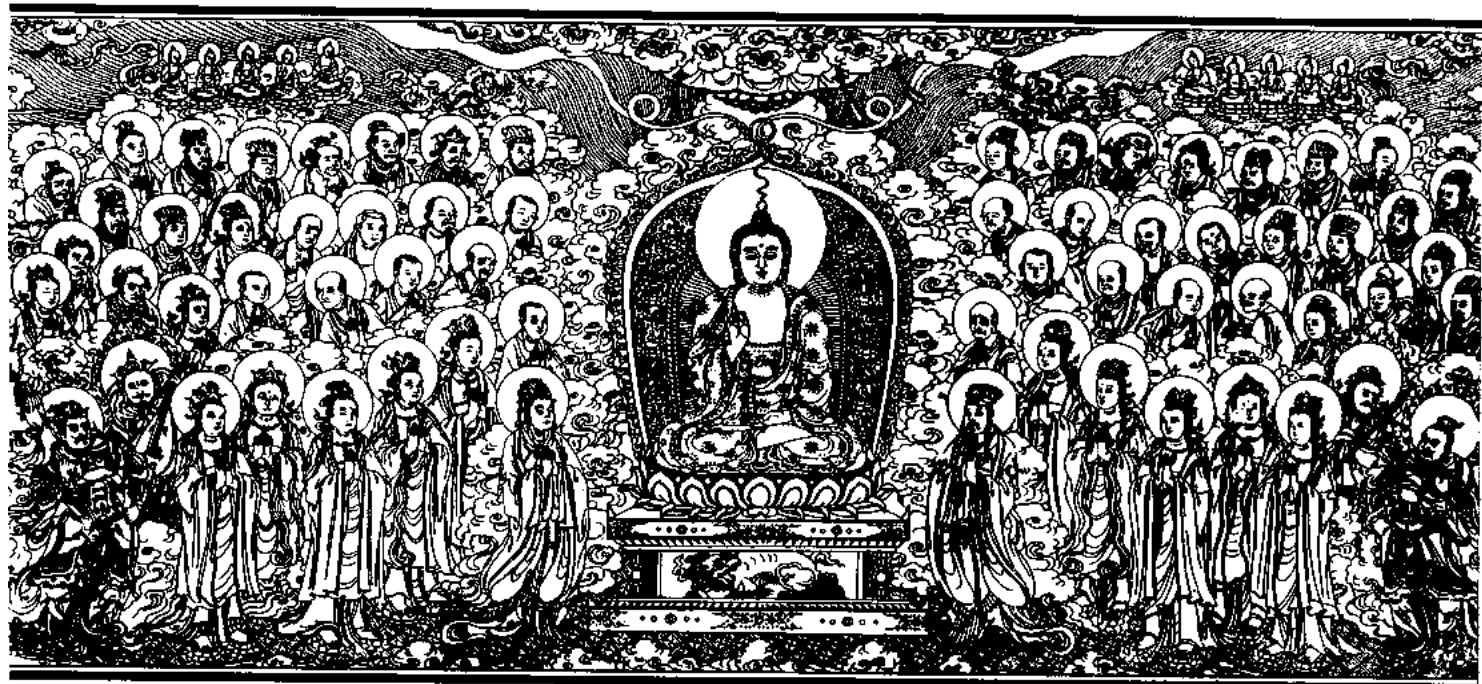
清刻龍藏佛說法變相圖