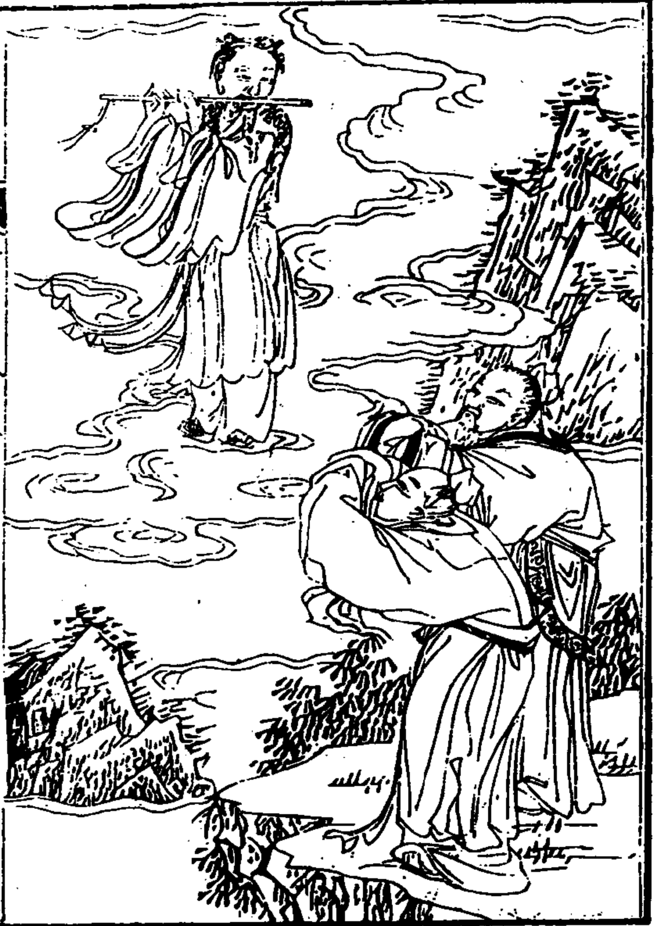
武東山志 卷之四 繪像