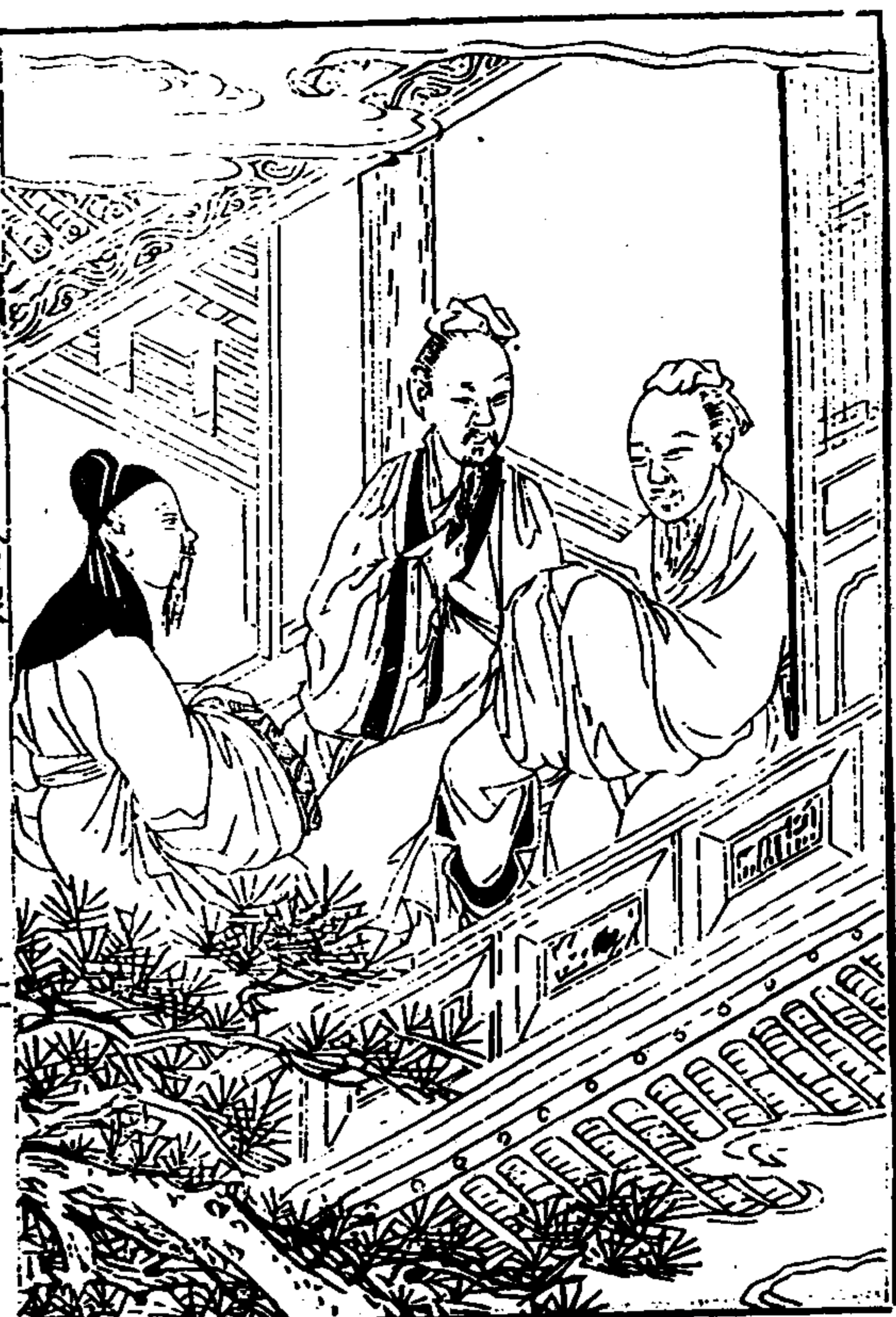
武夷山志 卷之首 繪像