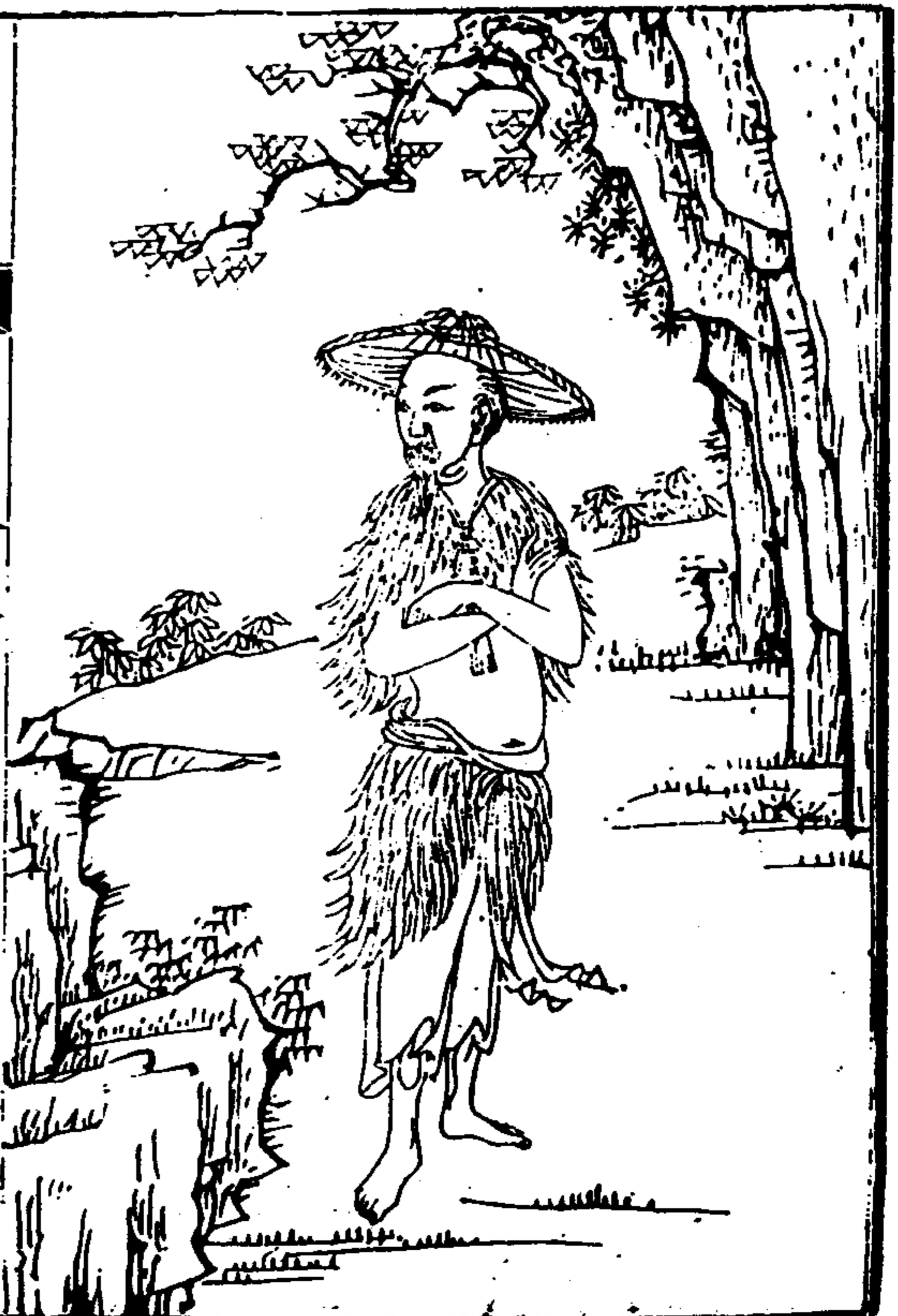
武東山志 卷之四 繪像