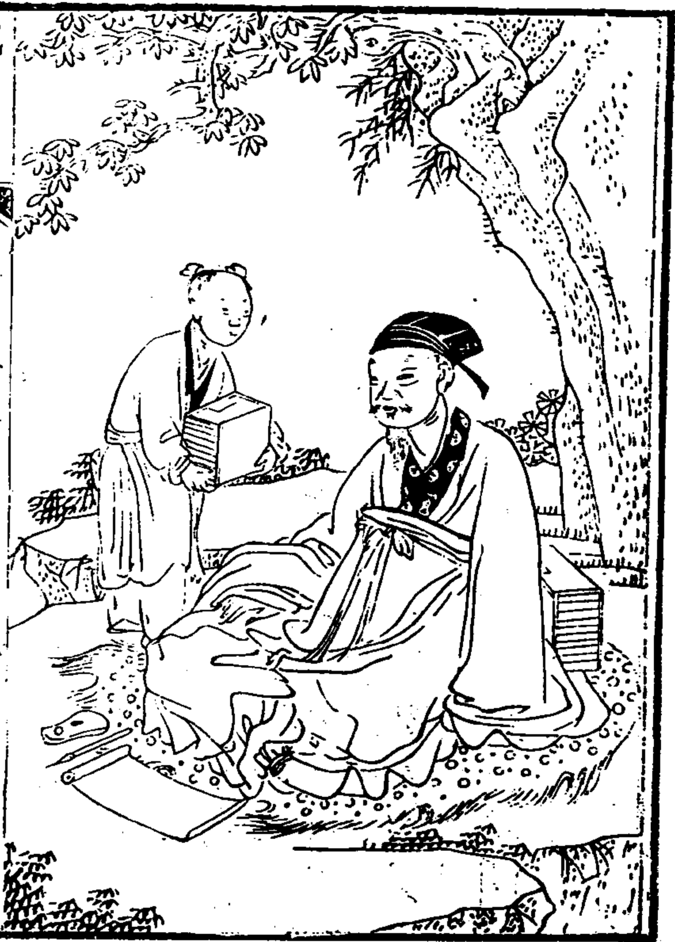
武夷山志 卷之首 繪像