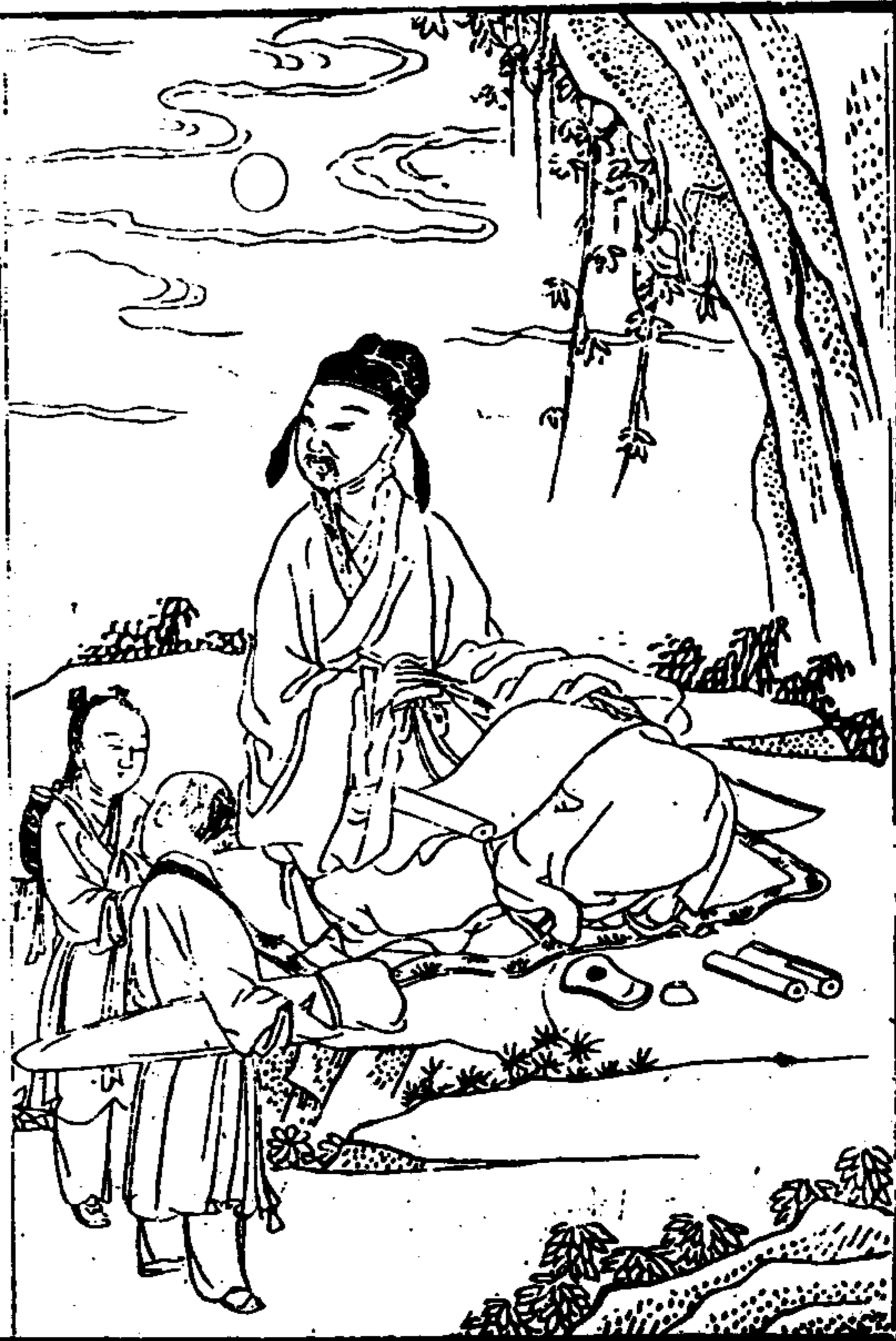
武東山志 卷之首 繪像

公以命世之才其位不克故天下知公之 文而未知公之道也昔王文正公居宰府 僅二十年未嘗見愛惡之迹天下謂之大 雅冠萊公當國真宗有澶淵之幸而能左 右天子如山不動却強敵保宗社天下謂 之大忠樞密扶風馬公慷慨立朝有犯無 隱天下謂之大直此三君子者一代之偉 人也公與三君子深相交許情如金石則 公之道其正可知矣 范文正公題