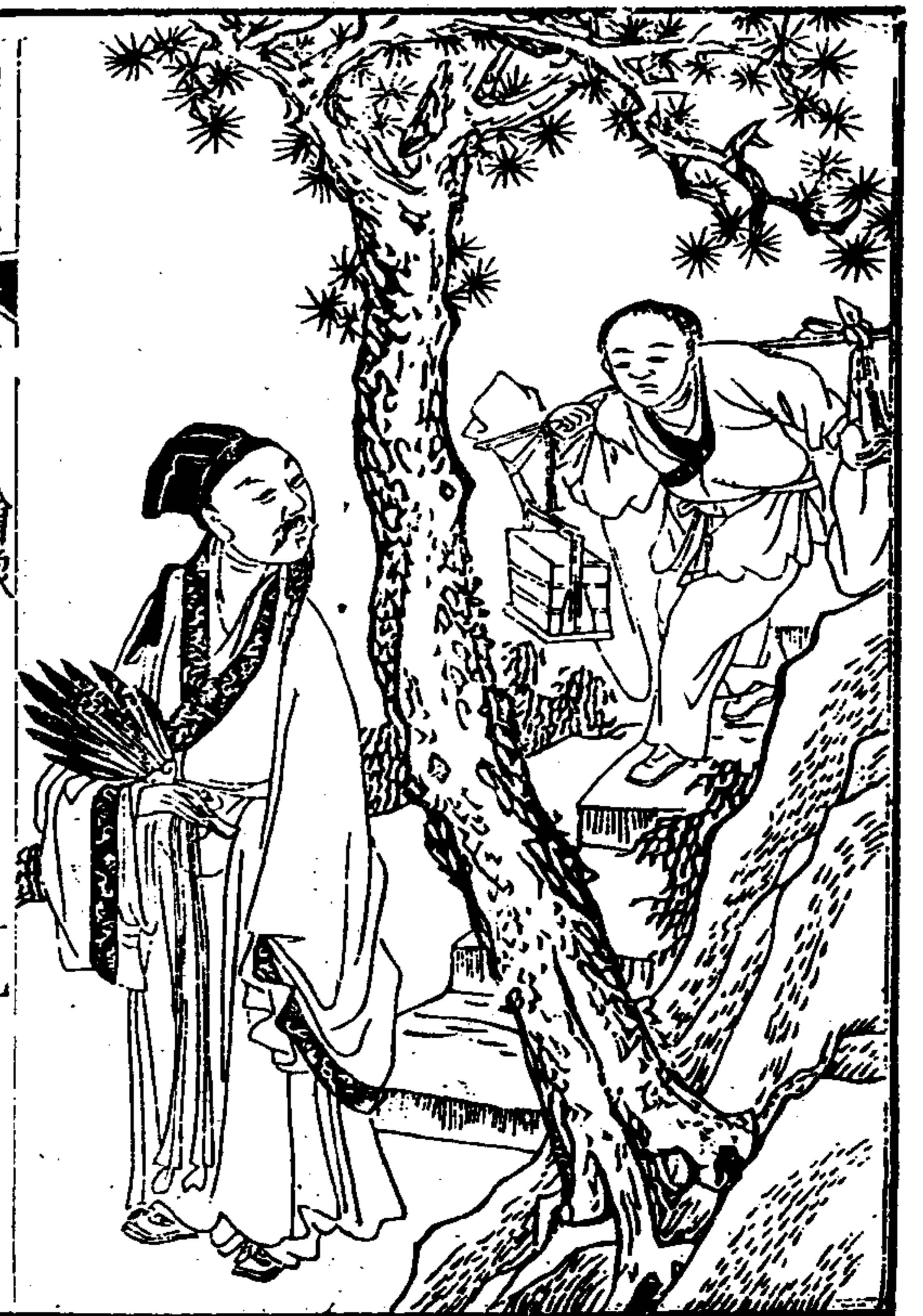
武夷山志 卷之首 繪像