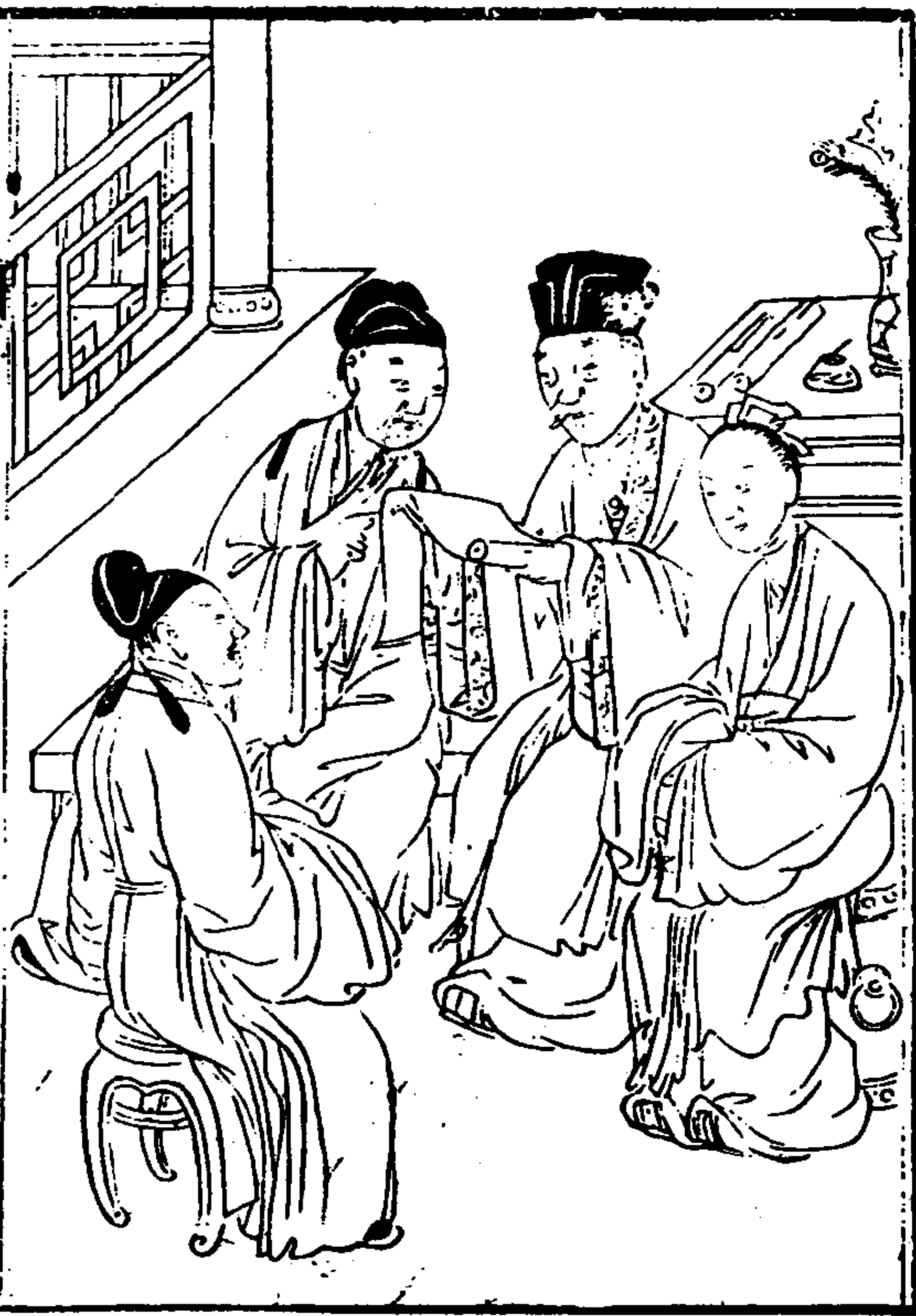
武東山志 卷之首 繪像