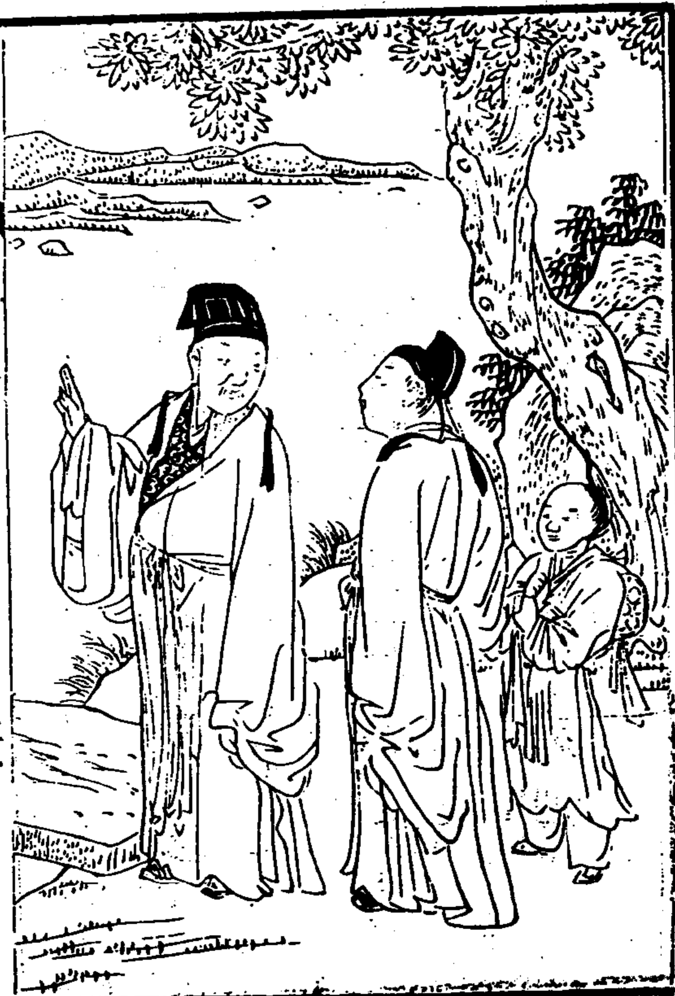
武夷山志 卷之首 繪像