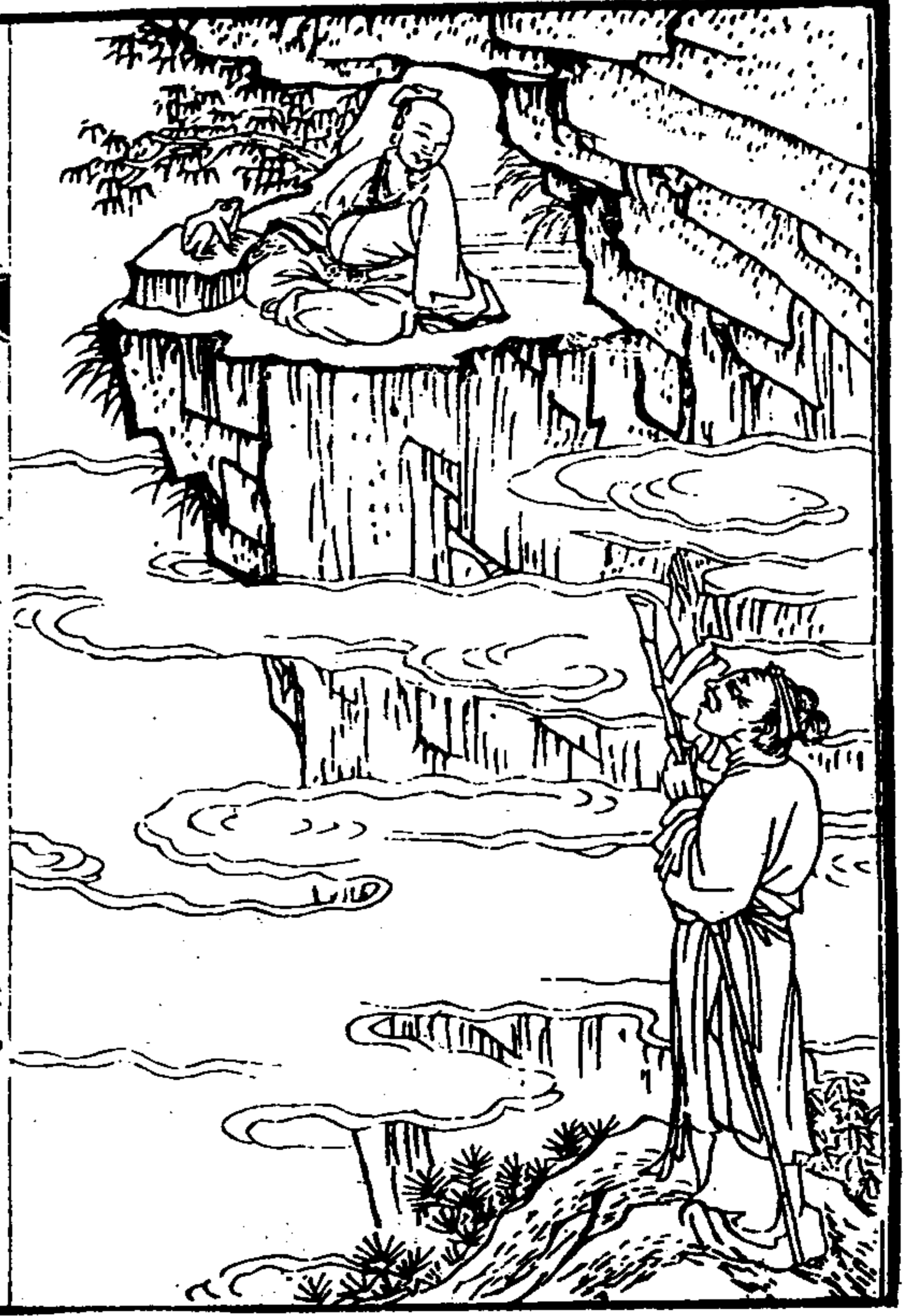
武夷山志 卷之首 繪像

控鶴仙人名爲仁十三仙魏王子騫張湛孫綽趙元奇彭令昭 劉景頤思遠白石生馬鳴生胡氏李氏魚道起魚道遠