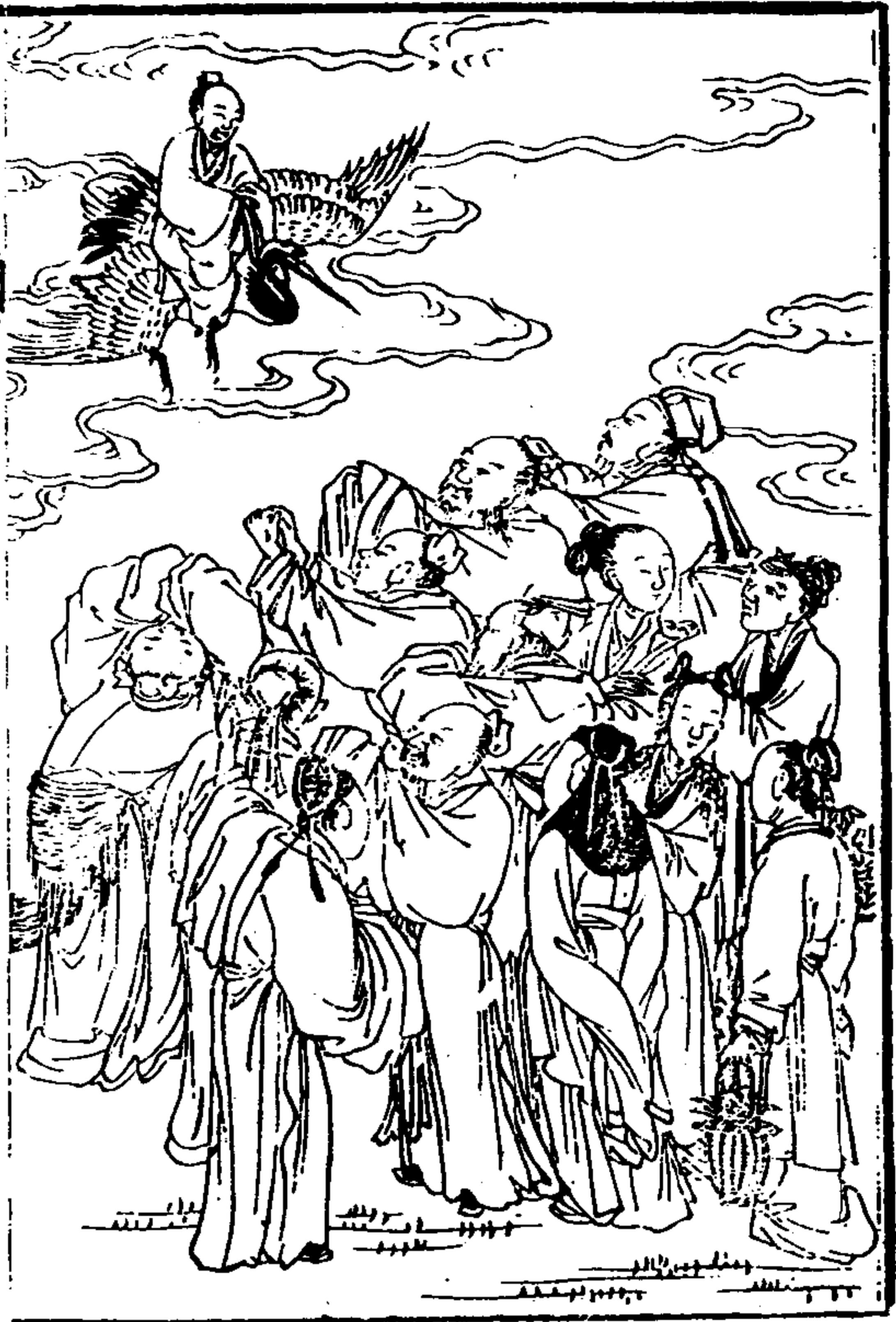
武夷山志 卷之首 繪像