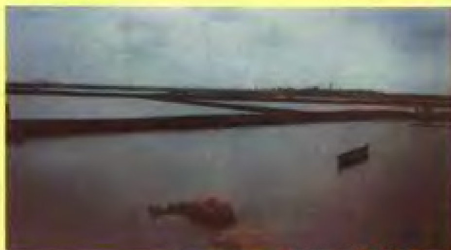
◀1986年垦区 对虾养殖池