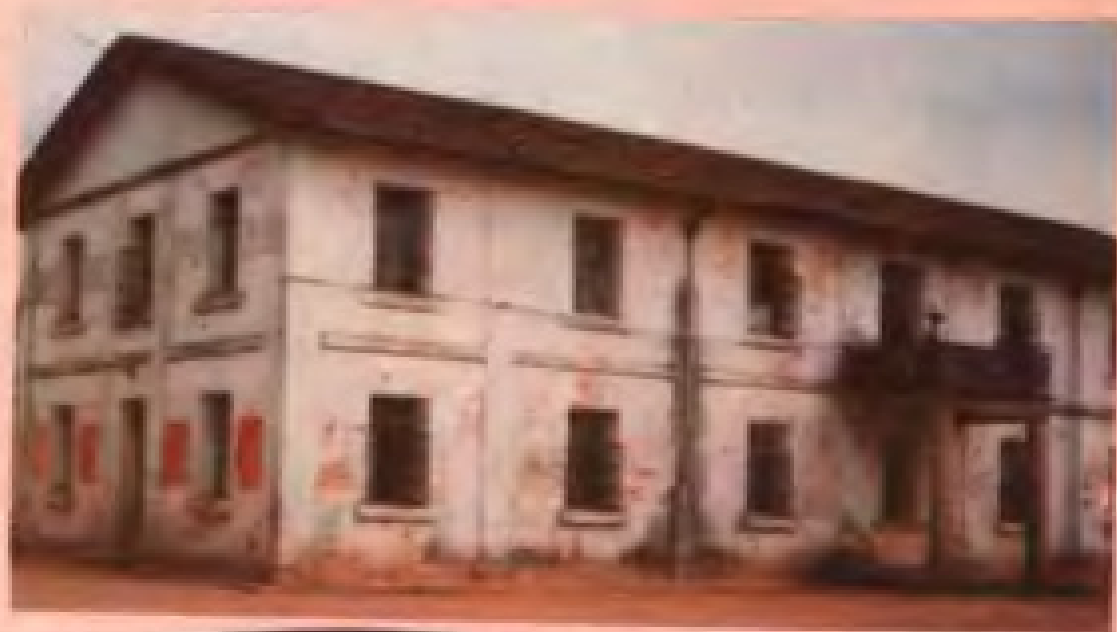
一九五八年下半年—— 一九九二年年底的场部旧办公楼