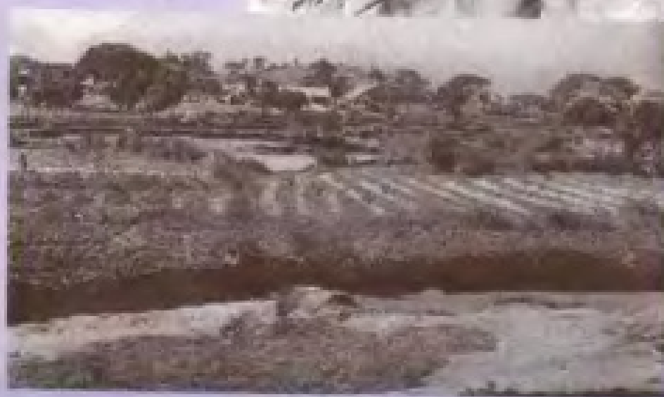
◀ 1958年 尚未基建时的 竹屿顶山