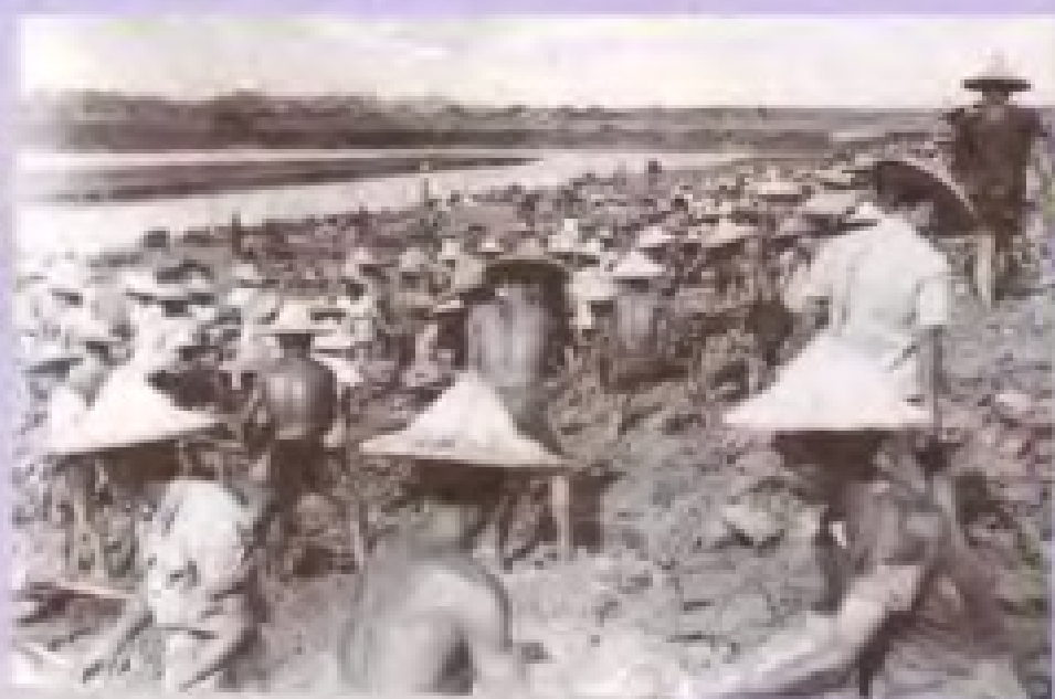
▶ 突击围堤 艰苦创业（一九五八年）