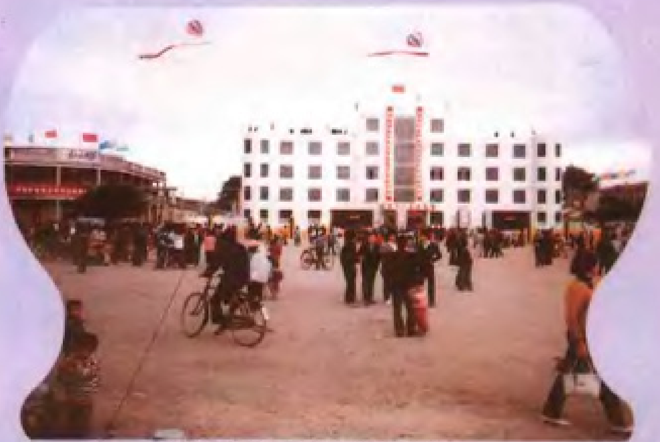
▲漳浦盐场办公科技综合大楼