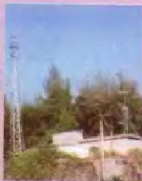
▲ 电视卫星地面接收差转台