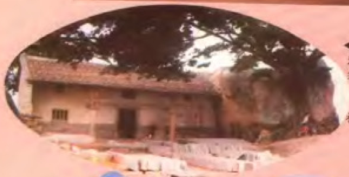
1958年 漳浦盐场 筹备处办 公地点 ——妈 祖庙原貌