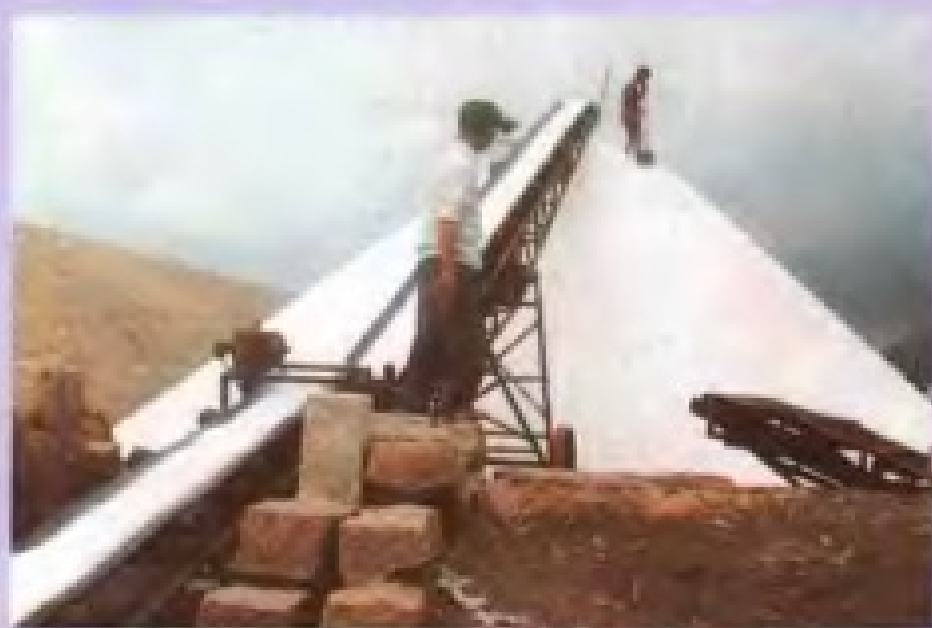
◀ 电力传动输送机 送盐上堆