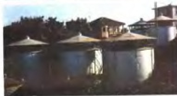
1979年建成的旧镇粮油储运站钢板油池。