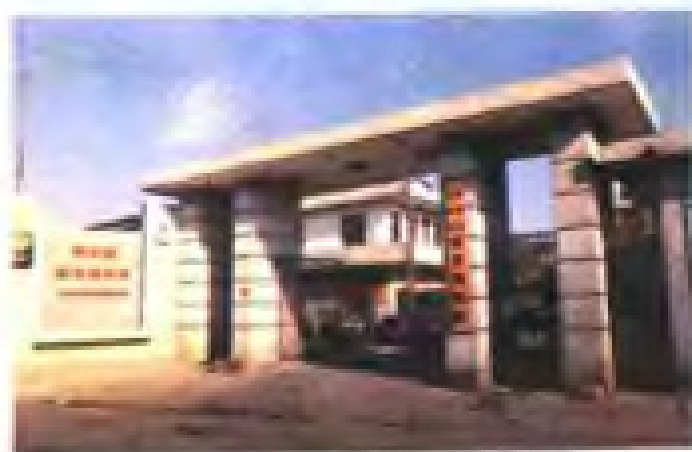
国家二级企业——龙海市配合饲料厂。