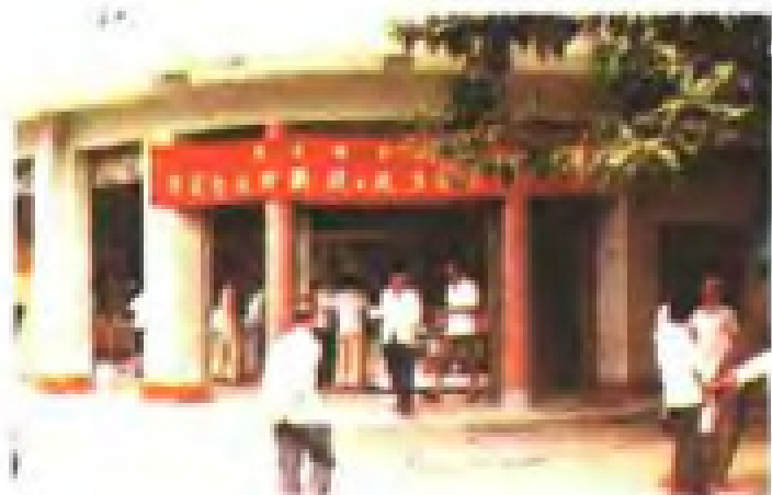
粮店积极开展树新风、比贡献活动。