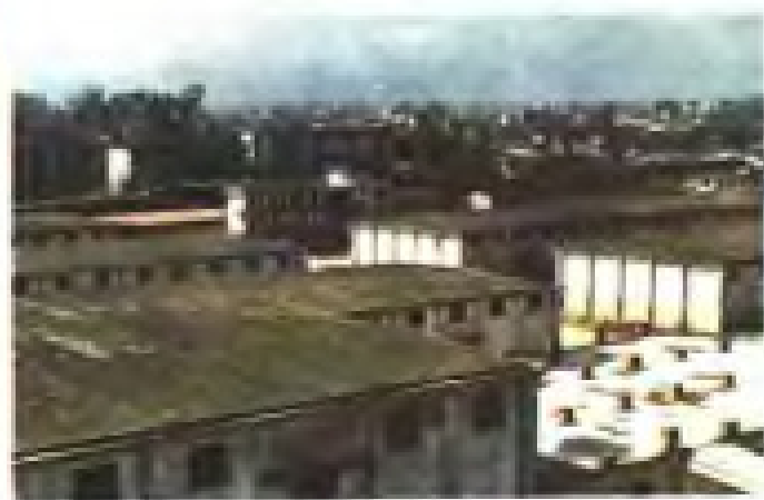
位于漳州火车站旁的岱山粮食储备库。