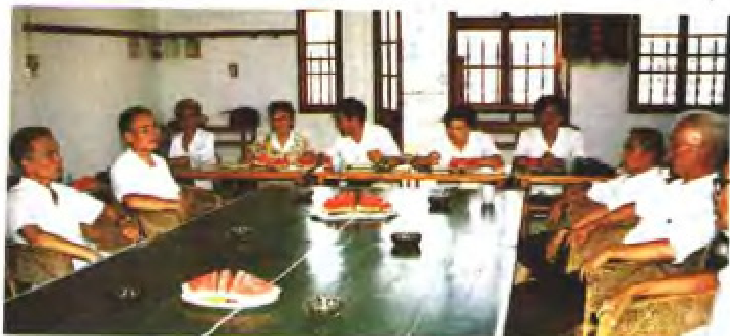
编写人员深入基层进行座谈，搜集资料。