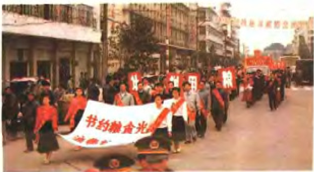
在世界粮食日所在周，市、区粮食系统组织“节约粮食光荣，浪费粮食可耻”的文艺游行。