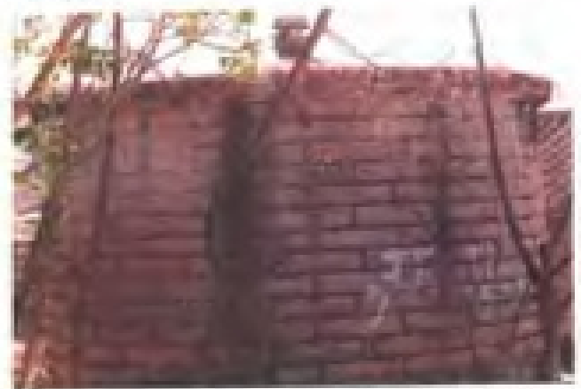
1958年建成的旧镇粮站石砌油池