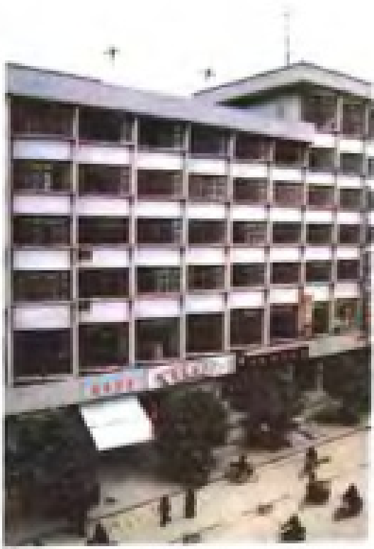
平和县稻香宾馆外景。