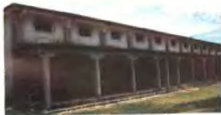
七〇年代建成的盘陀粮站石板屋顶仓。