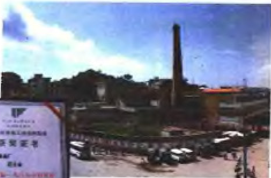
漳浦县旧镇油厂全景。