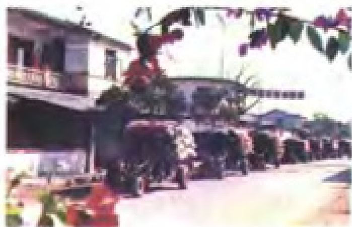
络绎不绝的手扶拖拉机满载粮食入库。