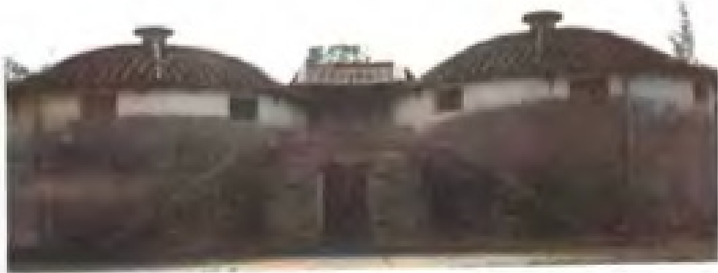
七〇年代初建成的漳浦县深土粮站石圆仓。