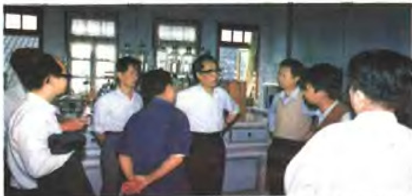
1985 年商业部副部长季榕(右四)视察龙海县配合饲料厂。右三为省粮食厅副厅长庄飞云。