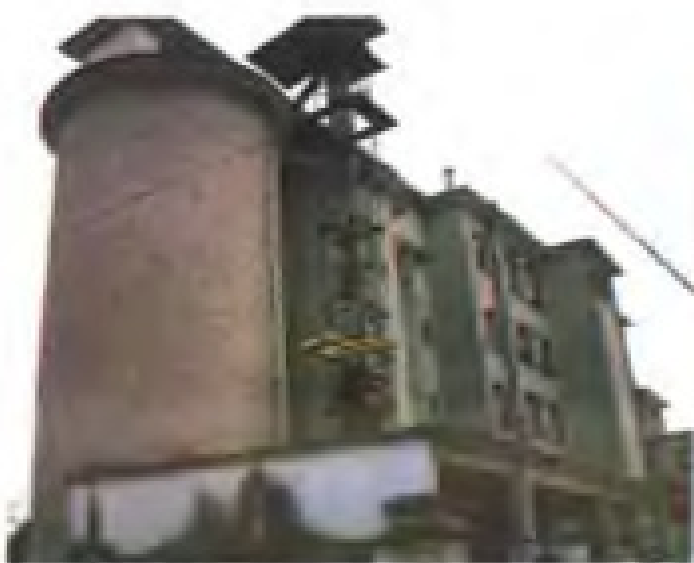
市面粉厂生产车间外貌。