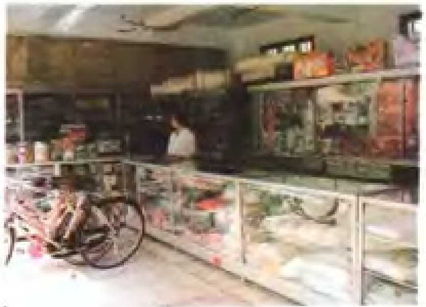
粮店扩大经营品种。