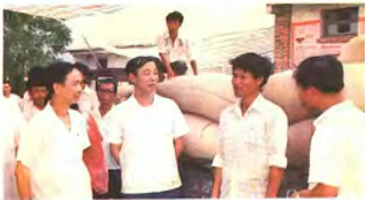
市、县粮食局领导深入粮食收购一线了解情况。