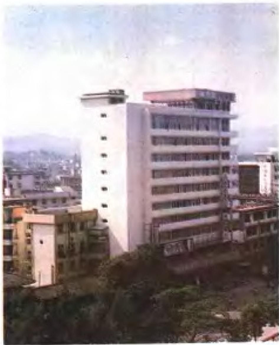
一九八八年竣工的粮食大楼雄姿。