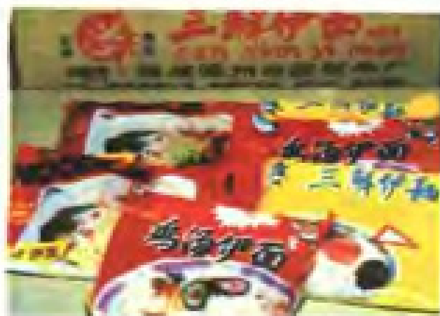
花色多样的快熟面制品。