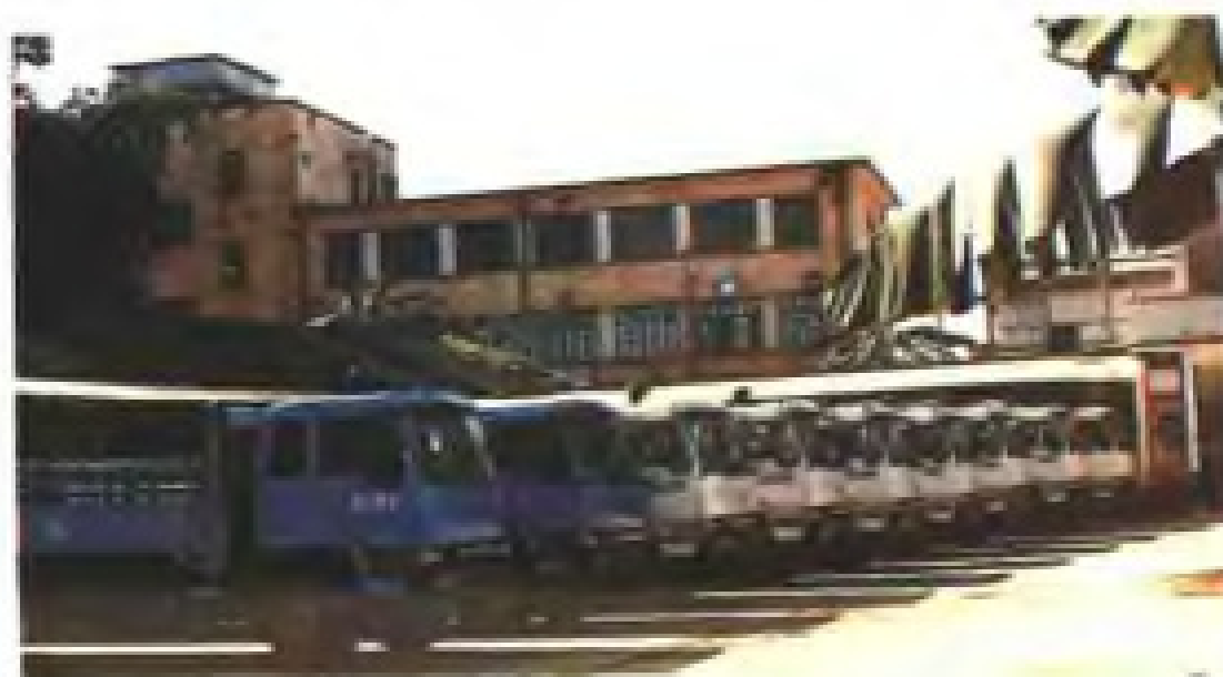
漳州粮食车队整装待发