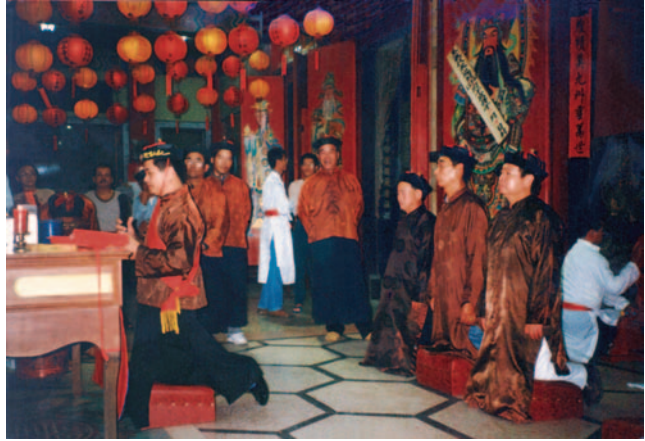
圖1-5 建醮時頭家鄉老祭拜

際的意義與甲相同，例如：澎南區的鐵線里下分上、中、下三柱，五德里下分頂寮、下寮、山邊三單位； 9 馬公市內東甲北極殿轄域分出頂、中、下三芸，火燒坪靈光殿下分路東、路西、下社3單位；單姓村的西嶼鄉二崁村之下分一房、二房、三房、四房。