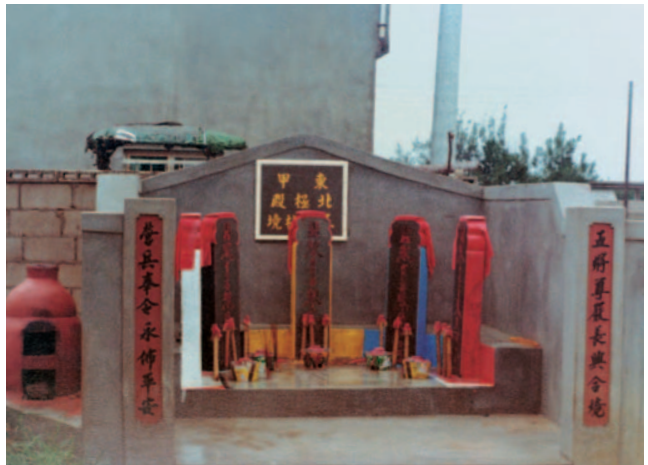
圖1-4 馬公東甲北極殿五營合奉

營頭做為村境超自然防線的功能是十分明顯的，昔時每個聚落的住屋鮮少有建於營頭的防衛線之外。除一般的五個營頭之外，有些村落因為某些地點被認為較「不乾淨」，居住或行經該處的居民常會遭逢意外，主神也會指示在該地點多安置一個營頭，這類增設的營頭常稱「小營」、「副營」、「偏營」等等。例如澎南區的烏炭在五營之外另設有四個偏營（小東營、小南營、小西營、小北營）、五德有七個偏營、嵵裡有一個附屬中營的小營； 2 湖西的菓葉則有內營及外營各六個，合計多達十二個； 3 西嶼的外垵更多達二十四個營頭，共有十個內營及十四個外營。 4