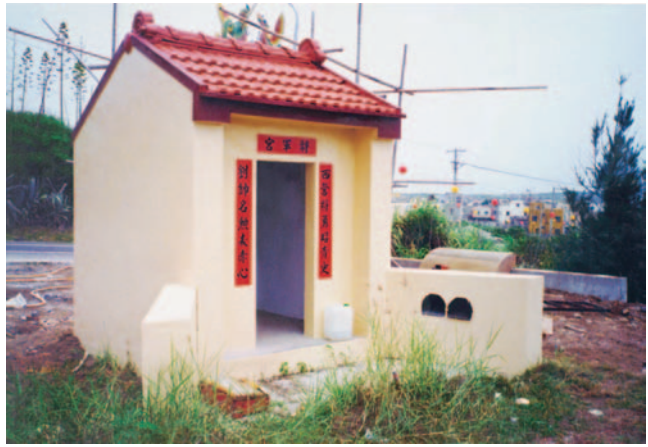
圖1-3 營頭設置之三

都以石碑具體化的顯示（圖1-2），近年逐漸有添蓋彷彿土地公廟的小祠，遮護代表營頭的石碑（圖1-3），更有進一步將石碑取消，代以水泥塑像。不論是碑、是祠、是像，每年法師鎮符時都須更換新的竹符（參見下一章）。