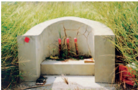
圖1-1 營頭設置之一

不過澎湖各村廟對境內居民最重要的設施是代表神兵部署的營頭，主神將轄下兵將駐紮於村境四周，以鎮壓邪魔鬼怪，保佑閭境平安，此即謂之「放營」。通常代替神明施行放營的是法師，無設法師之廟宇始由道士擔任，白沙鄉瓦硐村武聖廟及小赤村蝟鳴宮都由道士擔任放營工作。五個營頭分別豎立於村界上，最早的營頭形式可能只是書寫各營元帥名號的竹節，分別插在村莊的東、南、西、北、中央五個方位（圖1-1）。1970年代大多數的營頭