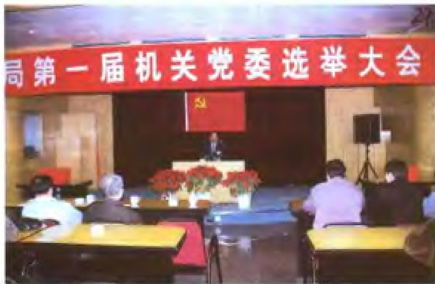
1999年，中共漳州市土地管理局党总支改设机关党委。图为第一届机关党委选举大会