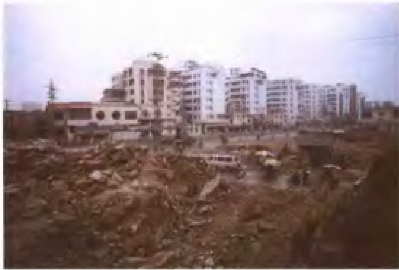
推进旧城改造 - 新村建设，实现集约用地。 图为漳州城区新华路改造工程