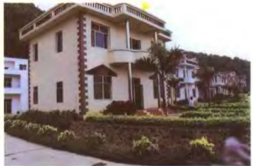
平和县坂仔镇西坑村新姿