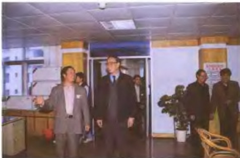
1998年12月21日，原国家土地管理局第一任局长王先进(左二)到漳州视察土地管理工作