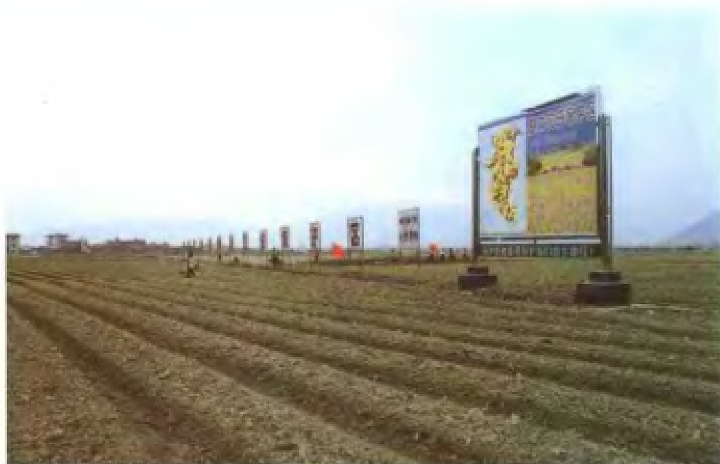
万亩基本农田保护区