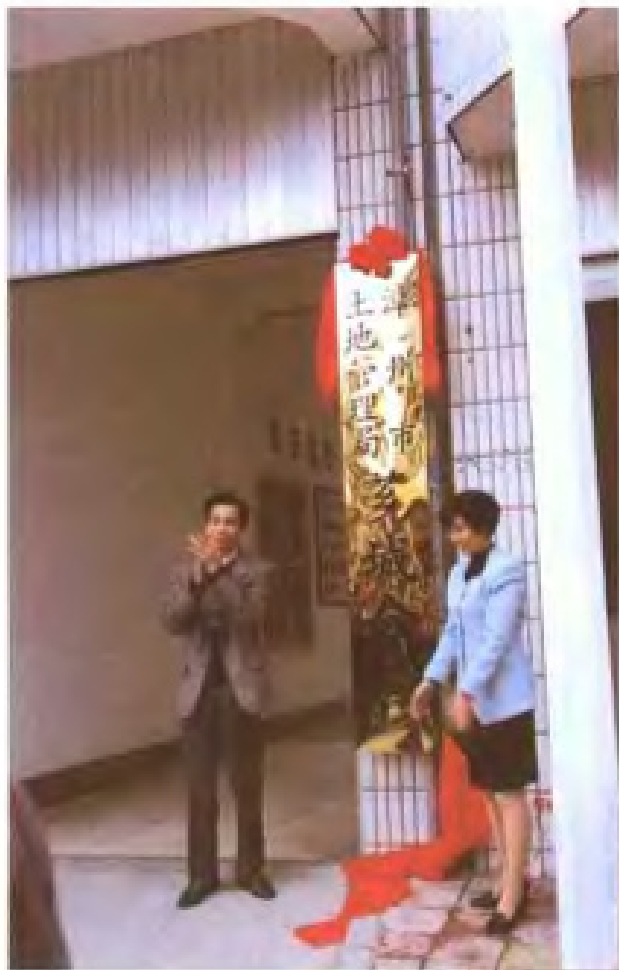
1997年芗城区、龙文区土地管理局改制为市土地管理局芗城、龙文分局。图为市政府副市长黄和东（左一）、中共芗城区委书记游婉玲为芗城分局揭牌