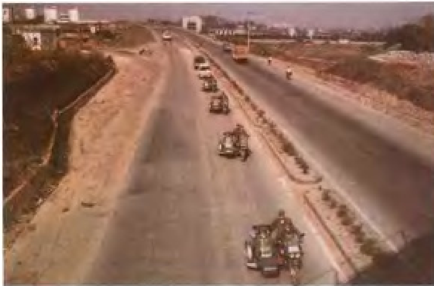
开展土地执法动态巡查