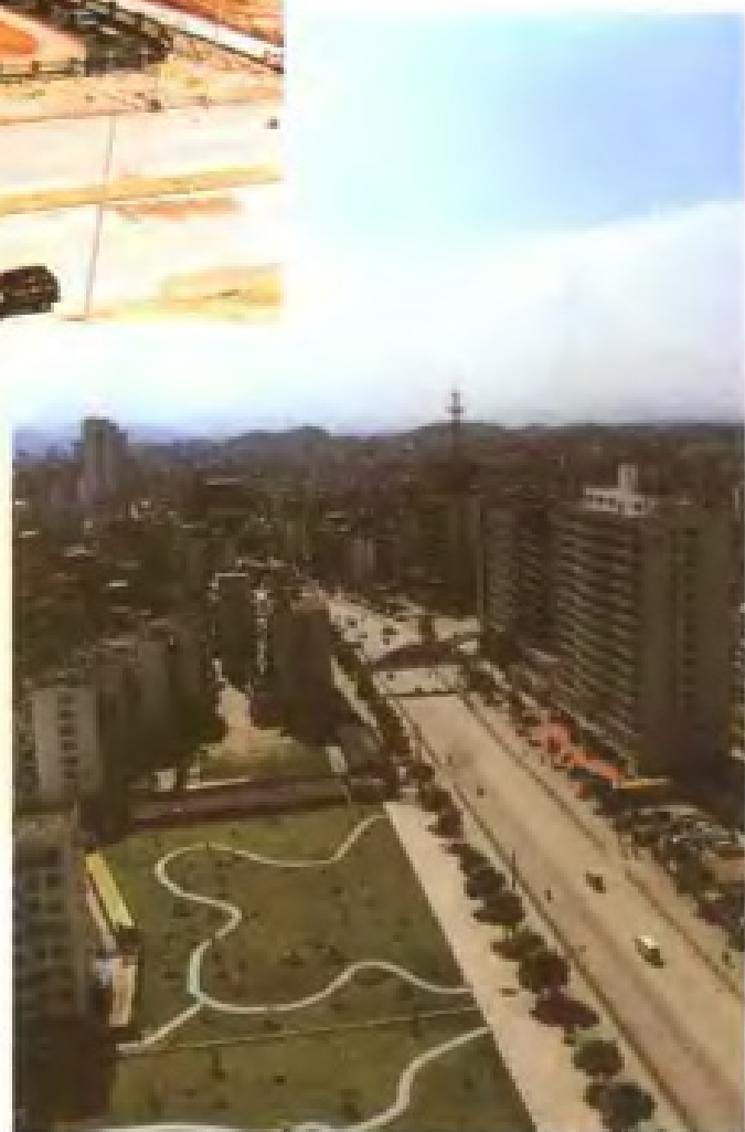
盘活土地存量,改闲置用地为城市公共绿地