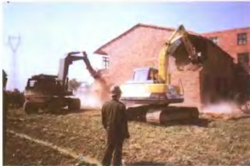
强制拆除违法建筑