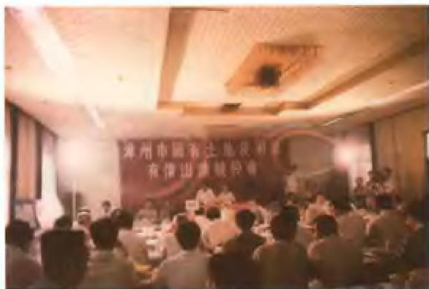
1992年6月，漳州市首次举办国有土地使用权有偿出让竞投会