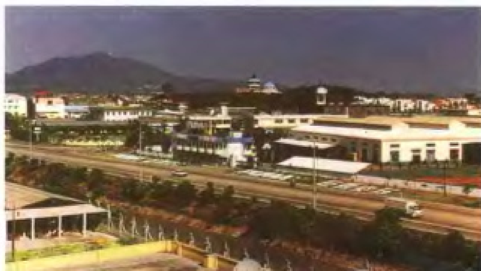
漳州市龙海角美工业开发区