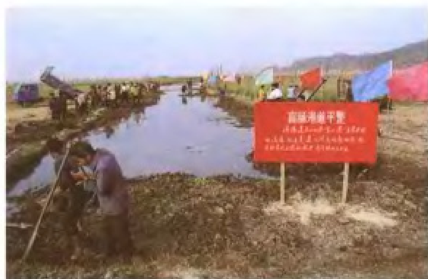
填平废弃河塘，扩大耕地面积