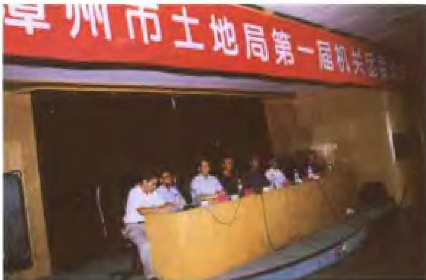
2000年，共青团漳州市土地管理局总支改设机关团委会。图为第一届机关团委选举大会