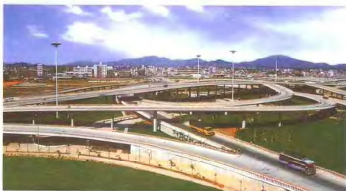
服务先行工程 - 图为漳州市东立交桥