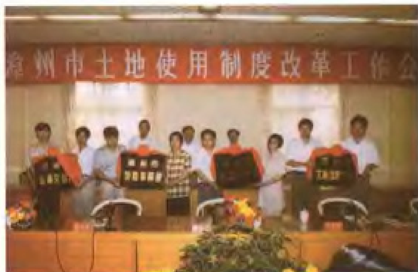
1995年，市政府召开土地使用制度改革工作会议，揭开漳州市国有土地使用权有偿、有限期、有流动使用制度改革序幕。图为市领导为新成立的地产市场中介服务机构授牌