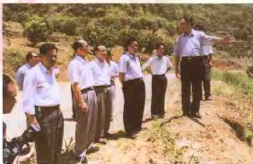
省委副书记林开钦(右三)在市领导陪同下视察市土地管理局创办的九龙坪山柚示范场