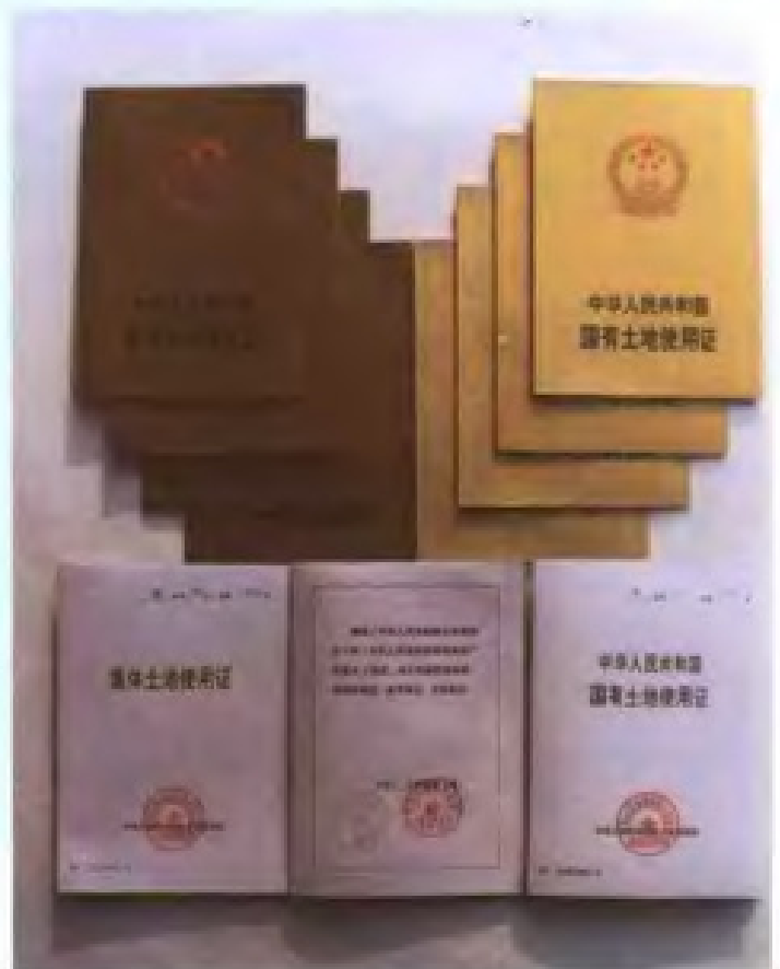
当前全国统一使用的《国有土地使用证》 和《集体土地使用证》式样