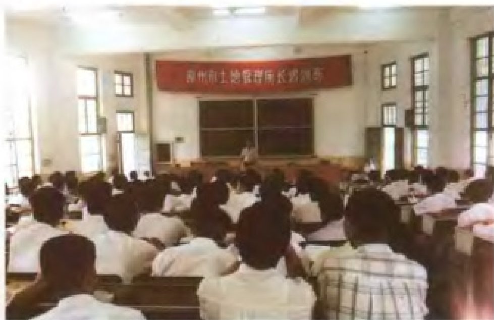
举办土地管理所所长培训班