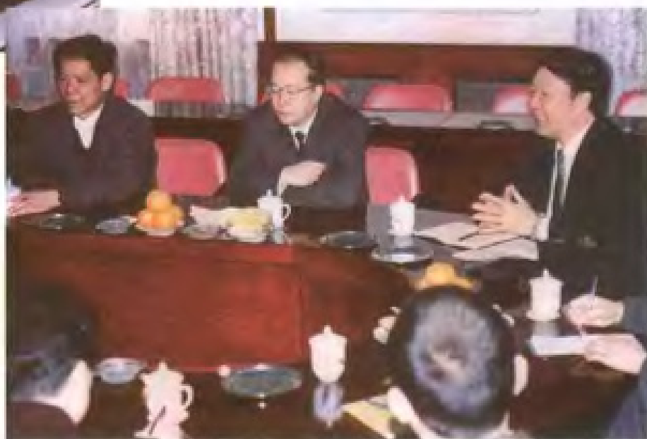
原国家土地管理局副局长李长江(右二)在漳州调研