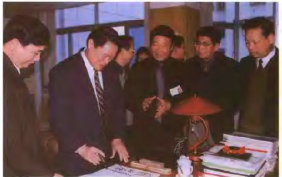
国土资源部周永康部长为市土地管理局挥笔题词