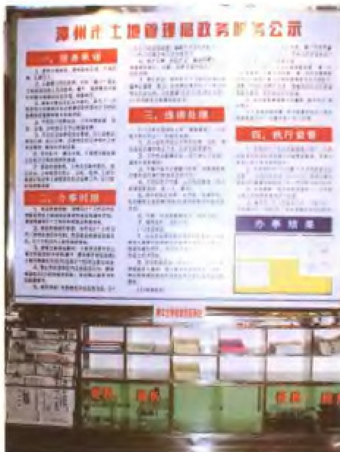
市土地管理局政务服务公示栏和便民服务台