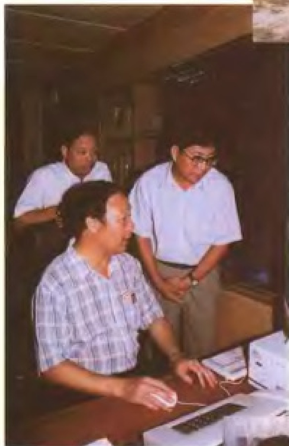
国土资源部副部长李元在市土地管理局检查工作