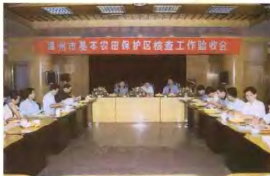
1999年漳州市基本农田保护区核查工作通过省级验收