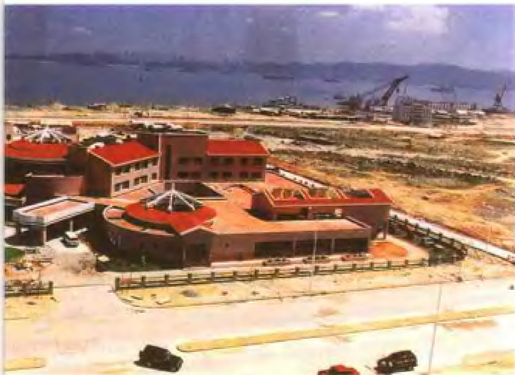
移山填海建造招商局中银漳州经济开发区