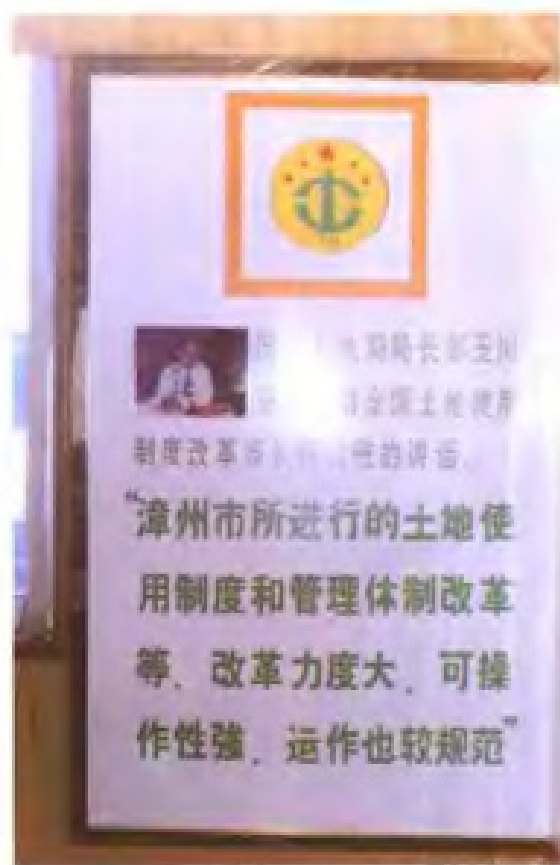
国家土地管理局局长邹玉川充分肯定漳州市土地管理改革工作取得显著成效