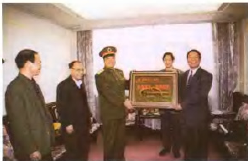
1999年2月3日驻闽某集团军首长 向市土地管理局赠送“热爱军队，情系 国防”牌匾