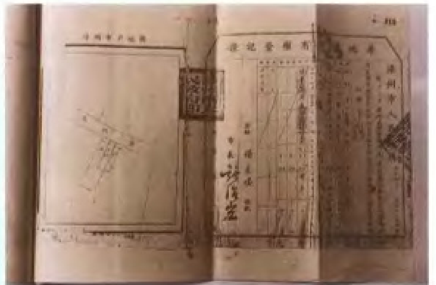
新中国成立初期《房地产权证》式样