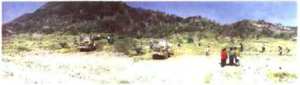
因地制宜，开垦荒山