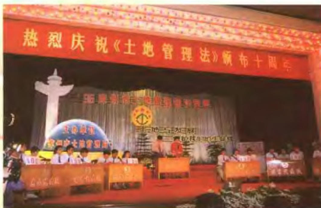
举办《土地管理法》知识竞赛