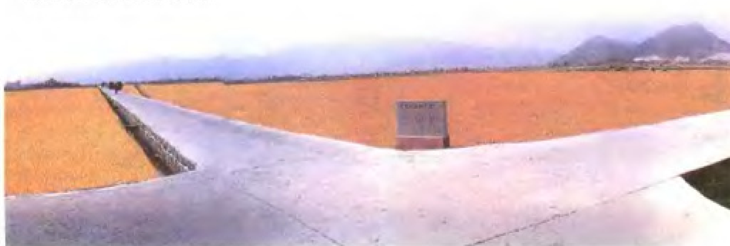
龙海市土地整理东园示范区