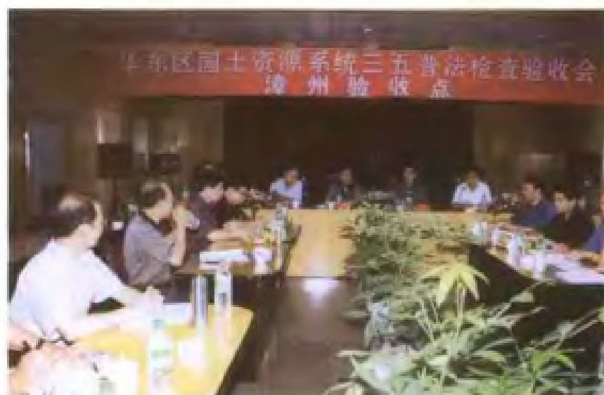
2000年8月，华东区“三五”普法验收组在漳检查验收