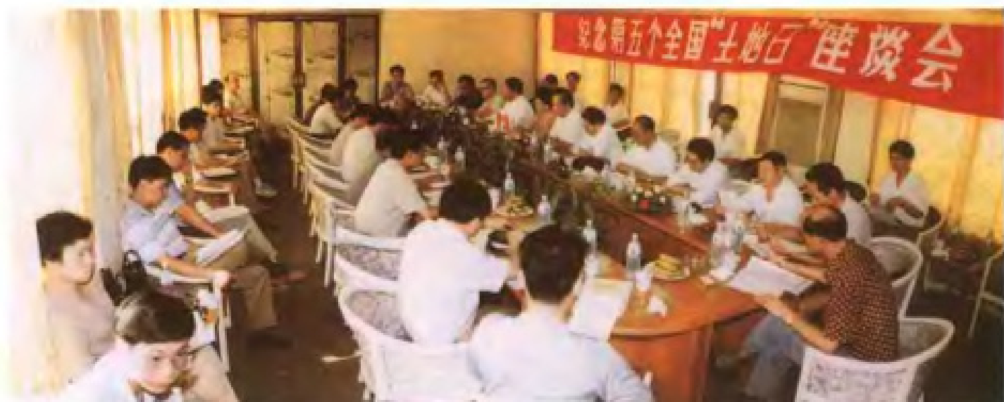
丰富多彩的6.25“土地日”活动。图为召开市五套班子领导座谈会