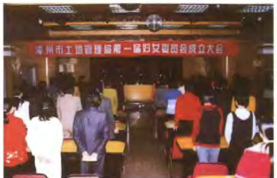
2000年，漳州市土地管理局第一届妇女委员会成立