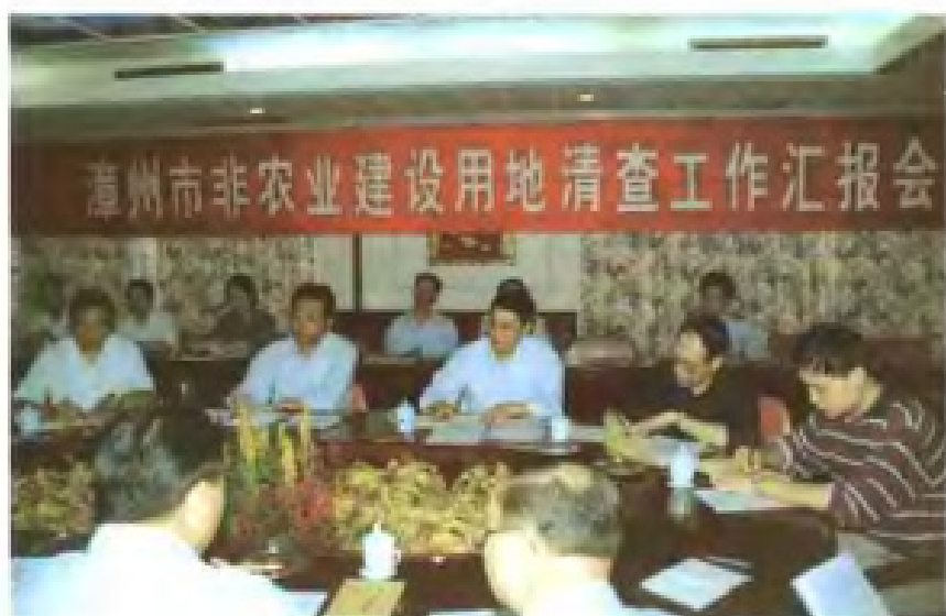
1997年，全市开展非农业建设用地大清查，图为当年10月，黄小晶副省长带领省检查团莅漳检查工作