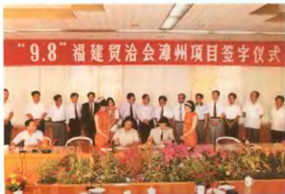
土地招商红红火火。图为市土地管理局庄永全局长出席“9.8”贸洽会投资项目签字仪式