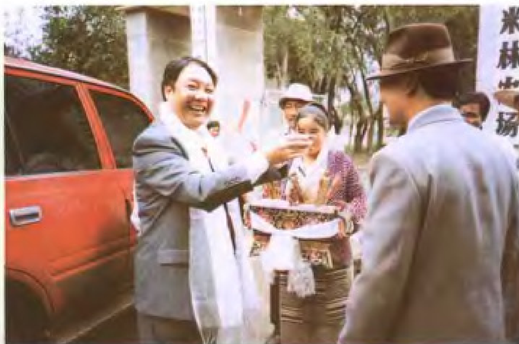
市土地管理局领导援藏表心意