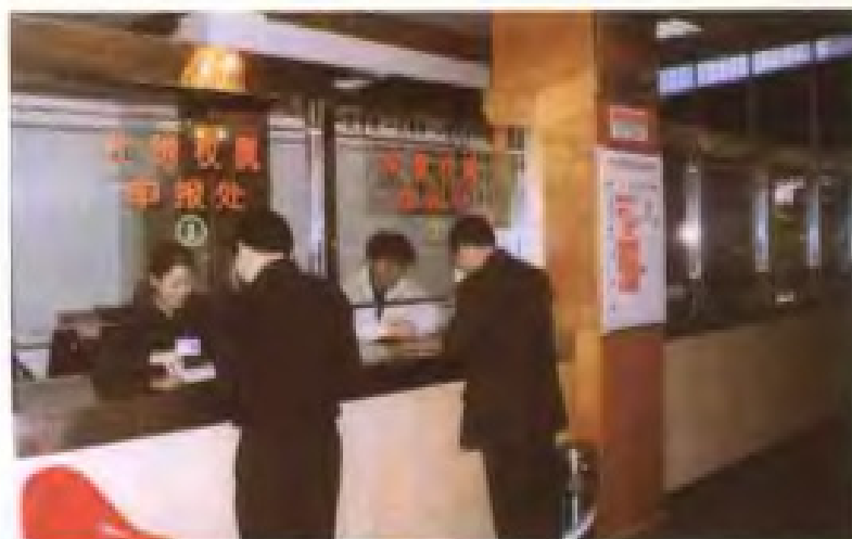
漳州市区土地登记处分别被共青团省委、市委评为“青年文明号”和“十佳青年文明号”。图为该处工作人员在办证“窗口”热情服务群众

1999年9月，漳州市直机关效能建设示范单位工作汇报会在市土地管理局召开，市委副书记马新岚（中）等领导出席会议