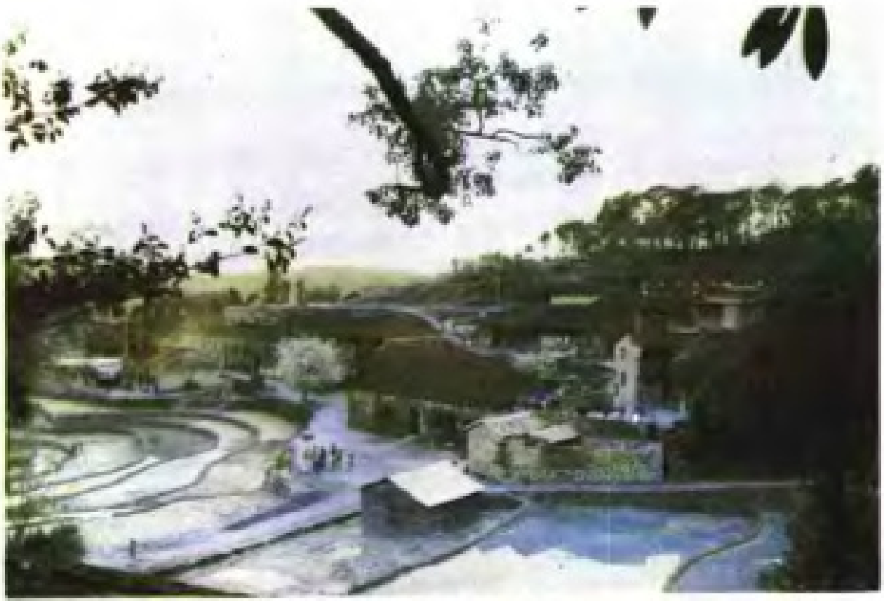
水门畲族乡茶岗村 (全国民族团结进步先进集体)