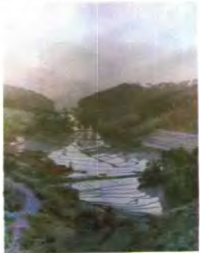
崇儒畲族乡上水村