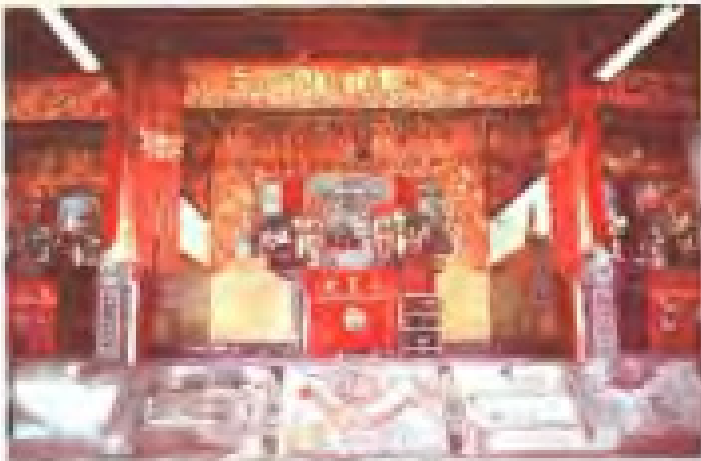
竹寮社保生宫 地址：安海镇 电话：2824723