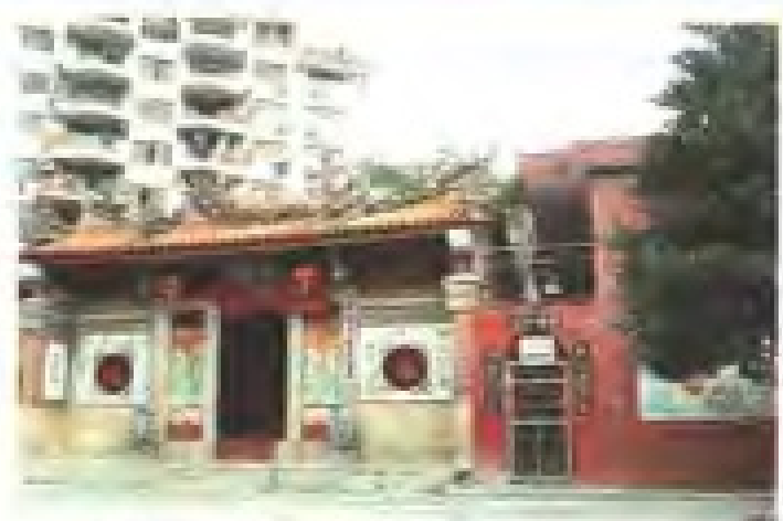
江仔尾路慈济宫 理事：蔡永春 电话：3862971