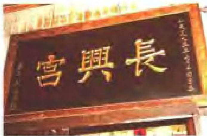
梧槽村保生宫 地址：梧槽前 电话：2810282