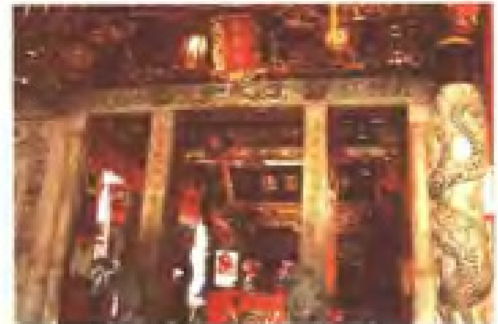
溪寮村保生宫 地址：溪寮后 电话：2810241