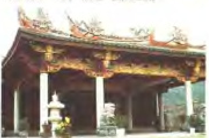
内厝港慈济宫 理事：陈礼忠 电话：3922524