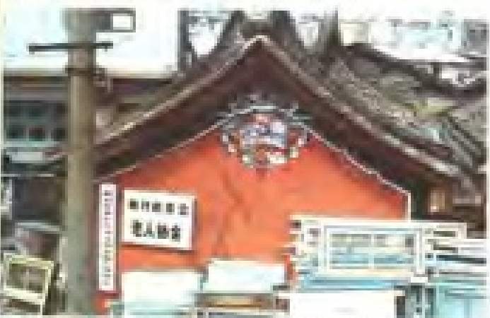
江仔尾路慈济宫 理事：蔡永春 电话：3862971