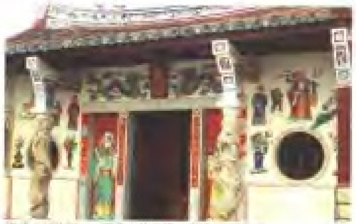
海山寺慈济宫 理事：林文堂 电话：550502