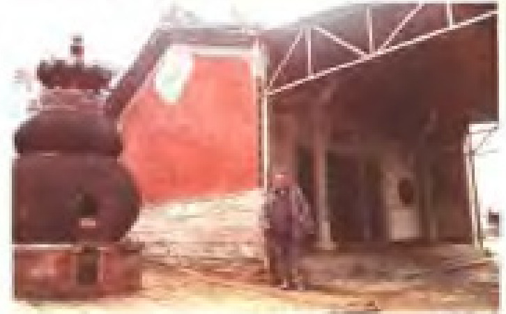
塘边村保生宫 地址：土金村 电话：2822241