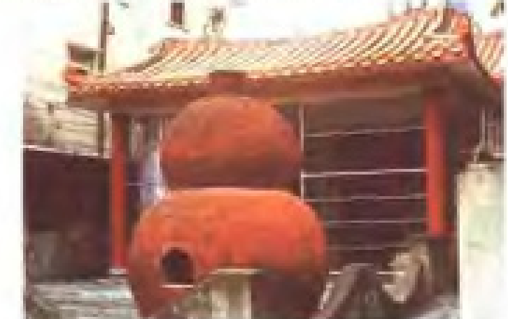
湖前村保生宫 地址：湖前水坑 电话：2810282