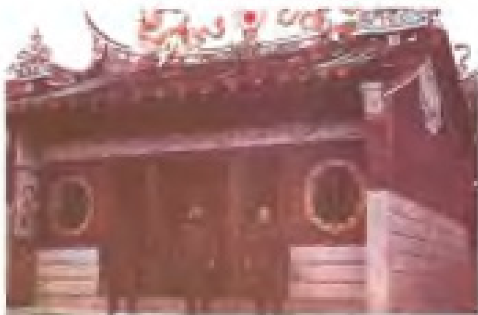
兜里村保生宫 地址：梧槽前 电话：2810282