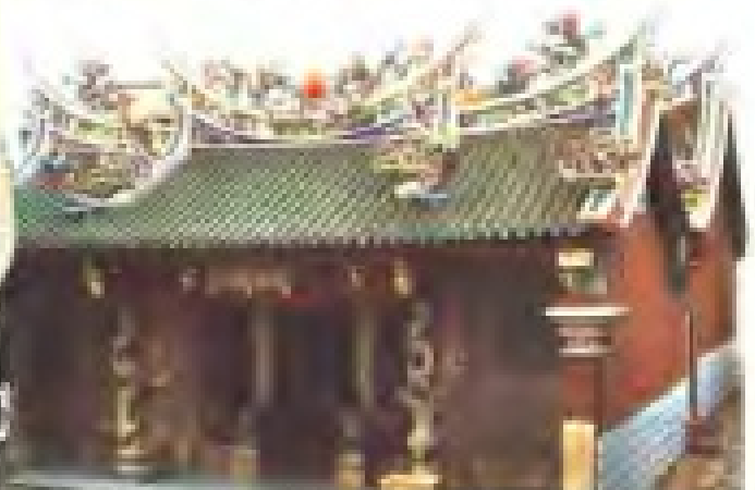
蔡厝村慈济宫 理事：陈定坤 蔡文峰 电话：5571529, 5571663