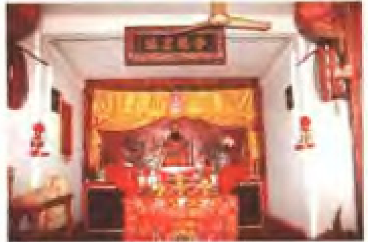
溪尾站保生宫 地址：古泉港 电话：2821803