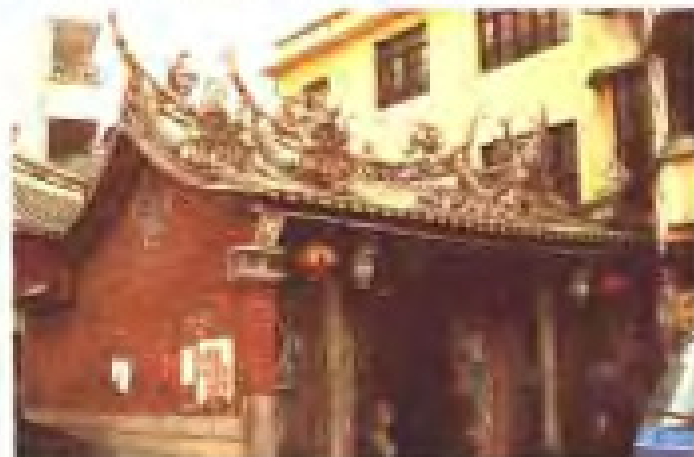
湖前村保生宫 地址：湖前水坑 电话：2810282