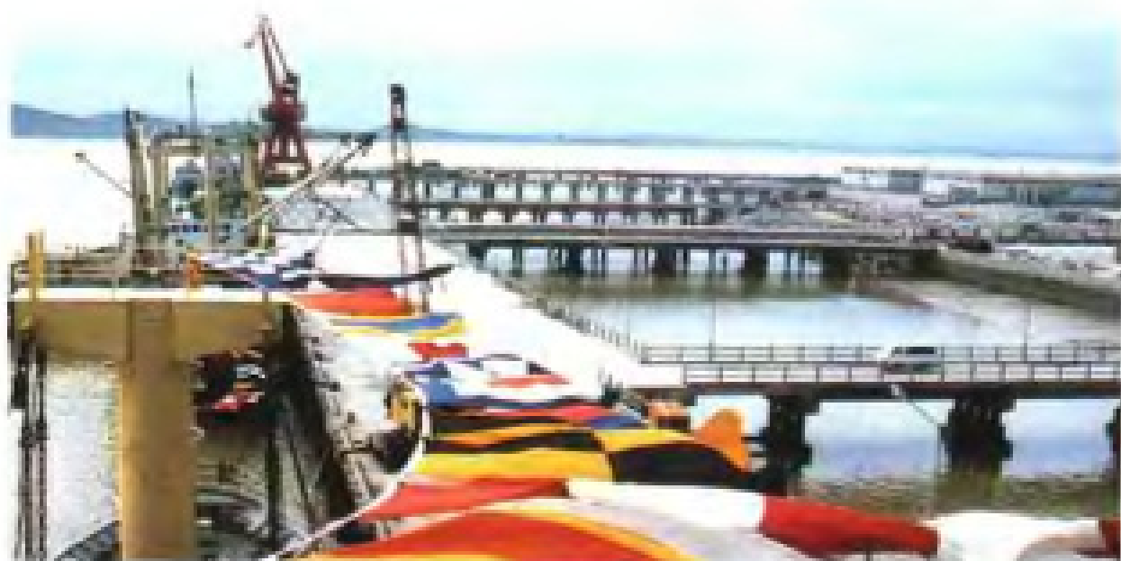
泉州后渚港3000吨级码头