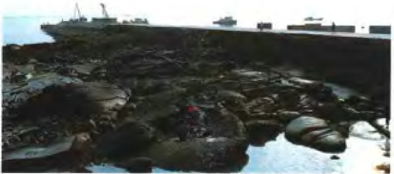
专门从事对台贸易的石狮梅林港