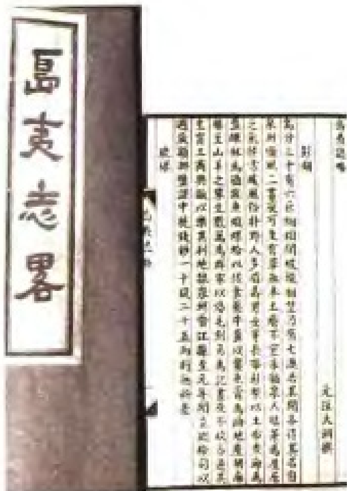
元汪大渊《島夷志略》书照