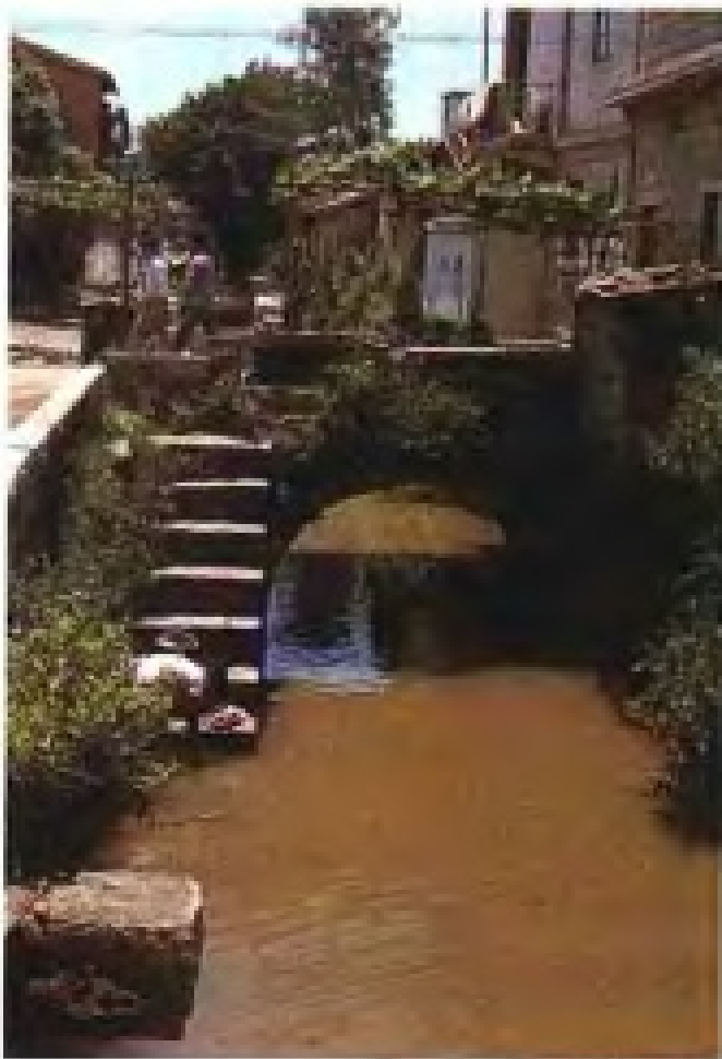
宋代泉州市 舶司水关遗址