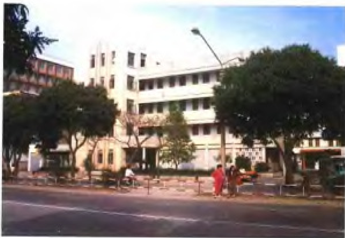
福建省泉州市对外贸易公司大楼