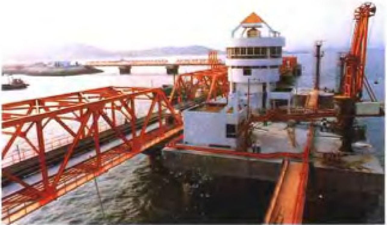
泉州肖厝港10万吨级码头