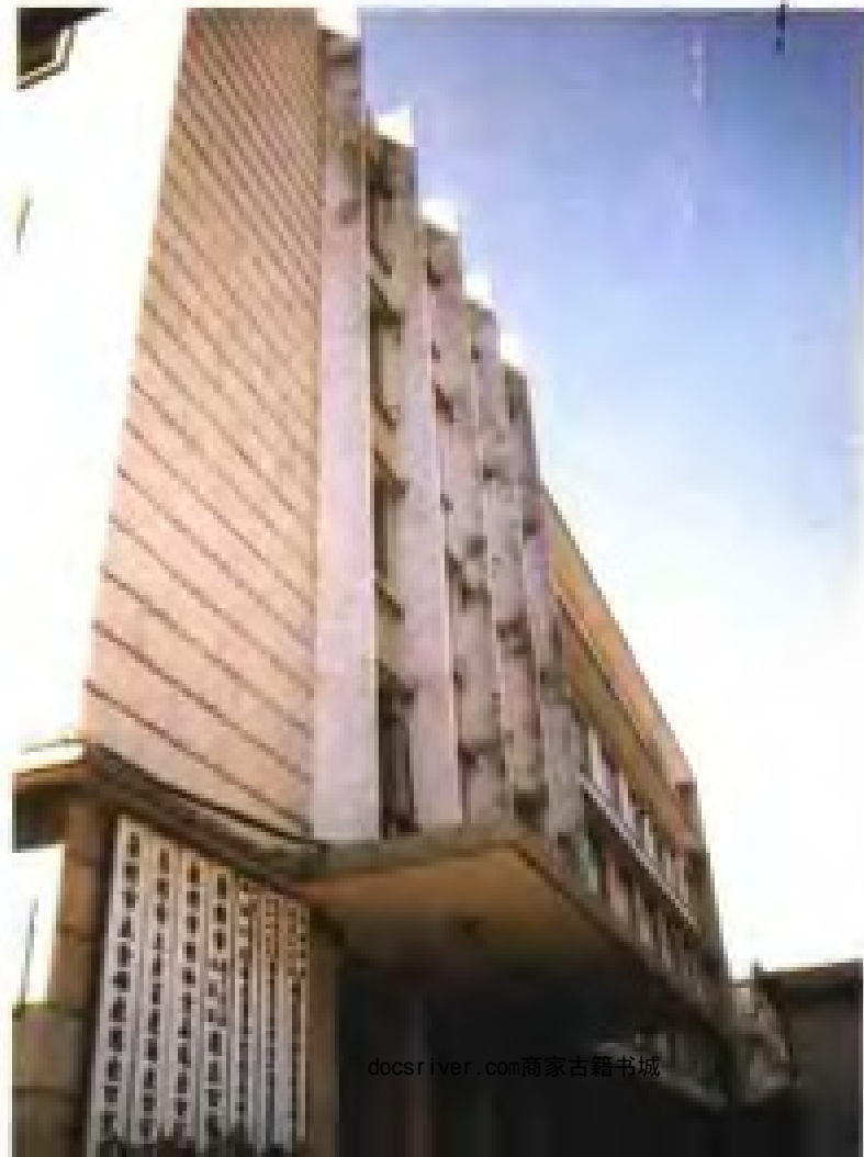
泉州市各专业进出口公司大楼