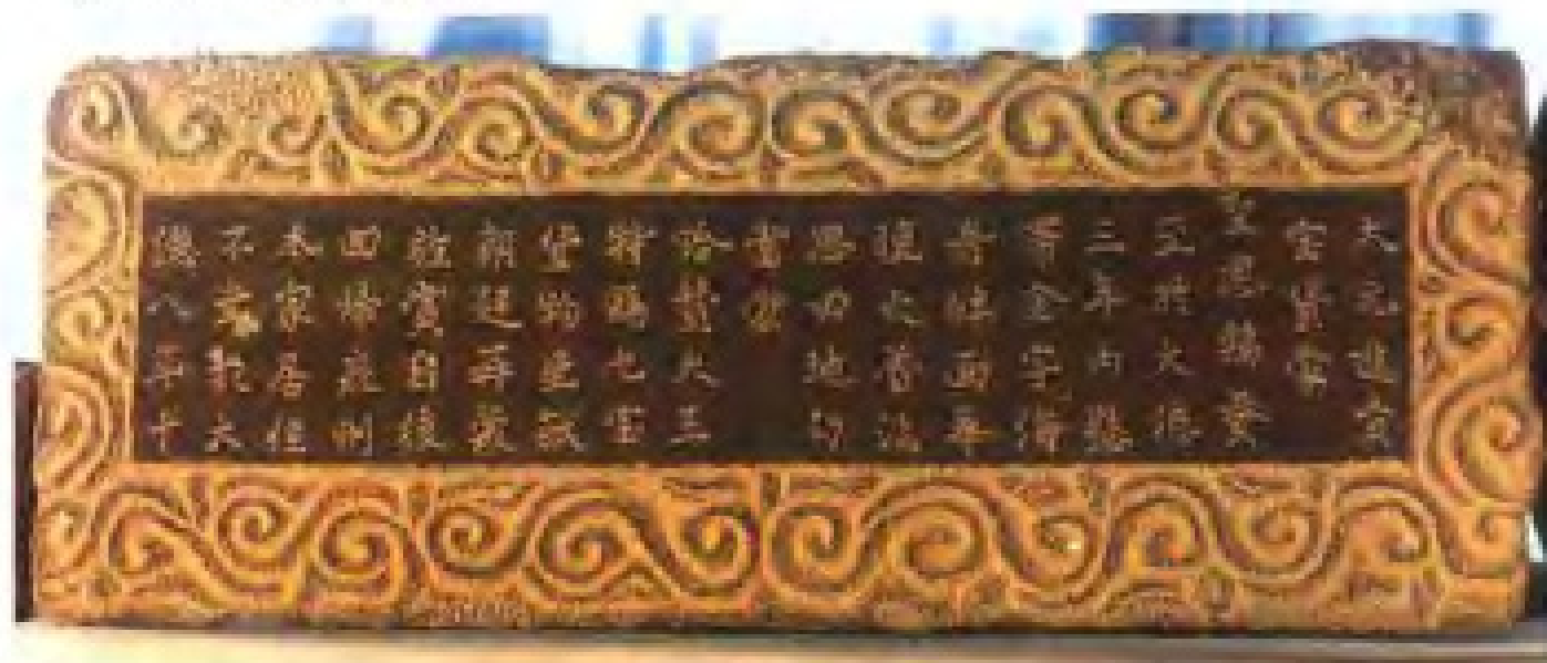
元大德八年泉人奉使波斯碑记