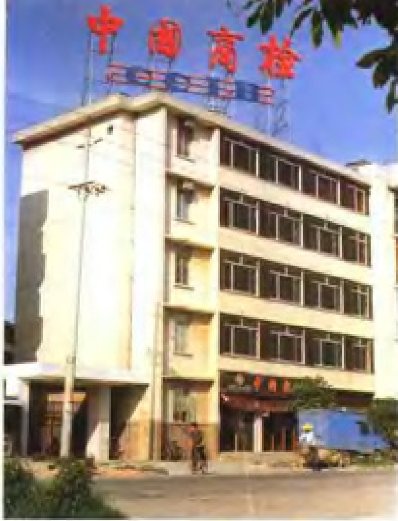
中华人民共和国泉州进出口商品检验局大楼