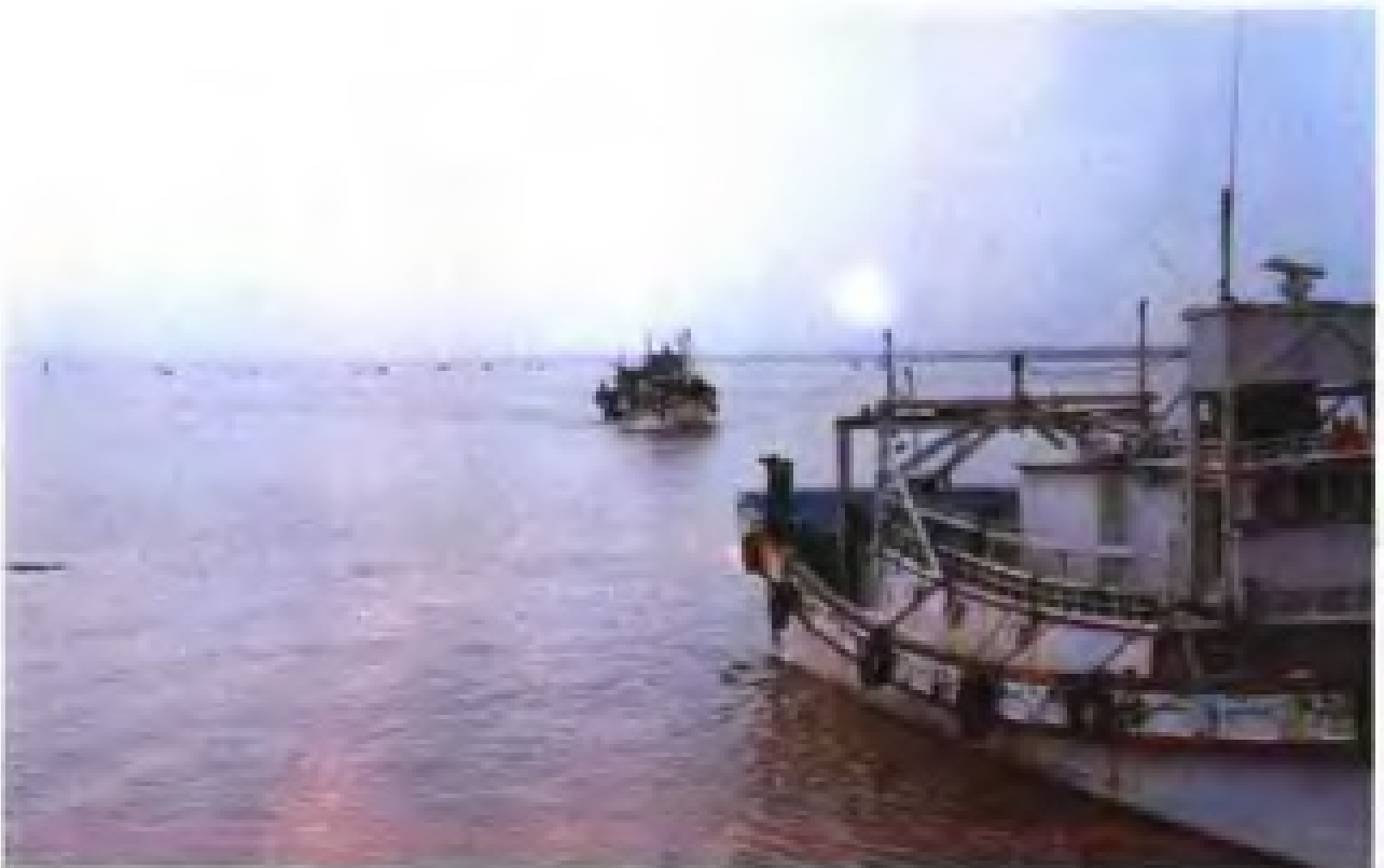
对台贸易的泉州埭埔港