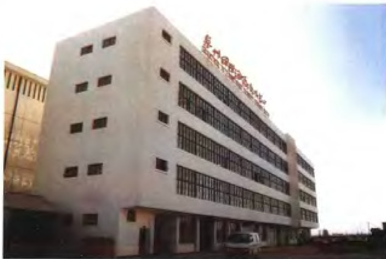
中国泉州国际经济合作公司和泉州国际海员培训中心大楼