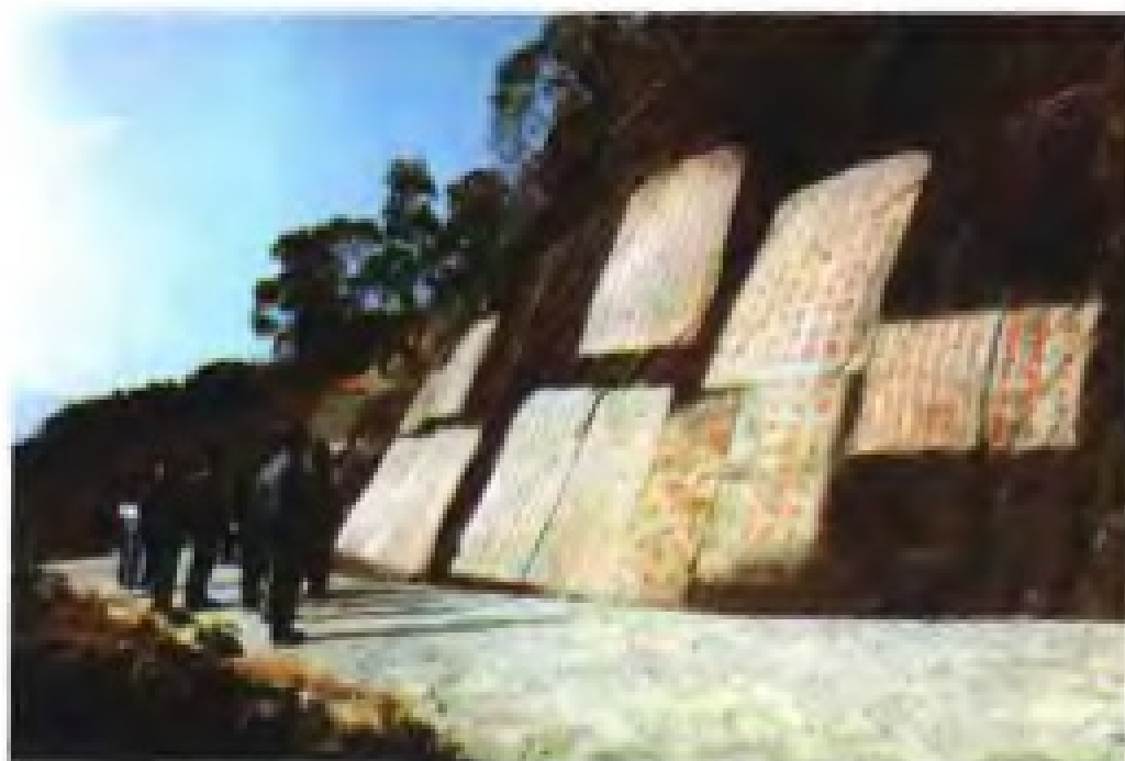
宋代泉州太守和市舶司官员对外商举行祈风仪式的九日山遗址