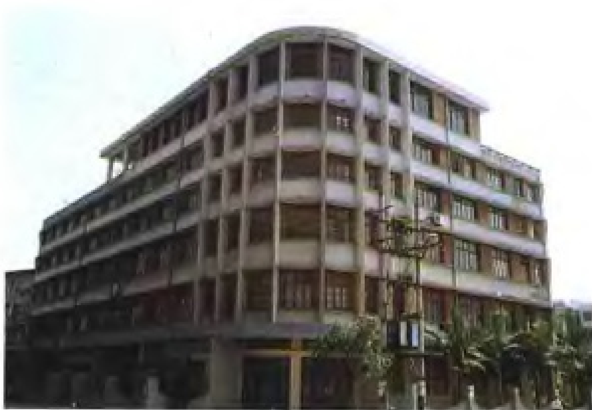
泉州市对外经济贸易委员会办公大楼