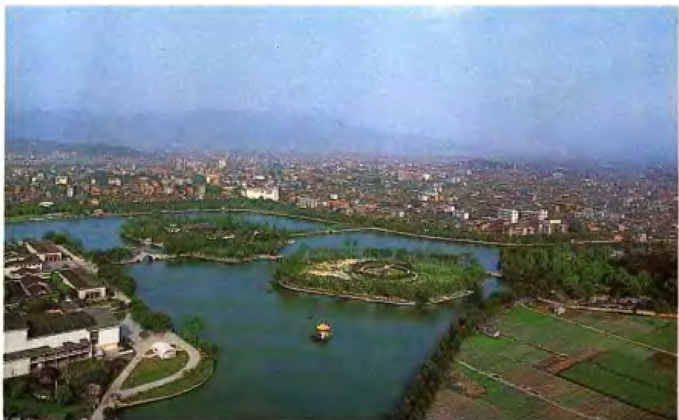
· 之四 · 西湖公园全景。