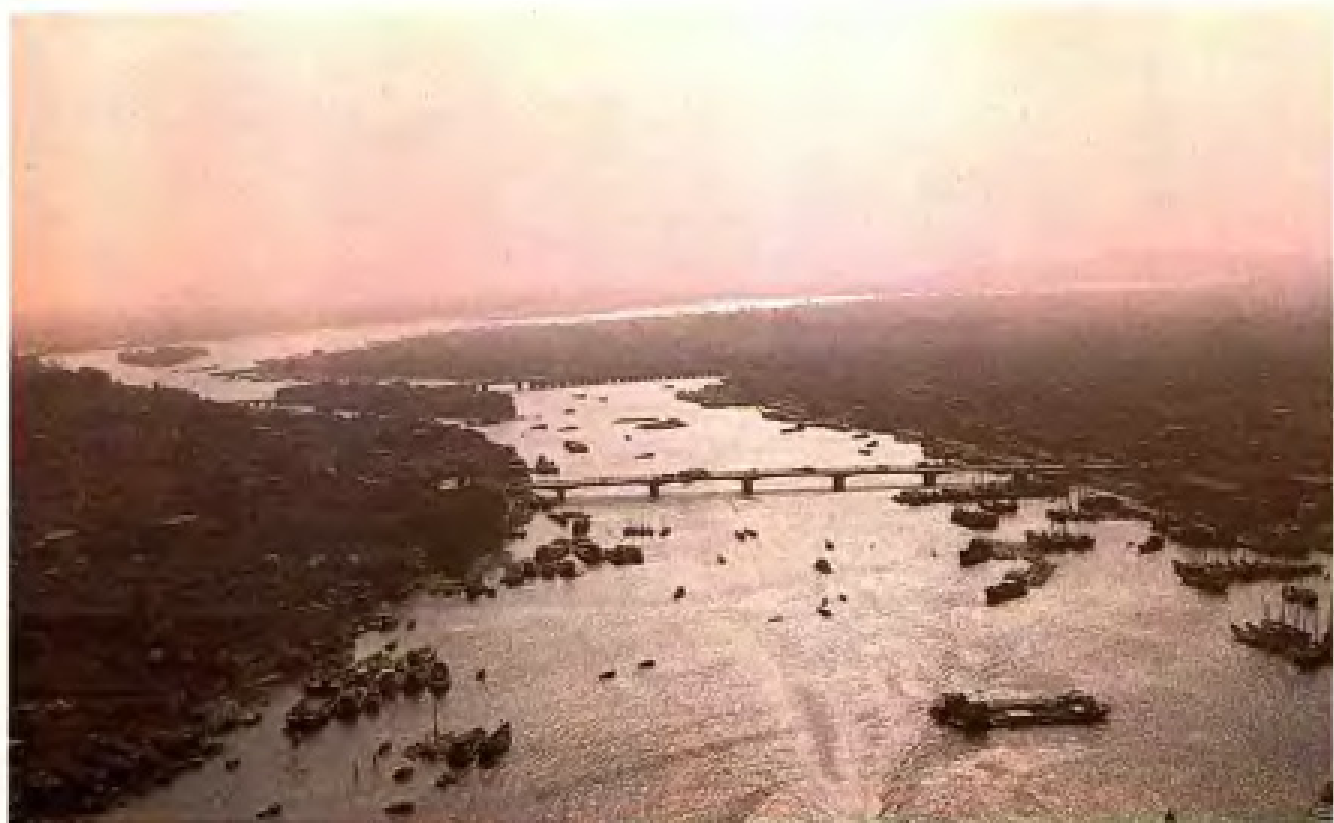
· 之三 · 台江晚霞景色。近处为闽江大桥，远处为解放大桥。