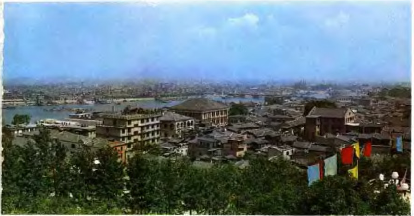
二一路，左为解放大桥，右为阅江大桥。