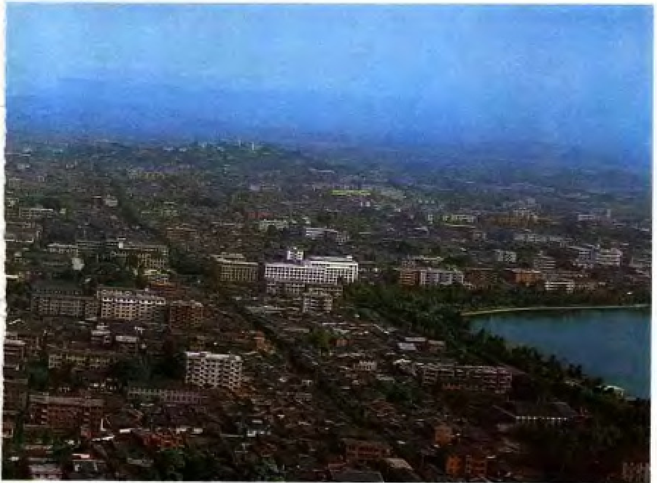
辟路、八一七路，远景为五虎山。