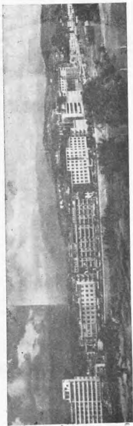
龙岩龙川中路，位于本市区中部，是一九八一年新建成的街道。