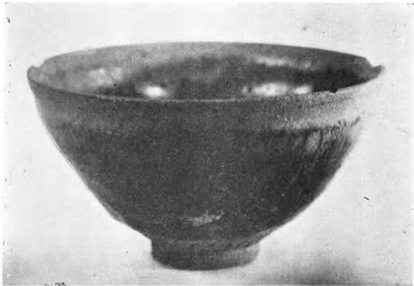
驰名中外的宋瓷——“建盏”。