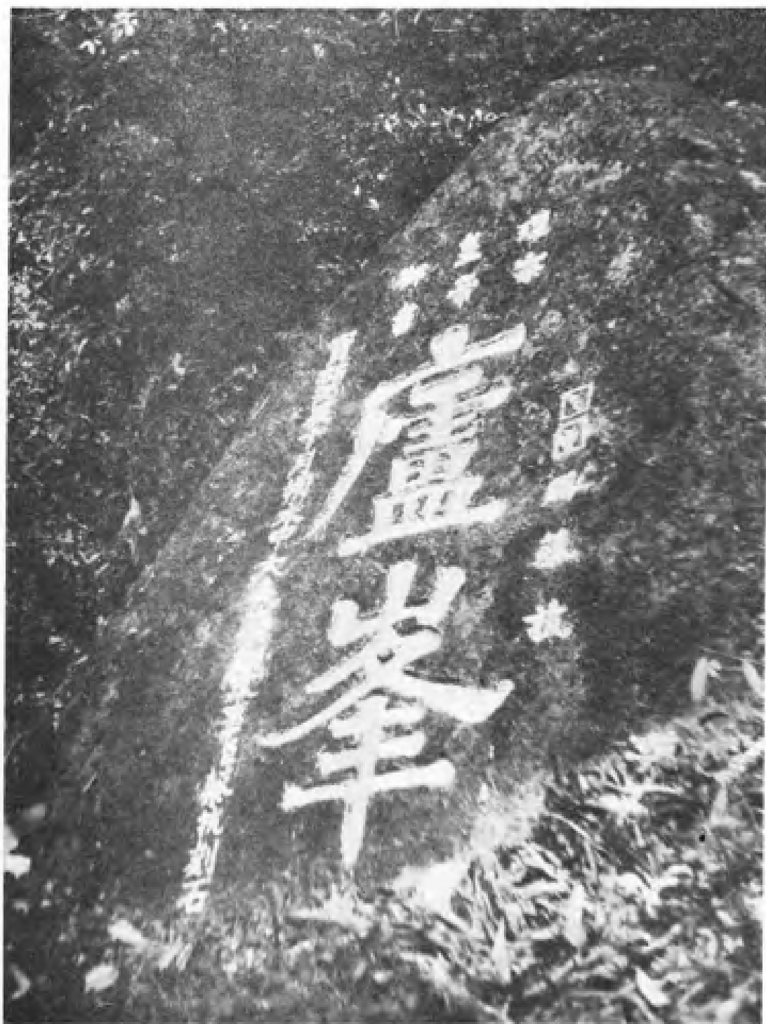
庐峰御书摩崖石刻