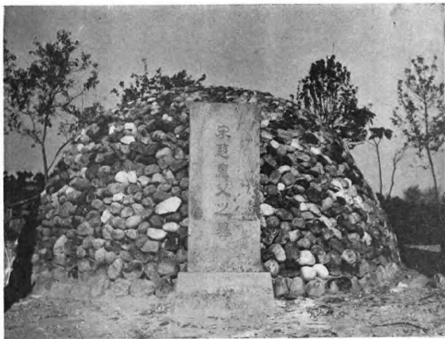
伟大的法医学家宋慈之墓。