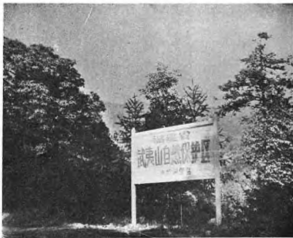
福建省武夷山自然保护区大竹岚管区。