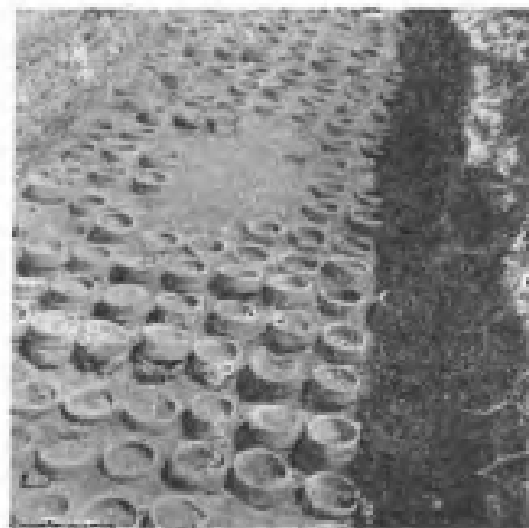
发掘出来的宋窑遗址中的部分“碗套”。