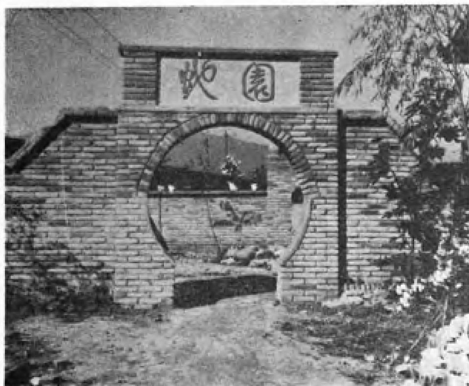
建阳县蛇伤防治研究所的蛇园。