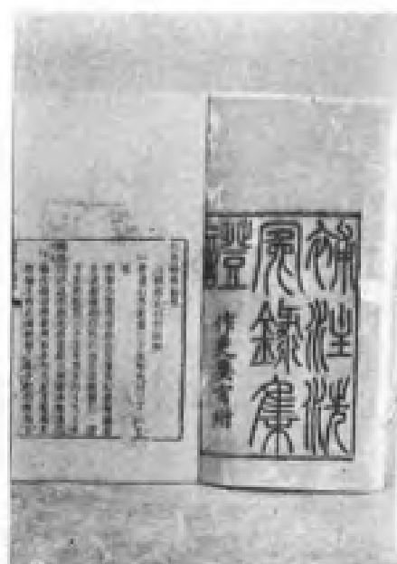
宋慈的法医学著作——《洗冤录》版本之一，现存建阳县文化馆。