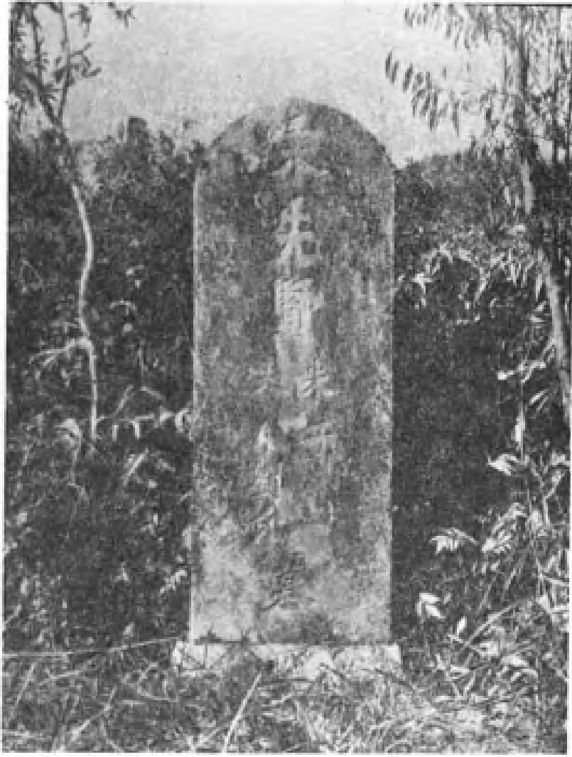
朱熹墓前的一对大石柱。