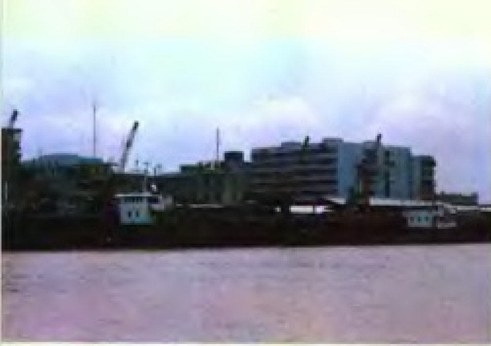
泉州市鲤城区交通局建设的后渚渡口码头