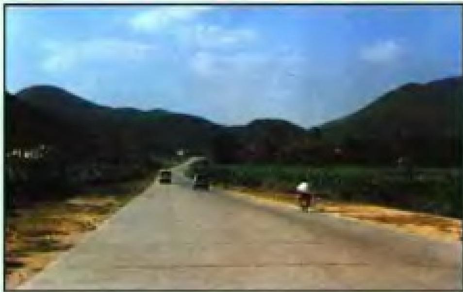
鲤城区河市乡村大道