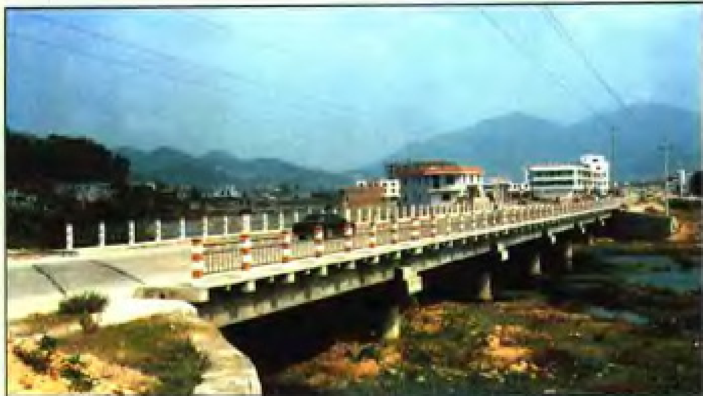
河市 2 号大桥