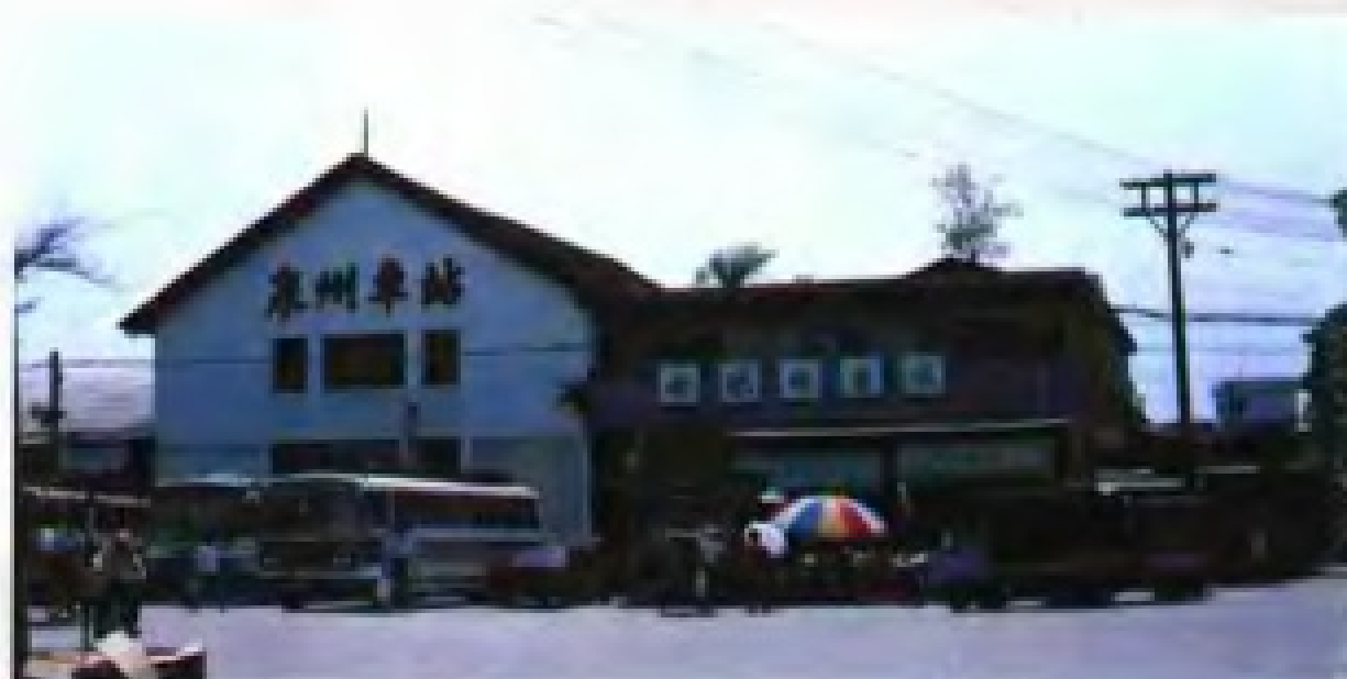
泉州汽车站车场一角