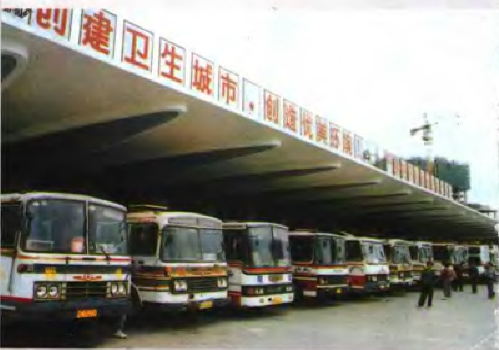
泉州新汽车站车场