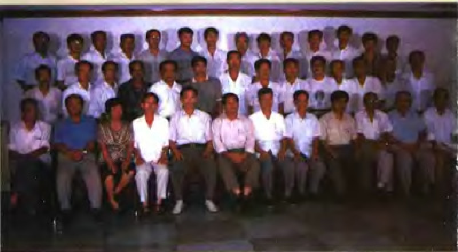
《鲤城交通志》评审会全体人员