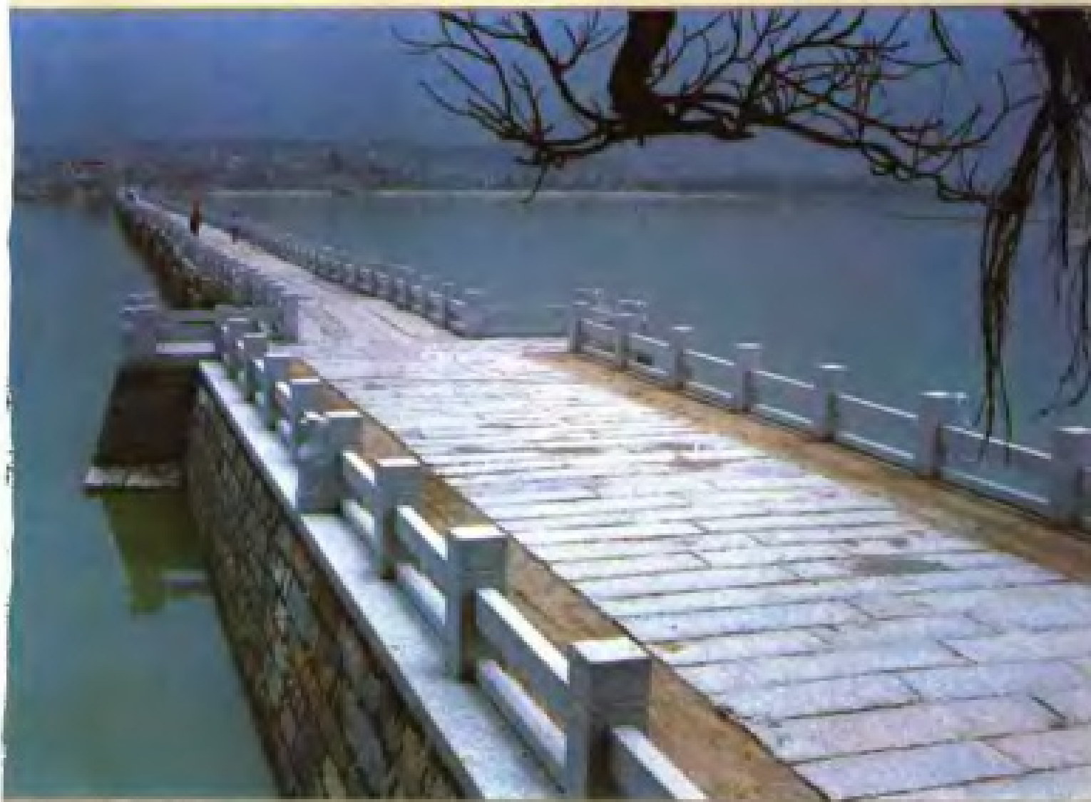
宋代桥梁—万安桥（洛阳桥）