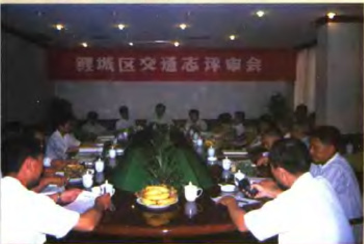
《鲤城交通志》评审会