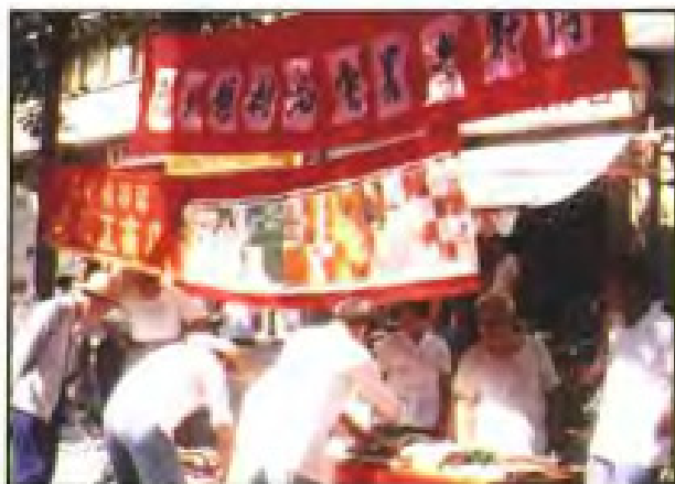
◀ 宣传普及医药知识