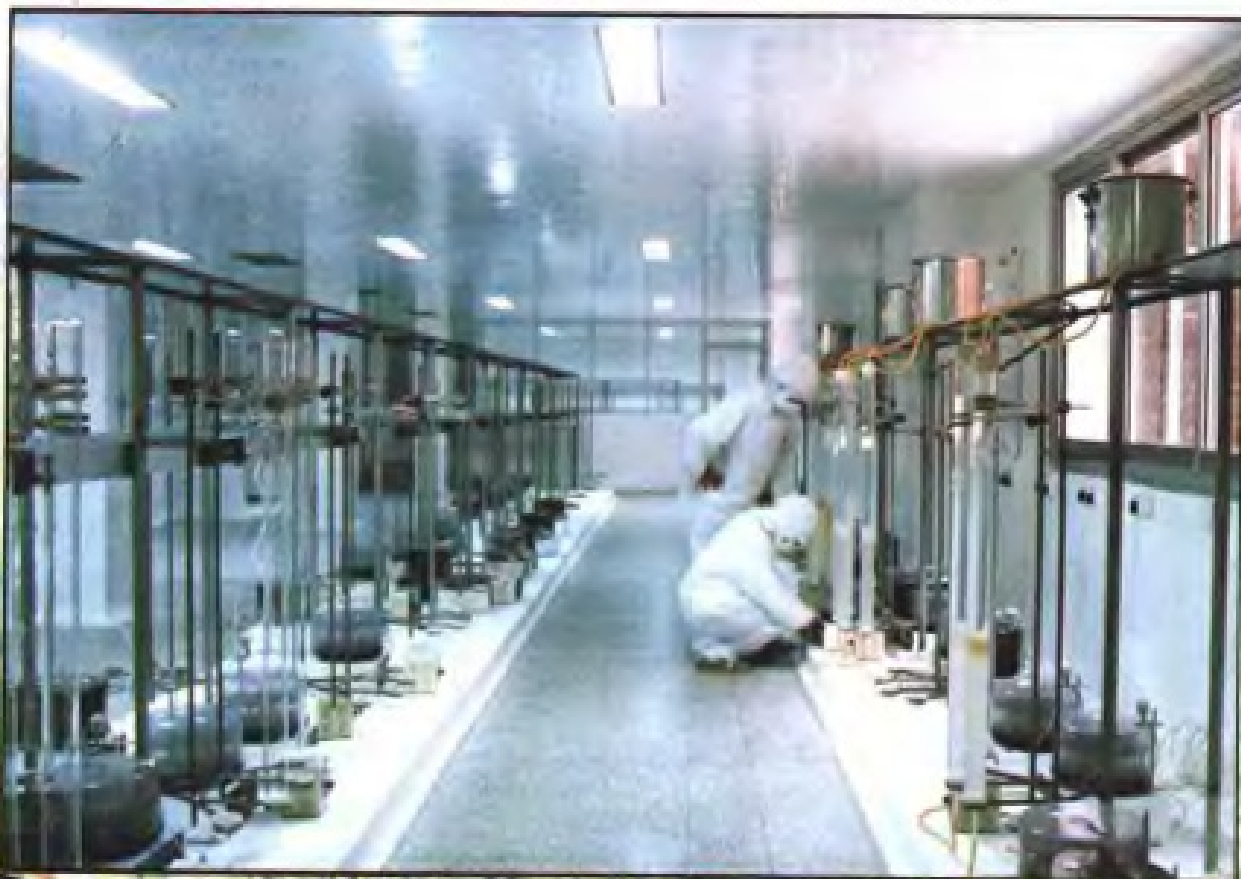
▼ 生产蕲蛇酶(三明制药厂)