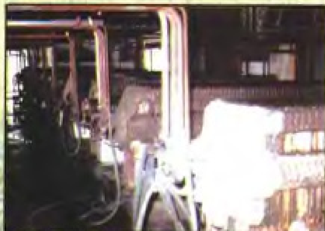
◀ 板框过滤(福州抗生素总厂)