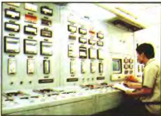
◀ 用电子计算机管理生产(三明制药厂)