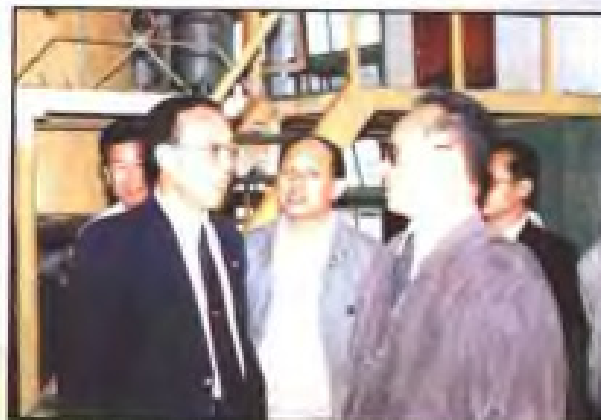
▲ 1991年12月24日，全国政协副主席谷牧（前排右一）视察厦门中药厂。