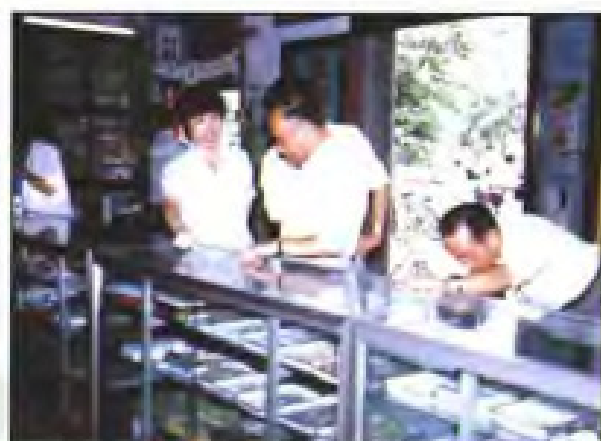
▲ 1992年9月23日，国家医药管理局副局长金同珍(右二)观看三明市医药公司网点柜台。