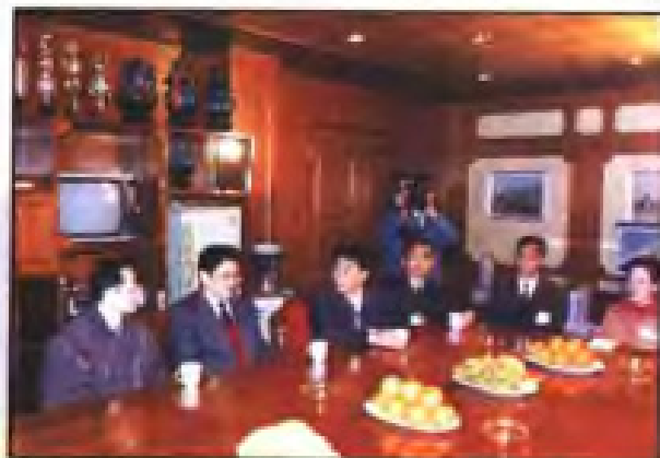
▲ 1995年2月，国务委员李铁映（左二）与漳州片仔癀集团公司职工座谈。