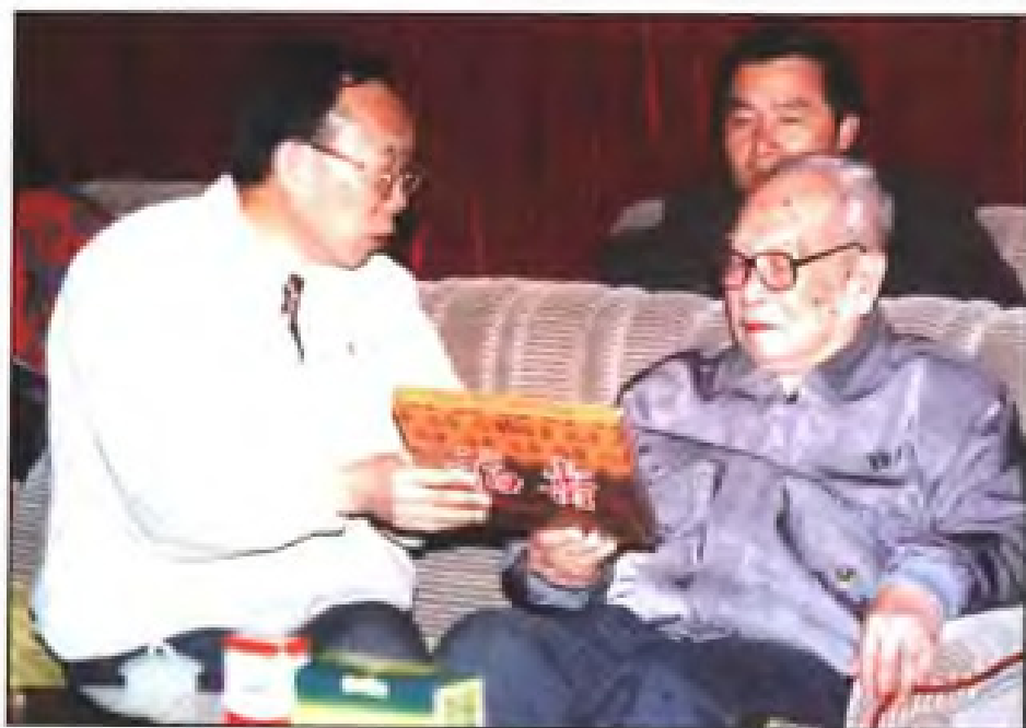
◀ 1994年1月18日，原全国人大常委会副委员长叶飞（前排右一）听取厦门中药厂领导介绍新产品。