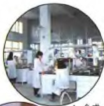
▲ 合成、半合成药物研究室