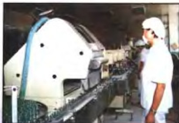
▲ 分装海珠喘息定片