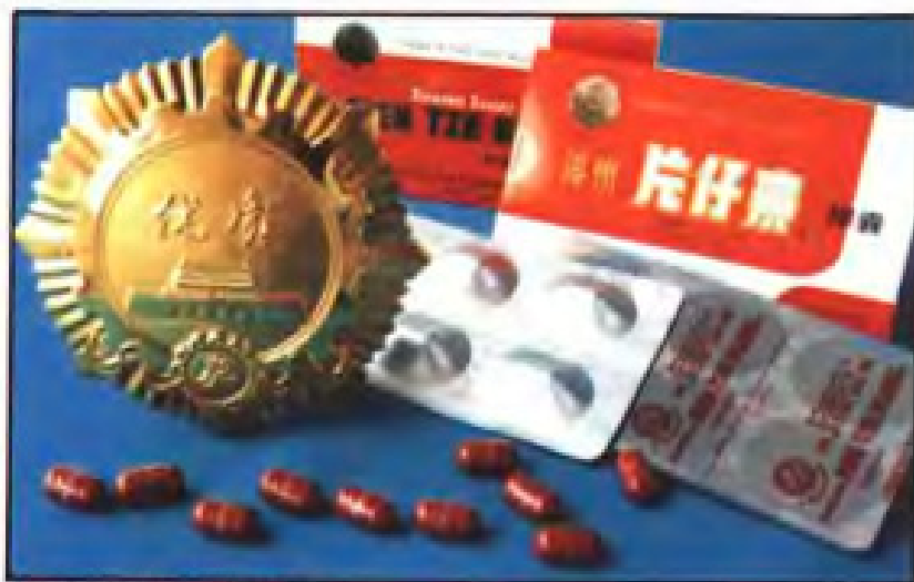
▲ 国家质量金奖产品