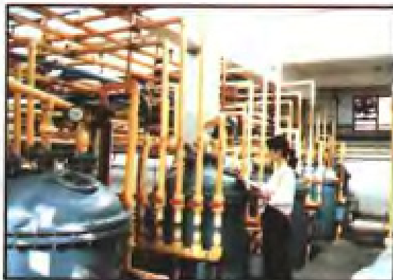
◀ 金霉素发酵(福州抗生素总厂)