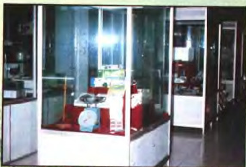
▲ 地产医疗器械产品