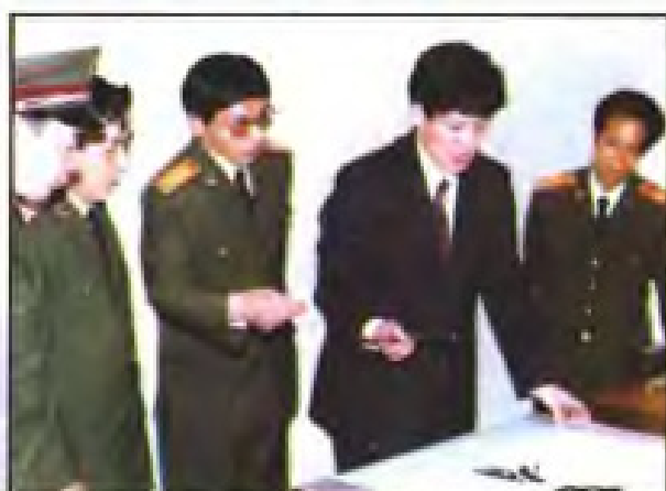
▲ 1995年4月，国家医药管理局局长郑筱英(右二)为闽清药厂题词：“志在有为”。