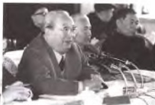
民盟中央副主席费孝 通在研讨会上讲话