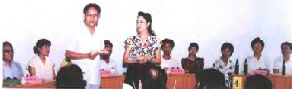
1991年6月，民进福建省委举行统战理论和会史知识竞赛