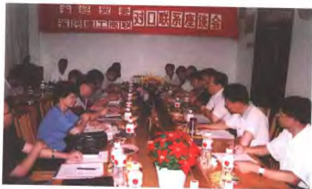
民建福建省委、省工商联与省外经贸委举行对口联系座谈会