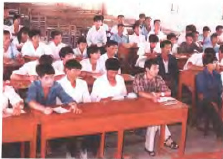
1985年6月，九三学社福建省委在河西 举办食用菌栽培技术培训班