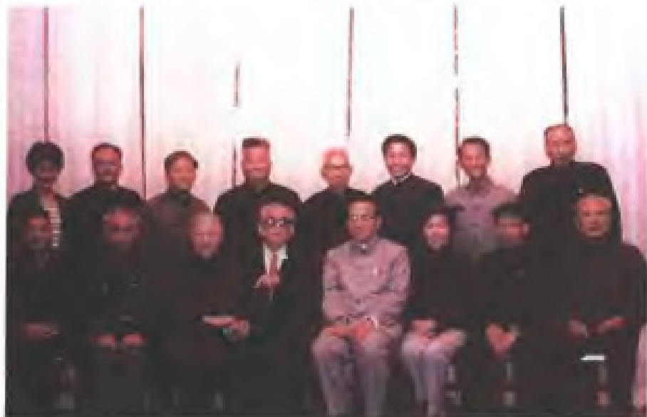
1983年12月，原农工民主党中央副主席、全国人大常委会副委员长周谷城（右五）来福建考察时，会见农工民主党福建省委会部分常委