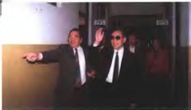
1998年11月，全国政协副主席、致公党中央主席董寅初（前右）视察致公党福建省委机关