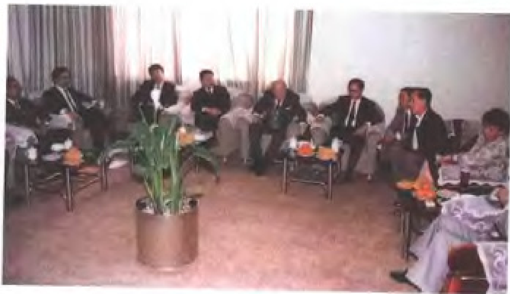
民建福建省委负责人会见台湾工商界人士