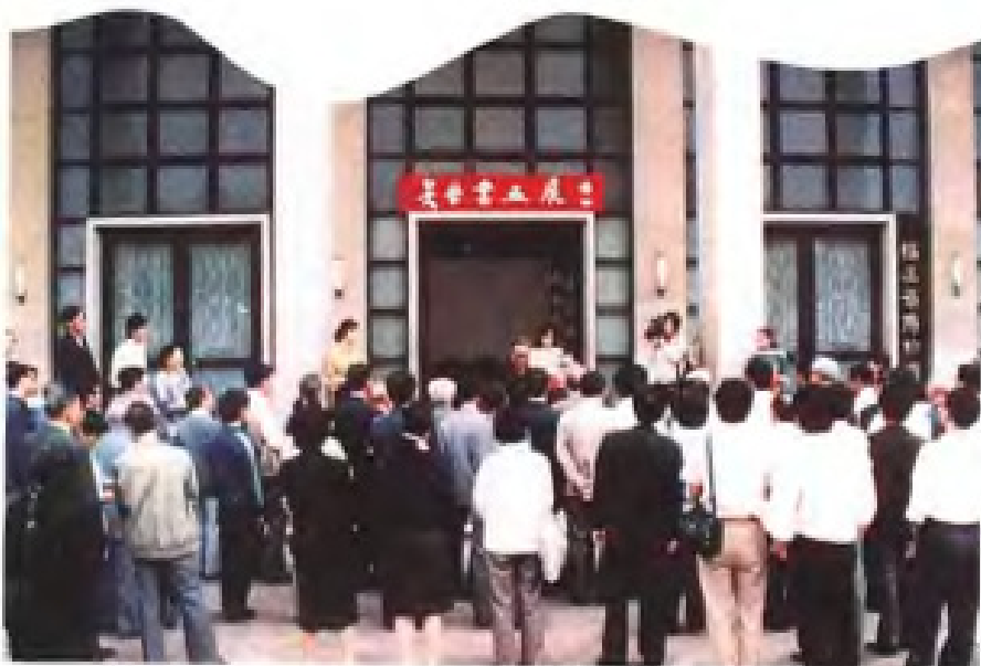
1989年5月，民进中央常委吴荣在家乡福州举办书画展