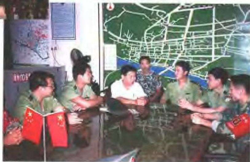
民革漳州市委負責人与110巡警大隊官兵座談