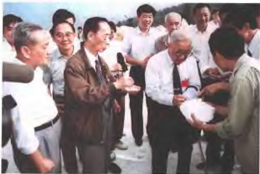
1994年10月，全国人大常委会副委员长、农工民主党中央主席卢嘉锡（前右二）率中央咨询考察团考察龙岩地区