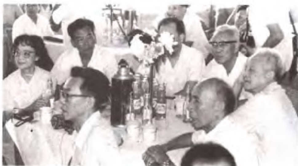
1988年9月，民盟福建省委与省政协联合邀请上海市政协文艺界代表团举行中秋对台思亲茶话会