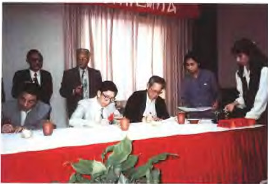
1996年4月，九三学社福建省委负责人与贵州省代表签订经济开发合作协议