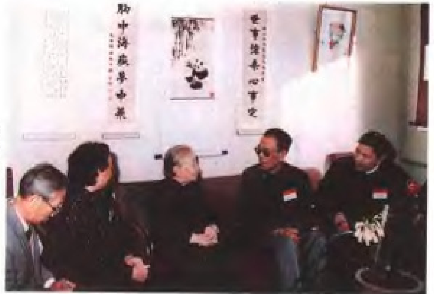
1988年10月，民进福建省委领导程力夫(右二)在京看望民进中央名誉主席谢冰心(中)