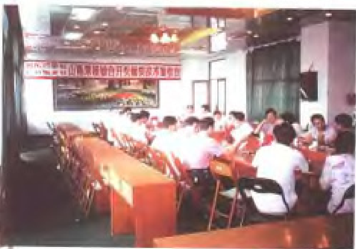
1997年8月，福建九三学社社员在 河北开展教育调研