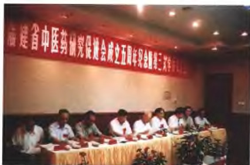
1995年秋，农工民主党福建省委主持召开福建省中医药研究促进会成立五周年纪念会及学术交流会