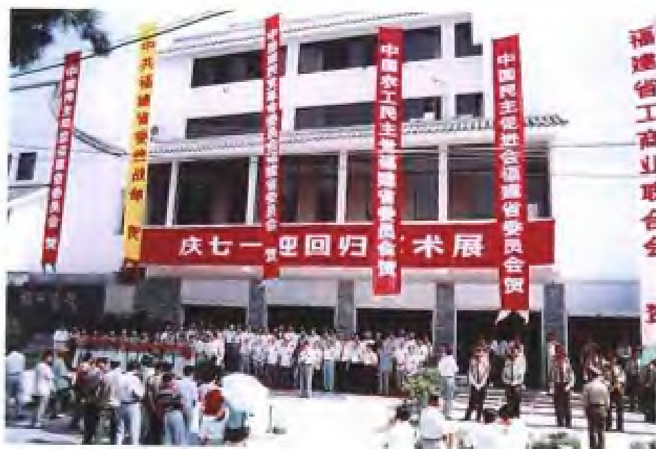
1997年6月，福建省统战系统举办“庆七一·迎回归”艺术展