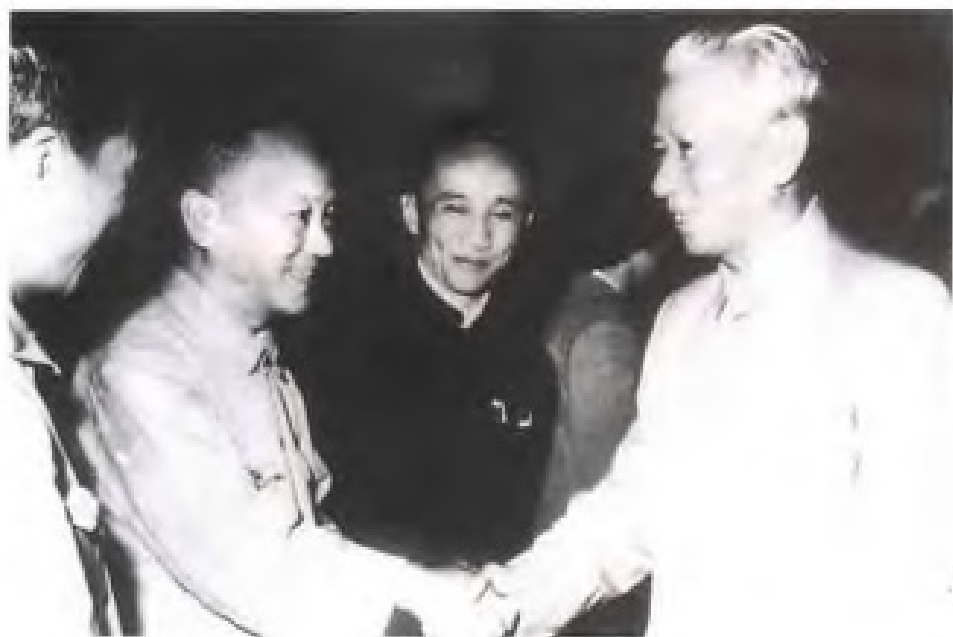
1960年，国家主席刘少奇在北京接见出席全国文教群英会的农工民主党福建省委副主委吴皎如