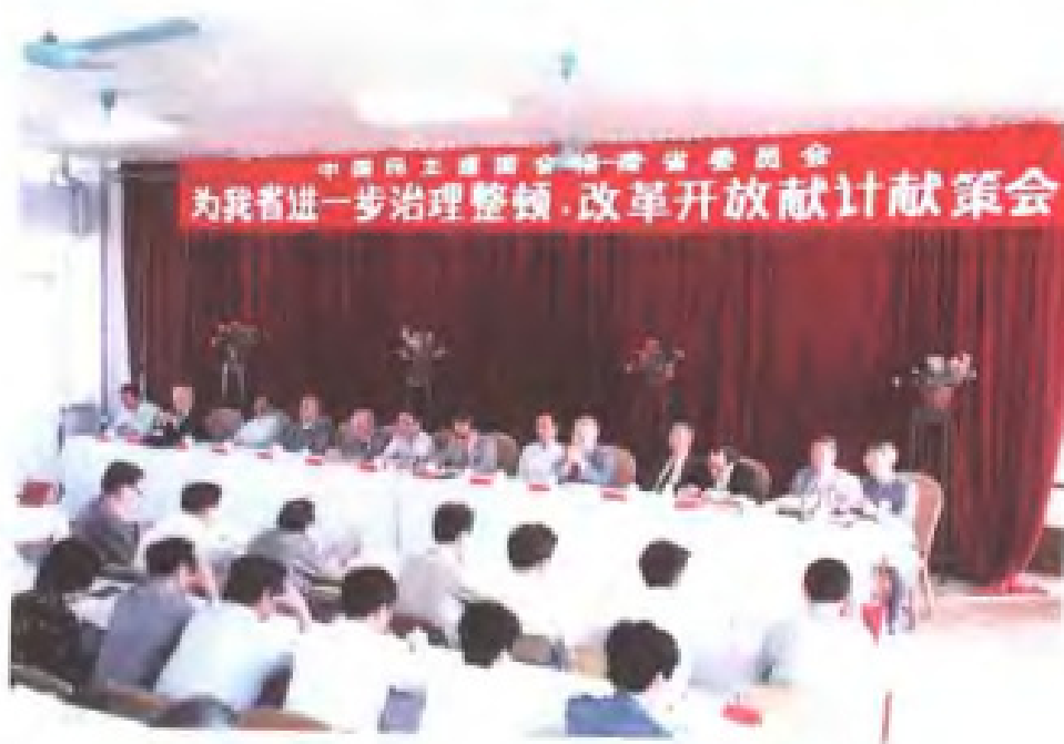
1990年10月，民建福建省委召开为改革开放献计献策会议