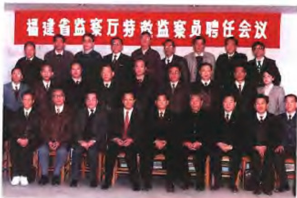
1994年3月，担任省监察厅特邀监察员的省民主党派人士出席聘任会议