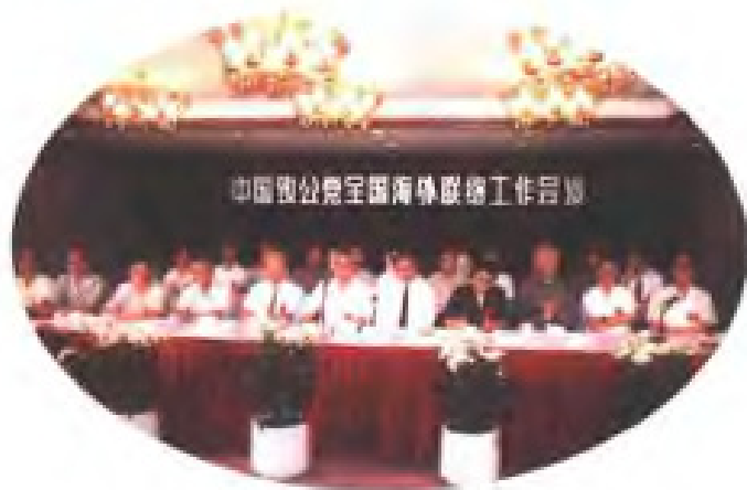
1998年5月，致公党全国海外联络工作会议在福州召开