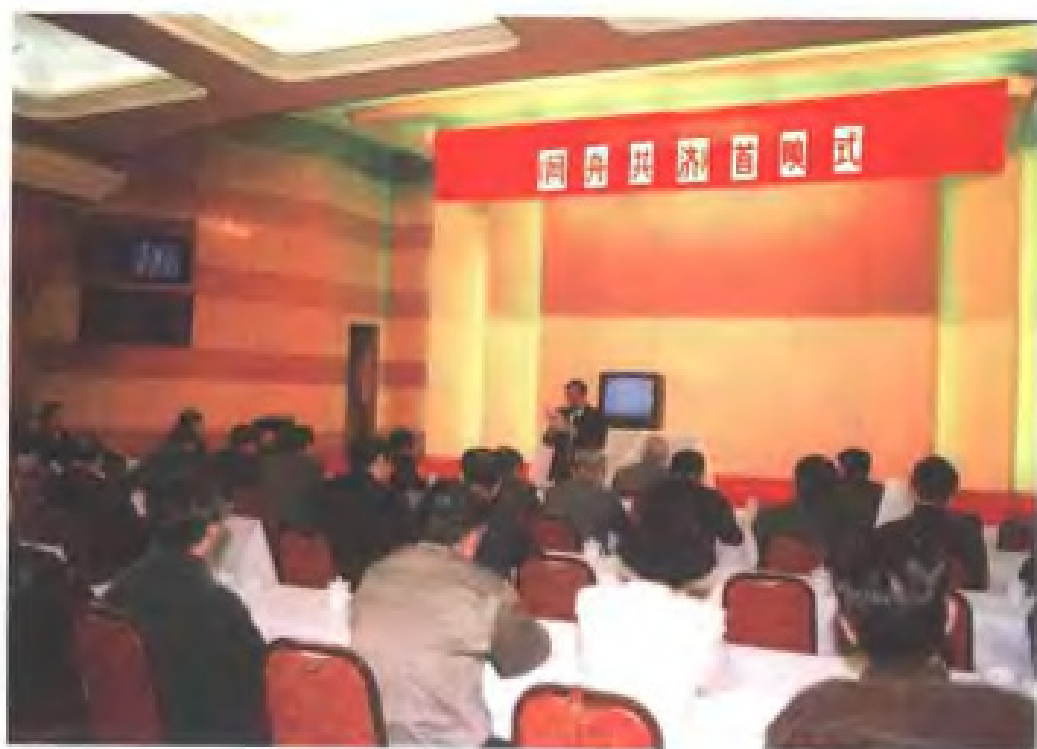
反映福建省各民主党派 与中共密切合作的电视专题片 《同舟共济》举行首映式