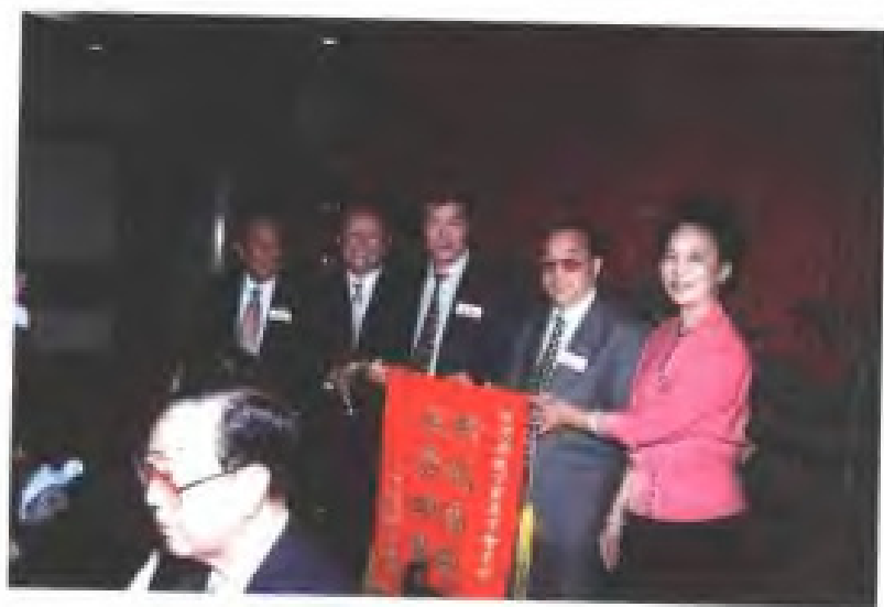
1997年10月，致公党福建省委接待英国致公总党代表团