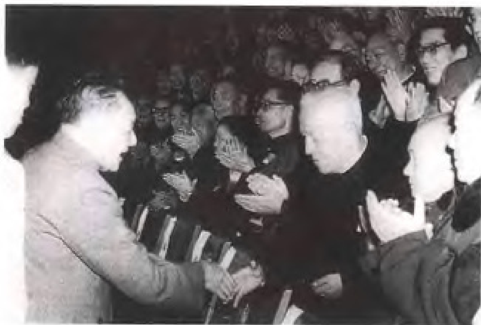
1983年12月，中共中央顾问委员会主任邓小平与出席民革全国六大的福建省代表罗榕荫亲切握手