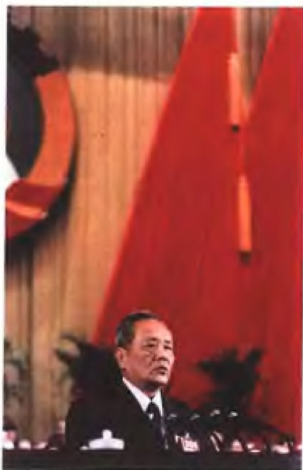
全国政协委员、农工民主党福建省委副主委王传琛在全国政协八届四次大会上发言