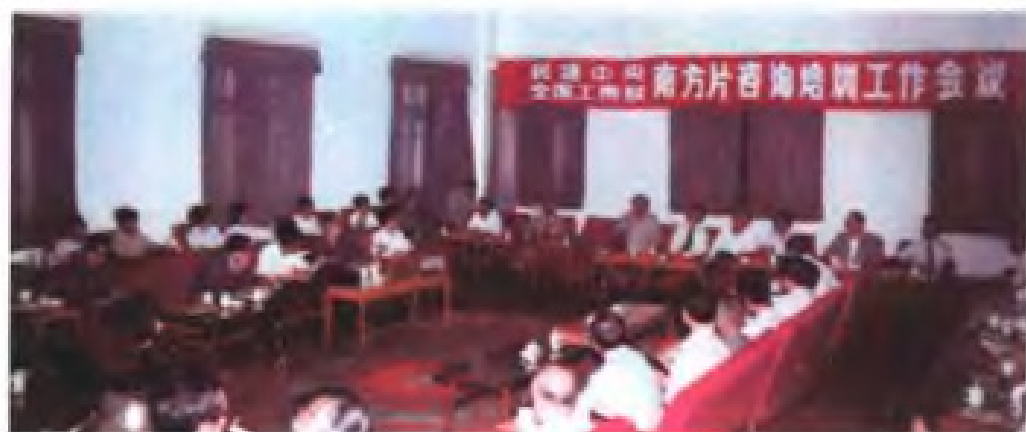
1990年10月，民建中央、 全国工商联在福州召开南方片 咨询、培训工作会议