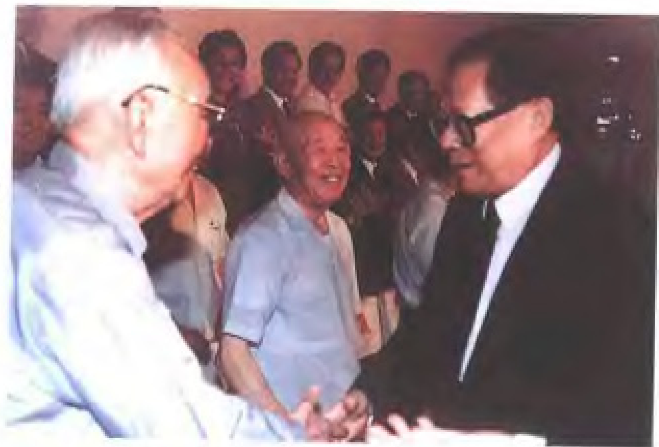
1994年8月，中共中央总书记江泽民视察福建时，会见省民主党派负责人和无党派人士