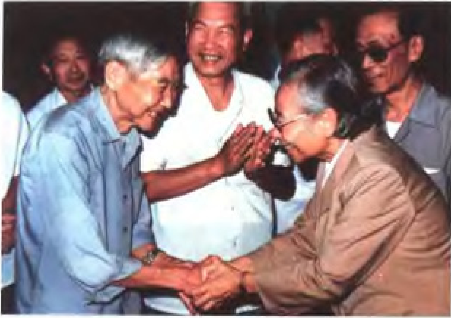
1987年9月，民进华东六省一市工作经验交流会在福州举行，民进中央主席雷洁琼(前排右)与民进福建省委主委贾祖璋(前排左)握手