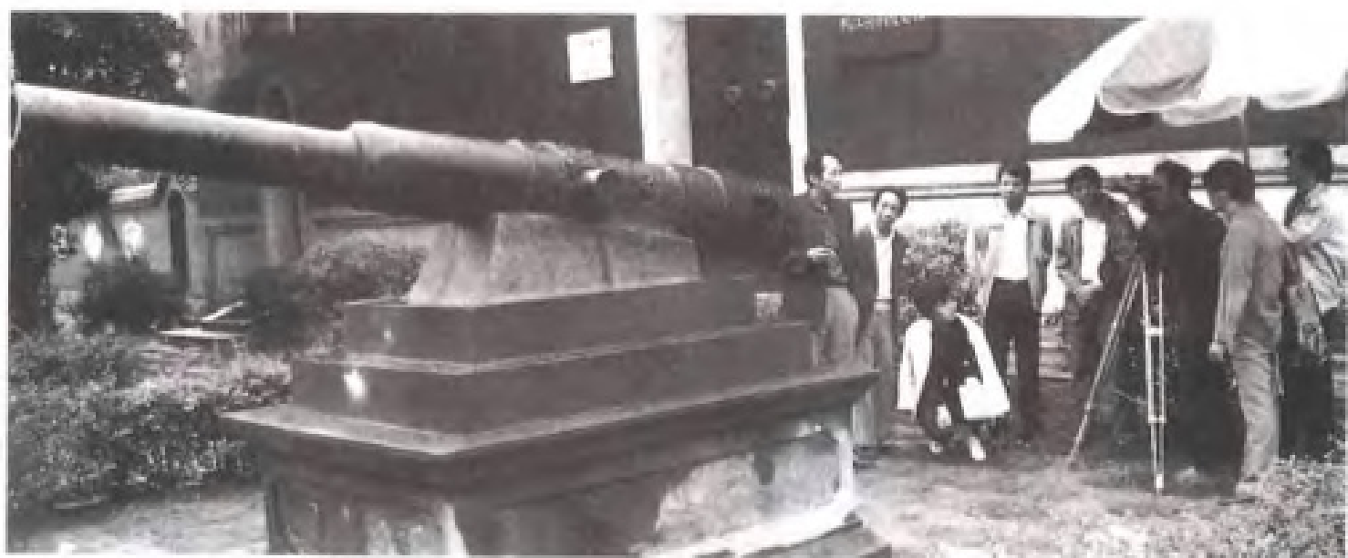
民盟福建省委与省政协联合拍摄纪念鸦片战争150年电视艺术片《马尾之光》，图为福州马江海战纪念馆前的拍摄现场