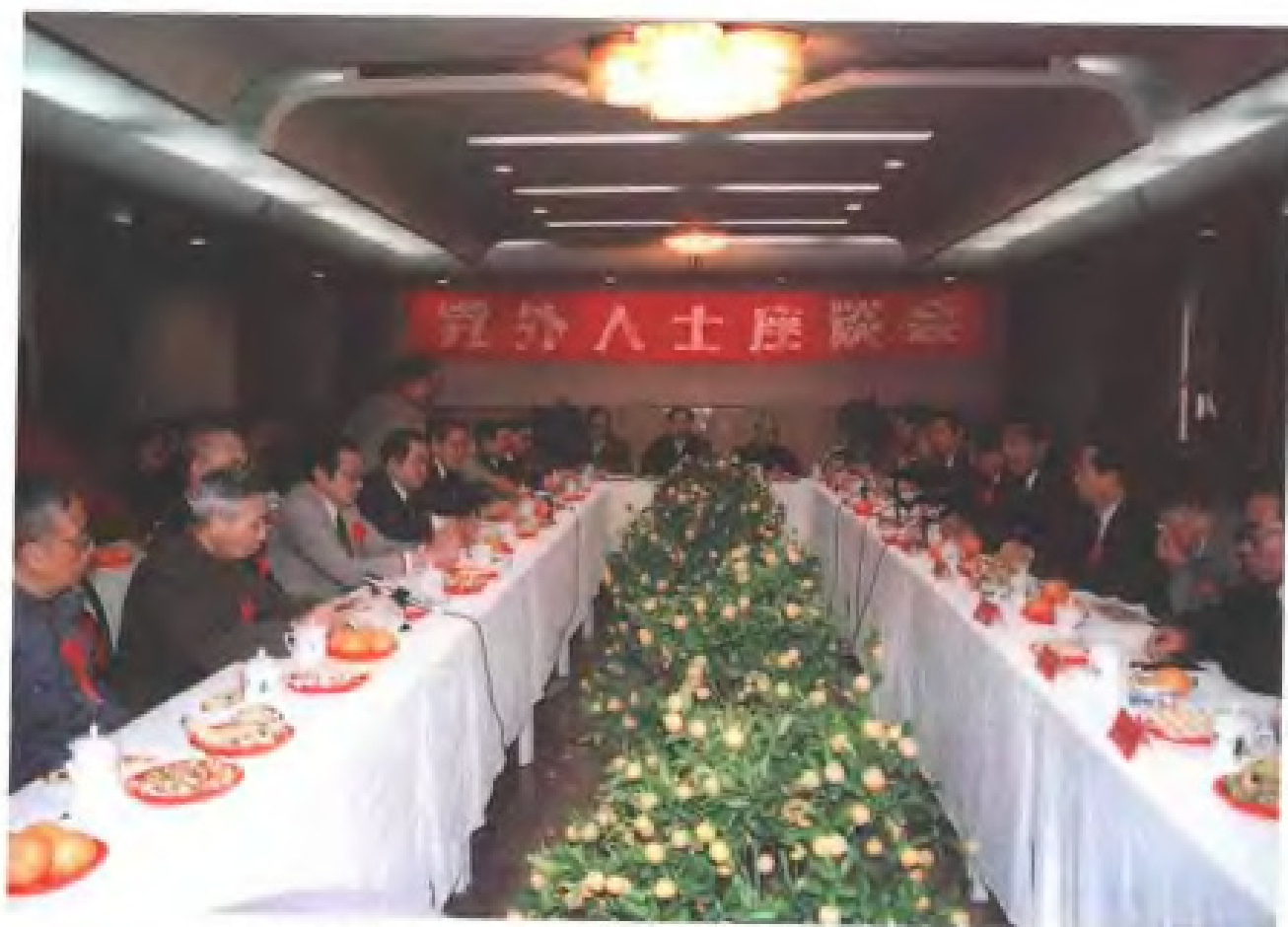
中共福建省委召开党外人士座谈会（右四为省委书记贾庆林）