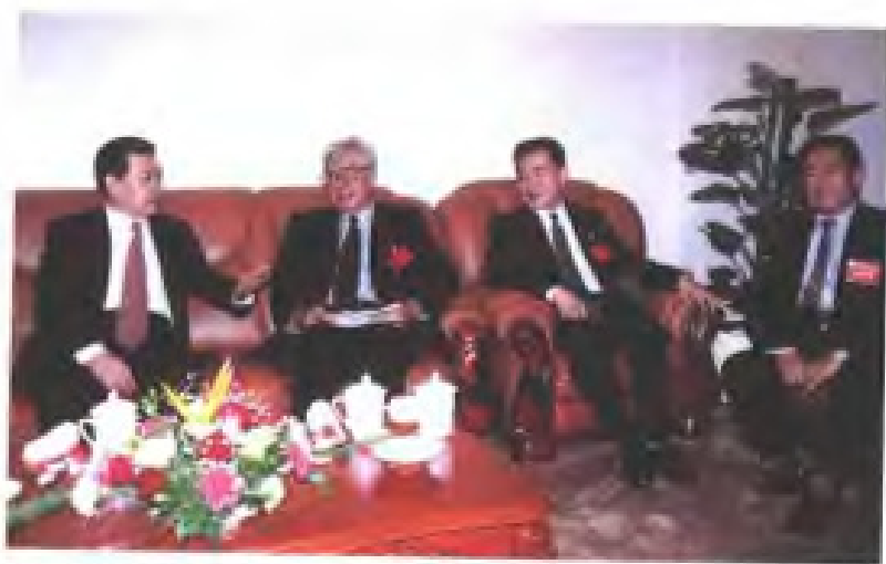
1998年11月，省委统战部部长金能筹(左一)同出席致公党中央在福州召开全国组工会议的致公党中央主席罗豪才(左二)、副主席王宋大(右二)、致公党福建省委主委周畅(右一)在一起