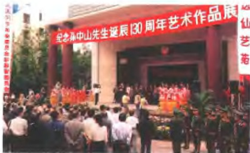
1996年11月，民革福建省委舉辦紀念孫中山藝術作品展