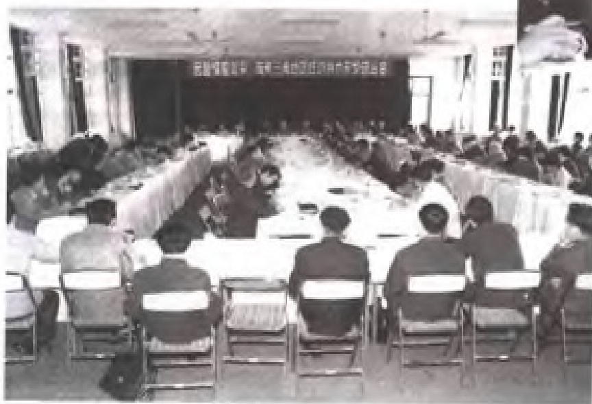
1985年10月，民盟福建省委在 福州举办闽南三角地区经济技术开 发研讨会