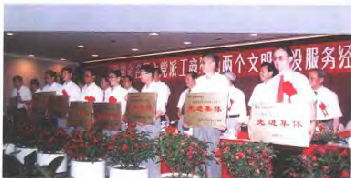
1997年6月，福建省各民主党派、工商联召开两个文明建设服务表彰会