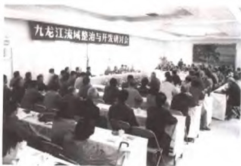
1986年11月，民盟福建省委 在漳州市举办九龙江流域整治与 开发研讨会