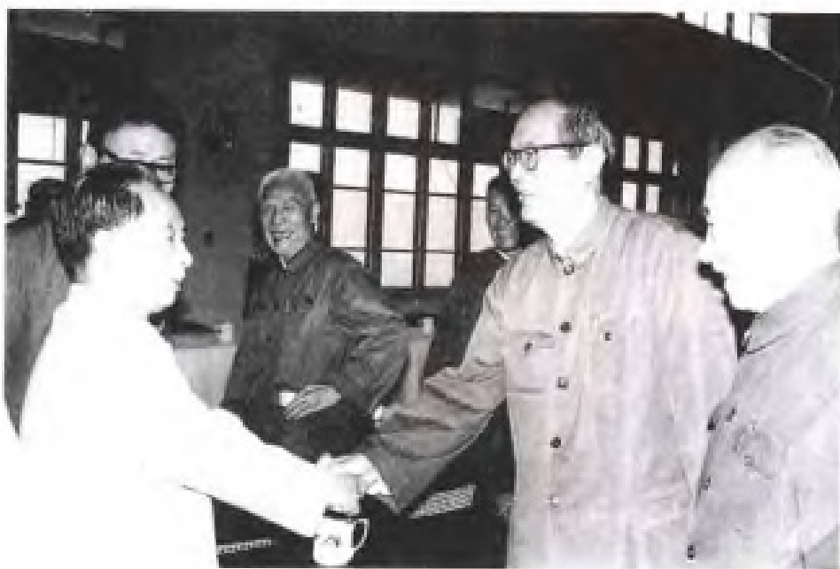
1982年11月，中共中央总书记胡耀邦视察福建时，会见省民主党派负责人和无党派人士