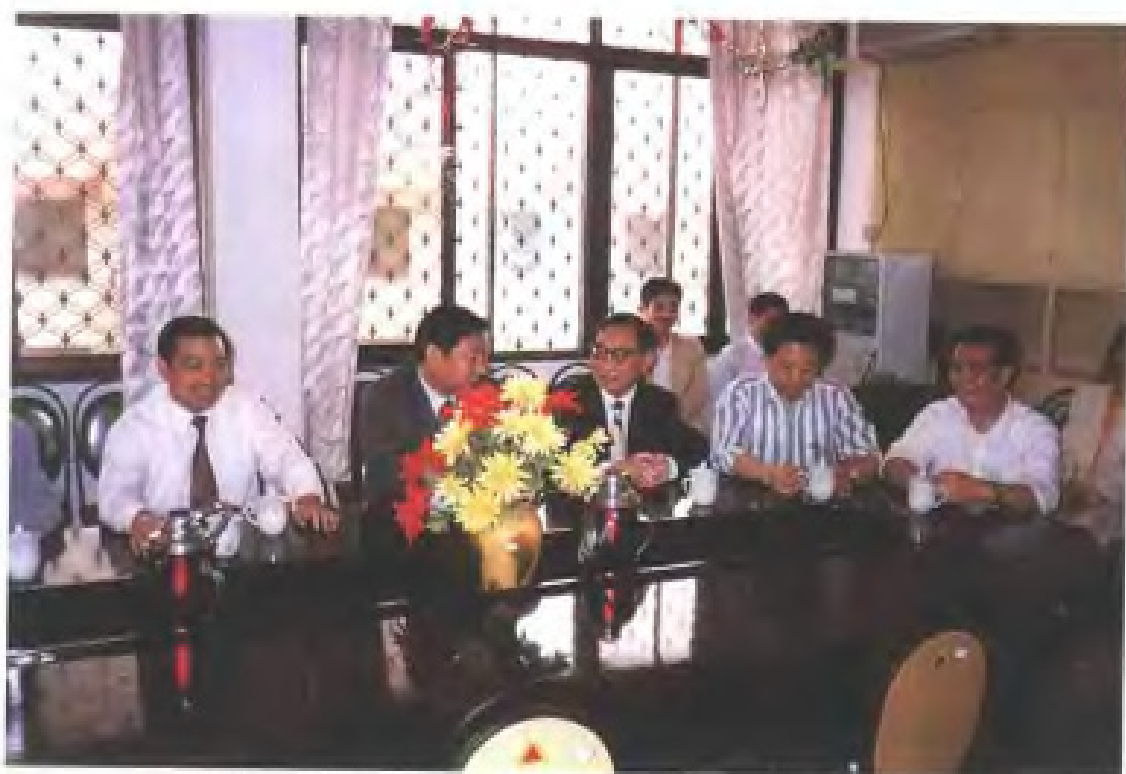
1996年4月，中共福建省委副书记习近平（左二），省政协副主席、省委统战部部长金能筹（左一）走访民进省委机关，同省政协副主席、民进福建省委主委林逸（左三）等座谈