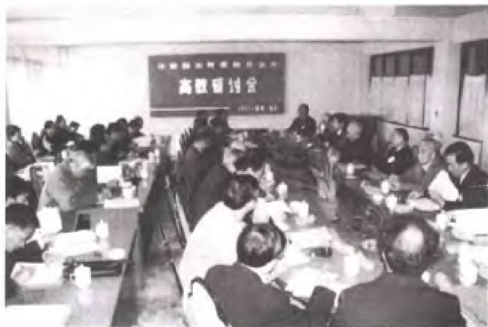
1992年8月，民盟在福州举办部分省、市高等教育研讨会