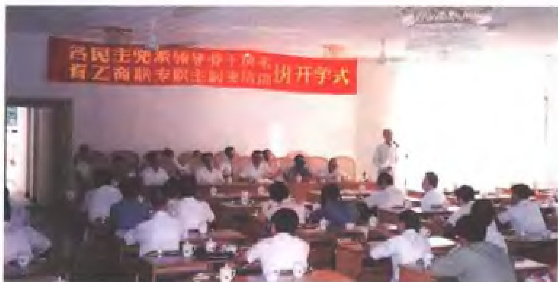
福建省各民主党派 领导骨干读书班开学