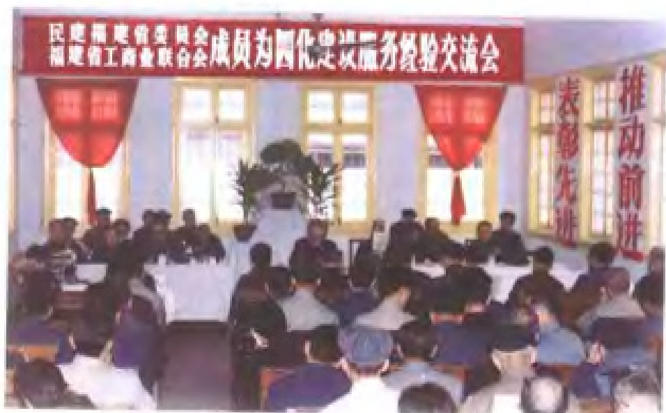
1982年，民建福建省委、省工商联召开为四化建设服务经验交流会