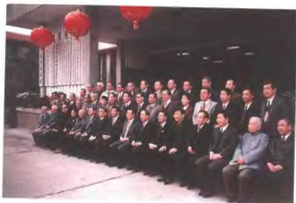
1994年2月，全国政协主席李瑞环（前排右八）视察福建时与福建省党政领导及民主党派负责人合影