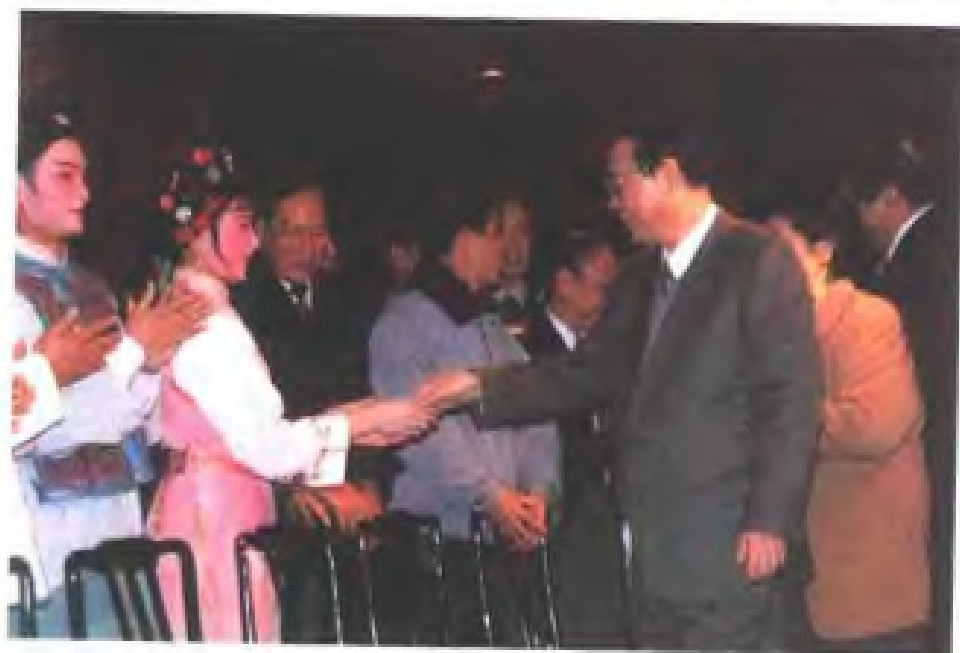
1995年2月，国务院总理李鹏在泉州观看文艺演出，接见致公党泉州文艺总支党员