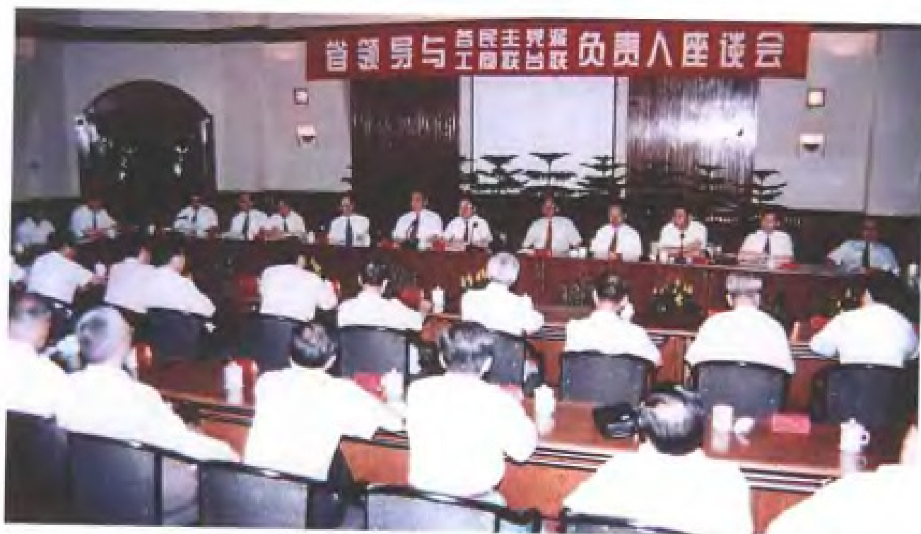
1997年6月，省领导与省各民主党派、工商联、台联新老领导人座谈，祝贺换届选举成功