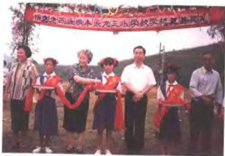
福建九三学社与建瓯市共建的丰乐 九三小学教学楼奠基