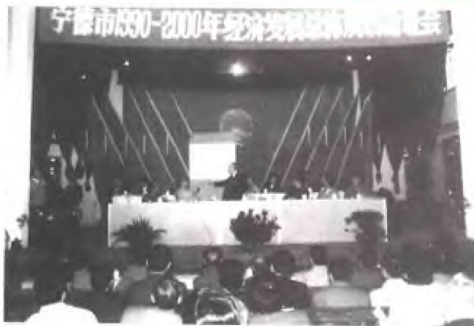
1990年,民盟中央副主席钱伟长在宁德市1990—2000年经济发展总体规划论证会上介绍张家港经济发展的经验