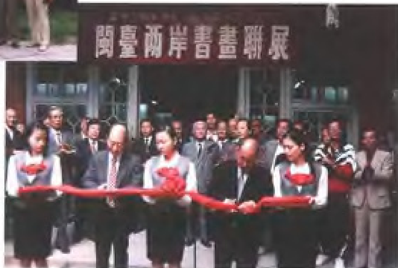
1994年，民革福建省委创办的福建逸仙艺苑与台湾八闽美术会在福州举办书画联展