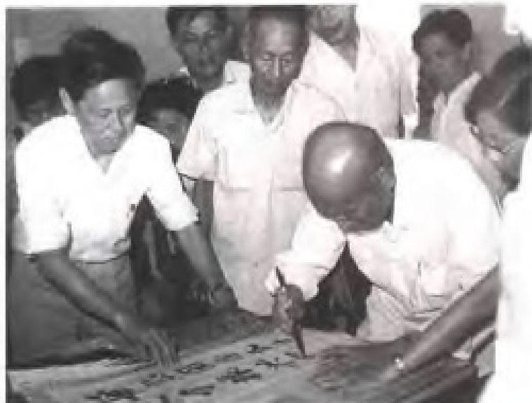
1985年5月，致公党中央主席黄鼎臣视察厦门时为致公党厦门市委题词