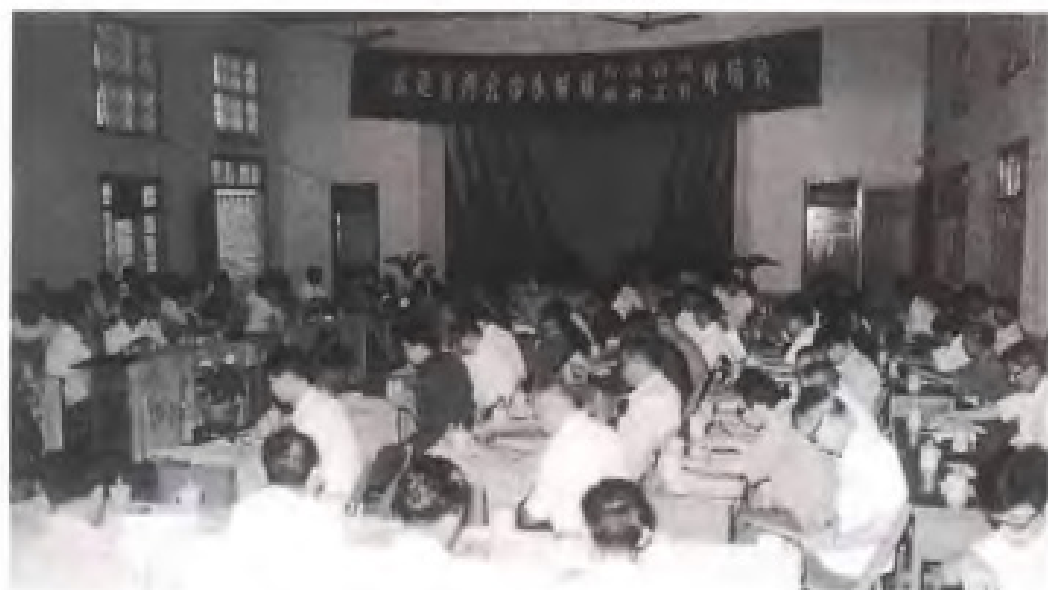
1983年5月，民建福 建省委、省工商联召开 中小城镇经济咨询、服 务工作会议