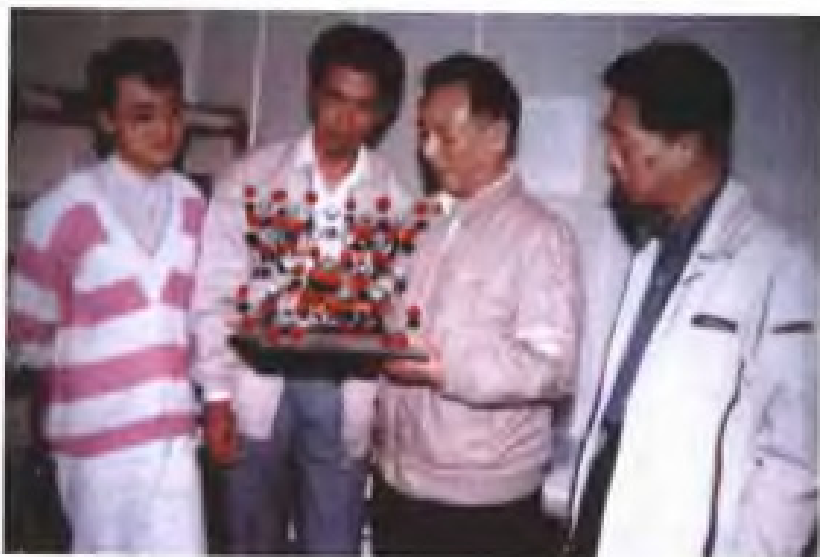
农工民主党福建省委副主委、中科院院士、福建物质结构研究所所长张乾二在实验室工作