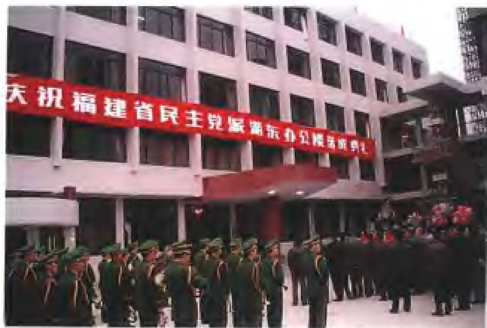
1994年2月，福建省民主党派办公楼落成