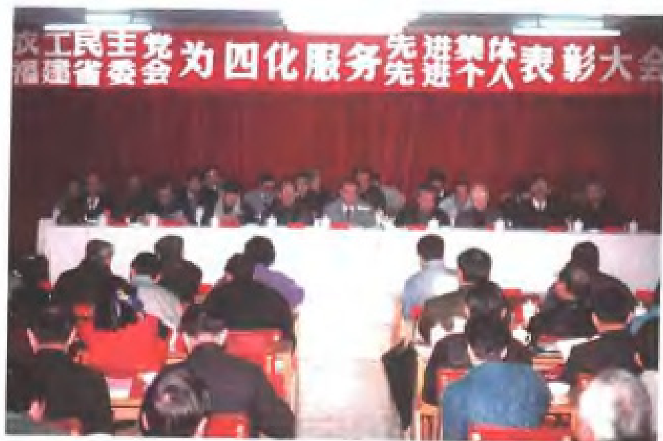
1982年1月，农工民主党福建省委员会召开为四化服务表彰大会