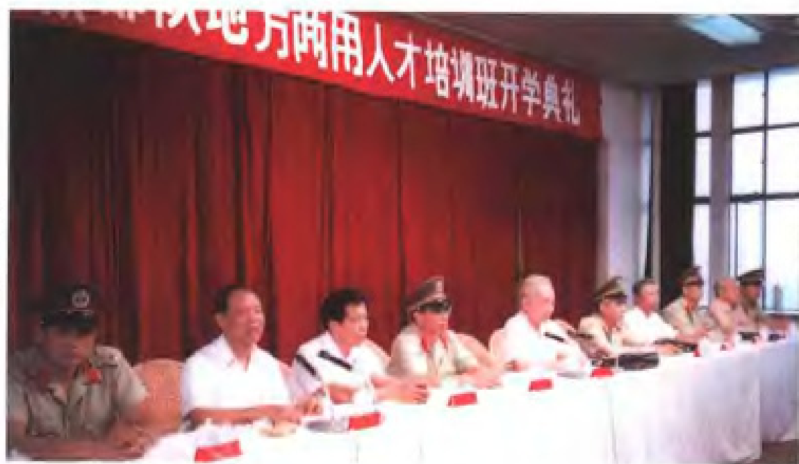
1986年6月， 民建福建省委与 省武警总队联合 举办军地两用人才 培训班