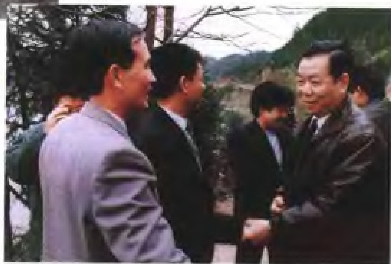
1994年3月，福建省副省长、民革福建省委副主委王良传到民革扶贫点武平县调研