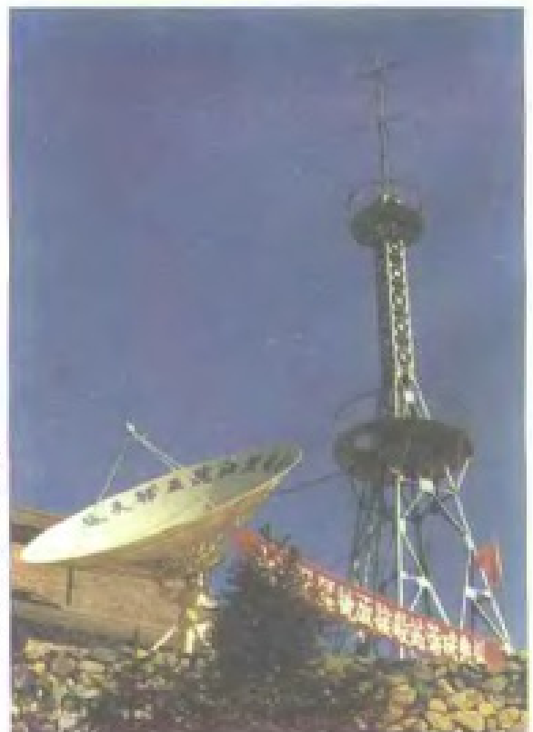
天马山电视差转台