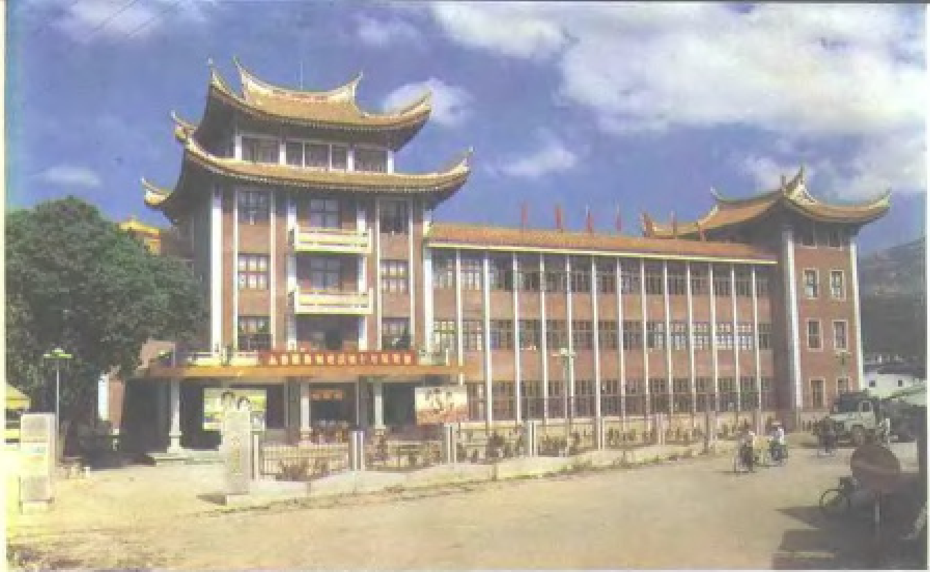
1987年建成的永春文化中心