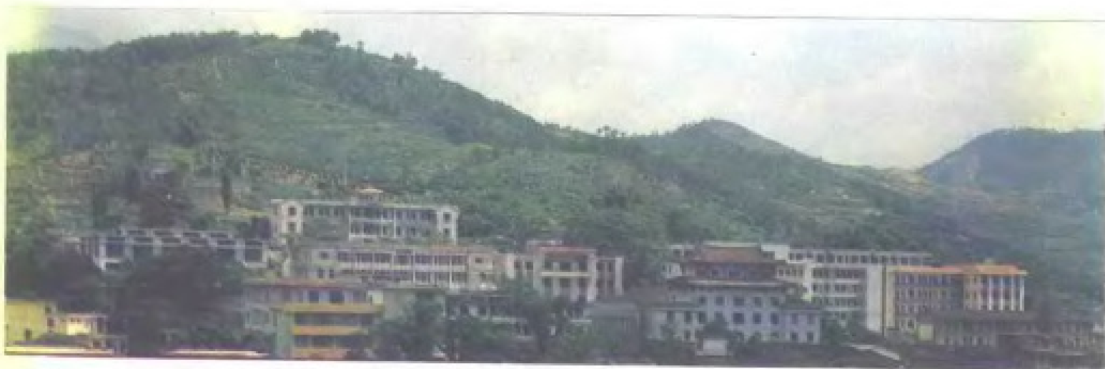
▽永春第一中学全景