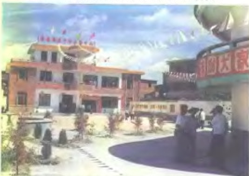
永春县老干部活动中心