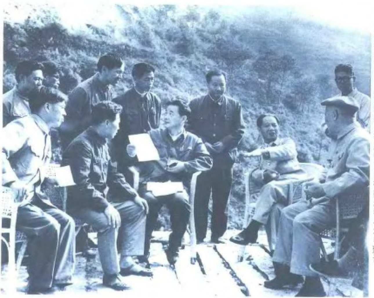
一九八二年十一月胡耀邦、李鹏等同志视察永春小水电建设