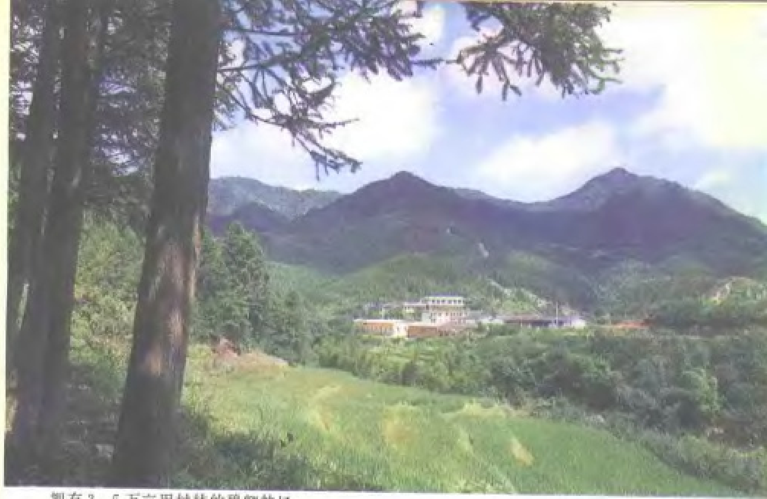
拥有 3.5 万亩用材林的碧卿林场