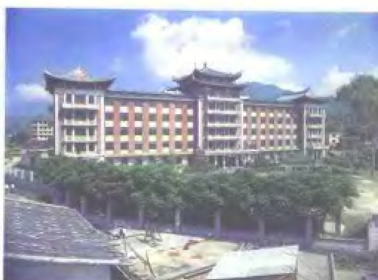
1985年落成的永春医院新楼。