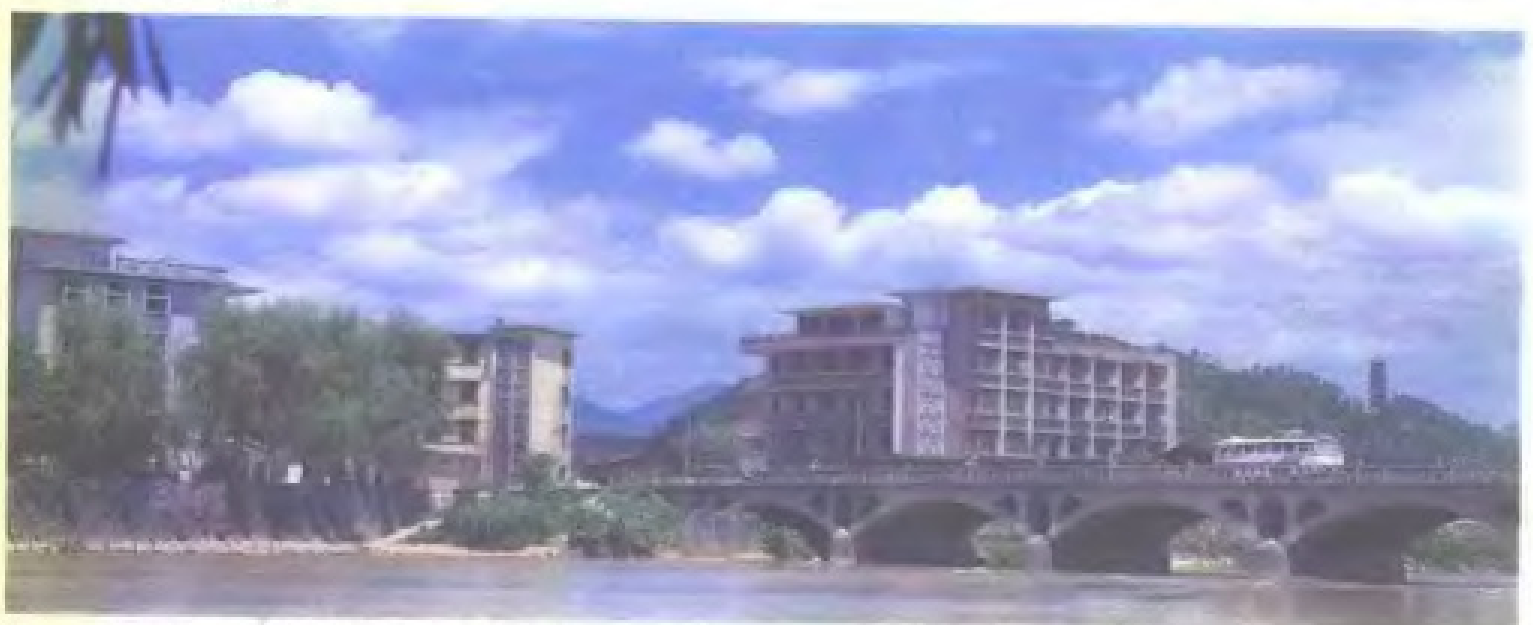
1977年新建的永春大桥（原为云龙桥）