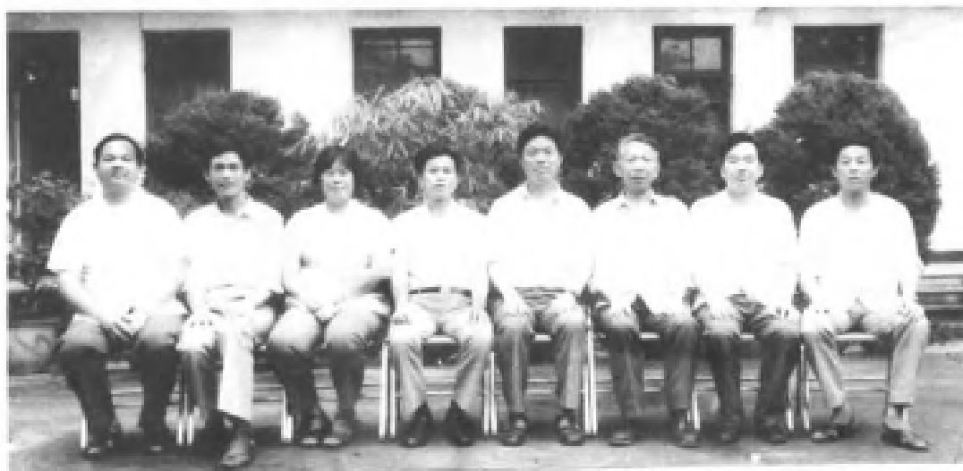
中共永春县第六届常务委员