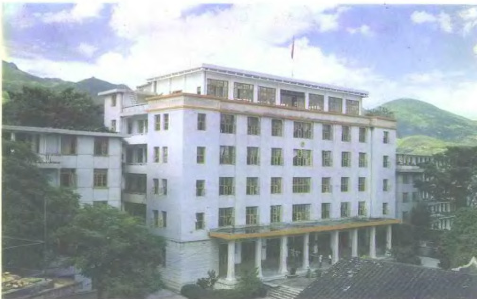
永春县委、县政府办公大楼。