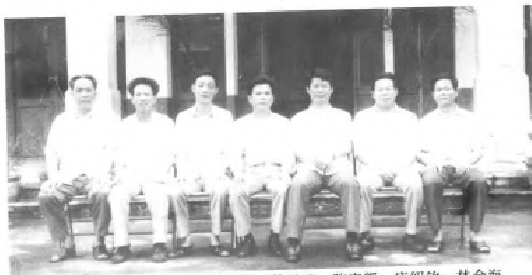
永春县人民政府第十一届正副县长 和调研员