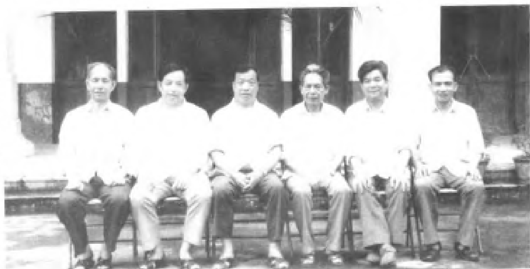
永春县人大第十一届常委会正副主任