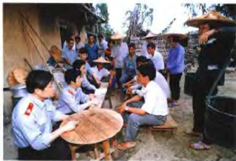
▲ 开展法律咨询活动