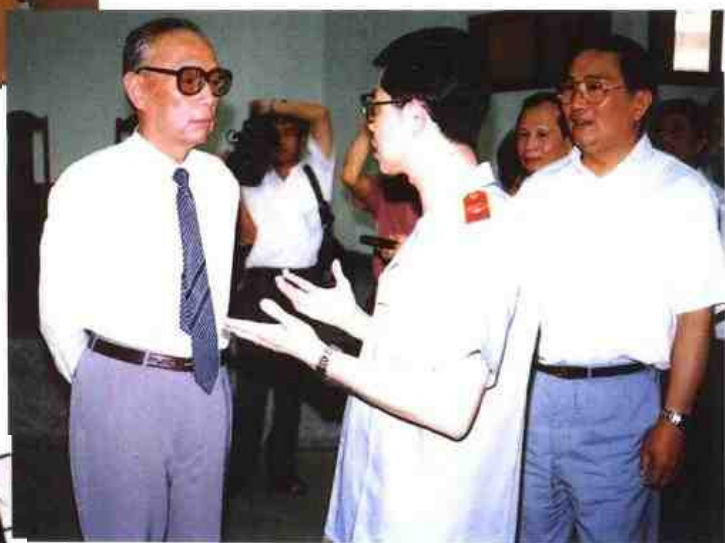
◀ 1992年1月中共中央顾问委员会委员、原最高人民法院院长郑天翔来闽视察期间为泉州市中级人民法院题词