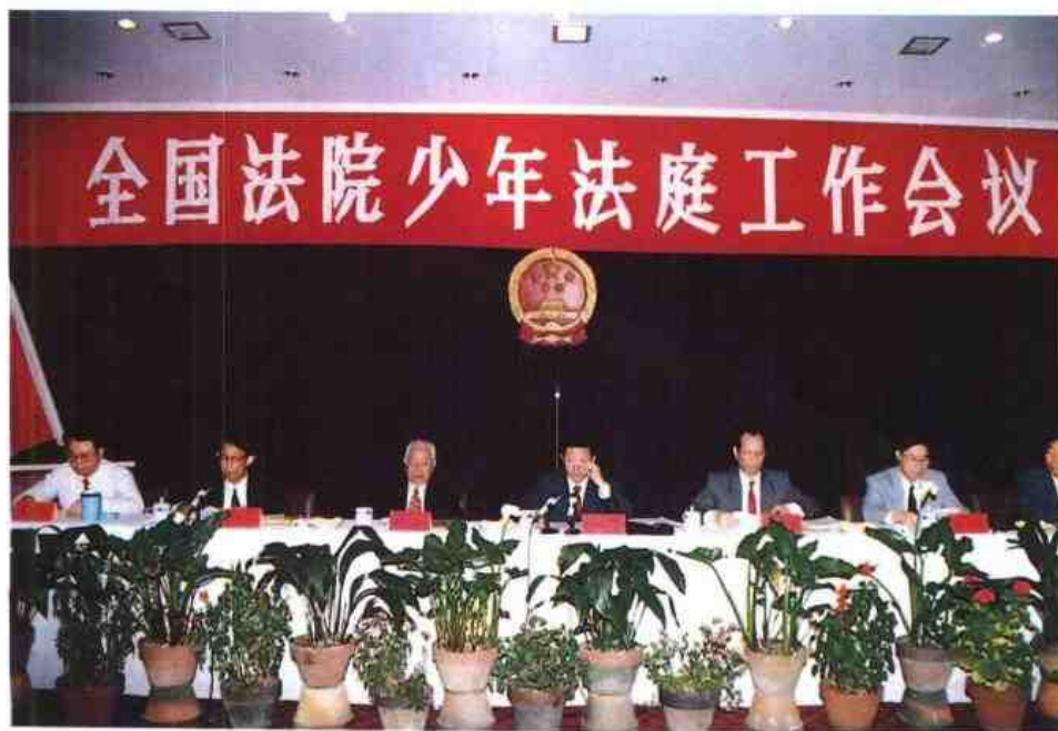
◀ 1995年5月全国法院少年法庭工作会议在福州召开，最高人民法院副院长王景荣（左四）参加会议