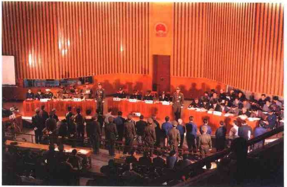
▶ 1986年3月福州市 中级人民法院开庭审理 杜国楨投机倒把、走私 诈骗案