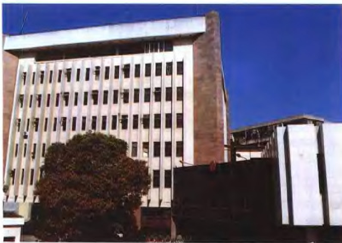
▲福建省高级人民法院现址（福州市光禄坊8号）