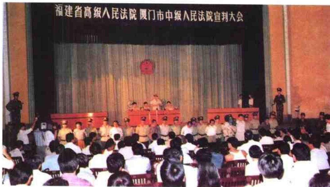
◀ 1994年6月省法 院与厦门市中级人民 法院召开宣判大会， 宣判走私、贩卖毒品 犯罪案件