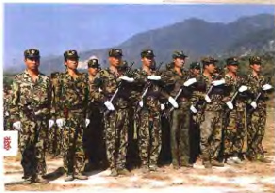
▲ 1993年10月省法院首次举行全省法院司法警察训练汇报比赛、表演暨表彰大会