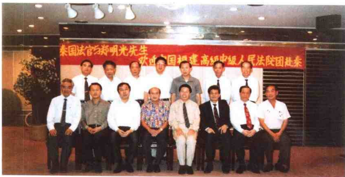
▲ 1993年1月福建省法院访问小组赴泰国考察