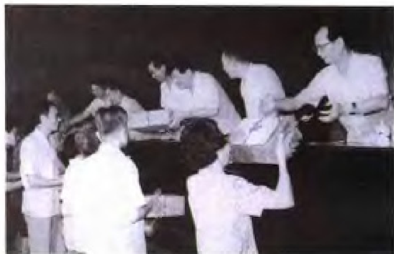
▶ 1990年8月省法院召开“颁发从事法院工作30年荣誉证书大会”