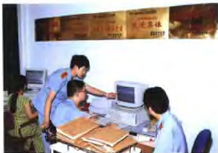
▲ 省法院档案室的影