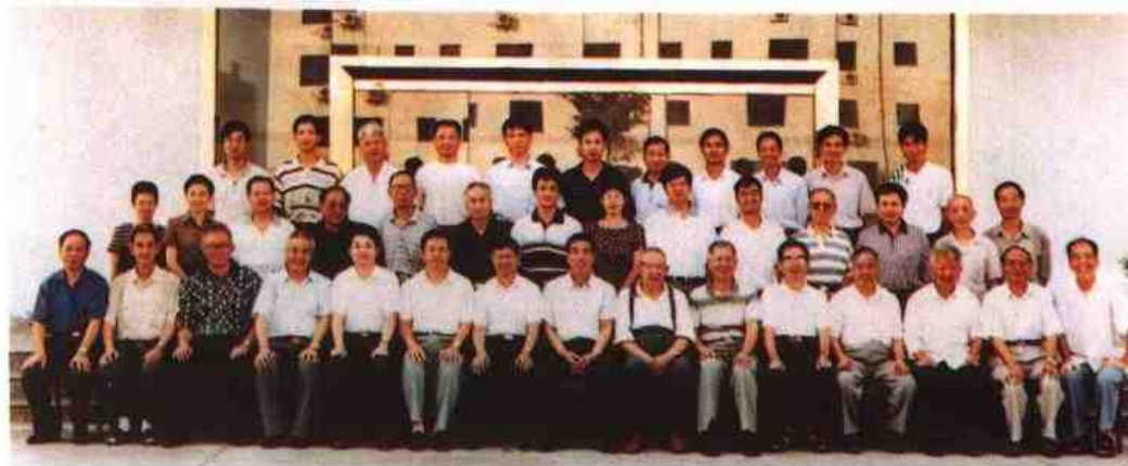
▶ 省法院院长陈旭(前排左八)与《福建省志·审判志》评稿会代表合影