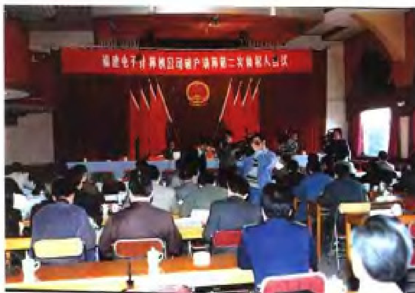
▶ 1995年省法院审理福建电子计算机公司破产案期间召开第二次债权人会议