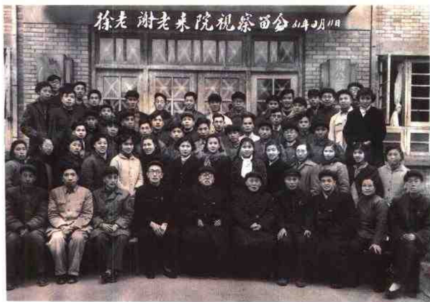
◀ 1961年2月最高人民法院院长谢觉哉（前排左五）与徐特立（前排左六）来闽巡察，同省法院干部合影。前排左四为省法院院长赵源