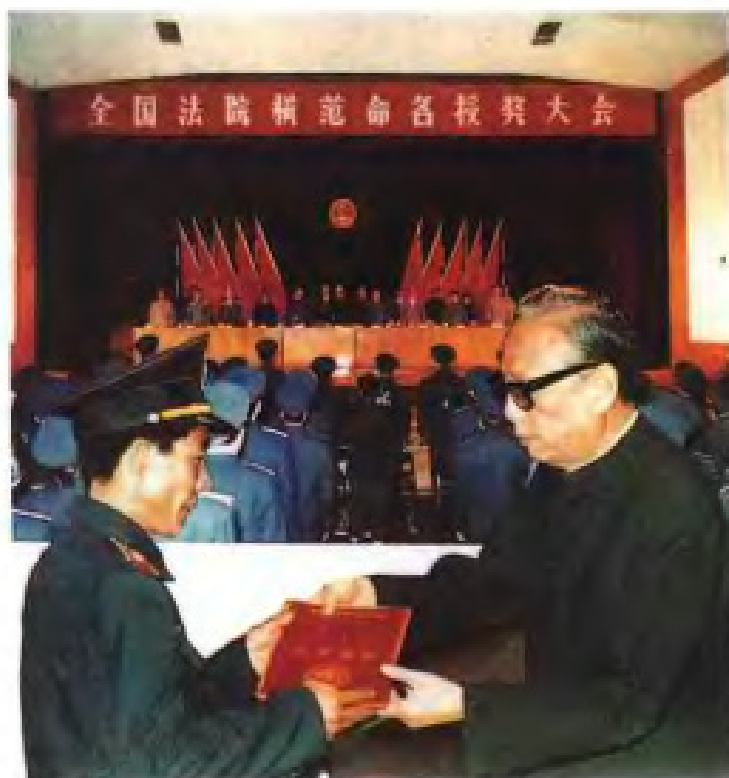
▶ 最高人民法院院长任建新给 全国法院模范欧金淡颁奖