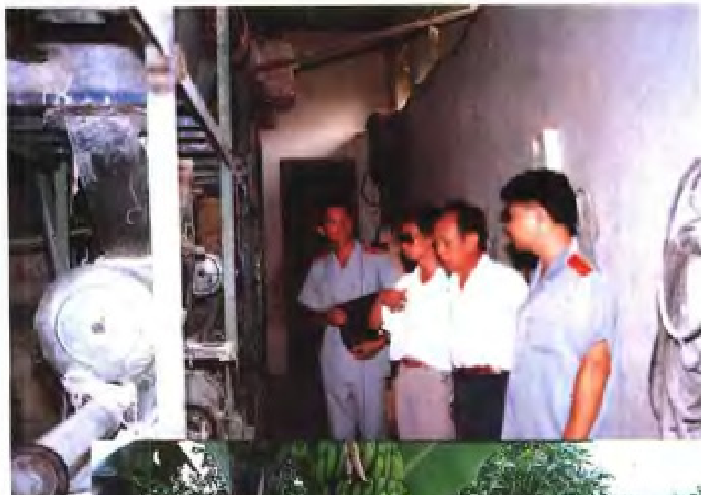
深入工厂、农村、渔区办案