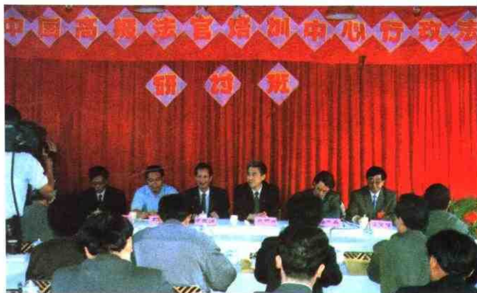
▶ 1992年10月中国高级法官培训中心“行政法研讨班”在厦门举行，最高人民法院副院长祝铭山（左四）在开幕式上讲话