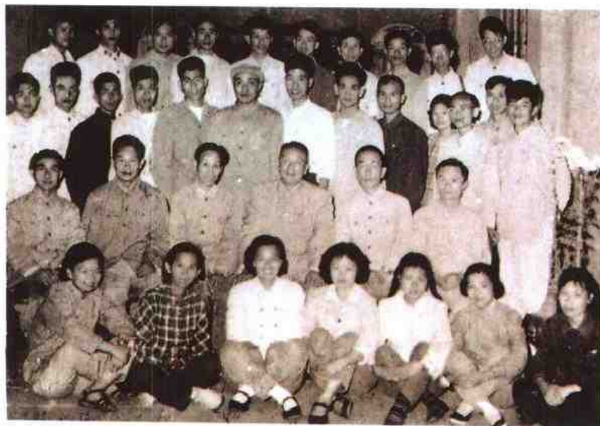
◀ 1960年6月最高人民法院副院长马锡五（第二排左四）来闽视察期间，同厦门市中级人民法院干部合影