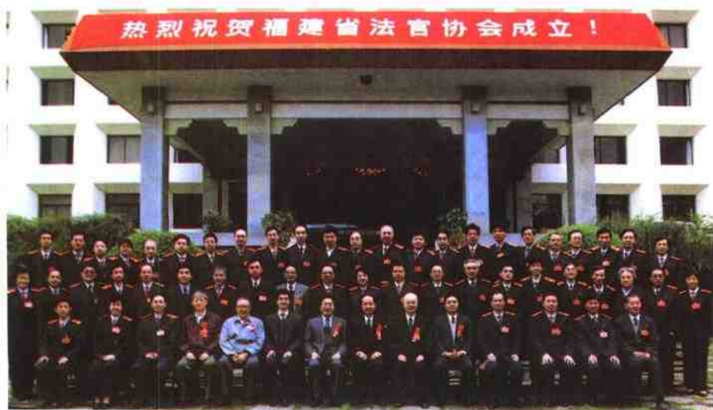
◀ 福建省法官协会成立与会者合影