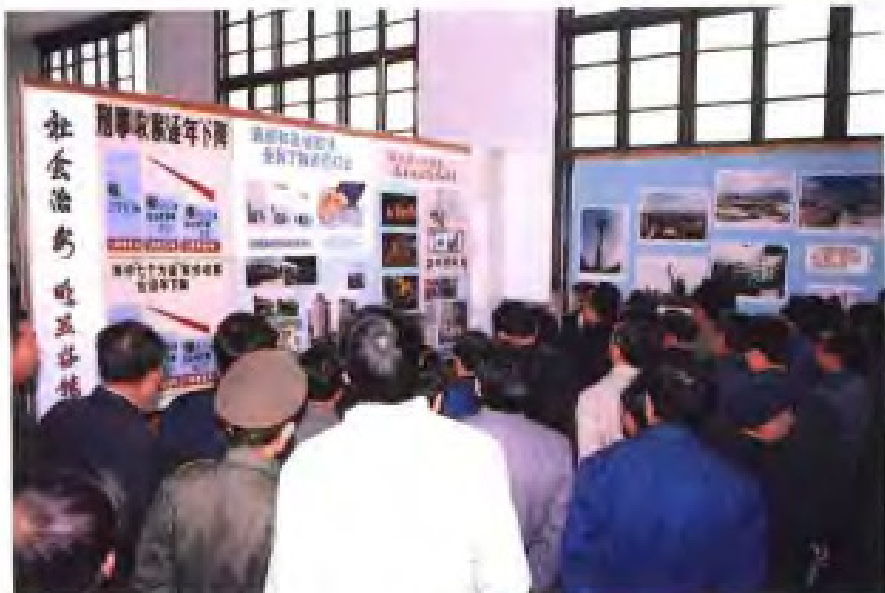
◀ “严打” 图片展览