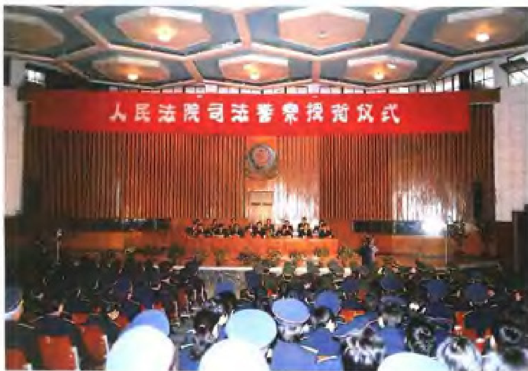
◀ 1992年12月省法院举行司法警察授衔仪式