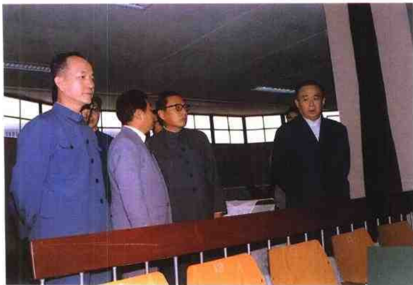
◀ 1986年10月中共中央书记处书记、国务院副总理、中央政法委书记乔石视察福州市中级人民法院审判法庭