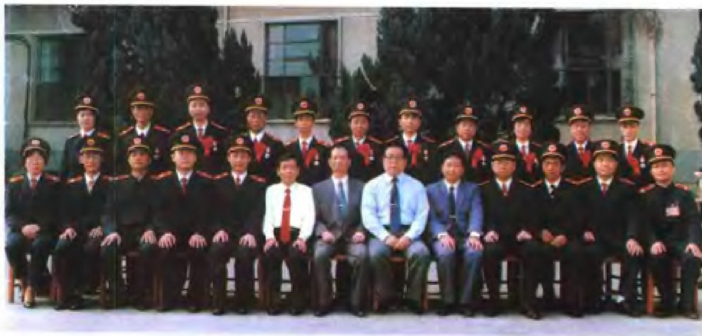
▲ 1994年4月全省法院系统评选出“十佳法院”和“十佳法官”