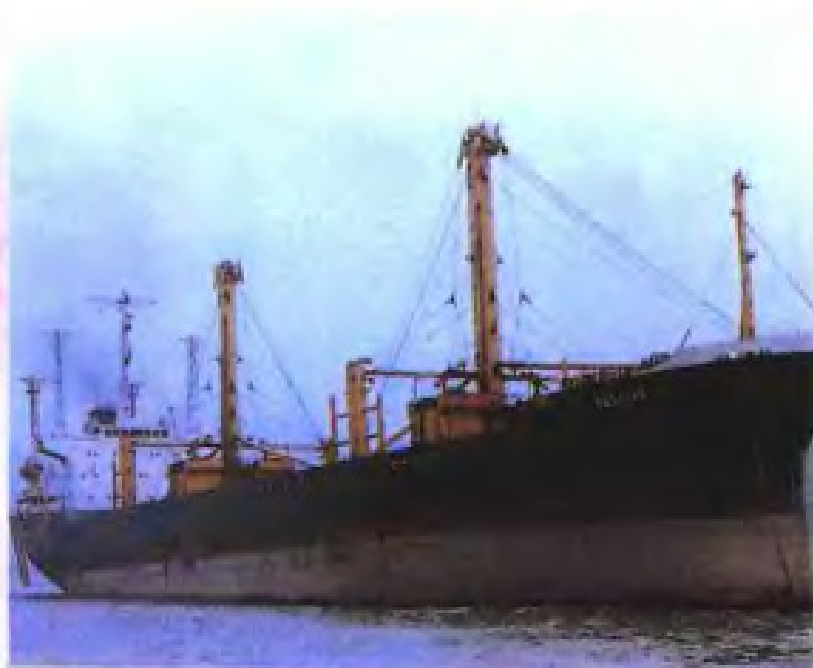
▲ 厦门海事法院扣押外籍船舶，办案人员上船张贴扣押令