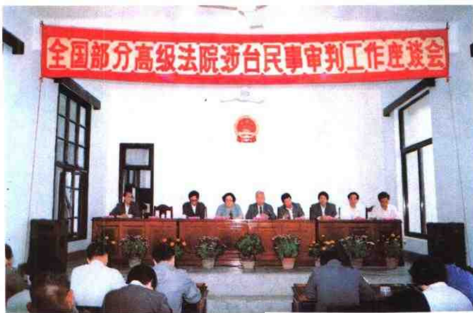
◀ 1992年5月全国部分高级法院涉台民事审判工作座谈会在厦门召开，最高人民法院副院长马原（左三）、端木正（左四）参加会议