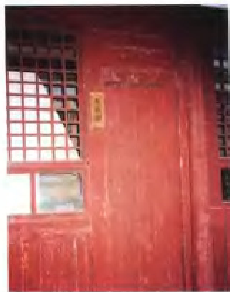
▲福建省苏维埃政府裁判部旧址（长汀县）