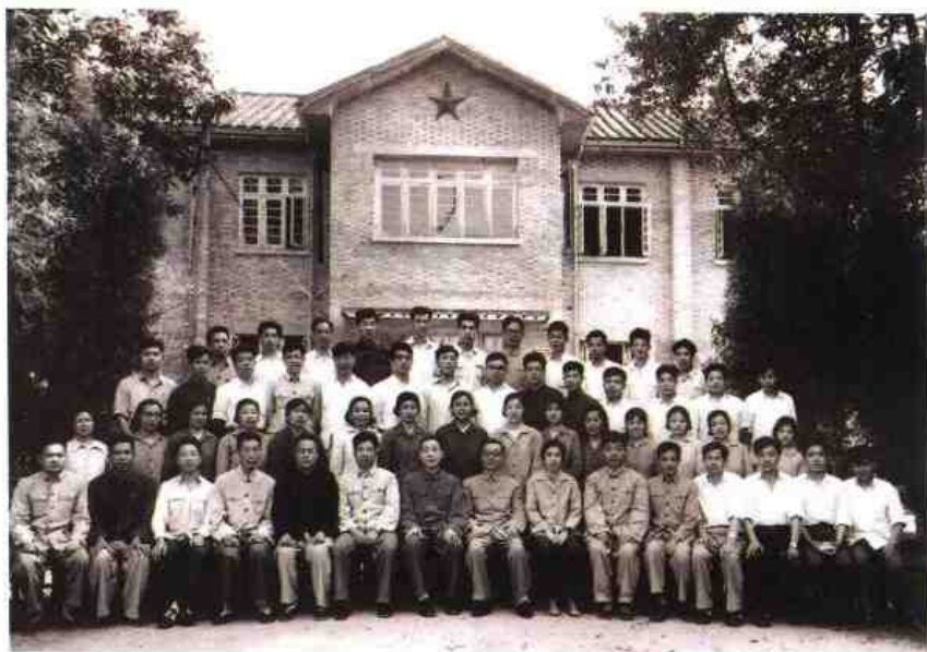
▶ 1965年5月最高人民法院院长杨秀峰（前排左八）来闽视察期间，同省法院干部在省法院办公楼前（鼓东路旧址）合影