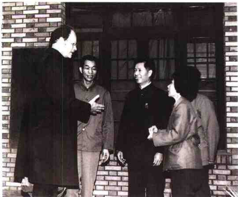
◀ 1984年4月美国俄勒冈州参议院议长、律师威廉福莱尔来省法院访问