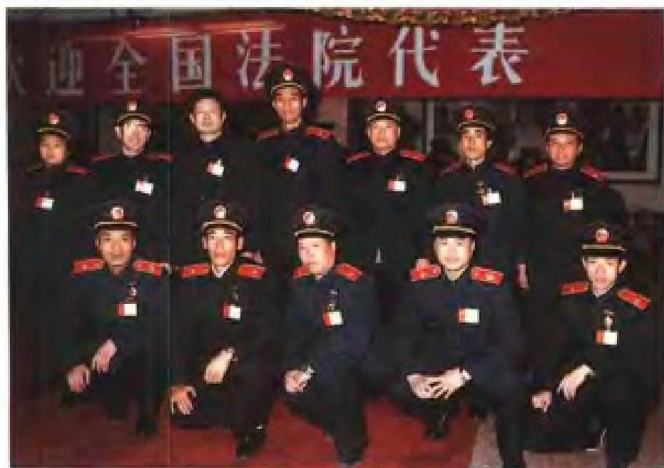
◀ 1985年2月福建省出席全国法院“双先”表彰大会的代表在京合影