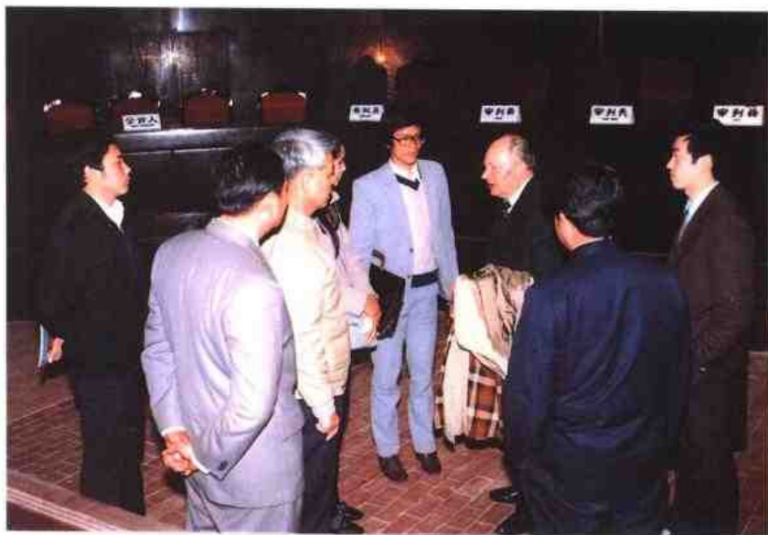
▶ 1989年1月来省法院进行学术访问的波兰科学院国家与法研究所刑法学教授比茨基（右三）参观审判法庭