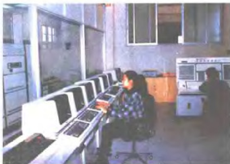
福州电信局于1987年1月开通的全国第一套微机自动转报系统