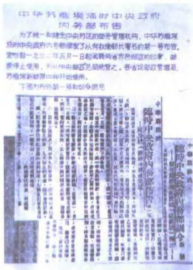
1932年，中华苏维埃临时中央政府内务部关于统一苏维埃邮政问题的布告