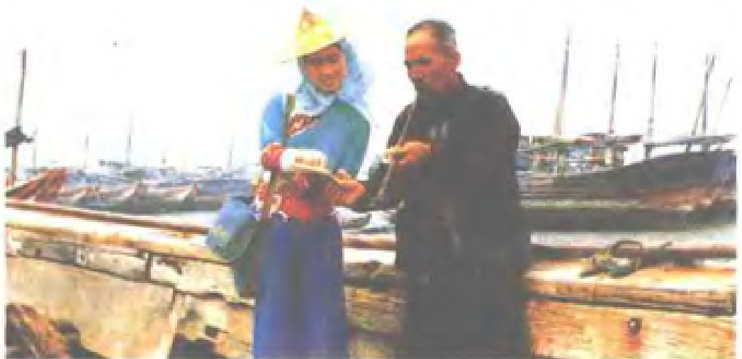
惠安县邮电局在乡邮改革中组织社会力量，实现农村投递到户