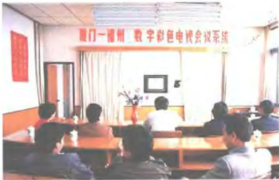
1988年12月,福州-厦门全国第一个 8Mb/s 彩色可视会议电话开通