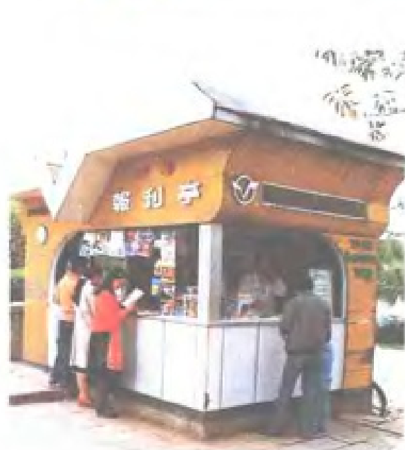
街头邮电服务网点