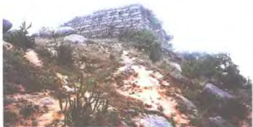
位于惠安东湖山的明朝抗倭烽火台遗址