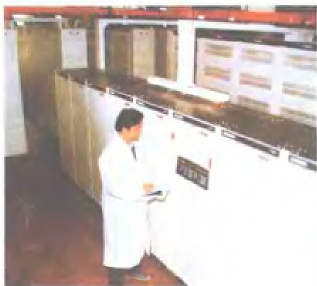
福州程控电话LS设备