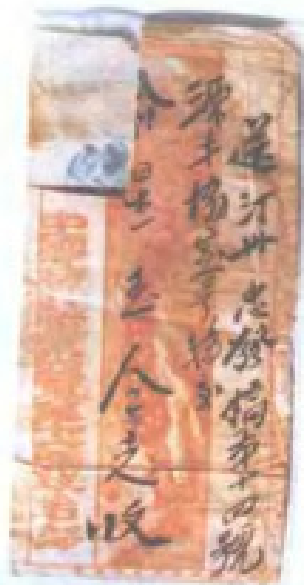
1932年,中华苏维埃邮政实寄封

1932年,中华苏维埃邮政总局发行的 赤色邮花,是苏维埃政权建立初期,在苏区 发行的,也是苏维埃政权建立初期发行的 第一套邮票。(1932年)