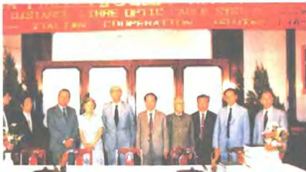
福建省邮电管理局与意大利 TELETRON 公司举行引进光缆 设备合同签订仪式