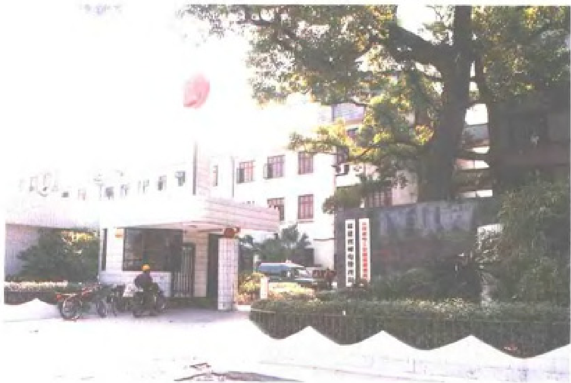
福建省邮电管理局