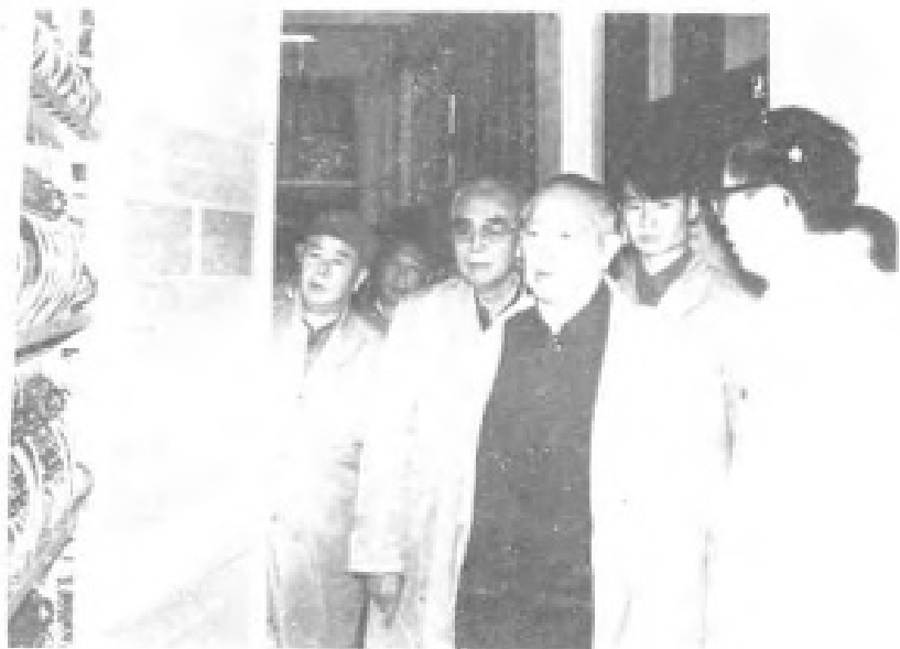
1982年11月,全国第一套万门程控电话在福州开通后,1983年10月18日,国家主席李先念视察福州电信局程控电话设备