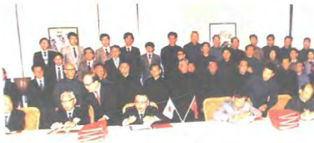
1980年12月24日,福建省邮电管理局与日本富士通株式会社在福州签订引进全国第一套程控电话合同书