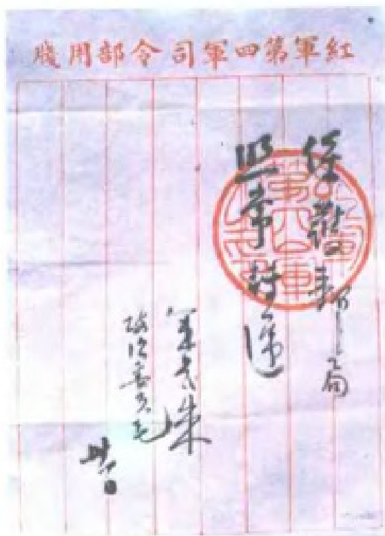
1929年12月，朱德军长、毛泽东政委签署通令：“保护邮局，照常转递”