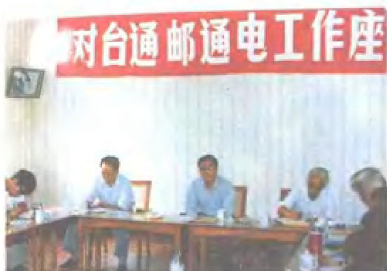
1987年11月,邮电部在厦门召开对台通邮通电工作座谈会