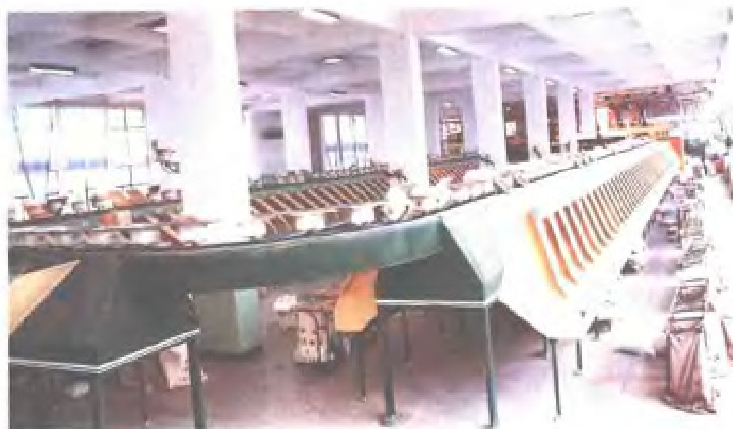
福州市邮政局自动包裹分拣机