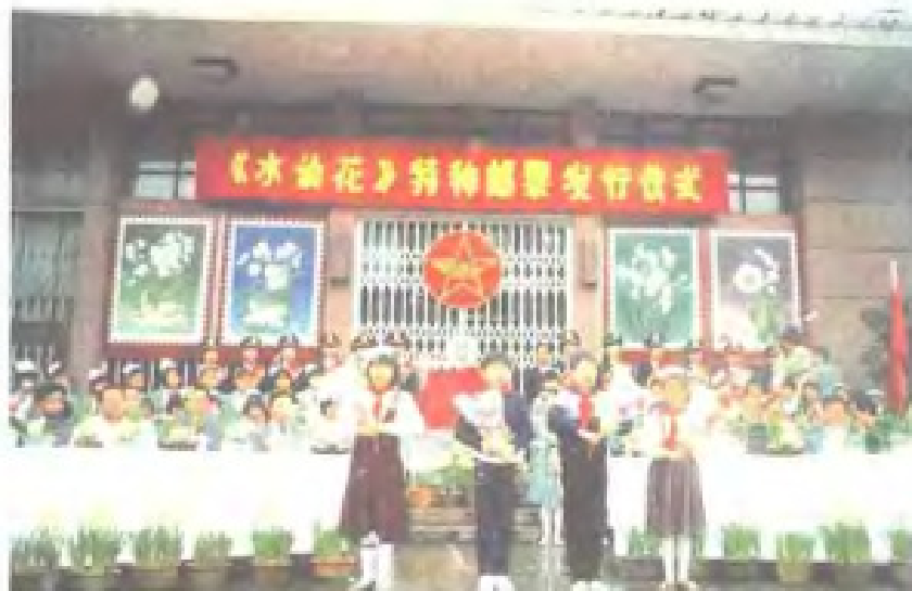
1990年2月10日，《水仙花》特种邮票首发式在漳州举行

中华邮政总办培黎（法国人）有意向刚创立的民国政府挑衅，将库存伦敦版蟠龙无水印邮票，加盖“临时中立”字样。