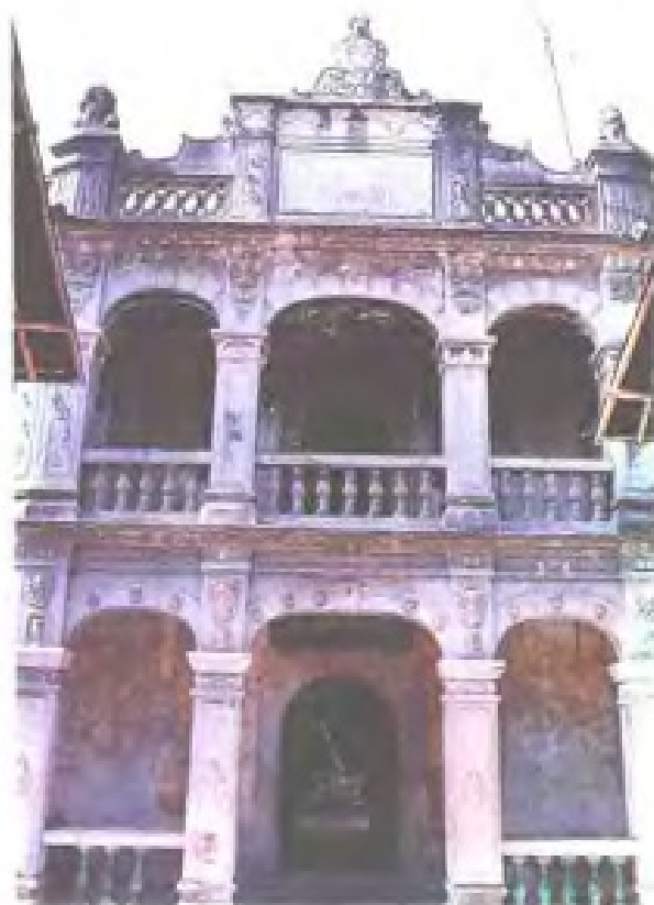
清光绪二十四年(1898年),在漳州流传乡设立的天一民信局