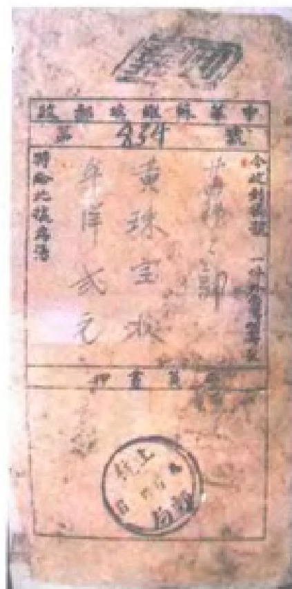
中华苏维埃邮政挂号 收据