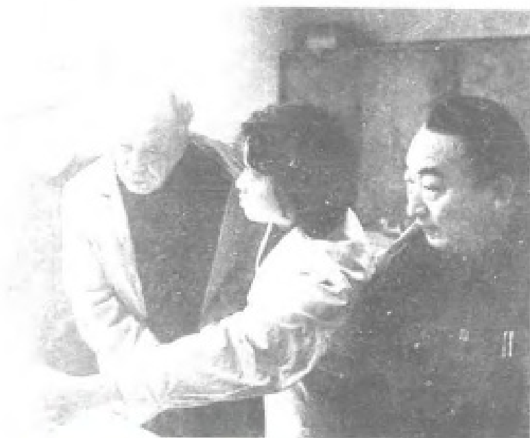
1985年1月11日,国务院副总理万里视察福州电信局程控电话设备