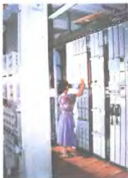
福州电信局光纤通信终端设备