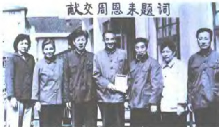
1981年1月，林卓午之子林孝祥向福建省邮电管理局局长邵峰云献出1940年5月9日周恩来题词：“传邮万里，国脉所系！”