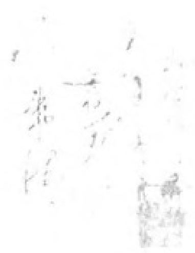
1929年5月，朱德军长题写的“所有书报信件业经检查，沿途友军准予通过”的手令