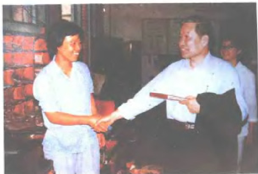
1985年10月11日， 邮电部部长杨泰芳视察 福建省邮件转运处