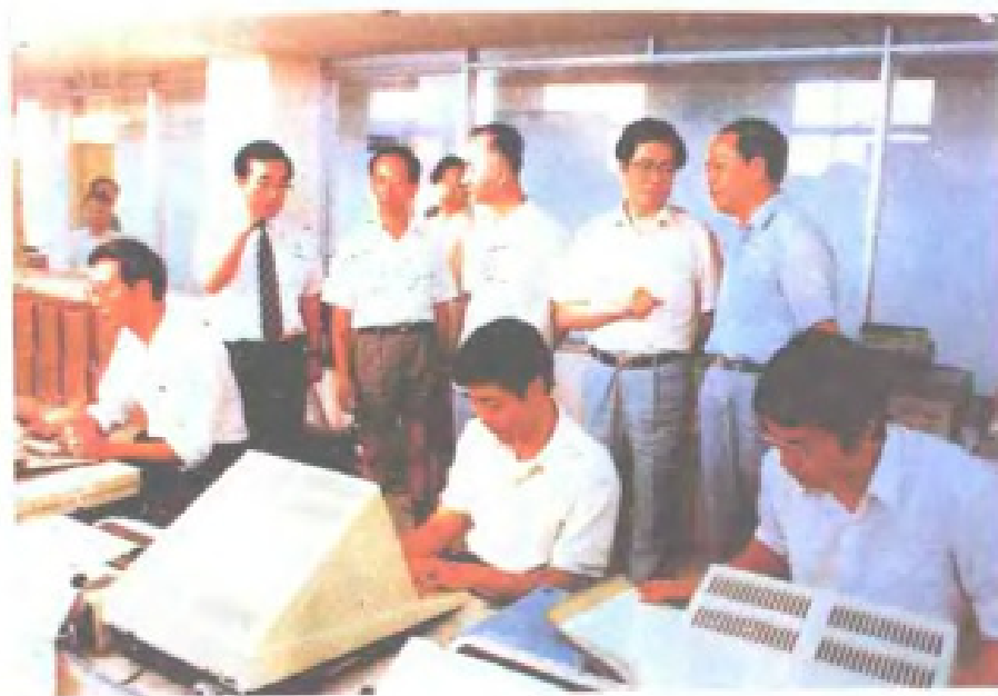
1989年6月，中共 福建省委书记陈光毅、 省长王兆国视察福建富 士通通信软件有限公司