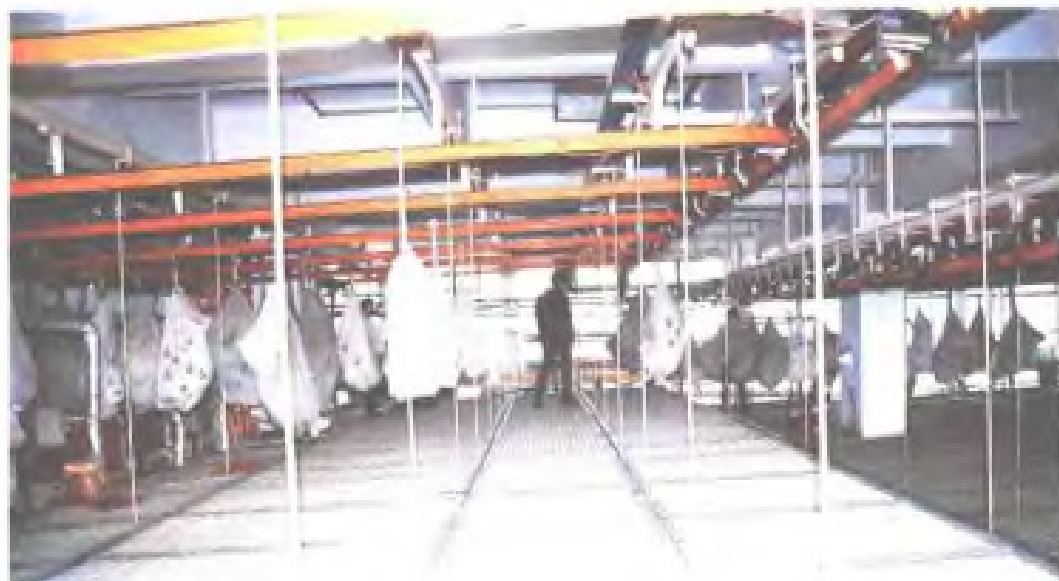
邮件总包推式悬挂分拣贮存系统