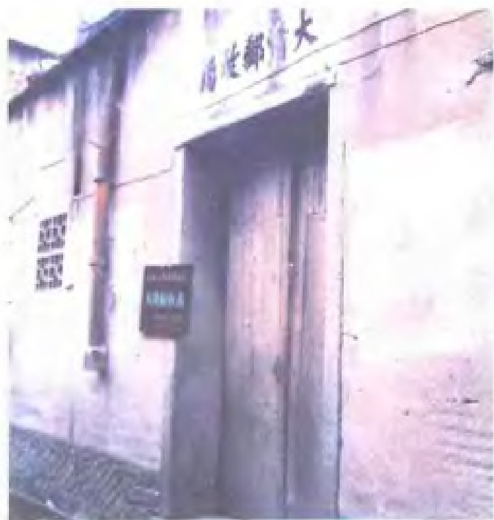
霞浦县大清邮政局旧址