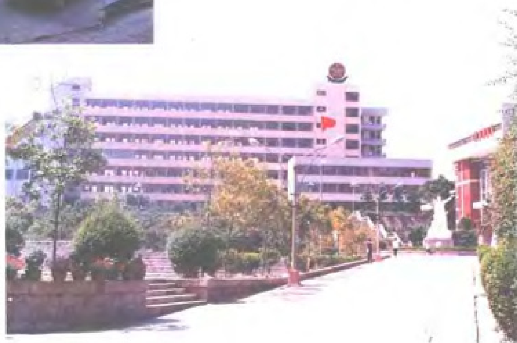
福建省邮电学校教学大楼