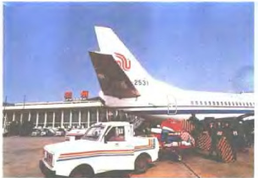
特快专递工作人员在福州机场迅速紧张地工作