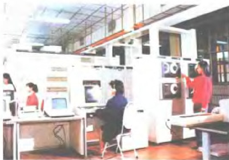
厦门市邮电局程控电话TS设备