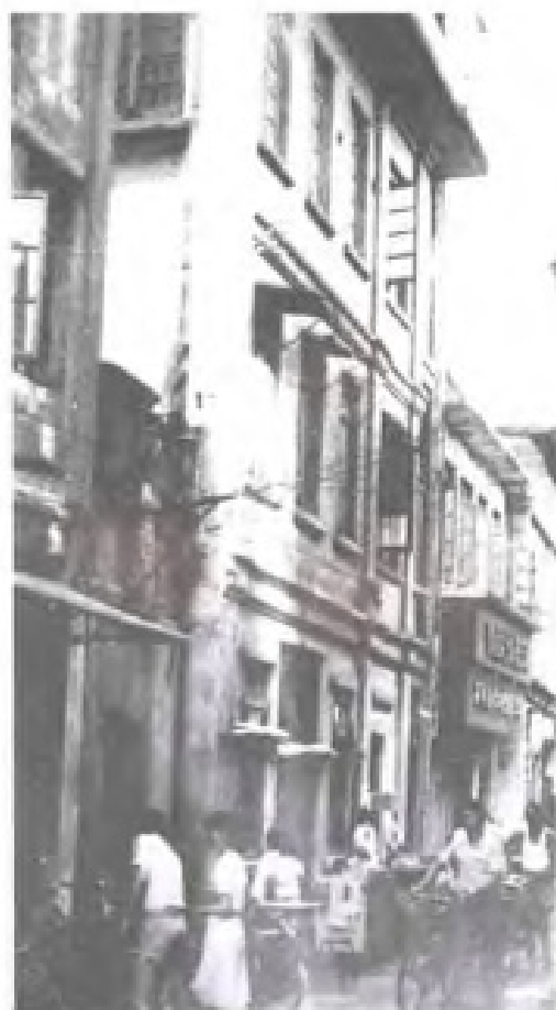
民国时期的厦门电话公司