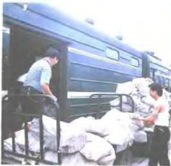
火车干线邮路交接邮件