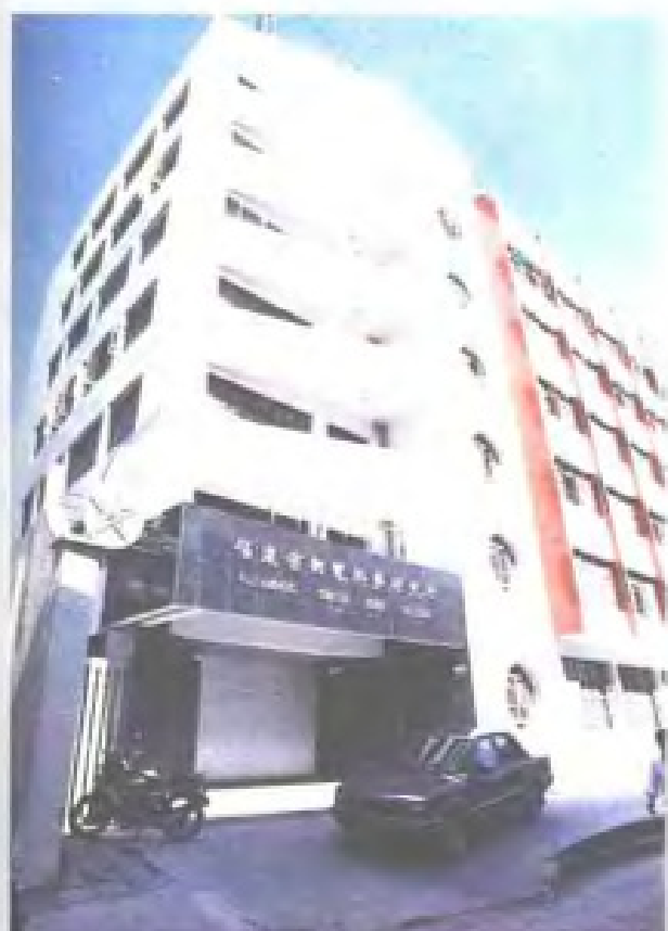
福建省邮电科学研究所