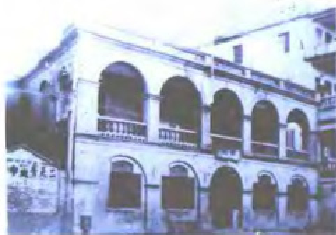
民国时期的厦门邮局