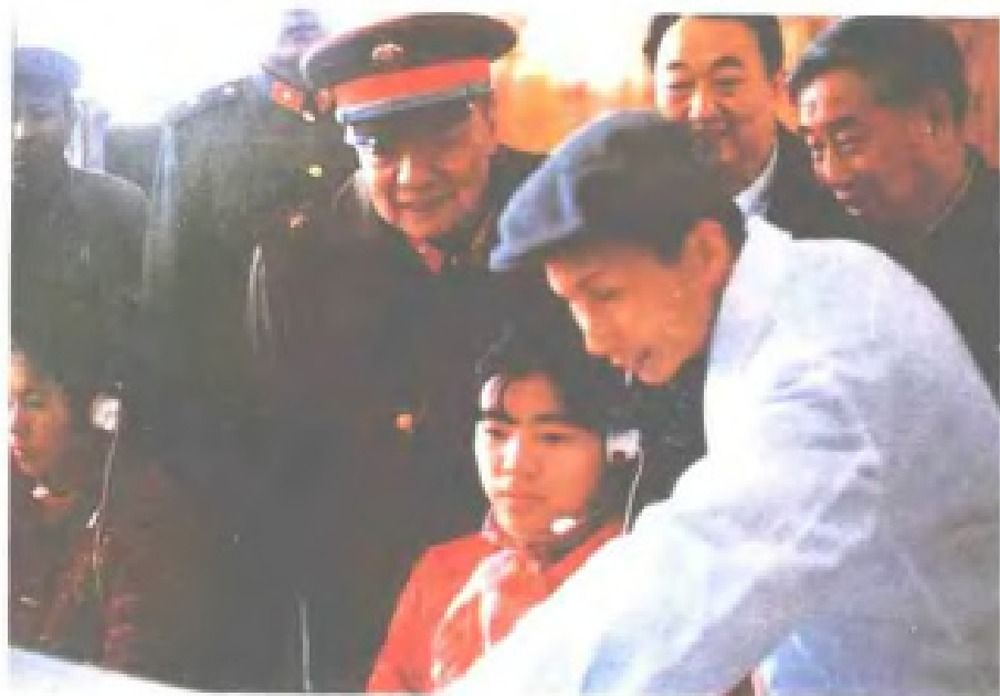
1986年2月8日,中央军委副主席杨尚昆视察福州电信局长途交换台