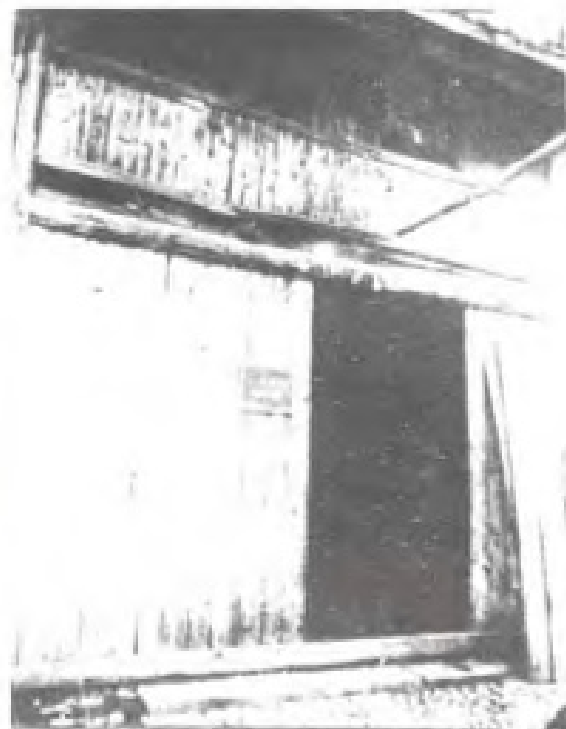
1932年，设在长汀县五通街的中华苏维埃福建省邮政管理局