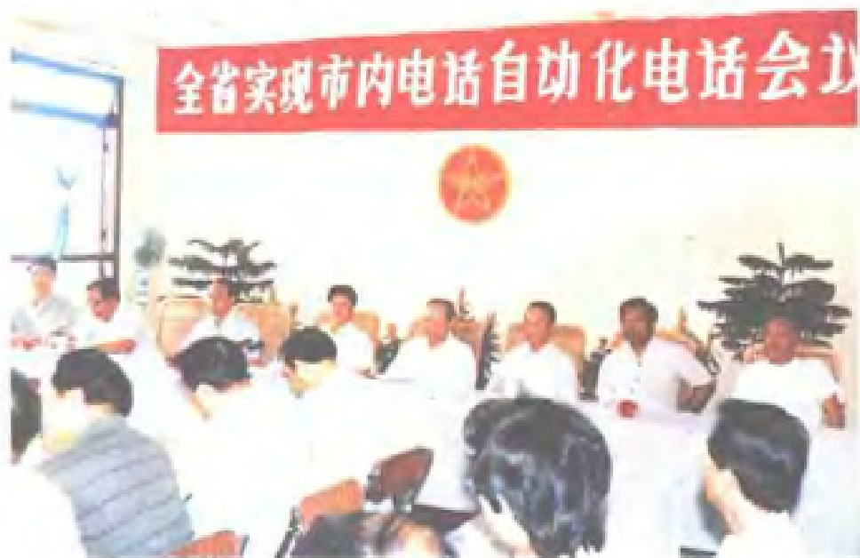
1988年6月28日,省政 府召开全省实现市内电话自动 化电话会议