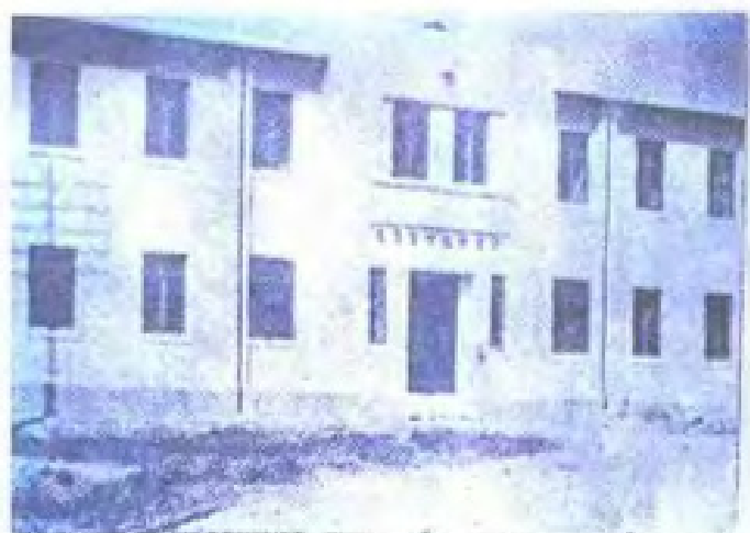
民国时期，设在福州东窑的福州电信指挥局