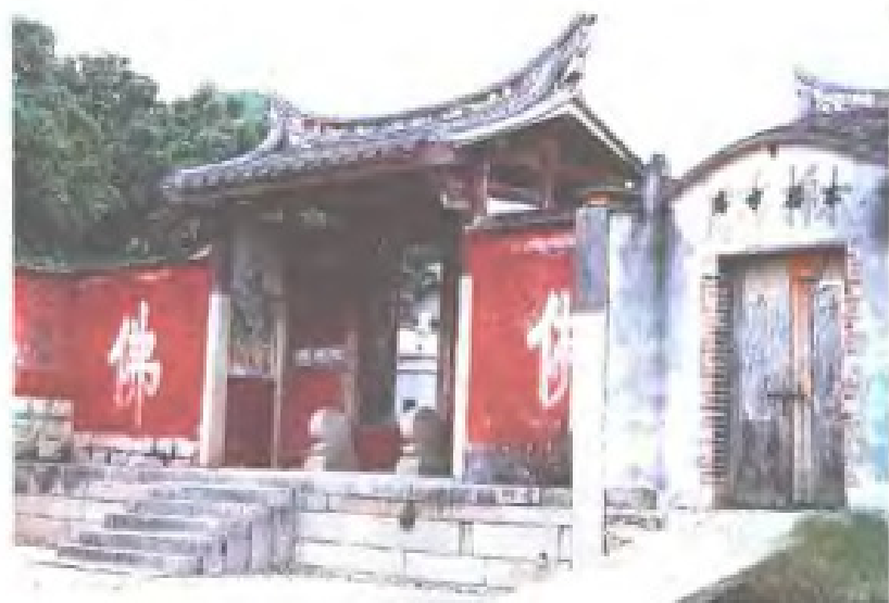
南宋淳熙末年,漳州到诏安驿路上随铺立庵,图为木栅古庵邮驿旧址