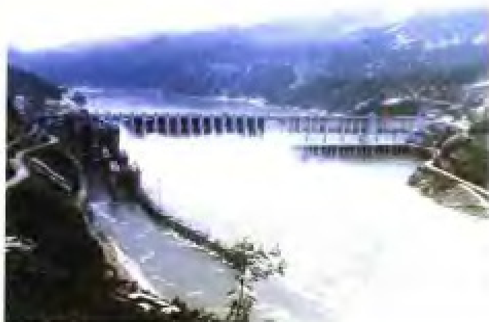
福建省“八五”计划重点建设项目之一——水口电站