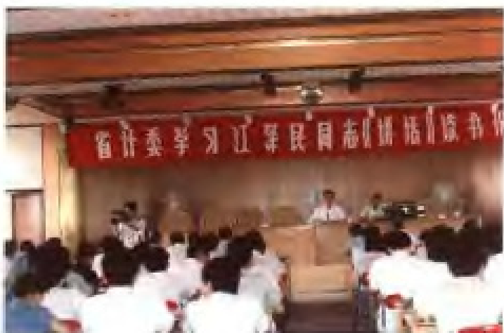
1998年4月，省计委举办读书班