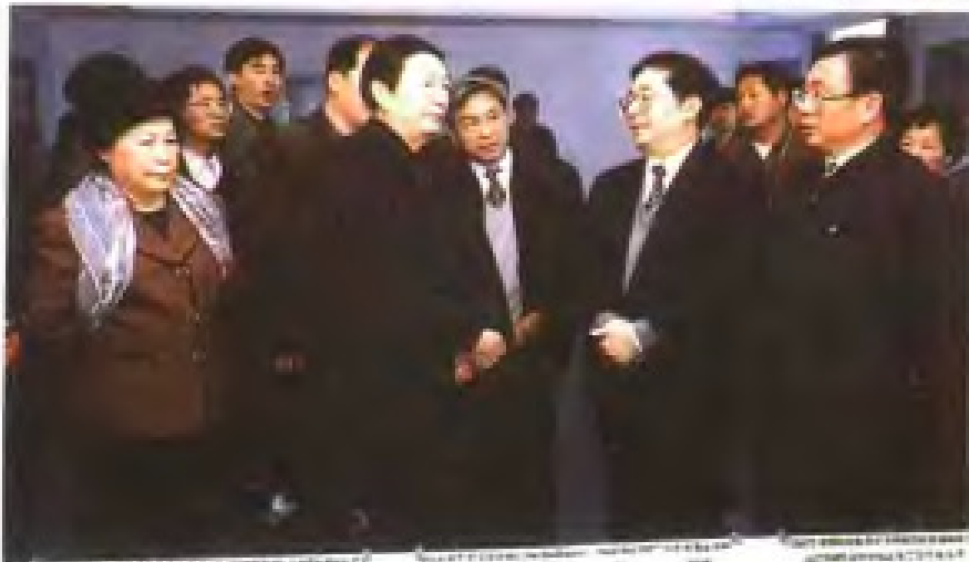
1999年，国务院总理朱镕基视察厦门 国际会展中心建设工程