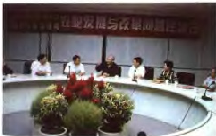
1996年8月，召开福建省海洋经济发展 规划纲要专家研讨会