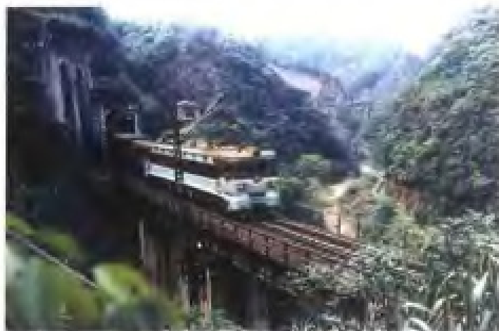
福建省“七五”计划重点建设项目之一——鹰厦铁路电气化工程