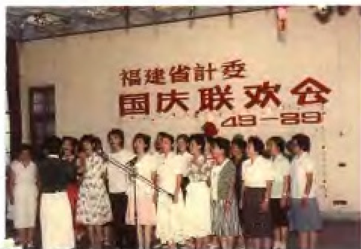
1989年，省计委举办国庆40周年联欢会