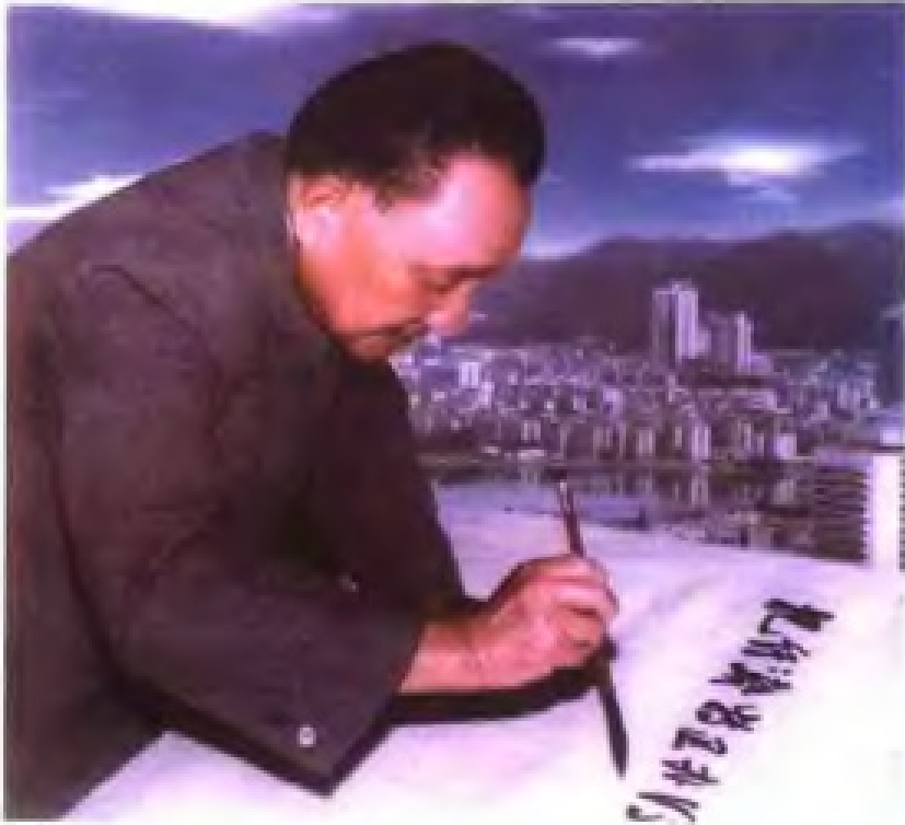
1984年，邓小平同志视察厦门经济特区