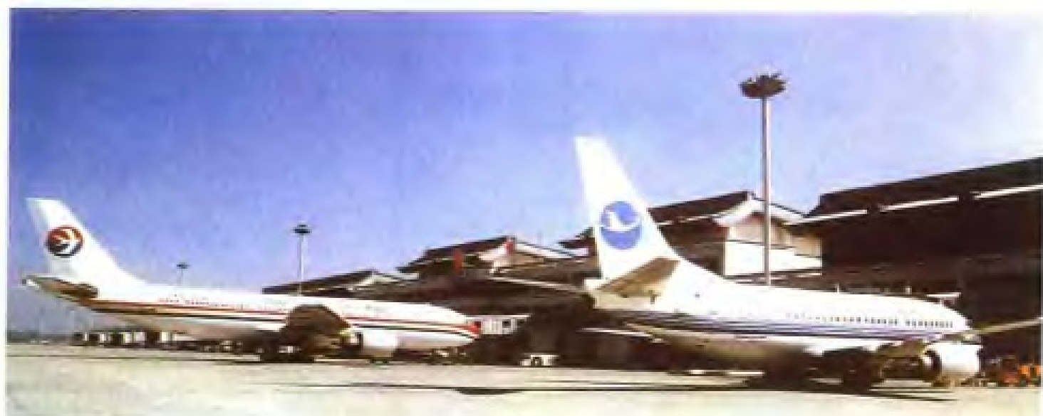
福建省“八五”计划重点建设项目之一——福州长乐国际机场