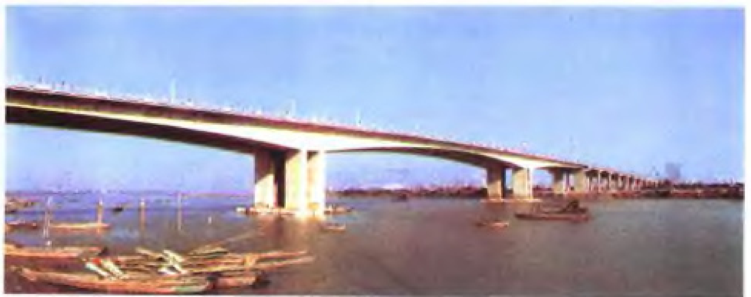
福建省“七五”计划重点建设项目之一——泉州刺桐大桥