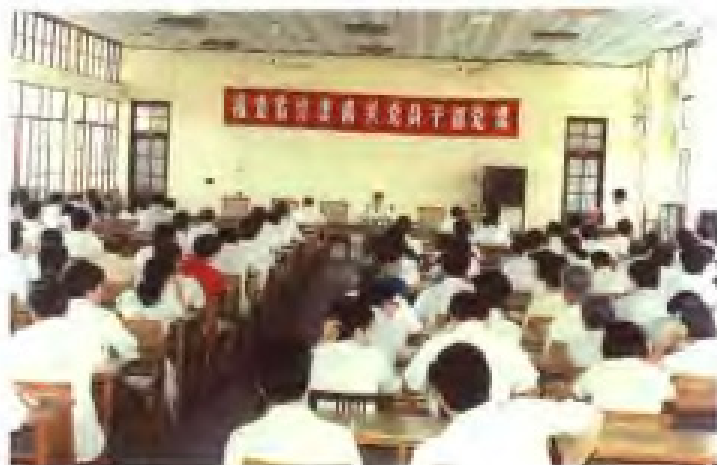
1988年7月，福建省计委机关党员干部上党课