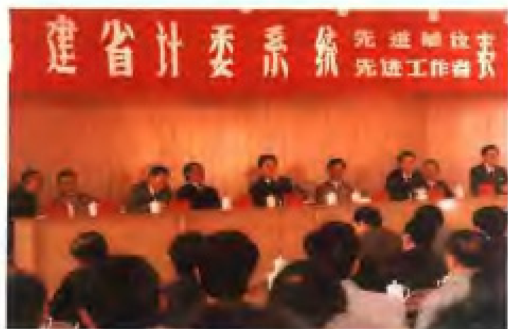
1990年12月，召开福建省计委系统表彰会