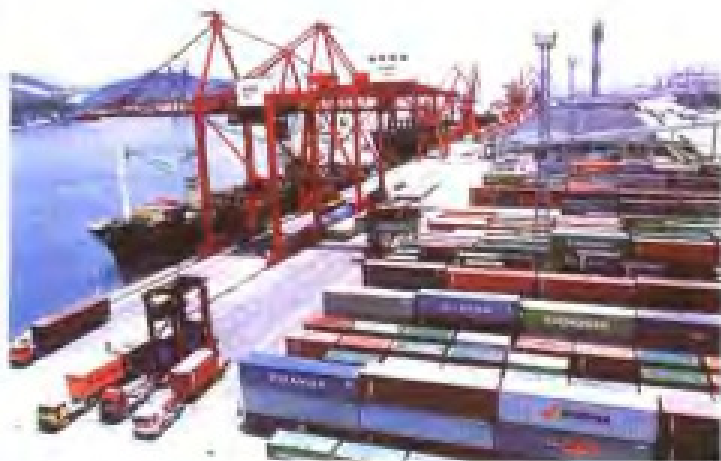
福建省“七五”计划重点建设项目之一——厦门东渡港