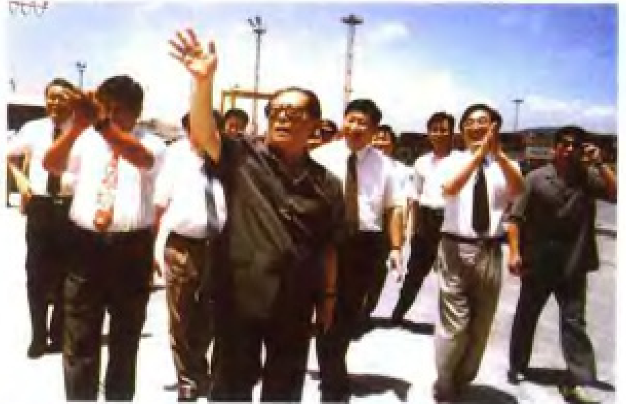
1994年，中共中央总书记江泽民 视察福州经济技术开发区