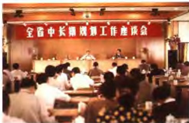
1993年，省计委召开全省 中长期规划工作座谈会