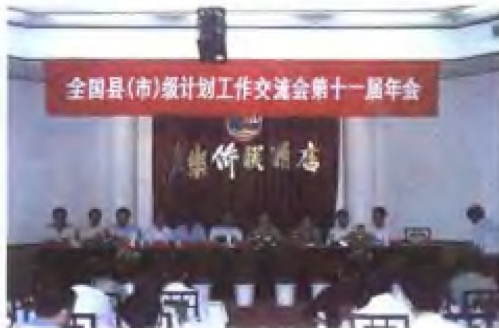
1999年10月，全国县(市)级计划工作 交流会年会在长乐市召开