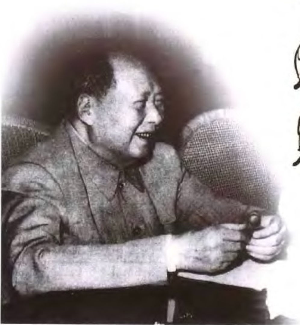
1964年，毛泽东为《福建日报》题写报名