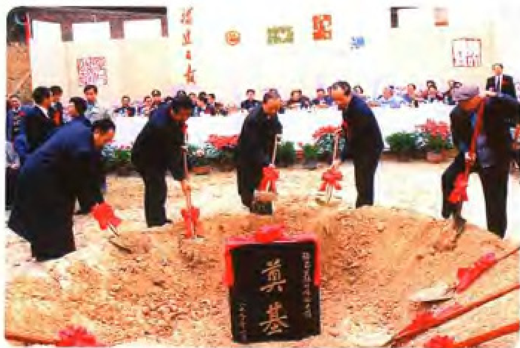
1990年10月，福建省领导为《福建日报》采编大楼奠基