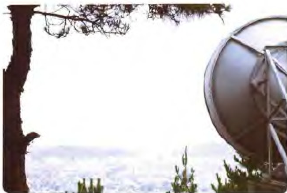
厦门西姑岭微波站