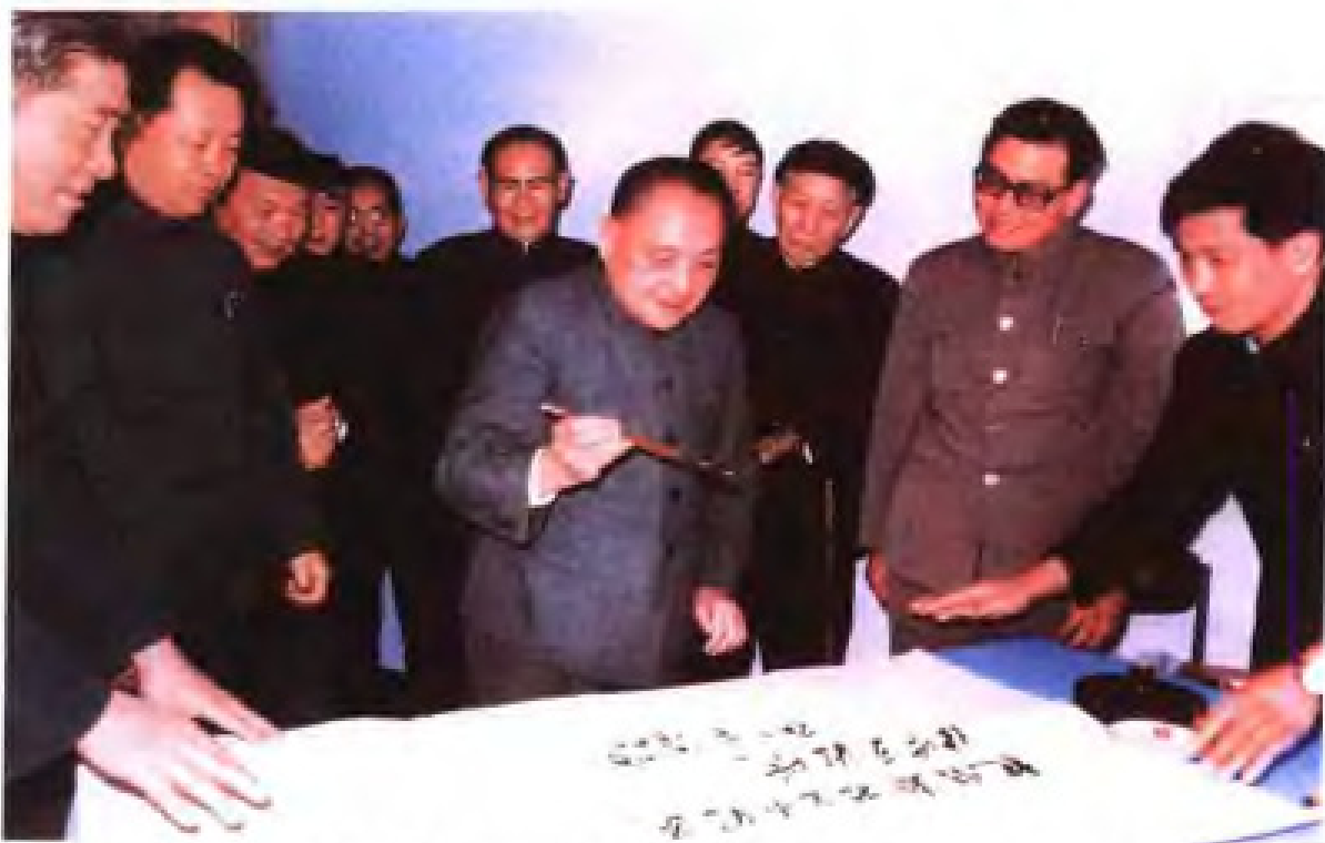
1984年2月,邓小平视察厦门经济特区时,题写“把经济特区办得更快些更好些”