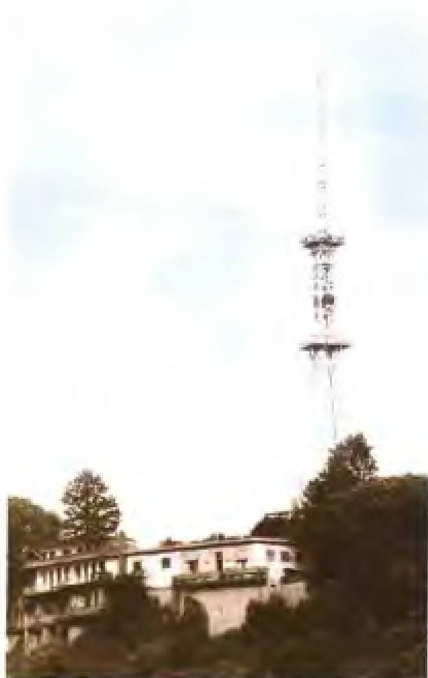
20世纪70年代初建立在福州乌山的广电发射塔