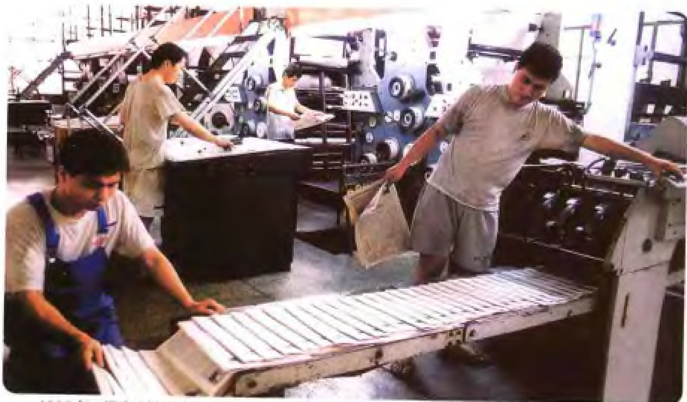
1989年，福建日报社引进彩色印刷机生产线