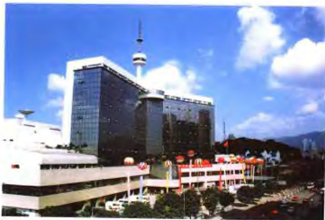
1991年福建广播电视大楼建成