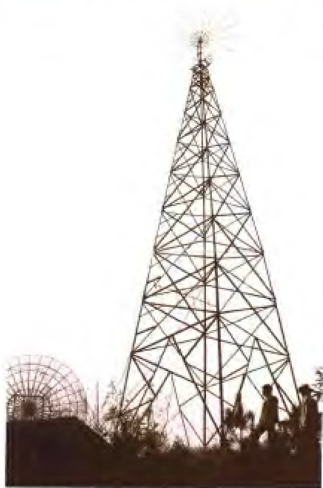
浦城县所建本省第一个卫星地面接收站