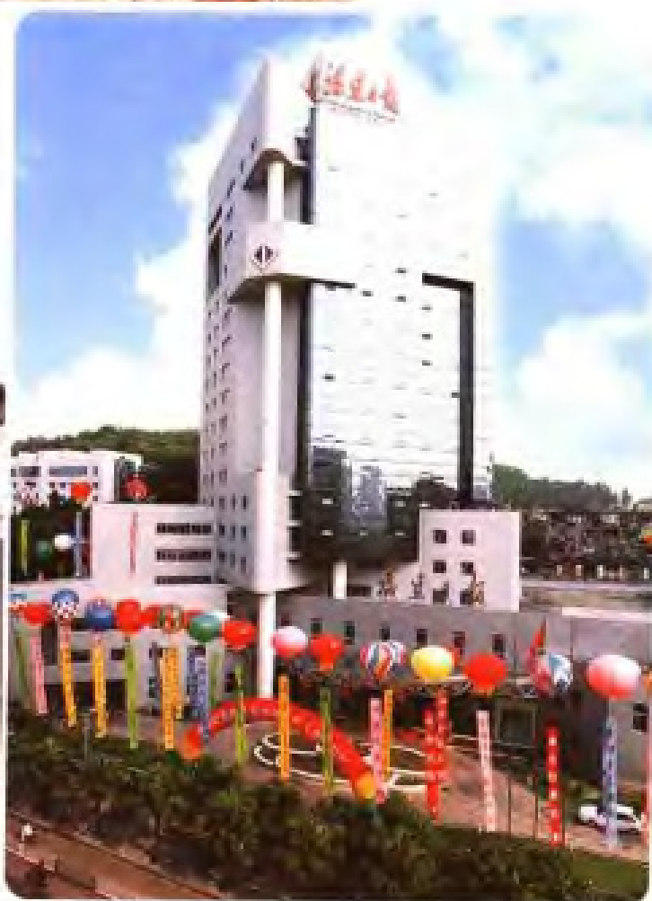
《福建日报》采编大楼