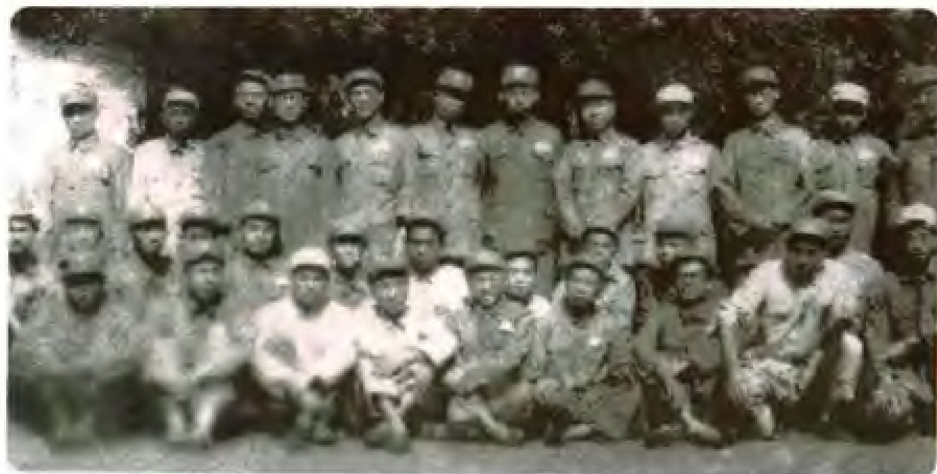
1949年7月，随军南下准备创建《福建日报》、福建人民广播电台、新华社福建分社的新闻中队在浙江省江山县新塘边村合影