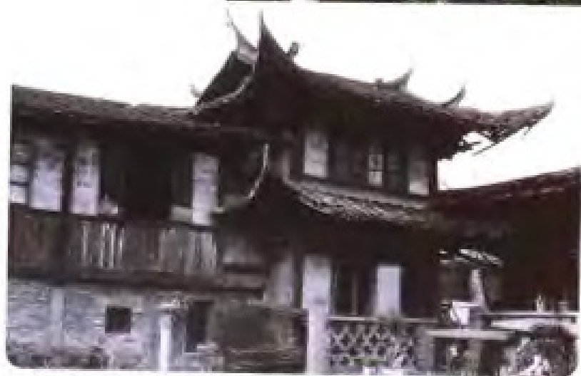
抗日战争时期福建广播电台在永安的台址