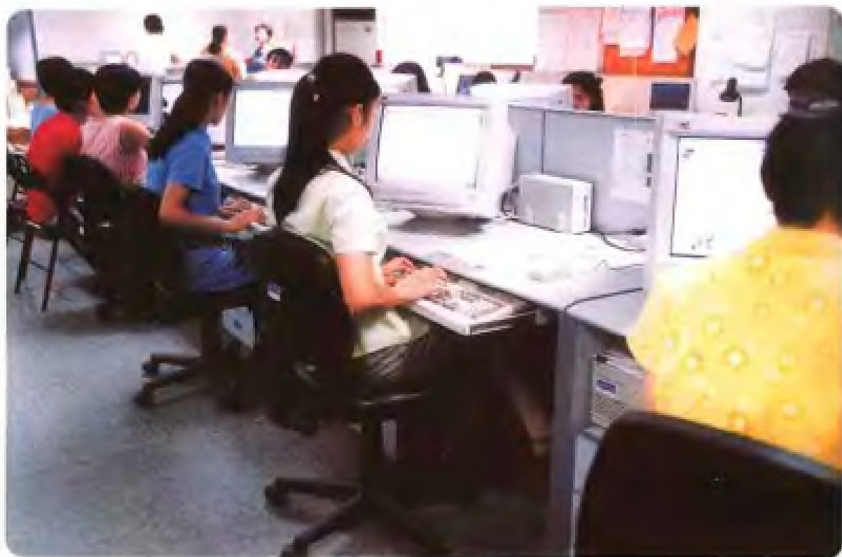
20 世纪 90 年代报业普遍使用电脑录排