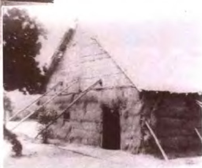
该草棚是建台初期的会场兼饭堂