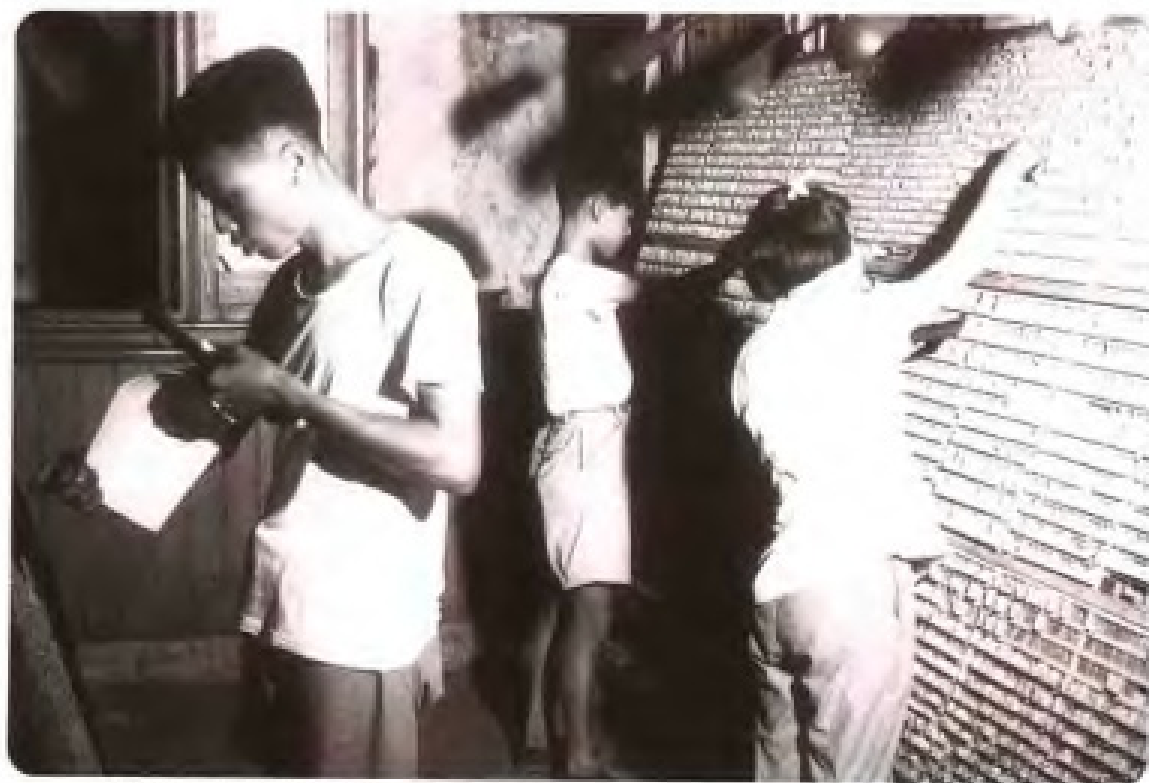
早期报业工人手工排字