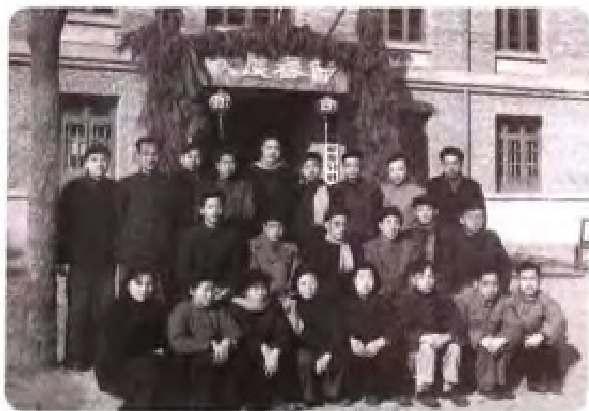
1963年新华通讯社 福建分社工作人员合影