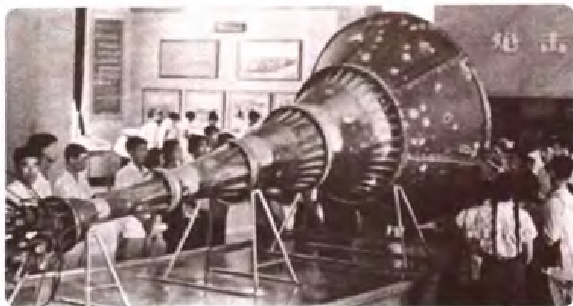
中国军事博物馆收藏的海峡之声广播电台大喇叭