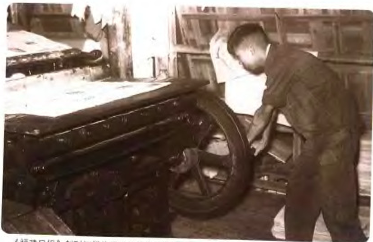
《福建日报》创刊初期使用手摇平板机印刷