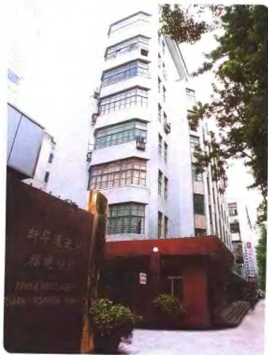
新华通讯社 福建分社办公楼