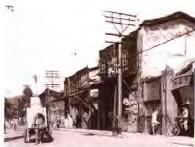
1949年，《福建日报》初创时的社址(图右)