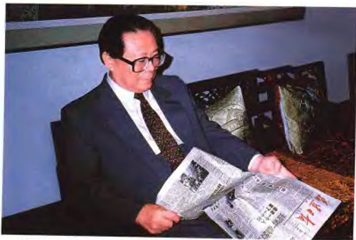
1994年6月,江泽民来闽视察时阅读《福建日报》