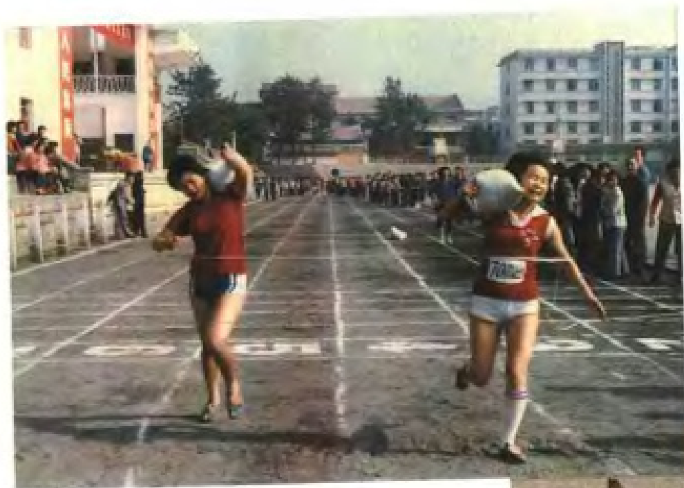
◀ 1986年莆田县农民运动会 (图为女子100米负重赛跑决赛)