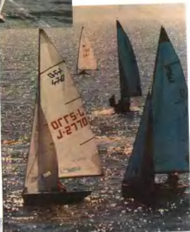
▶ 活跃在集美海域的省帆船队