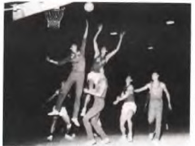
▲ 60年代，福建男篮以小个打大个而闻名全国，受到中共中央和贺龙副总理的表彰（图为与四川队的比赛）