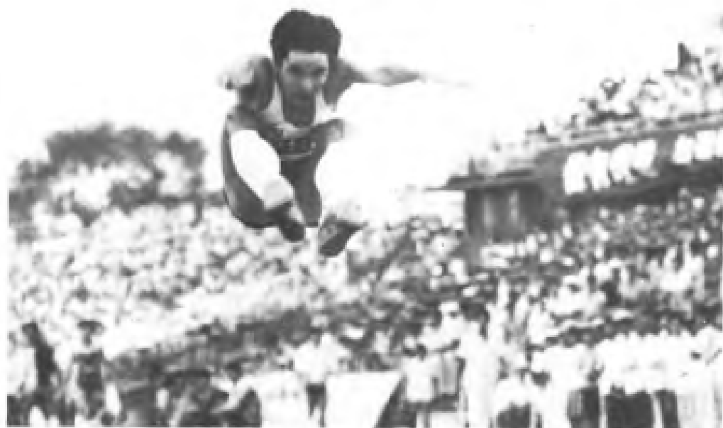
▲ 亚洲跳远纪录创造者—刘玉煌