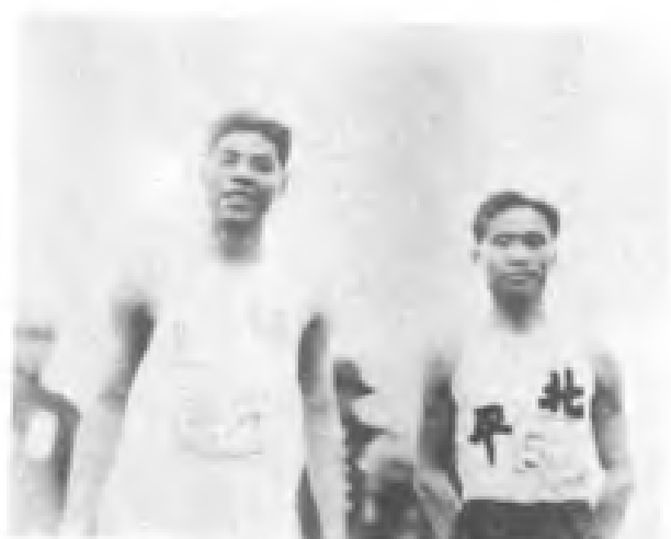
▲ 1930年中华民国第4届运动会男子110米高栏冠军—林绍洲(左)