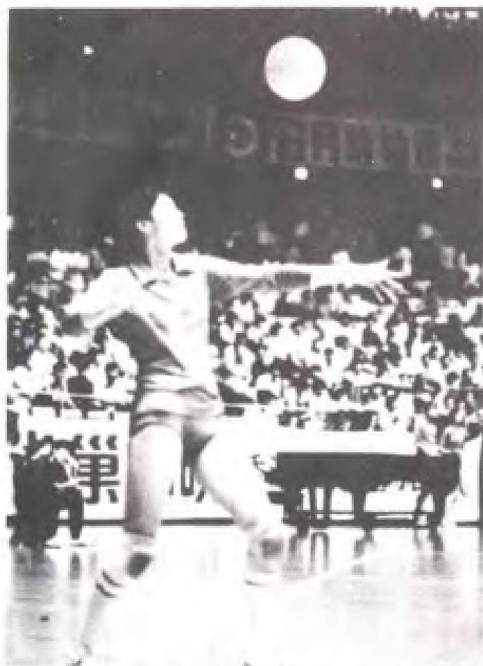
▲著名排球运动员侯玉珠在比赛中