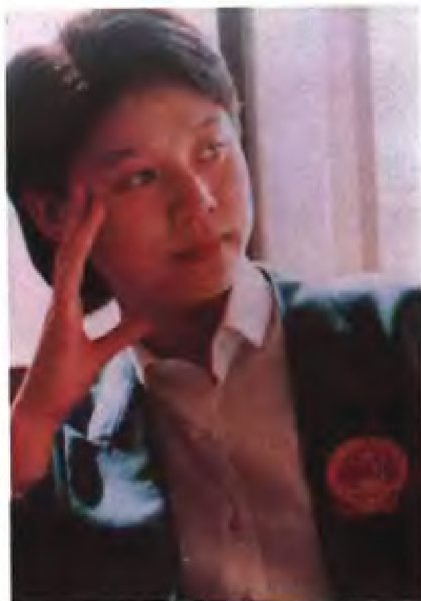
▲乒乓球名将—陈子荷