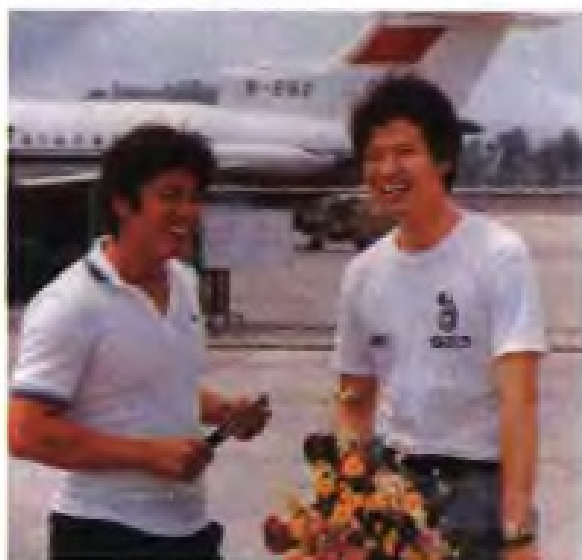
▼乒乓球世界冠军郭跃华（左）陈新华（右）