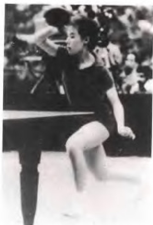
▲ 1975年郑怀颖作为中国女子乒乓球队队员参加第33届世界乒乓球锦标赛，荣获女子团体冠军