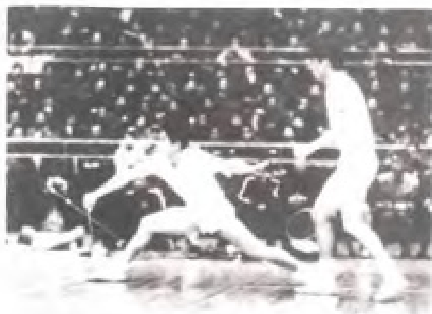
▲著名羽毛球运动员杨仙虎（前）在接网前球，后者林诗铨