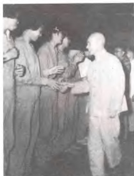
▲张鼎丞、陆定一接见福州军区、福建省女子篮球队