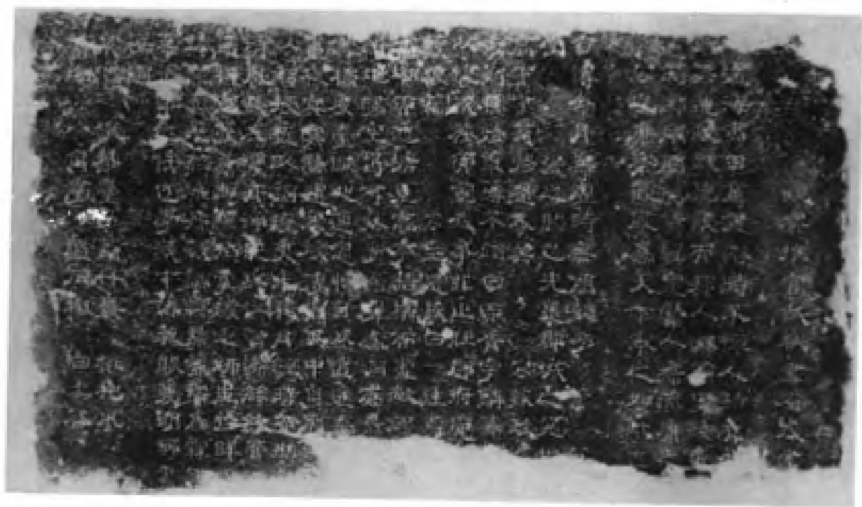
◀ 唐元和八年《球场山亭记》残碑拓片