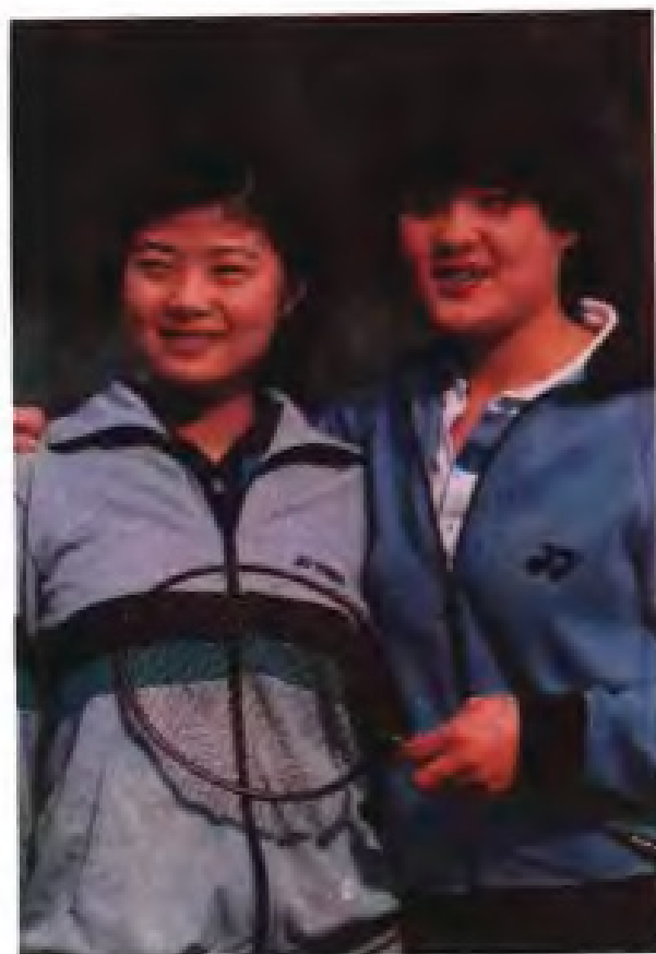
▲女子羽毛球双打世界冠军 林瑛（右），吴迪西（左）