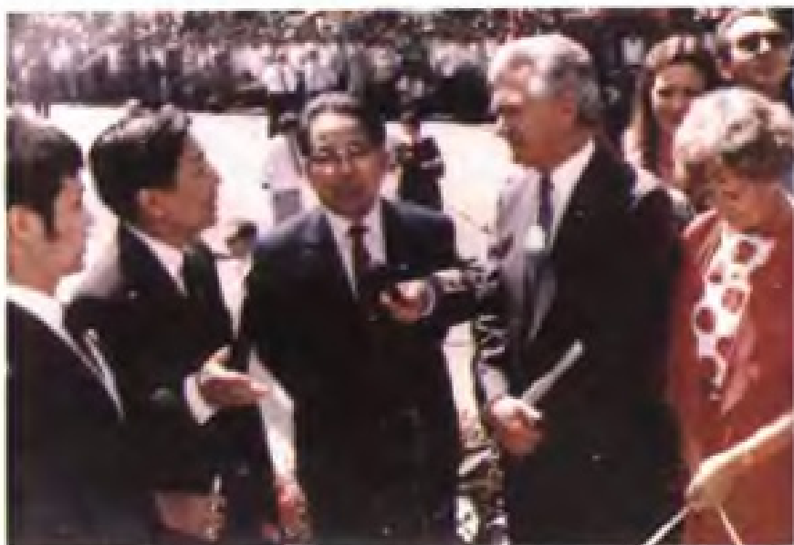
▲澳大利亚总理霍克（右二）和夫人由省长胡平陪同参观漳州体育训练基地