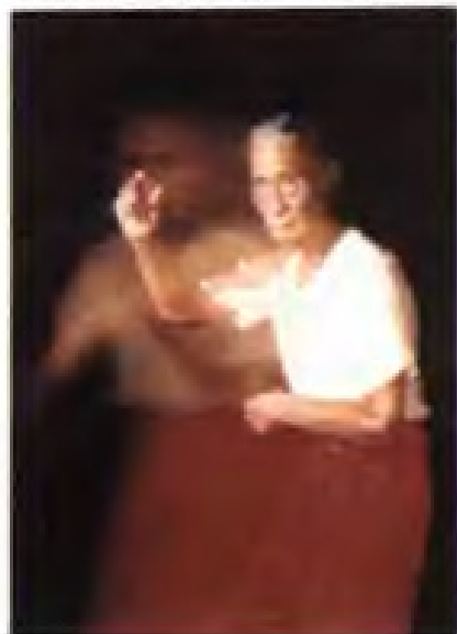
▼著名老武术家——万籁声