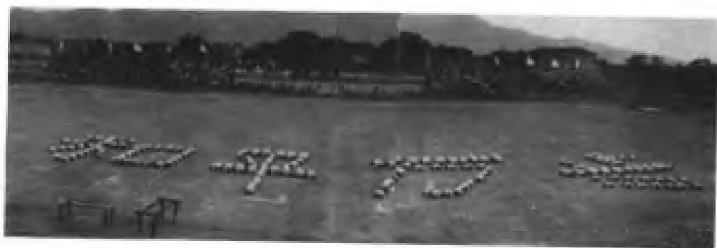
◀ 1952年福建省首届人民体育运动大会团体操组字“和平万岁”