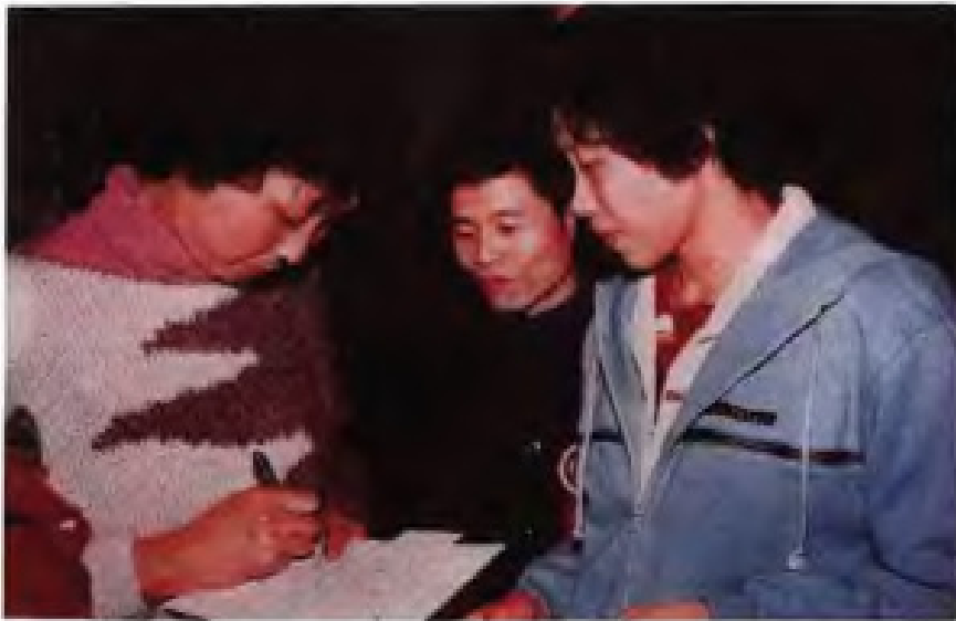
◀ 女子排球著名运动员陈亚琼（左一）郑美珠（右一）为群众签名