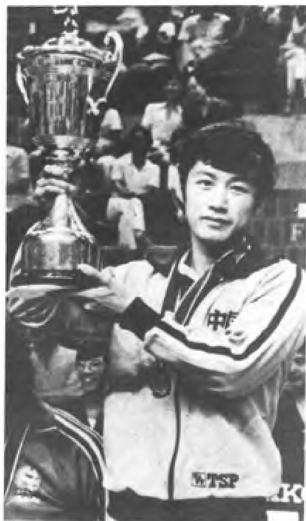
▲ 1981年郭跃华夺得36届世界乒乓球锦标赛男子单打冠军 右图：郭跃华高举“斯韦思林杯” 左图：郭跃华在比赛中