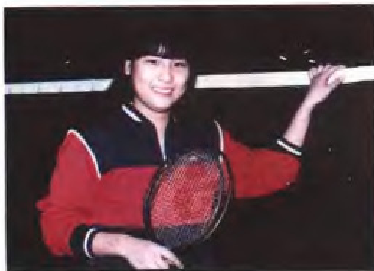
▲女子羽毛球世界冠军—郑昱鲤