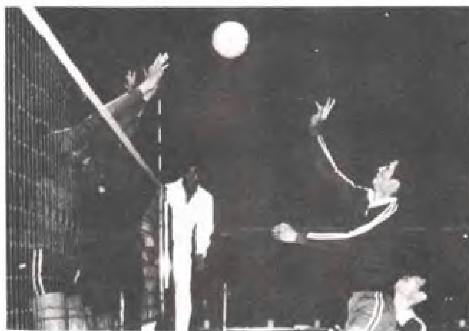
◀被誉为网上飞人的男排网手汪嘉伟