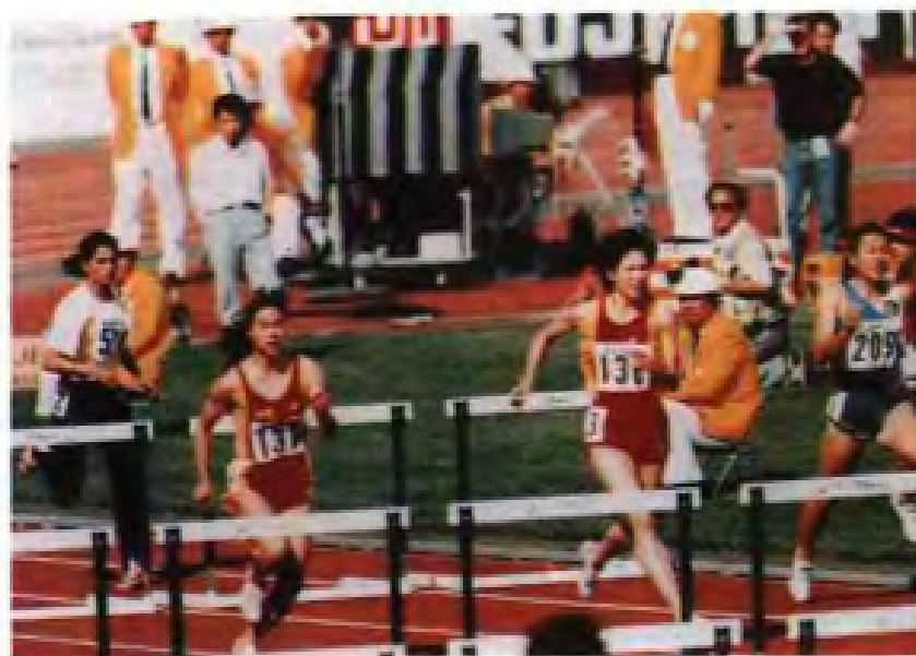
▲女子100米栏亚洲纪录创造者—刘华金（右二）