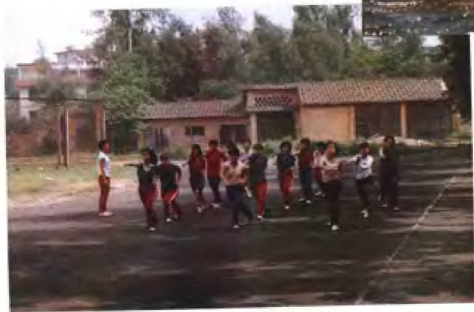
◀ 福建师大体育系武术教学课