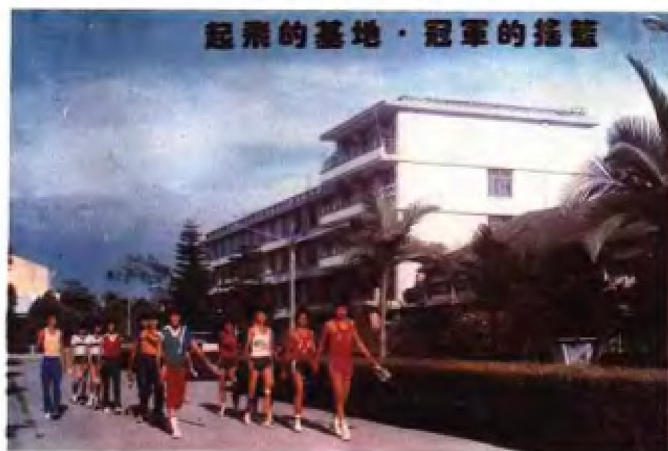
◀ 漳州体育训练基地