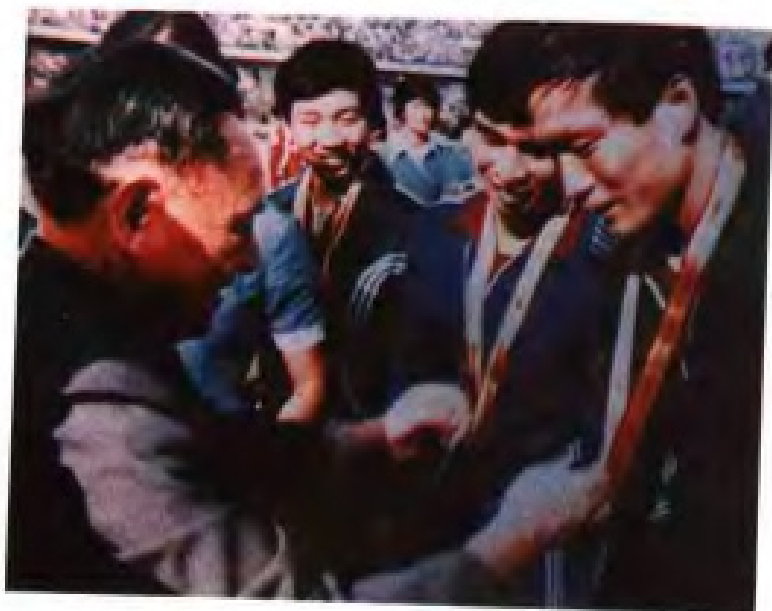
▲ 邓小平为福建羽毛球运动员秦劲（右一）、林义雄（右三）颁奖