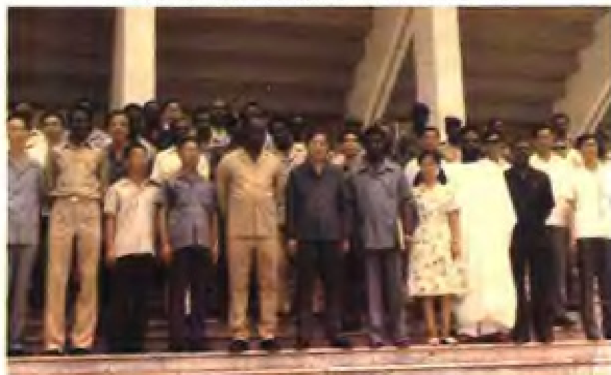
◀1982年贝宁总统克雷库（前排左五）视察我国援建（福建承建）的贝宁友谊体育场（前排左六为中国驻贝宁大使张俊华，左四为专家组组长慕香亭）