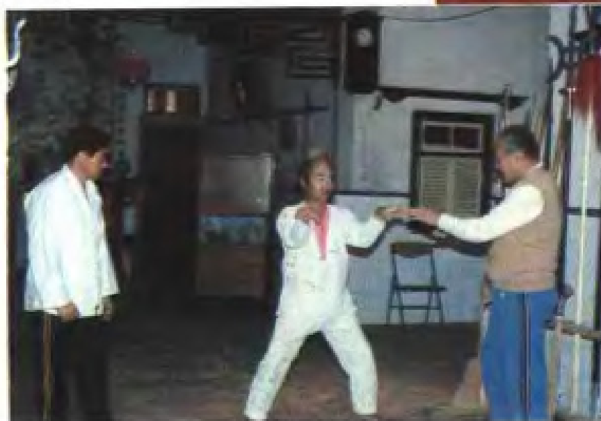
◀ 友人传授武术 石狮市侨乡回术馆向日本