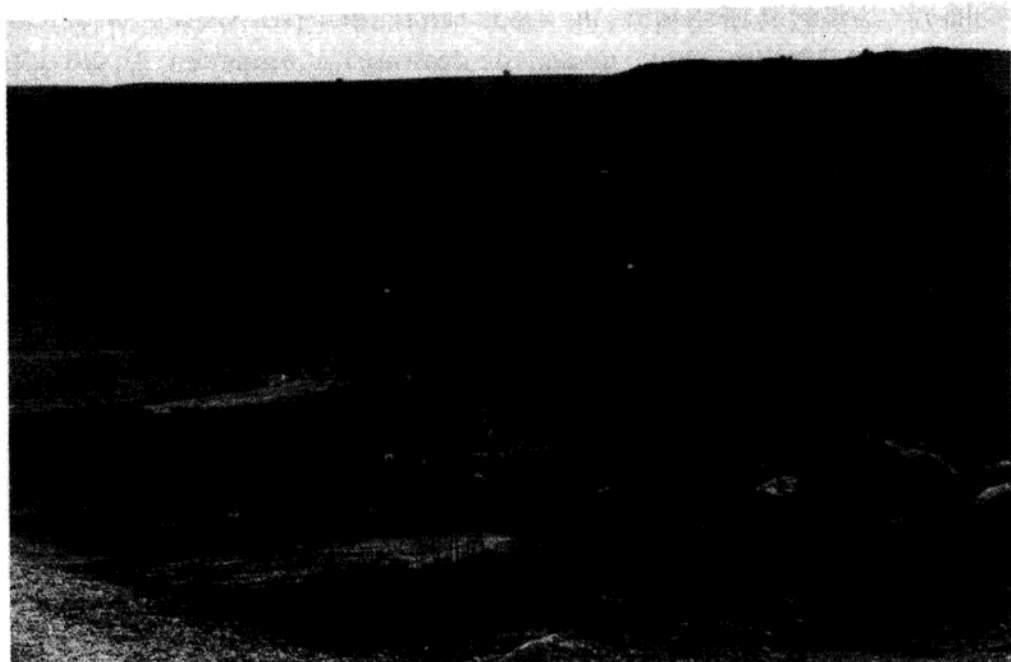
图 1.1 位于摩苏尔附近的圣以利亚(Saint Elijah)修道院,修建于 595 年。GNU Free Documentation 许可

阿拉伯人之所以能够轻易征服萨珊波斯,除了后者因与拜占庭的战争而变得明显衰弱外,还在于萨珊波斯对待阿拉伯封臣的政策。大多数阿拉伯人在接受伊斯兰教之前,分属大小不等的各个部落,他们的凝聚力建立在拥有共同的祖先和鼓励内部通婚而产生的家族观念之上。阿拉伯各部落在展现其同质性的同时,对外族人的接纳实际上却十分开放,外族人逐渐获得了完全的地位,被视为部落的一分子。尽管一个部落只承认唯一的领袖,即最高的“长老”(shaykh),但每个部落里还包括几个次一级的群体,它们之间并不总是友善的关系。沙漠中可放牧土地的匮乏,会引发地方性的部落冲突及一种好战的文化。