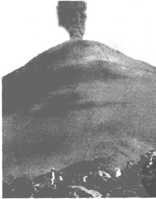
伊萨尔科火山（Izalco）最后一次喷发在 1966 年。萨尔瓦多有 100 多个火山，伊萨尔科就是其中之一。（《国家地理杂志》照片，1922 年 2 月）