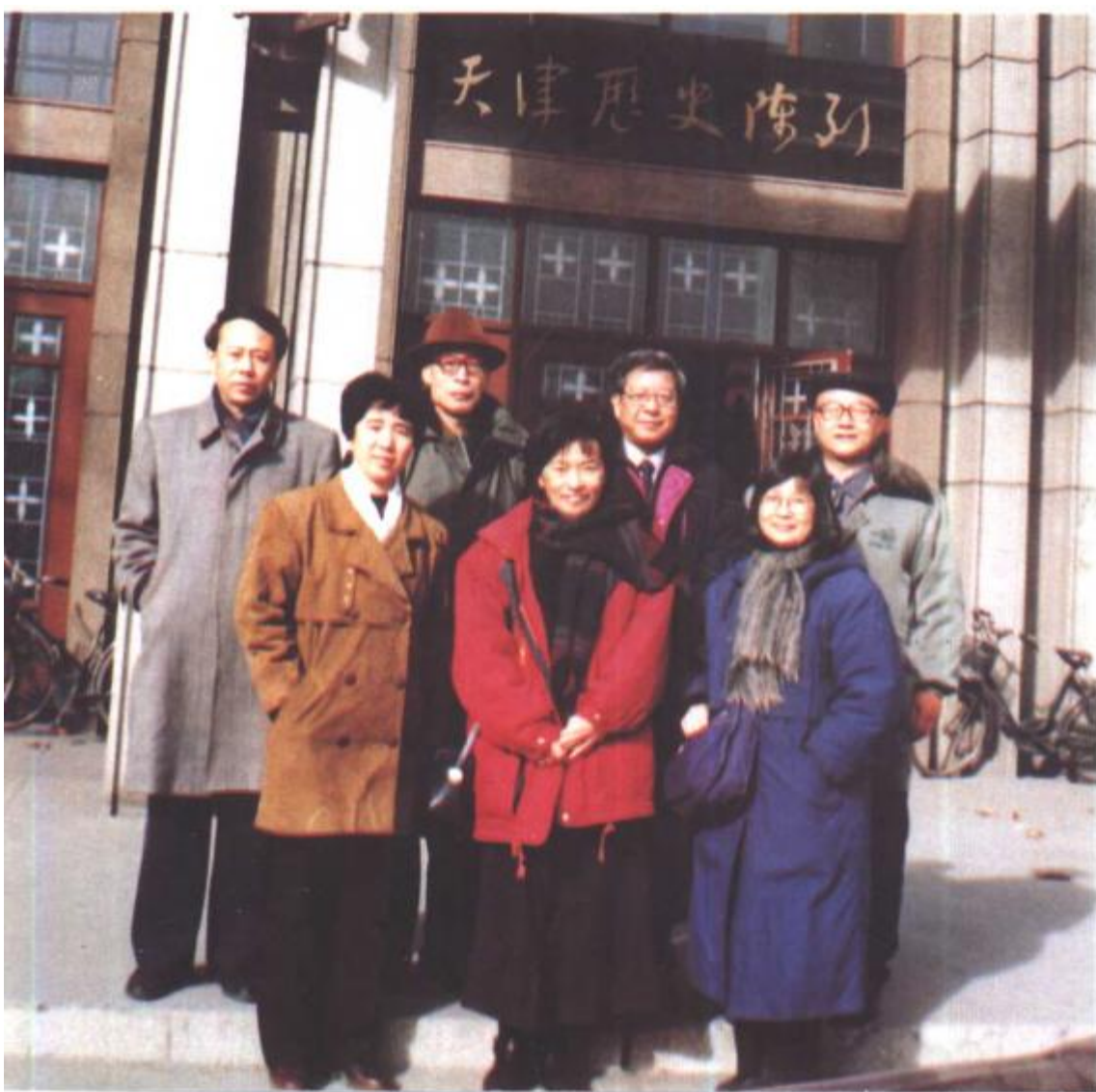
1998年元月3日, 与会部分学者参观天津历史博物馆时合影