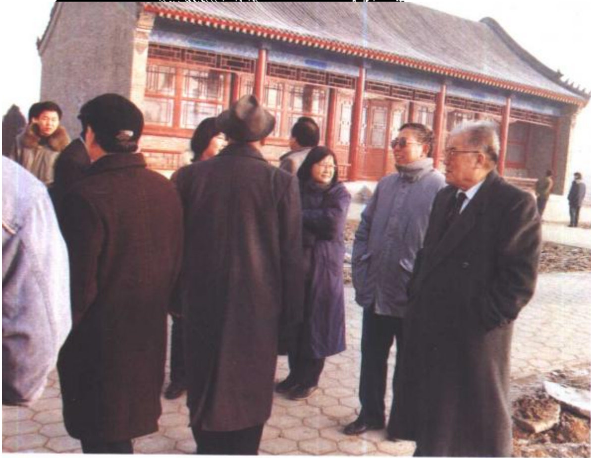
1998年元月2日， 与会学者参观西青区 霍元甲墓