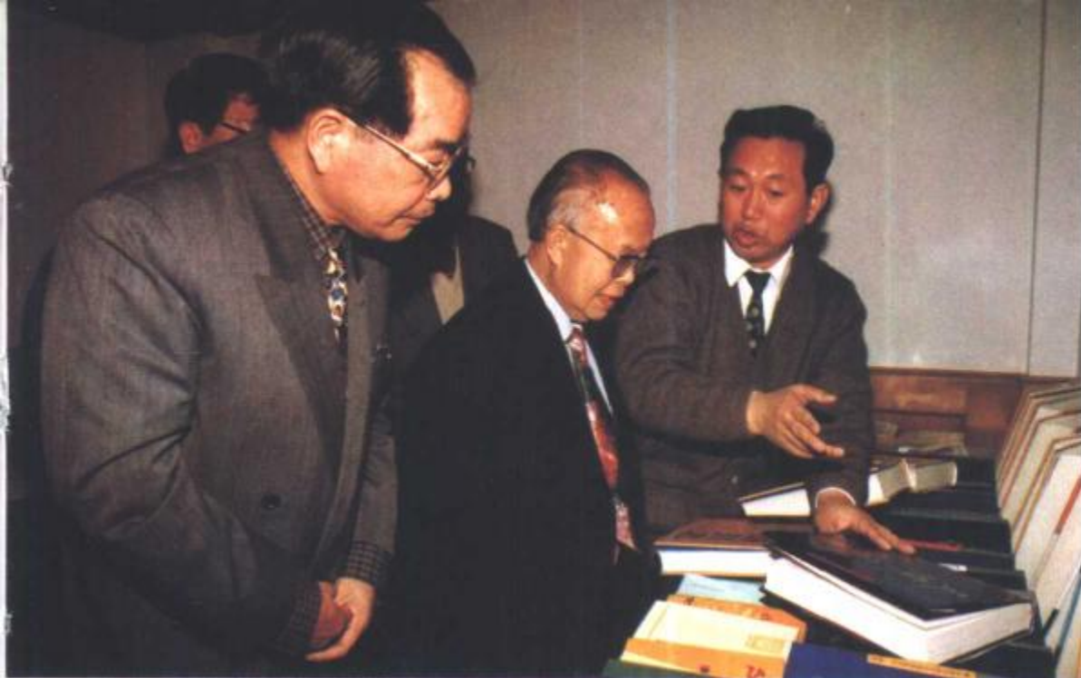
1997年12月29日， 与会学者参观天津市地 方志书成果展览