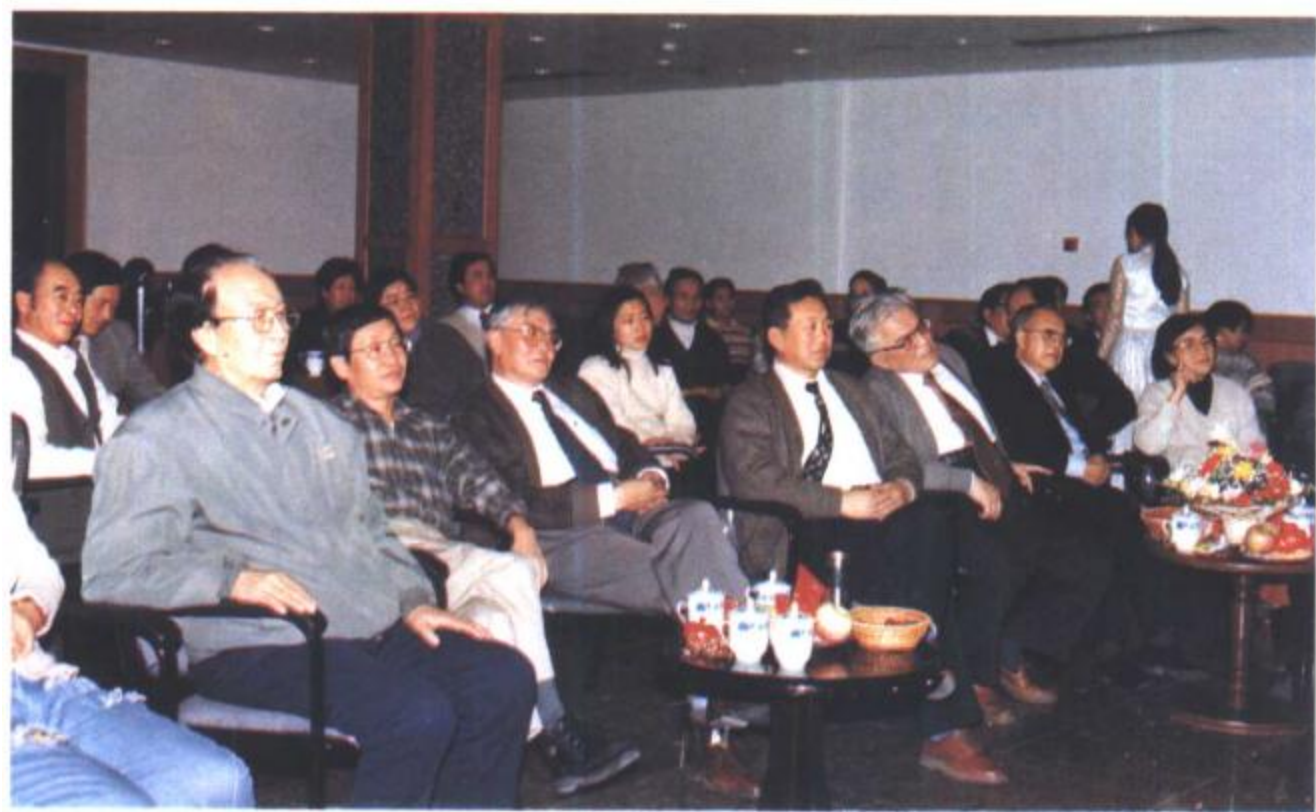
1997年12月30日 晚上，与会学者观看天 津曲艺学校的演出