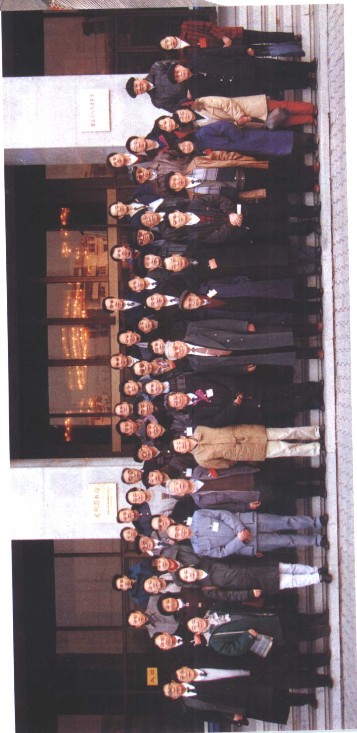
1997年12月30日，与会学者参观天津图书馆时合影