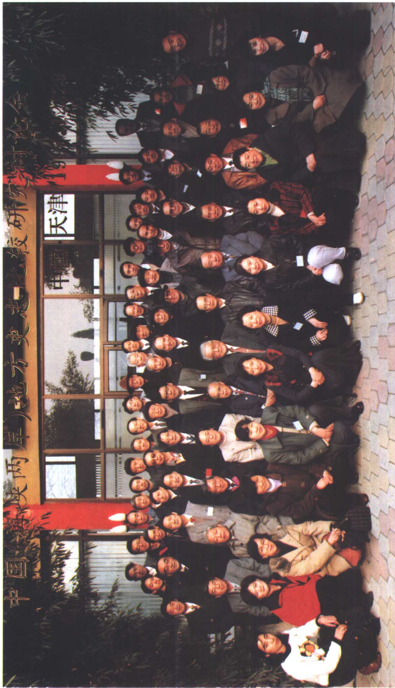
与会全体人员合影