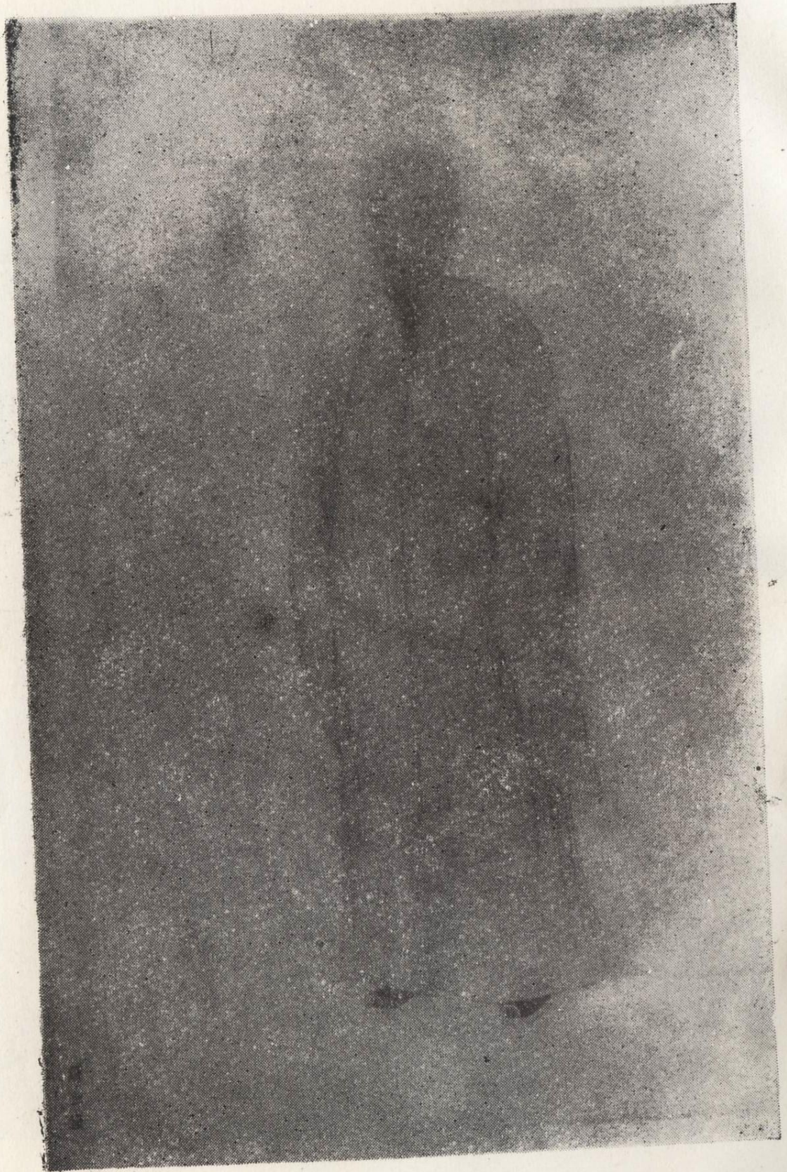
圖一 蔣士銓像 (據《清代學者像傳》複製)