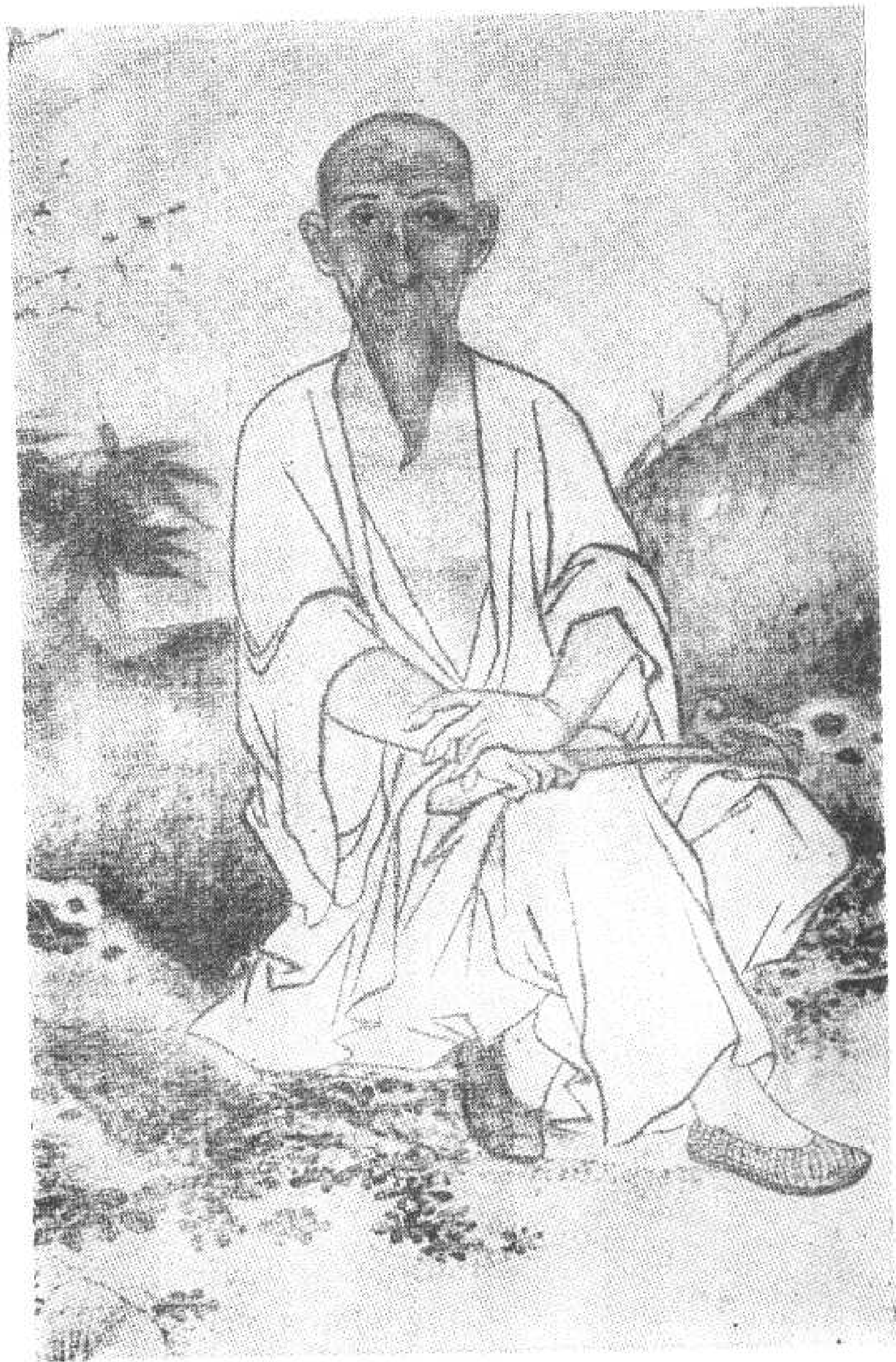
圖一 顧炎武像 禹之鼎繪 (據李平書《且頑老人自訂年譜》插頁複製)