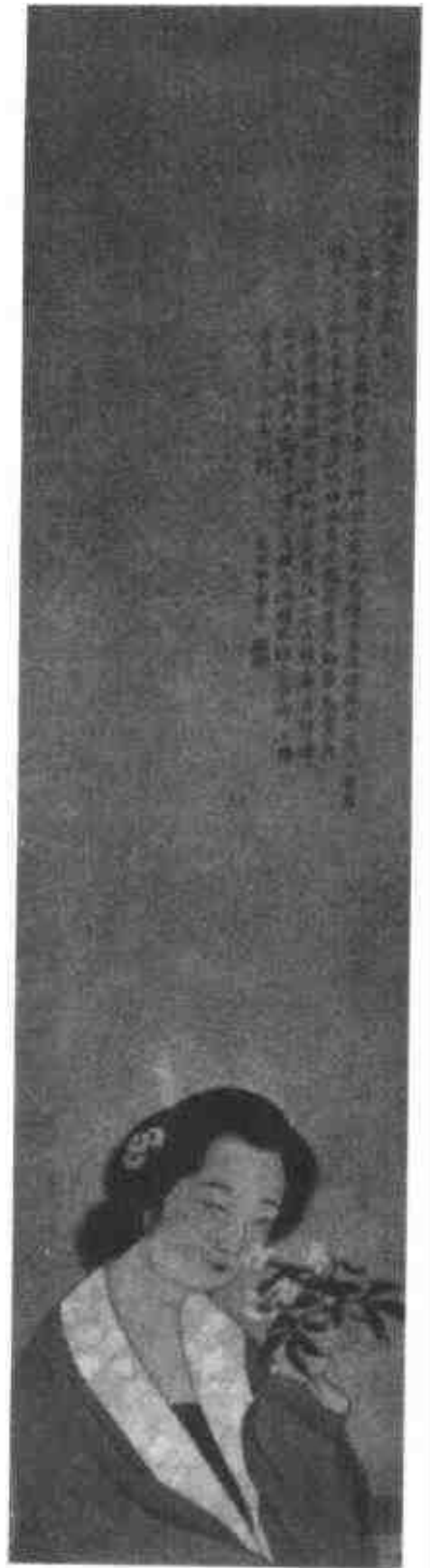
李清照醉照春去圖照