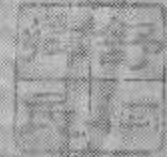
劉大櫟八家園點評書影