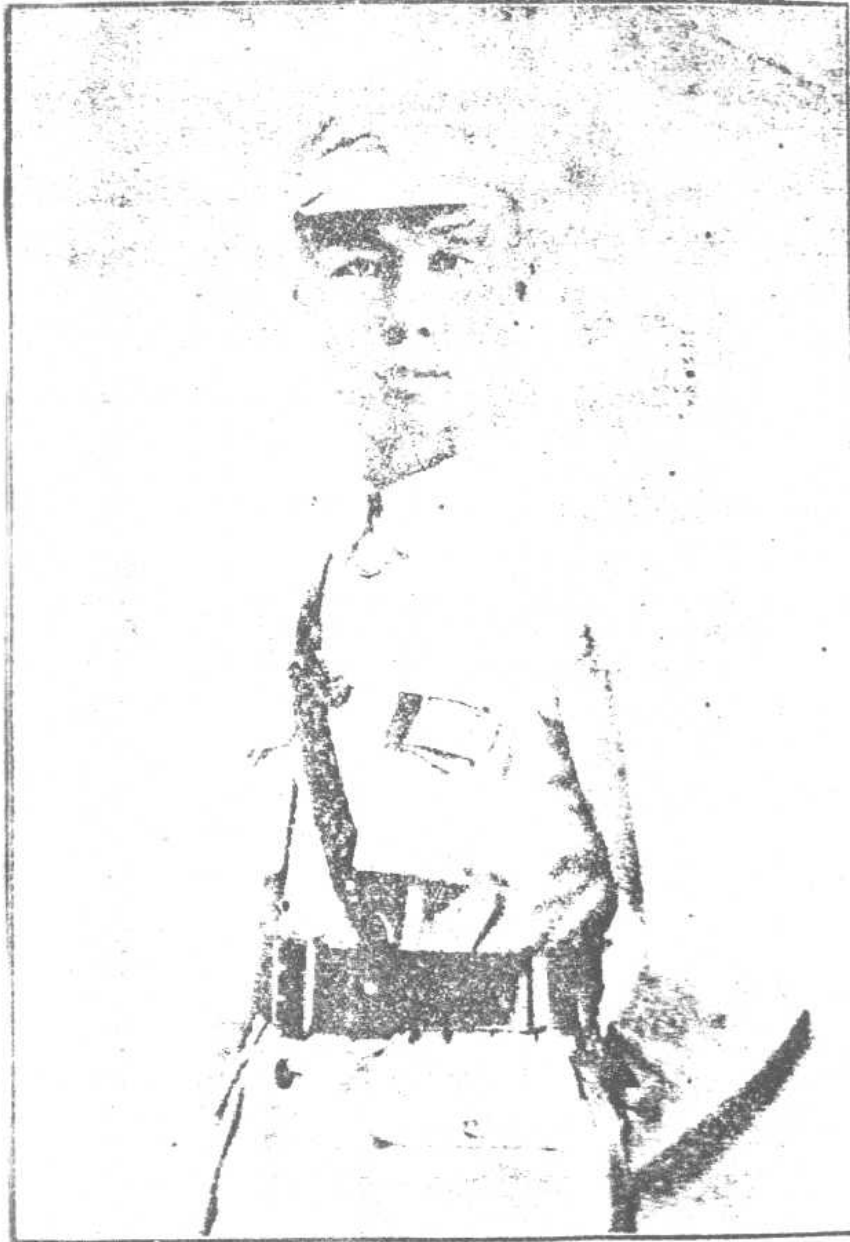
虞 縣 長 世 熙 玉 照