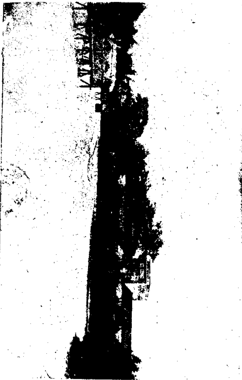
中 學 校