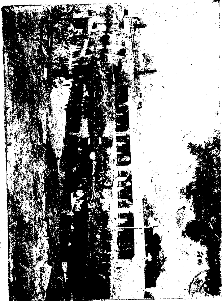
中紀山紀念橋（前龍津橋現為山中紀念橋）