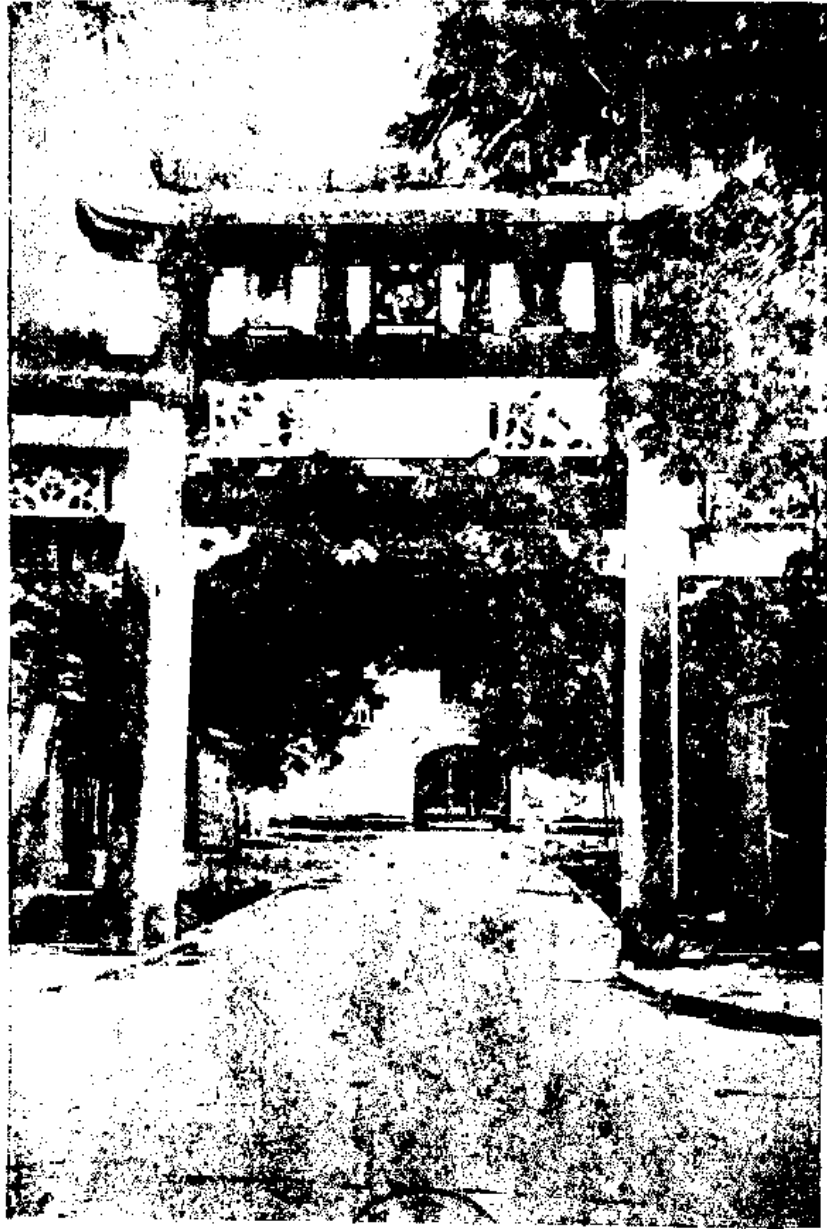
(此駐署衙代歷) 府政縣