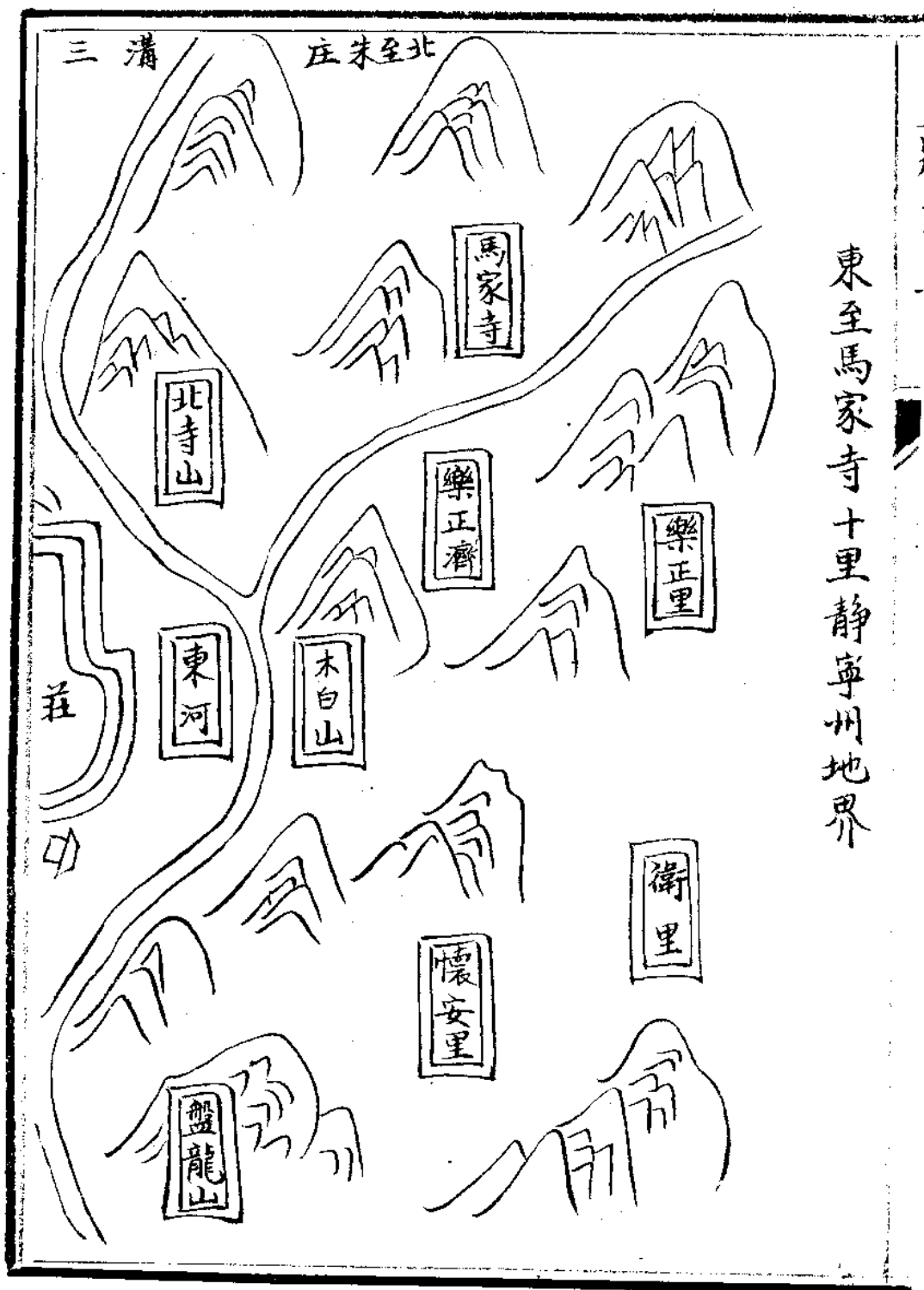
東至馬家寺十里靜寧州地界