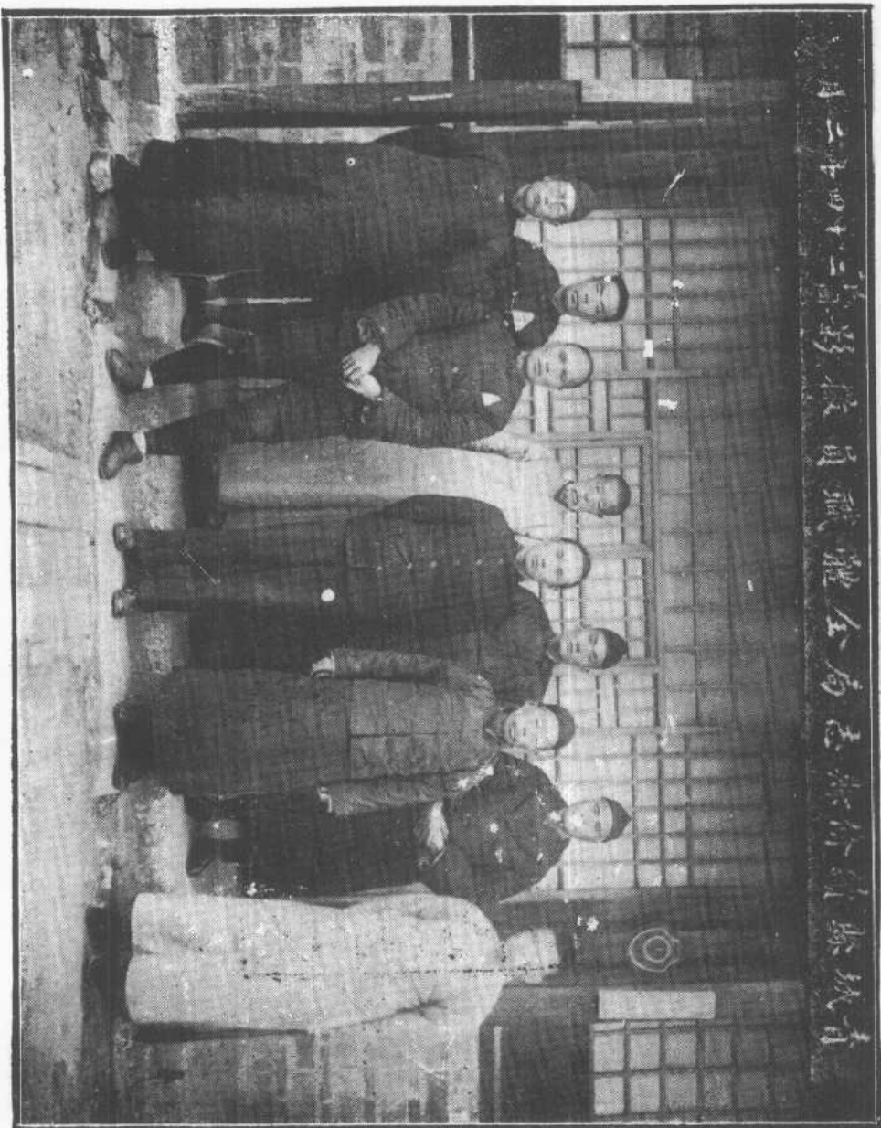
青島市立第一中學職員全體合影